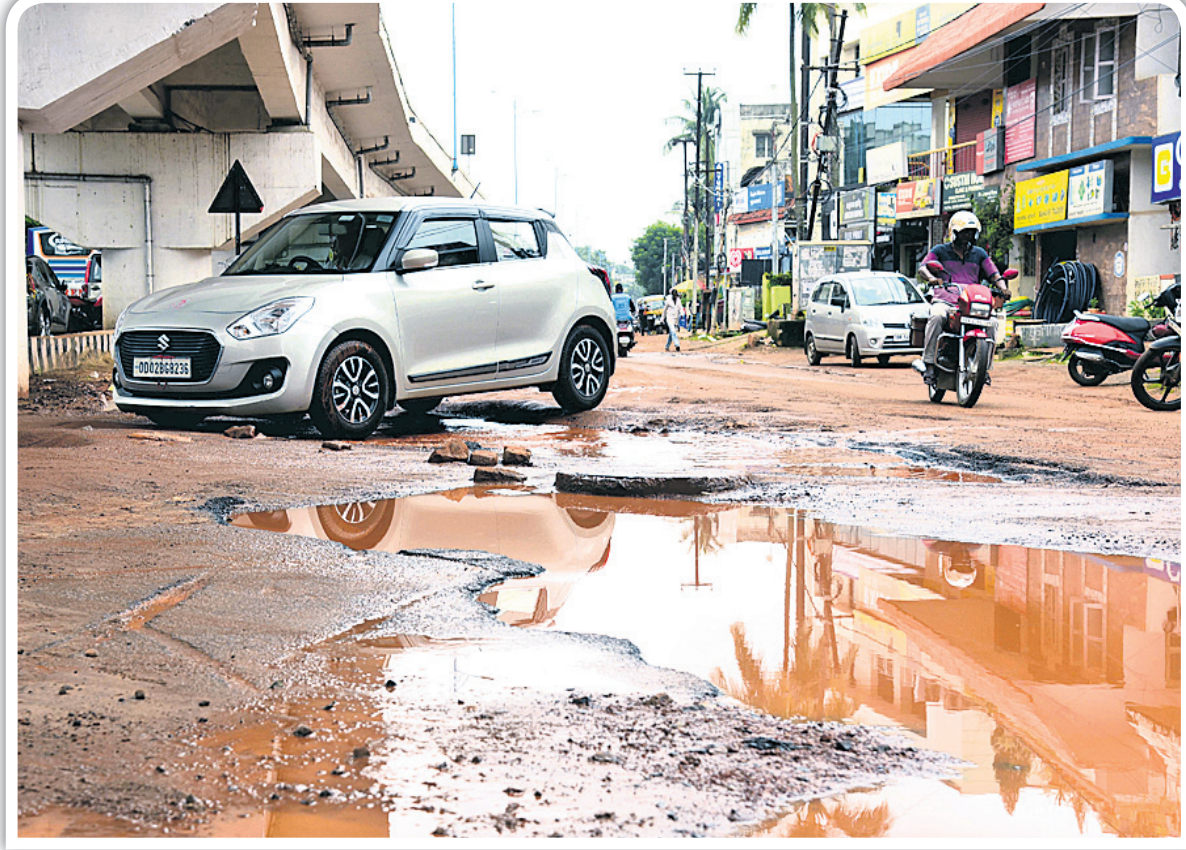
କଟକ ରୋଡ୍‌ର ବମିଖାଲ ଓଭରବ୍ରିଜ୍ ତଳ ରାସ୍ତାରେ ଦୀର୍ଘଦିନ ହେବ ରହିଥିବା ଖାଲ । ଶନିବାର ରାତିରେ ଏଠାରେ କାର ଦୁର୍ଘଟଣାଗ୍ରସ୍ତ ହେବାକୁ ଜଣେ ଡାକ୍ତରଙ୍କ ଜୀବନ ଯାଇଥିଲା । ଏଥିସହ ଉଭୟାନ୍ତର ଅପରପାର୍ଶ୍ୱ ରାସ୍ତା ମଧ୍ୟ ଶୋଚନୀୟ ହୋଇପଡ଼ିଛି । ବଡ଼ବଡ଼ ଖାଲଖାମା ମୁଖ୍ୟର ଥିବା ମେଲି ରହିଛି ।