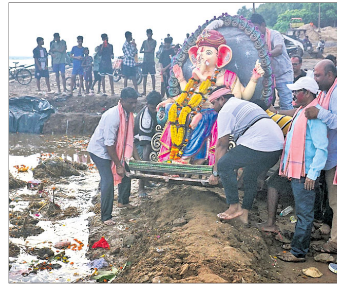
ଅଗ୍ରୀୟା ପୋଖରୀରେ ମୂର୍ତ୍ତି ବିସର୍ଜନ କରାଯାଇଛି। କଟକ, ୨୪।୯ (ପୁସ୍ତକ ପ୍ରିୟଦର୍ଶିନୀ)