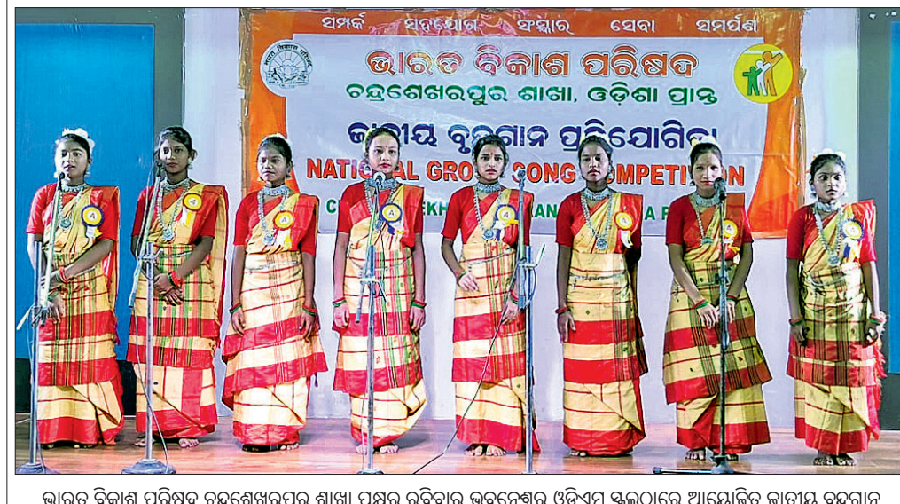
ଭାରତ ବିକାଶ ପରିଷଦ ଚନ୍ଦ୍ରଶେଖରପୁର ଶାଖା ପକ୍ଷରୁ ରବିବାର ଭୁବନେଶ୍ୱର ଓଡ଼ିଏମ୍ ସ୍କୁଲରେ ଆୟୋଜିତ ଜାତୀୟ ବୃନ୍ଦାବନ ପ୍ରତିଯୋଗିତାରେ ପିଲାମାନେ ସଜାତ ପରିବେଷଣ କରୁଛନ୍ତି।

ନିଷ୍ପତ୍ତି ନେଇଥିଲା। କିନ୍ତୁ ଏବେ ଦୀର୍ଘ ଏକମାସ ହେବ ମହାପ୍ରଭୁଙ୍କ ବନକଲୀନି ନୀତି ନ ହେବା ଯୋଗୁ ଶ୍ରୀବିଗ୍ରହଙ୍କ ଶ୍ରୀମୁଖ ମିଳିନ ପଡିଲାଣି। ଅନ୍ୟପକ୍ଷରେ ଶ୍ରୀମନ୍ଦିରରେ ଏବେ ଅନେକ ନୀତି ଚାଲିଥିବାରୁ ବନକଲୀନି ନୀତି ହେଉନାହିଁ ବୋଲି ଦଳ ମହାପାତ୍ର ସେବକ କହିଛନ୍ତି। ତେବେ ଆଗାମୀ ଦିନରେ ନୀତି ନିର୍ବାଚିତ ସମୟରେ ହେବ ବୋଲି ସେ ପ୍ରକାଶ କରିଛନ୍ତି। ତେବେ ଏସମ୍ପର୍କରେ ଗାରବରୁ ଠିକ୍ ଆସିବ ବୋଲି ନୀତି ପ୍ରଶାସକ ଜିତେନ୍ଦ୍ର ସାହୁ କହିଛନ୍ତି। ଉଲ୍ଲେଖଯୋଗ୍ୟ, ବିବାଦ ଦେଖାଦେଇଥିବା ବେଳେ ବୁଧବାର ବନକଲୀନି କରିବାକୁ ଶ୍ରୀମନ୍ଦିର ପ୍ରଶାସନ