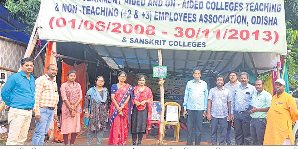
ଲୋୟର ପିଏସ୍‌ସିରେ ବେସରକାରୀ ଅନୁଦାନ ଓ ଅଣ-ଅନୁଦାନ (ମୁକ୍ତ ୨ ଓ ମୁକ୍ତ ୩) ମହାବିଦ୍ୟାଳୟ ଅଧ୍ୟାପିକା ଅଧ୍ୟାପକମାନେ ଧାରଣା ଦେଇଛନ୍ତି।