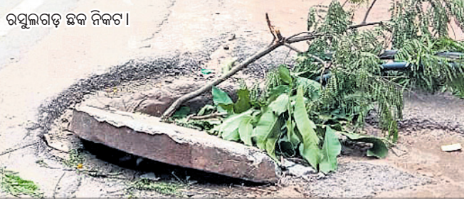
ରତ୍ନୁଲଗଡ଼ ଛକ ନିକଟ ।