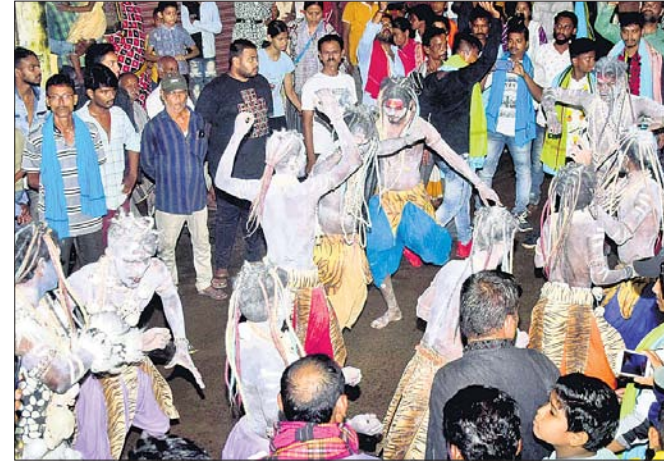
କଟକ ବୁଲିଯାଉ ପଠାଯାଉ ବାହାରିଥିବା ଭସାଣି ଶୋଭାଯାତ୍ରା।

ଉତ୍ସବ ପାଇଁ ବିଭିନ୍ନ କ୍ଳବ ପକ୍ଷରୁ ବାଜାକୁ ଗୁରୁତ୍ୱ ଦିଆଯାଇଛି। ଭୋଲ ବାଜା, ଶକ୍ତିକୁଳମ ବାଜା ମୁଖ୍ୟ ଆକର୍ଷଣ ବିଦାୟ ଦେଇଛନ୍ତି। ରବିବାର ସକାଳୁ କଟକରେ ପ୍ରଥମ ପର୍ଯ୍ୟାୟ ଗଣେଶ ଭସାଣି ଆରମ୍ଭ ହୋଇଥିଲା। ମୋଟ ୪୫୫ଟି ଉର୍ଜ୍ଜ୍ୱ ମେଢ଼ ବିସର୍ଜନ ପାଇଁ ତାଲିକା ହୋଇଥିଲା। ସକାଳୁ ଆରମ୍ଭ ହୋଇଥିଲା ଭସାଣି ପ୍ରକ୍ରିୟା। ମୂର୍ତ୍ତି ବିସର୍ଜନ ପାଇଁ ପ୍ରାୟ ୧୧ଟି ଅଗ୍ରୀୟା ପୋଖରୀ ଆୟୋଜନ କରିଛି କଟକ ମହାନଗର ନିଗମ। ତେବେ ଏହି ପର୍ଯ୍ୟାୟରେ ଭସାଣି କରାଯିବ। ଦ୍ୱିତୀୟ ପର୍ଯ୍ୟାୟ ସେପ୍ଟେମ୍ବର ୧ ଓ ତୃତୀୟ ପର୍ଯ୍ୟାୟ ଭସାଣି ୮ ତାରିଖରେ ଶେଷ ହେବ ବୋଲି ନିଷ୍ପତ୍ତି ନିଆଯାଇଛି।