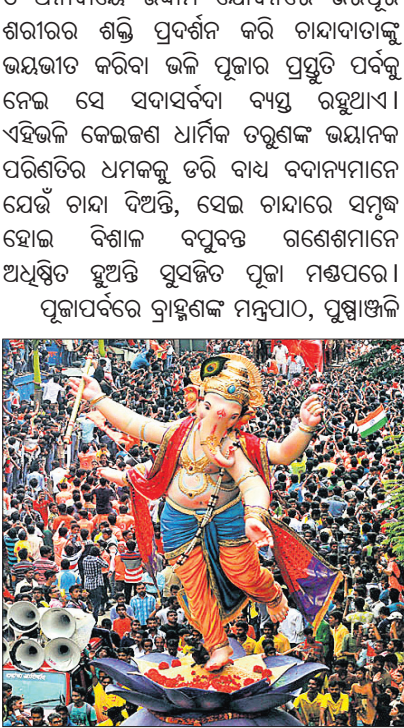
ଭକ୍ତ୍ୟାଦି ଭକ୍ତିଭାବର ଯେତିକି ଉଲ୍ଲାସ ସହନ ନ କରେ ତାହାଠୁ ତେଜ ଅଧିକ ରୁଣ୍ଡର ପୂଜା ପ୍ରତିବେଦନ ଅନୁଭୂତ ହୁଏ ପରବର୍ତ୍ତୀ ଦୁଇ ସମ୍ପର୍କରେ, ଯେତେବେଳେ ଗଣେଶଙ୍କ ଆସ୍ଥାନଠାରୁ ଅଧିକ ଉଚ୍ଚତାର ପାଖ ପେଣ୍ଡାକୁ ଭାସିଆସେ ମେଲୋତି କଳାକାରଙ୍କ କଣ୍ଠ ସଙ୍ଗୀତ ଓ ଉଦ୍‌ଘୃଷ୍ଟ ନୃତ୍ୟ । ଅଗ୍ରପୂଜ୍ୟ ଗଣେଶଙ୍କୁ ଆଗରେ ରଖି ସ୍ୱର୍ଗ ବସ୍ତ୍ରାବୃତ୍ତା ଆଧୁନିକ ତତ୍ତ୍ୱଗଣଙ୍କ ଅଶ୍ୱଳ ନୃତ୍ୟ ଓ ଏହାକୁ ଉପଭୋଗ କରୁଥିବା ସର୍ଗକଙ୍କୁ ଦେଖି ପୂଜାର ଆୟୋଜକ ତତ୍ତ୍ୱ ଗଣେଶ ଭକ୍ତମାନଙ୍କ ଛାଡି କୃଷ୍ଣମୋଟ ହୋଇଯାଏ । ସେମାନେ ବି ନର୍ତ୍ତକୀଙ୍କ ପାଦ ସହିତ ପାଦ ମିଳାଇ ନାଚନ୍ତି । ନିଜ ଛୋଟ ଛୋଟ ଆଖି ଦୁଇଟି ମେଲାଇ ପୂଜାକର୍ତ୍ତା, ଭକ୍ତମାନଙ୍କୁ ଚାହିଁ ରହିଥାନ୍ତି ଅସହାୟ ଗଣେଶ । ଆଖୁରେ ଅପେକ୍ଷା କରିଥାନ୍ତି ପୂଜାର ଅତିନ ପର୍ବ

ଯାଉଥିବା ଗାଡି ଅଟକାଇ ପୂଜାଚାରା ମାରିବା ଓ ଅନାଦାୟେ ଉଦ୍ଦାମ ଯୌବନରେ ଭରପୁର ଶରୀରର ଶକ୍ତି ପ୍ରଦର୍ଶନ କରି ଚାନ୍ଦାଦାତାକୁ ଭୟଭୀତ କରିବା ଭଳି ପୂଜାର ପ୍ରସ୍ତୁତି ପର୍ବକୁ ନେଇ ସେ ସଦାସର୍ବଦା ବ୍ୟସ୍ତ ରହୁଥାଏ । ଏହିଭଳି କେଉଁକଣ ଧାର୍ମିକ ତତ୍ତ୍ୱଗଣ ଭୟାନକ ପରିଣତର ଧମକକୁ ତରି ବାଧ୍ୟ ବଦାନ୍ୟମାନେ ଯେଉଁ ଚାନ୍ଦା ଦିଅନ୍ତି, ସେଇ ଚାନ୍ଦାରେ ସମୃଦ୍ଧ ହୋଇ ବିଶାଳ ବସୁବତ୍ତ ଗଣେଶମାନେ ଅଧିଷ୍ଠିତ ହୁଅନ୍ତି ସୁସଜ୍ଜିତ ପୂଜା ମଣ୍ଡପରେ । ପୂଜାପର୍ବରେ ବ୍ରାହ୍ମଣଙ୍କ ମନ୍ତ୍ରପାଠ, ପୁଷ୍ପାଞ୍ଜଳି