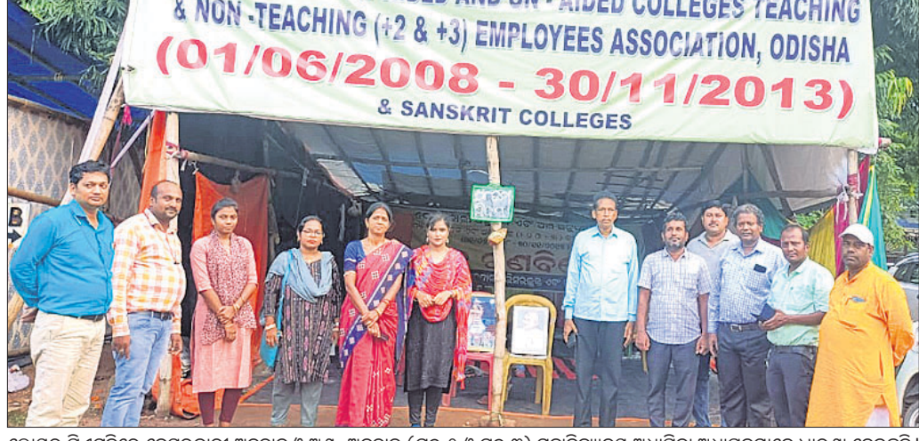
ଲୋୟର ବିଏମ୍‌ସିରେ ବେସରକାରୀ ଅନୁଦାନ ଓ ଅଣ-ଅନୁଦାନ (ସ୍କୁଲ ୨ ଓ ସ୍କୁଲ ୩) ମହାବିଦ୍ୟାଳୟ ଅଧ୍ୟାପିକା ଅଧ୍ୟାପକମାନେ ଧାରଣା ଦେଇଛନ୍ତି।