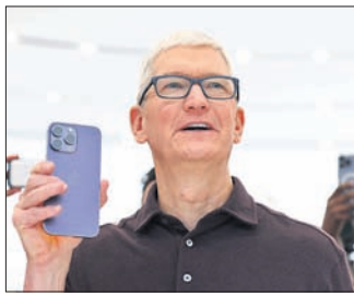
ଆପଲ୍ ସିଇଓ ଟିମ୍ କୁ ଆଇଫୋନ୍ ୧୫ ସିରିଜ୍ କୁ ଅନ୍ତରାଷ୍ଟ୍ରୀୟସ୍ତରରେ ଉନ୍ନତ କରିବାକୁ

ଅନ୍ତରାଷ୍ଟ୍ରୀୟ ତଥା ପ୍ରିମିୟମ ସ୍ମାର୍ଟଫୋନ୍ ନିର୍ମାତା ଆପଲ୍ ଚଳିତ ବର୍ଷ ଶେଷ ପୂର୍ଣ୍ଣ ଭାରତରେ ଆଇଫୋନ୍ ଉତ୍ପାଦନ ବଢ଼ାଇବା ନେଇ ବିଚାରବିମର୍ଶ କରୁଛି ବୋଲି କମ୍ପାନୀ ପକ୍ଷରୁ କୁହାଯାଇଛି। କାରଣ ନିକଟରେ କମ୍ପାନୀ ଭାରତୀୟ ବଜାରରେ ଆପଲ୍ ଏକ୍ସକ୍ୟୁସିଭ ଆଉଟଲେଟ ଜରିଆରେ ଗ୍ରାହକଙ୍କୁ ଆଇଫୋନ୍ ସମସ୍ତ ଉତ୍ପାଦ ଯୋଗାଇଛି। ଏପରିକି ଭାରତୀୟ ବଜାରରେ ଆପଲ୍ ବ୍ରାଣ୍ଡର ଚାହିଦା ପୂର୍ବପେକ୍ଷା ବୃଦ୍ଧି ପାଇଛି। ଫଳରେ କମ୍ପାନୀ ଚଳିତ ବର୍ଷ ଶେଷ କିମ୍ବା ଆସନ୍ତା ବର୍ଷ ମଧ୍ୟରେ ଆଇଫୋନ୍ ଉତ୍ପାଦନ ପୂର୍ବପେକ୍ଷା ୨୦୦ ଟା ପର୍ଯ୍ୟନ୍ତ ବଢ଼ାଇବାକୁ ଯୋଜନା କରୁଛି। ଅପରପକ୍ଷରେ ଭାରତରୁ ସର୍ବାଧିକ ଫୋନ୍ ରପ୍ତାନି କରୁଥିବା ସଂସ୍ଥା ଭାବେ ଆପଲ୍ ପ୍ରଥମ