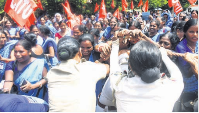
କର୍ମୀଗଣରୁ କାର୍ତିକା ବନ୍ଦ କରାଯାଇ ସହ ସରକାର ବାମା ଯୋଜନାର ପ୍ରତିମତ ପ୍ରଦାନ, ସର୍ବନିମ୍ନ ଦରମା ୨୬ ହଜାର ଟଙ୍କା ପ୍ରଦାନ, ଅବସର ବୟସ ସାମା ୬୫ବର୍ଷ କରାଯିବା ସହିତ ଅବସରକାଳୀନ ନିଷ୍ପତି ଅନୁଯାୟୀ ଆଶାକର୍ମୀଙ୍କ ଖର୍ଚ୍ଚ, ଜନନୀ ପୁରୁଣା ଯୋଜନାର ଅନୁଦାନ ବୃଦ୍ଧି, ବେସରକାରୀ ସ୍ୱାସ୍ଥ୍ୟକେନ୍ଦ୍ରରେ ସମ୍ପାନ କରୁ ହେଲେ ସହାୟତା ରାଶି ପ୍ରଦାନ, ଆଶାକର୍ମୀଙ୍କ ପାଇଁ ଗଠିତ ସଂସଦାୟ କମିଟିର ସୁପାରିସ ଅନୁସାରେ ୧୦ ବର୍ଷର ଅଭିଜ୍ଞତା ଥିବା ଆଶାକର୍ମୀଙ୍କୁ ଏସବୁ ପ୍ରଦାନ, ୫ ବର୍ଷ ଅଭିଜ୍ଞତା ଥିବା ଆଶାକର୍ମୀଙ୍କ ନିର୍ଦ୍ଦେଶ କଲେଜରେ ଗାଳିମ ପାଇଁ ସ୍ଥାନ ସଂରକ୍ଷଣ ଓ ଅନାୟତ୍ୟ ଦାବିରେ ଏହି ଆନ୍ଦୋଳନ କରାଯାଇଥିଲା।

ପୋଲିସକୁ ନାକେଦମ୍ ହେବାକୁ ପଡ଼ିଥିଲା। ଜାତୀୟ ଶ୍ରମ ସମ୍ମିଳନୀରେ ହୋଇଥିବା ନିଷ୍ପତି ଅନୁଯାୟୀ ଆଶାକର୍ମୀଙ୍କ ଖର୍ଚ୍ଚ ମାନ୍ୟତା, ସର୍ବନିମ୍ନ ପେନ୍ସନ୍, ସାମାଜିକ ନିରାପତ୍ତା, ମାସିକ ଭଣ୍ଡା ପ୍ରଦାନ, ବିଭିନ୍ନ ଯୋଜନା ଯଥା ପ୍ରାଧାନମନ୍ତ୍ରୀ ଜୀବନଭଣ୍ଡାଟି ବାମା ଯୋଜନା ଓ ଅନାୟତ୍ୟ ଯୋଜନାର ବେଢ଼ ଆଶାକ