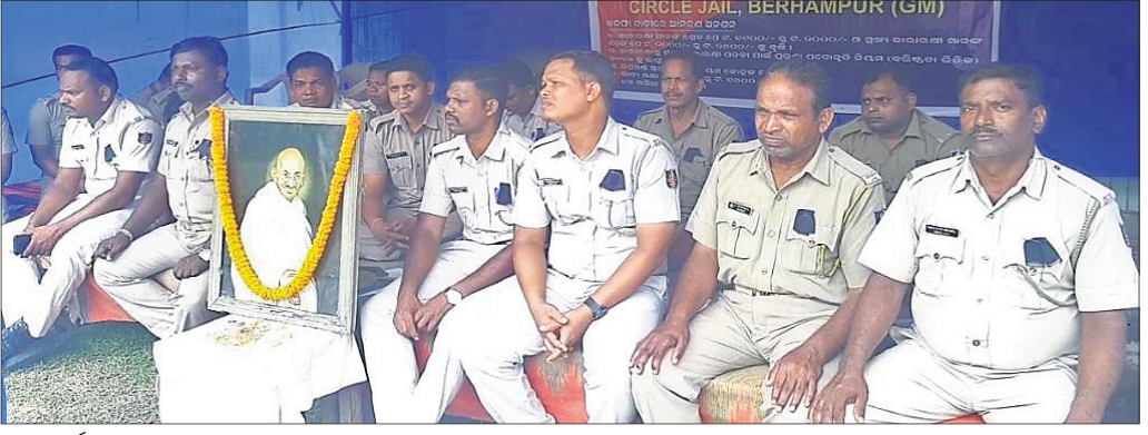
କାରା କର୍ମଚାରୀଙ୍କ ଆମରଣ ଅନଶନ ।