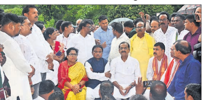
ଆନ୍ଦୋଳନରେ ସରପଞ୍ଚ ଏବଂ ସମିତି ସଭ୍ୟଙ୍କ ସହ ଭାଜପା ପ୍ରତିନିଧି ଦଳ ଆଲୋଚନା କରୁଛି।