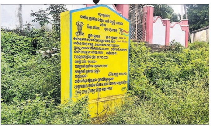
କୁଳାଡ଼ ବଡ଼ବନ୍ଧ ।

ଆଜ୍ଞାପନ ଅମୃତ ସାଗରର ଅଧିକାରୀ ଗ୍ରାମାଞ୍ଚଳରେ ଥିବା ଯୋଗରାଜୁଡ଼ିକୁ କେନ୍ଦ୍ର ସରକାରଙ୍କ ଅମୃତ ସାଗର ଖନନ ଯୋଜନାରେ ପୁନରୁଦ୍ଧ କରାଯାଉଛି। ଉଚ୍ଚ କାମଗୁଡ଼ିକର ସାମାଜିକ ସମାକ୍ଷା (ଅତିର୍) କରିବା ପାଇଁ କେନ୍ଦ୍ର ସରକାର ଗତ ରୁଦ୍ଧରେ ରାଜ୍ୟ ସରକାରଙ୍କୁ ନିର୍ଦ୍ଦେଶ ଦେଇଥିଲେ। ଏହାପରେ ରାଜ୍ୟ ସରକାର ସମସ୍ତ ଜିଲା ପ୍ରଶାସନକୁ ଏନେଇ ଚିଠି ମାଧ୍ୟମରେ ଜଣାଇ ଦେଇଥିଲେ। ଗଞ୍ଜାମ ଜିଲାର ଶତାଧିକ ଯୋଗରାଜୁ ଉଚ୍ଚ ଯୋଜନାରେ ସାମିଲ କରାଯାଇଥିବା ବେଳେ ସେଥିମଧ୍ୟରୁ ବର୍ତ୍ତମାନ ସୁଦ୍ଧା ୮୬ଟି ଯୋଗରାଜୁ କାମ ସରିଛି। ସେଥିରୁ ଅତିର୍ କରିବା ପାଇଁ ଜିଲା ପ୍ରଶାସନ ପକ୍ଷରୁ ସାମାଜିକ, ସାମାଜିକ ସମାଜିକ ଚିଠି ମାଧ୍ୟମରେ ଜଣାଇ ଦିଆଯାଇଛି। ଭଞ୍ଜନଗର ରୁକ୍ଷ ୧୮ଟି