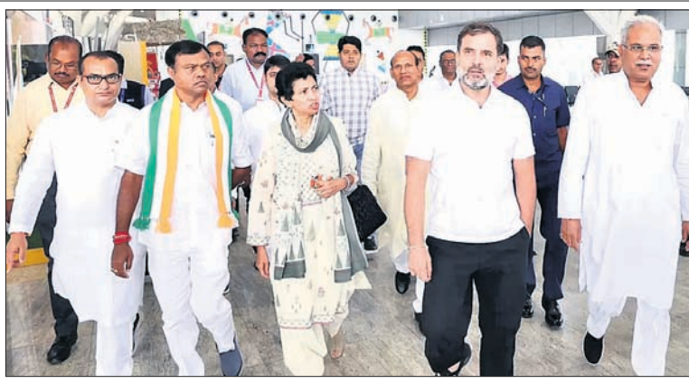
କଂଗ୍ରେସ ନେତା ରାହୁଲ ଗାନ୍ଧୀଙ୍କୁ ଛତିଶଗଡ଼ ମୁଖ୍ୟମନ୍ତ୍ରୀ କୁପେଶ ବସେଇ, ରାଜ୍ୟ ପ୍ରଧାନୀ କୁମାରୀ ଶେଖରା ଏବଂ ଅନ୍ୟ ନେତାମାନେ ସ୍ୱାଗତ କରାଉଛନ୍ତି।

କୋଳକାଶ, ୨୫:୮: : ଲୋକ ସଭାରେ କଂଗ୍ରେସ ନେତା ଅଧାର ରଞ୍ଜନ ଚୌଧୁରୀ ଚୁକ୍ତିପୂର୍ଣ୍ଣ କଂଗ୍ରେସ ମୁଖ୍ୟ ତଥା ପଶ୍ଚିମବଙ୍ଗ ମୁଖ୍ୟମନ୍ତ୍ରୀ ମମତା ବାନାର୍ଜୀଙ୍କ ସ୍ନେହ ଗ୍ରସ୍ତ ନେଇ ପ୍ରଶ୍ନ ଉଠାଇଛନ୍ତି। ଅଧାର କହିଛନ୍ତି ରାଜ୍ୟରେ ତେଜୁ ରୋଗ ବହୁତୁତ୍ୱ ସମୟରେ ମୁଖ୍ୟମନ୍ତ୍ରୀ ମମତା କିପରି ବିଦେଶ ଗଲେ? ଆଉ ସ୍ନେହର ଏକ ବିଳାସପୁରୁଷ୍ଟ ହୋଇଲେ କିପରି ରହିଲେ। ବିଳାସପୁରୁଷ୍ଟ ହୋଇଲେ ମମତାଙ୍କ ଉତ୍ତରରେ କିପରି ପ୍ରଶ୍ନ କରାଯିବ। ଏହି ସତ୍ୟକୁ ନେଇ ବିରୋଧୀ ନିଲ୍ମତ ମେଘୁଲେଖାରେ ଫାଟ ବହୁତୁତ୍ୱ ଚର୍ଚ୍ଚା ହେଉଛି। ପୂର୍ଣ୍ଣିମାଦିନରେ ଖବରଦାତାଙ୍କ ସହ ଆଲୋଚନା ବେଳେ ଅଧାର କହିଛନ୍ତି, ଅନାସ୍-ସେପ୍ଟେମ୍ବରରେ ତେଜୁ ସଂକ୍ରମଣକୁ ପାଇବ ବୋଲି ଆମେ ରାଜ୍ୟ ସରକାରଙ୍କୁ ତଥାପନ କରିବା ବୋଲି କହିଛୁ। ଏହି ସରକାର ସାଧାରଣ ଜନତାଙ୍କ ପ୍ରତି ହେଉ ପନେଇବା ପ୍ରଦର୍ଶନ କରୁଛନ୍ତି। ଆମେ ଶୁଣୁଛୁ ମୁଖ୍ୟମନ୍ତ୍ରୀ ଦରମା ନେଇଛନ୍ତି। ସେ ତାଙ୍କ ବହି, ପେଣ୍ଟି ବିକ୍ରୟ କରି ନିଜ ଖର୍ଚ୍ଚ ପୂରଣ କରୁଛନ୍ତି। ମାତ୍ର ଏଭଳି ଛୁଟିରେ ସେ ମାଟ୍ରିକର ଏକ ବିଳାସପୁରୁଷ୍ଟ ହୋଇଲେ କିପରି ରହିଲେ। ଯାହାର ଭଣ୍ଡା ଦିନକୁ ୩ ଲକ୍ଷ ଟଙ୍କା। ଏହି ବିଦେଶ ଗସ୍ତରେ କେତେ ଖର୍ଚ୍ଚ ହୋଇଛି? କେଉଁ ଶିଳ୍ପପତି ଏଠାରେ ବିନିଯୋଗ କରୁଛନ୍ତି? ବିଶ୍ୱ ବଜାର ଶିଳ୍ପପତି ସମ୍ମିଳନୀ ଆୟୋଜନ ପାଇଁ ସରକାର ଖର୍ଚ୍ଚ କରିଥିବା ଅର୍ଥର ୧୦ ପ୍ରତିଶତ ଯଦି ଫେରସ୍ତ କରାଯାଏ, ତେବେ ଏହା ରାଜ୍ୟର ଲକ୍ଷ ଲକ୍ଷ ବେକାର ଲୋକଙ୍କୁ ରୋଜଗାର ଯୋଗାଇବ ବୋଲି ସେ କହିଛନ୍ତି।