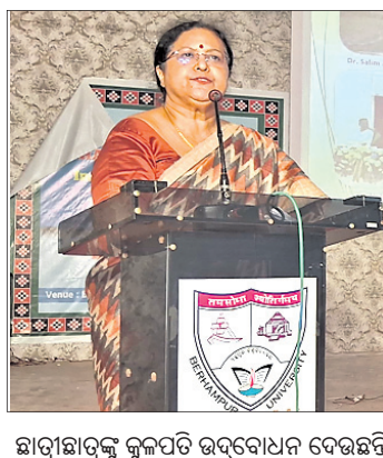
ଛାତ୍ରୀଛାତ୍ରଙ୍କୁ କୁଳପତି ଭବେ ସ୍ୱାଗତ କରାଯାଇଛି।