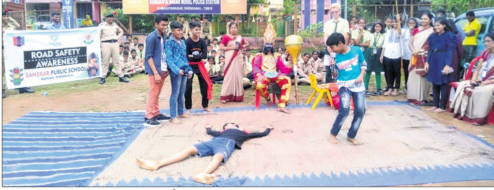
ଥାନା ସମ୍ମୁଖରେ ଛାତ୍ରଛାତ୍ରୀମାନେ ନାଟକ ପ୍ରଦର୍ଶନ କରୁଛନ୍ତି ।

କାମାକ୍ଷାନଗର, ୨୫.୯ (ସୁଧାଂଶୁ କୁମାର ପରିଡ଼ା)