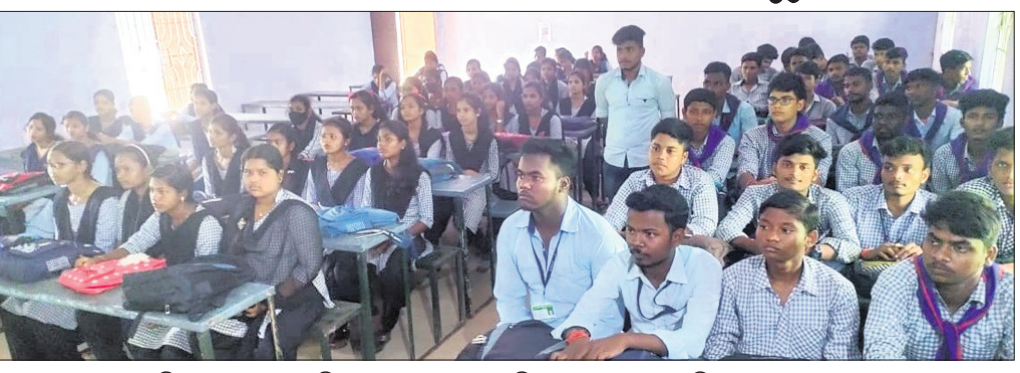
ବାଜି ରାଉତ କଲେଜ ପରିସରରେ କାତାୟ ସେବା ବିବସ ଅବସରରେ ଉପସ୍ଥିତ ଛାତ୍ରଛାତ୍ରୀମାନେ ।