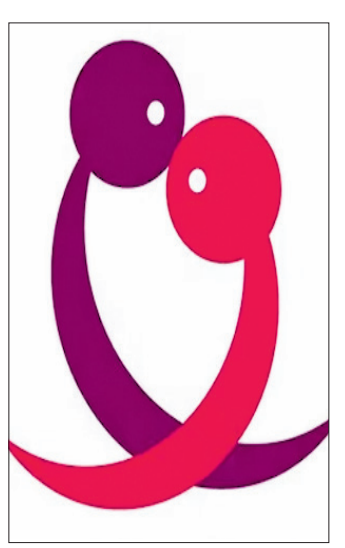
ପରିବାର ଯୋଜନା, ସୁଚନା ଏବଂ ଶିକ୍ଷା ଏବଂ ପ୍ରଜନନ ସ୍ୱାସ୍ଥ୍ୟକୁ ନେଇ ଜାତୀୟ ରଖାଯାଉ ଏବଂ କାର୍ଯ୍ୟକ୍ରମର ଏକାକରଣ

ପୃଥିବୀର ଜନସଂଖ୍ୟା ଯୋଗୁ ସଙ୍କଟ ବଢ଼ିବାରେ ଲାଗିଛି। ଜନସଂଖ୍ୟା ବୃଦ୍ଧିର ବହୁ କାରଣ ରହିଛି। ସେଗୁଡ଼ିକ ମଧ୍ୟରେ ପାଠପଢ଼ା ଅଭାବ, ଲୋକଙ୍କ ଆର୍ଥିକ ସ୍ଥିତି, ସାମ୍ପ୍ରଦାୟିକ ଅଭାବ ଆଦି ମୁଖ୍ୟ କାରଣ। ତେବେ ଜନସଂଖ୍ୟା ବୃଦ୍ଧିକୁ ରୋକିବା କ୍ଷେତ୍ରରେ ଗର୍ଭ ନିରୋଧକ ଏକ ବିକଳ୍ପ ଭାବେ ଉଭା ହୋଇଛି। ୨୦୩୦ ପୂର୍ଣ୍ଣ ବିଶ୍ୱସ୍ତରରେ ସ୍ତ୍ରୀମାନଙ୍କୁ ବିକାଶ ଏକେଣ୍ଡା ଲକ୍ଷ୍ୟ ନେଇ ୧୯୯୪ ସେପ୍ଟେମ୍ବର ୨୬ରେ ଅନୁଷ୍ଠିତ ହୋଇଥିବା ଜନସଂଖ୍ୟା ଏବଂ ବିକାଶ ଉପରେ ଅନ୍ତର୍ଜାତୀୟ ସମ୍ମିଳନୀରେ ଗୁରୁତ୍ୱାହୀନ କରାଯାଇଥିଲା ଏବଂ ବିଶ୍ୱ ଗର୍ଭ ନିରୋଧକ ଦିବସ ପାଳନ କରାଯିବାକୁ ନିଷ୍ପତ୍ତି ଗ୍ରହଣ କରାଯାଇଥିଲା। ସେବେଠାରୁ ପ୍ରତିବର୍ଷ ସେପ୍ଟେମ୍ବର ୨୬କୁ ବିଶ୍ୱ ଗର୍ଭ ନିରୋଧକ ଦିବସ ଭାବରେ ପାଳନ କରାଯାଇ ଆସୁଛି। ଏହିଦିନ ବିଶ୍ୱବ୍ୟାପୀ