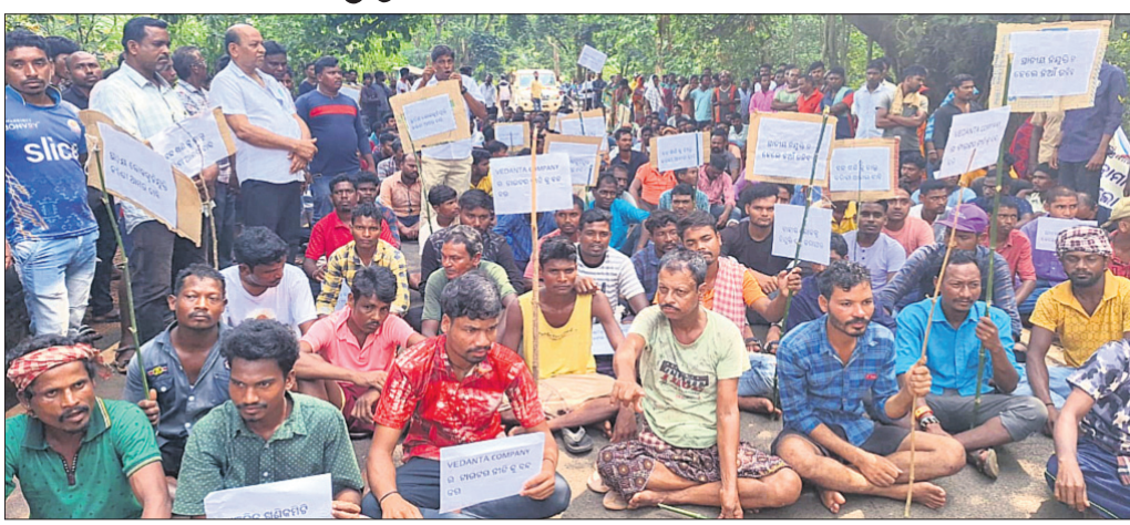
ଆଞ୍ଚଳିକ ଗ୍ରୋମାଲଟ ଖଣି କମିଟି ସଦସ୍ୟମାନେ ଧାରଣା ଦେଇଛନ୍ତି ।

ଦେଶାନ୍ତ ଲିମା କଳ୍ପହାତୀ ଥାନା କାଠପାଳସ୍ଥିତ ଫେକର ବେଦାନ୍ତ କମ୍ପାନୀ ସମ୍ମୁଖରେ ସୋମବାର ଆଞ୍ଚଳିକ ଗ୍ରୋମାଲଟ ଖଣି କମିଟି ସଦସ୍ୟମାନଙ୍କ ପକ୍ଷରୁ ଗଣଧାରଣା ଦିଆଯାଇଥିଲା । ଖବରପାଇ ପ୍ରଶାସନିକ ଅଧିକାରୀମାନେ ପହଞ୍ଚି ରୁଖିଗୁଣ୍ଡା କରିବା ପରେ ଧାରଣା ପ୍ରତ୍ୟାହତ ହୋଇଥିଲା । କମିଟି ପକ୍ଷରୁ କୁହାଯାଇଛି, ଏଠାରେ ଥିବା ଗ୍ରୋମାଲଟ ଖଣି ପ୍ରାୟ ୧୦ ବର୍ଷ ହେଲେ ବନ୍ଦ ରହିଛି । ଫଳରେ ଏହା ଉପରେ ନିର୍ଭର କରୁଥିବା ବିରାଣାଳ, ମରୁଆପଲ, ରାଇବୋଲ, ମରୁଆକାଟେଶୀ, ବାଲିକ୍ରମା, ବାଟଗାଁ ଆଦି ୬ ପଞ୍ଚାୟତବାସୀ ରୋଜଗାର ହରାଇଛନ୍ତି । ଏ ନେଇ ଫେକର ଓ ବେଦାନ୍ତ ସହ ଅନେକଥର ବୈଠକ ହୋଇଥିଲେ ମଧ୍ୟ ସୁଫଳ ମିଳିପାରିନାହିଁ । ଏହାର ପ୍ରତିବାଦରେ କମିଟିର ଶତାଧିକ