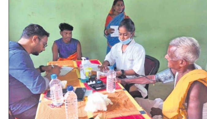
ଶିବିରରେ ଜଣେ ରୋଗୀଙ୍କ ସ୍ୱାସ୍ଥ୍ୟ ପରୀକ୍ଷା କରାଯାଇଛି ।

ଦେଶାନ୍ତ ଲିମା କଳ୍ପହାତୀ ବ୍ଲକ୍ ବାମ ହାଲସ୍କୁଲ ପଡ଼ିଆରେ ସ୍ୱେଚ୍ଛାସେବୀ ଅନୁଷ୍ଠାନ 'ବିକାଶ ଫାଉଣ୍ଡେଶନ' ତରଫରୁ ରବିବାର ଏକ ନିଃଶୁଳ୍କ ସ୍ୱାସ୍ଥ୍ୟ ଶିବିର ଅନୁଷ୍ଠିତ ହୋଇଯାଇଛି । ଶିବିରରେ ଆଖପାଖ ଅଞ୍ଚଳର ୧୯୨ ଜଣ ରୋଗୀଙ୍କ ସ୍ୱାସ୍ଥ୍ୟ ପରୀକ୍ଷା କରାଯାଇ ବିନା ମୂଲ୍ୟରେ