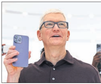
ଆପଲ୍ ସିଇଓ ଟିମ୍ କୁ ଆଇଫୋନ୍ ୧୫ ସିରିଜ୍ କୁ ଅନ୍ତରାଷ୍ଟ୍ରୀୟସ୍ତରରେ ଉତ୍ପାଦନ କରୁଛନ୍ତି।

ଅନ୍ତରାଷ୍ଟ୍ରୀୟ ତଥା ପ୍ରିମିୟମ ସ୍ମାର୍ଟଫୋନ୍ ନିର୍ମାତା ଆପଲ୍ ଚଳିତ ବର୍ଷ ଶେଷ ପୂର୍ଣ୍ଣ ଭାରତରେ ଆଇଫୋନ୍ ଉତ୍ପାଦନ ବଢ଼ାଇବା ନେଇ ବିଚାରବିମର୍ଶ କରୁଛି ବୋଲି କମ୍ପାନୀ ପକ୍ଷରୁ କୁହାଯାଇଛି। କାରଣ ନିକଟରେ କମ୍ପାନୀ ଭାରତୀୟ ବଜାରରେ ଆପଲ୍ ଏକ୍ସକ୍ୟୁଟିଭ ଆଉଟଲେଟ ଜରିଆରେ ଗ୍ରାହକଙ୍କୁ ଆଇଫୋନ୍ର ସମସ୍ତ ଉତ୍ପାଦ ଯୋଗାଇଛି। ଏପରିକି ଭାରତୀୟ ବଜାରରେ ଆପଲ୍ ବ୍ରାଣ୍ଡର ଚାହିଦା ପୂର୍ବପେକ୍ଷା ବୃଦ୍ଧି ପାଇଛି। ଫଳରେ କମ୍ପାନୀ ଚଳିତ ବର୍ଷ ଶେଷ କିମ୍ବା ଆସନ୍ତା ବର୍ଷ ମଧ୍ୟରେ ଆଇଫୋନ୍ ଉତ୍ପାଦନ ପୂର୍ବପେକ୍ଷା ୨ରୁ ୩ ଗୁଣା ବଢ଼ାଇବାକୁ ଯୋଜନା କରୁଛି। ଅପରପକ୍ଷରେ ଭାରତରୁ ସର୍ବାଧିକ ଫୋନ୍ ରପ୍ତାନି କରୁଥିବା ସଂସ୍ଥା ଭାବେ ଆପଲ୍ ପ୍ରଥମ