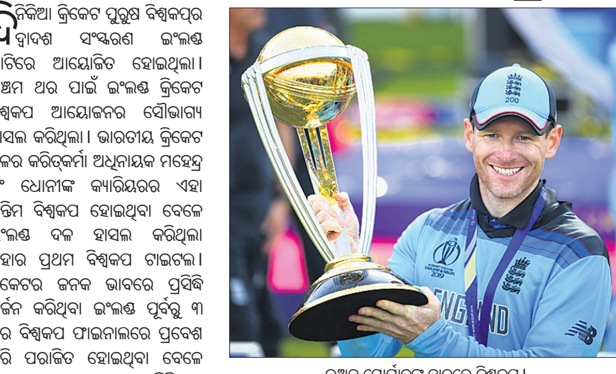
ଇଅନ ମୋର୍ଗାନଙ୍କ ହାତରେ ବିଶ୍ୱକପ ।