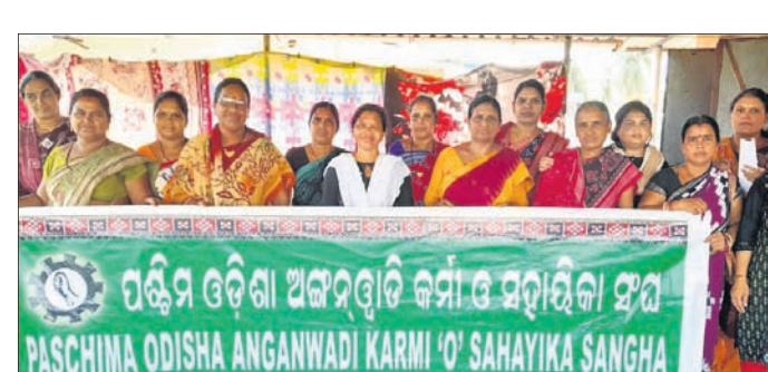
ଧରୁପାଲିଠାରେ ଅଙ୍ଗନୱାଡି କର୍ମୀଙ୍କ ସମାବେଶ।

ଅକ୍ଟୋବର ୩ରୁ ଅଙ୍ଗନୱାଡି କର୍ମୀଙ୍କ ଧାରଣା ହେବ। ଏହି ଧାରଣାରେ କର୍ମୀଙ୍କୁ ଶିକ୍ଷା ଦିଆଯାଏ।