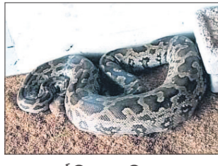
କୁରୁଡ଼ା ଫାଟି ଭିତରେ ପଶିଥିବା ଅଜର।

ଜନକଠାକୁ ଖବରପାଇ ସର୍ବଦା ଉଦ୍ଧାରକାରୀ ଚିମ୍ପୁ ସଦସ୍ୟମାନେ ପହଞ୍ଚି ଅଜରକୁ ଉଦ୍ଧାର କରି ଅନୁଗୋଳ ରୋଷ୍ଟି ଅଧିକାରୀଙ୍କୁ ହସ୍ତାନ୍ତର କରିଥିଲେ।