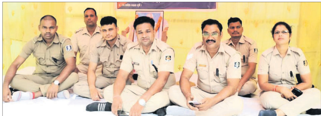
ଆମରଣ ଅନୁଷ୍ଠାନରେ ଜେଲ କର୍ମଚାରୀ।

୪୯ତମ ଦାସରେ ଜେଲ କର୍ମଚାରୀଙ୍କ ଆମରଣ ଅନୁଷ୍ଠାନ ଉଦ୍ଘାଟନ କରାଯାଇଛି। ଏହି ଅନୁଷ୍ଠାନରେ ଜେଲ କର୍ମଚାରୀଙ୍କୁ ଶିକ୍ଷା ଦିଆଯାଏ।