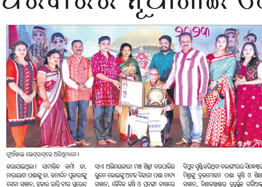
ନୂଆଁଖାଇ ଭେଟ୍‌ସାଙ୍ଗର ଅତିଥିମାନେ।