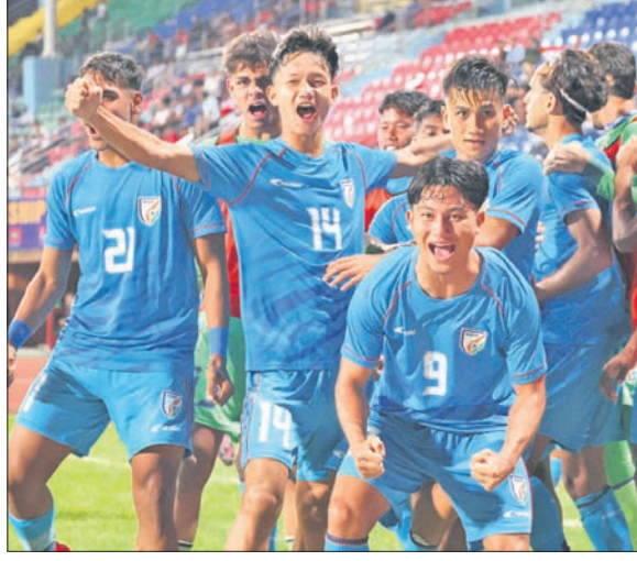
ମ୍ୟାଚ ଜିତିବାପରେ ଉତ୍ସାହରେ ଭାରତୀୟ ଖେଳାଳି ।

କାଠମାଣ୍ଡୁ, ୨୫ (ସି.ପି.) ନେପାଳର କାଠମାଣ୍ଡୁରେ ଅନୁଷ୍ଠିତ ୧୯ ବର୍ଷରୁ କମ୍ ସାଫ୍ଟ୍ ଟେନିସ୍ ପ୍ରତିଯୋଗିତାରେ ଭାରତୀୟ ଦଳର କ୍ରମାନ୍ୱୟରେ ଭାରତୀୟ ଦଳର ସମସ୍ତ ଖେଳାଳିଙ୍କୁ ପ୍ରମୋଦଣ କରିଥିଲା ।