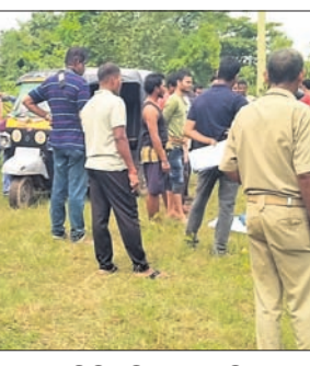
କଳାଳୟରୁ କର୍ମୀମାନଙ୍କ ମୃତଦେହ ଜବତ କରାଯାଇଛି।