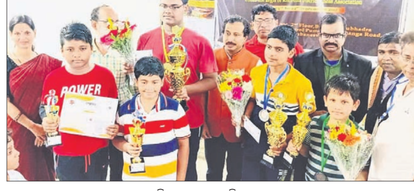
କୃତୀ ପ୍ରତିଯୋଗୀମାନେ ଅତିଥିଙ୍କୁ ଗ୍ରହଣରେ ।

ଭୁବନେଶ୍ୱର, ୨୫ (ସି.ପି.) ଶ୍ରୀମତୀ ପ୍ରମିଳା ପାଣିଗ୍ରାହୀଙ୍କ ଉଦ୍ଦେଶ୍ୟରେ ଭୁବନେଶ୍ୱରରେ ଅନୁଷ୍ଠିତ ଆରିନ୍ ଅନ୍ୱେଷ ଚାମ୍ପିୟନ ପ୍ରତିଯୋଗିତାରେ ଭାରତୀୟ ଦଳର ସମସ୍ତ ଖେଳାଳିଙ୍କୁ ପ୍ରମୋଦଣ କରିଥିଲା ।