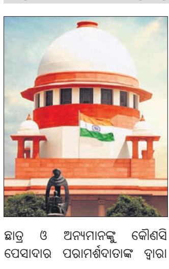
ଛାତ୍ର ଓ ଅନ୍ୟମାନଙ୍କୁ କୌଣସି ସେବାଦାର ପରାମର୍ଶଦାତାଙ୍କ ଦ୍ୱାରା