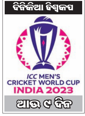
ଆଉ ୬ ଦିନ

ପାକିସ୍ତାନକୁ ପଛରେ ପକାଇଥିଲା ଲୁକ୍‌ମାଣ୍ଡ। ଇଂଲଣ୍ଡ ଚତୁର୍ଥ ଥର ପାଇଁ ଦିନିକିଆ ବିଶ୍ୱକପର ଫାଇନାଲରେ ପ୍ରବେଶ କରିଥିଲା। ଏହା ପୂର୍ବରୁ ୧୯୭୯, ୧୯୮୩ ଓ ୧୯୯୨ ବିଶ୍ୱକପରେ ଦଳ ରନର ଅଧିକାରୀ ଥିଲା। ଫାଇନାଲ ମ୍ୟାଚରେ ପ୍ରଥମେ ବ୍ୟାଟିଂ କରିଥିବା ଲୁକ୍‌ମାଣ୍ଡ ନିର୍ଦ୍ଧାରିତ ଓଭରରେ ୮ ରନକେତ ହରାଇ ୨୪୧ ରନ କରିଥିଲା। ଜବାବରେ ଇଂଲଣ୍ଡ ୫୦ ଓଭରରେ ୨୪୧ ରନରେ ଅଧିକାରୀ ହୋଇଥିଲା। ସୁପର ଓଭର ଖେଳା ଯାଇଥିବା ବେଳେ ଉଭୟ ଦଳ ସମାନ ୧୫ ରନ ଲେଖାଏ ଷ୍ଟୋର କରିଥିଲେ। ଅଧିକ ବାଉଣ୍ଡି ଷ୍ଟୋର କରିଥିବା ଇଂଲଣ୍ଡକୁ ଗାଇତଲା ବିଜେତା ଘୋଷଣା କରାଯାଇଥିଲା।