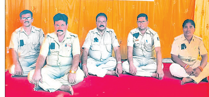
ଖୋର୍ଦ୍ଧା ଉପକାରାଗାର ଆଗରେ କର୍ମଚାରୀମାନେ ଅନଶନରେ ବସିଛନ୍ତି।

ଖୋର୍ଦ୍ଧା(ପ୍ରଭାତ ପାଣିଗ୍ରାହୀ)/ ଗନ୍ଧାରୀମୁଖ, ୨୫୯୯(ଦିଲୀପ ସ୍ୱାଇଁ)