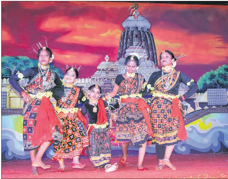
ଶରଧାବାଲିଠାରେ ଆୟୋଜିତ ଗଣେଶ ଭସାଣି ମହୋତ୍ସବରେ ପରିବେଷିତ ସାଂସ୍କୃତିକ କାର୍ଯ୍ୟକ୍ରମ ।