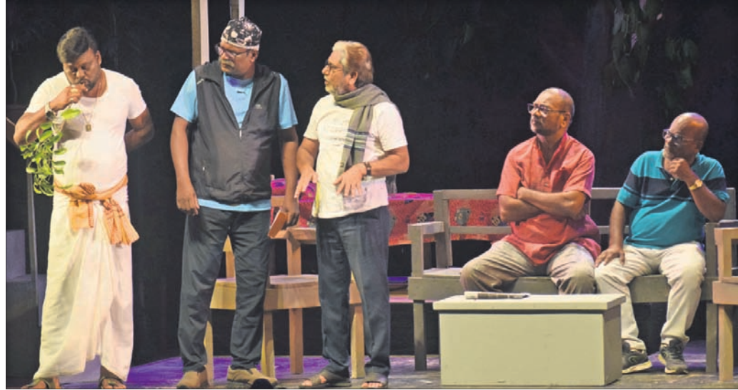
ଓଡ଼ିଶା ନାଟ୍ୟ ସଂଘ ପକ୍ଷରୁ ସୋମବାରଠାରୁ ରବୀନ୍ଦ୍ର ମଞ୍ଚପରେ ଆରମ୍ଭ ହୋଇଥିବା ବୃତ୍ତୀୟ ଜାତୀୟ ନାଟ୍ୟ ମହୋତ୍ସବର ପ୍ରଥମ ସନ୍ଧ୍ୟାରେ କାଗୁଡି ଇନ୍‌ସ୍ଟିଚ୍ୟୁଟ୍ ଅଫ୍ ଅର୍ଦ୍ଧ-ସଂଗଠନ କଳାକାରଙ୍କ ଦ୍ୱାରା ପରିବେଷିତ ନାଟକ 'ଶେଷ ପାହାଚ'ର ଏକ ଦୃଶ୍ୟ ।

ଧର୍ମିଆ ଜନଜାତି ଲେଖକ ସମ୍ମିଳନୀର ଉଦ୍ଦାୟନୀ ଉତ୍ସବରେ ଅତିଥିକ ସହ ଜନଜାତି ଲେଖକାଲେଖକ ଓ ଅନ୍ୟମାନେ । ସାହୁ ଉଦ୍ଦାୟନ କରି ସାହାଯ୍ୟ, ମୁଦ୍ରା, ବିନ୍ଦୁ ଥାଲି ଭାଷାର ଲେଖକା ଲେଖିକାଙ୍କୁ ସ୍ୱାଗତ କରିଥିଲେ । ସେମାନଙ୍କ ଭାଷା, ସଂସ୍କୃତି, ସାହିତ୍ୟ, ବିଜ୍ଞାନ, ଦର୍ଶନ ଓ ଜ୍ଞାନବିଶେଷକୁ ବୁଝାଇ ସମାଜ ପାଖରେ ପହଞ୍ଚାଇବାରେ ବିଭାଗ ନେତୃତ୍ୱାଧୀନ ପଦକ୍ଷେପ ବିଶେଷରେ ସୂଚନା ଦେଇଥିଲେ । ଡିଜିଟାଲ ପ୍ଲାର୍ଫର୍ମରେ ରଚନାବଳୀକୁ ଗୁଣିତ କରିବା ପାଇଁ ଆଦିବାସୀ ଭାଷା ଓ ସଂସ୍କୃତି ଏକାଡେମୀ ଏକ ପ୍ରକାଶନ କେନ୍ଦ୍ର ଭାବେ କାମ କରିବ । ଏହା ଜନଜାତି ଭାଷା ଓ ସଂସ୍କୃତିର ବିକାଶରେ ସହାୟକ ହେବ ବୋଲି ବିଭାଗୀୟ କମିଶନର କହିଥିଲେ । ପ୍ରଥମ ଦିନରେ ୨୦ଜଣ ପ୍ରତିଷ୍ଠିତ ଲେଖକା ଲେଖକ