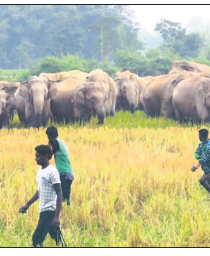
ପଶୁପାଳନ କାର୍ଯ୍ୟ ଆମ ଐତିହ୍ୟ, ପରମ୍ପରା ଓ ଆଧ୍ୟାତ୍ମିକ ଭାବନା ସହ ହାତୀ ଓଡ଼ିଆରେ ଭାବେ କଢ଼ିତ ।

ହାତୀଙ୍କ ଆବାସସ୍ଥଳୀ । ସେଥିପାଇଁ ଉତ୍କଳ ସମ୍ରାଜ୍ୟ ସୈନ୍ୟବାହିନୀରେ ସହସ୍ରାଧିକ ଗଜାରେହାତୀ ସୈନିକ ଥିଲେ ଏବଂ ହାତୀ ଥିଲା ରାଜାଙ୍କ ସାମରିକ ସାମର୍ଥ୍ୟର ସୂଚକ । ବୋଧହୁଏ ସେହି କାରଣରୁ ସେତେବେଳେ (ଦ୍ଵାଦଶ ଶତାବ୍ଦୀ) ଗଜପତି ଉପାଧିରେ ଭୃଷିତ ହୋଇଥିଲେ କଳିଙ୍ଗ ସାମ୍ରାଜ୍ୟର ଅଧିପତି । କେବଳ ମୁହୂର୍ତ୍ତେ ନୁହେଁ, ମହାପ୍ରଭୁଙ୍କ ସେବାପୂଜାରେ ନିୟୋଜିତ ହେଉଥିଲେ ହାତୀ । ଏଥିସହିତ ଭାରବାହୀ ପଶୁ ଭାବରେ ମନ୍ଦିର, ପ୍ରାସାଦ ଓ ରେଳଧାରଣା ଆଦି ନିର୍ମାଣ କାର୍ଯ୍ୟରେ ହାତୀର ବିଶେଷ ଯୋଗଦାନ ଥିଲା, ଯାହା ଓଡ଼ିଶା ଇତିହାସରେ ଏକ ସ୍ମରଣୀୟ ଅଧ୍ୟାୟ । ଏହି ପରିସ୍ଥିତିରେ ସତ୍ୟ ପ୍ରମାଣ ଉପରେ ଥିଲା