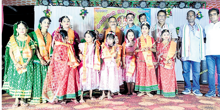
ଜଟଣୀ: ମେଡିକାଲ ଛକ ବ୍ୟବସାୟୀ ସଂଘ ପକ୍ଷରୁ ସୋମବାର ଆୟୋଜିତ କାର୍ଯ୍ୟକ୍ରମରେ ଅତିଥି ଓ କୁଳି କଳାକାରମାନେ।