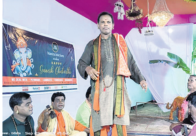
ହରି ଭାଇନା ଛକ ବ୍ୟବସାୟୀ ସଂଘ ପକ୍ଷରୁ ବାଦ୍ୟପାଳା ପରିବେଷଣ କରାଯାଇଛି।