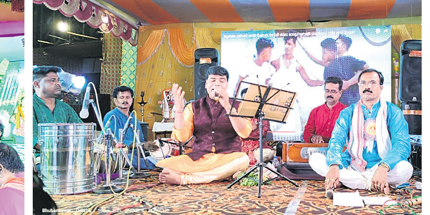
ପୋଷ୍ଟ ଅଫିସ୍ ଛକ ବ୍ୟବସାୟୀ ସଂଘ ପକ୍ଷରୁ ଆୟୋଜିତ ଭଜନ ସମାରୋହ।