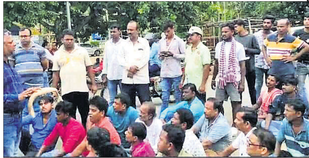
ଉଚ୍ଚେଦକୁ ବିରୋଧ କରି ଉଠାଦୋକାନୀମାନେ ଧାରଣା ଦେଇଛନ୍ତି।

ଭୁବନେଶ୍ୱର ମହାନଗର ନିଗମ (ବିଏମସି) ଅନ୍ତର୍ଗତ କଳିଙ୍ଗ ବିହାର କେ-୪ ଏବଂ କେ-୫ରୁ ଶିବମିର ଛକ ନିକଟରେ ଜବରଦସ୍ତୀ ଉଚ୍ଚେଦ କରିବାକୁ ଯାଇଥିବା ବିଏମସି ଓ ବିଏସ ଏନପୋର୍ଟମେଣ୍ଟ ଓଡ଼ିଆ ବୋକାଳମାନେ ବିରୋଧ କରିଛନ୍ତି। ଏହାକୁ ନେଇ ଦୀର୍ଘ ସମୟ ଧରି ସେଠାରେ ଉଚ୍ଚେଦନାମୂଳକ ପରିସ୍ଥିତି ଲାଗି ରହିବାରୁ ଶେଷରେ ଉଚ୍ଚେଦ କରି ନ ପାରି ତିନିଦିନ ଚଳିଥିବା ପଡ଼ିଛି। ବ୍ୟବସାୟୀଙ୍କ