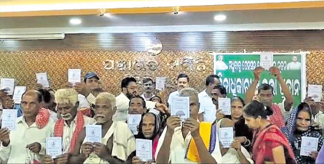
କାର୍ଯ୍ୟକ୍ରମରେ ଉପସ୍ଥିତ ହିତାଧିକାରୀମାନେ ।