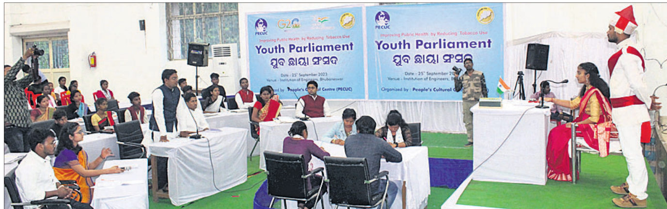
ଇନ୍‌ସ୍ଟିଚ୍ୟୁଟ୍ ଅଫ୍ ଇଞ୍ଜିନିୟରିଂରେ ସୋମବାର ତମାଖୁକୁ ନେଇ ଅନୁଷ୍ଠିତ ଯୁବ ଛାତ୍ର ସଂସଦ ।

ଭକ୍ତଙ୍କ ପାଇଁ ଶ୍ରୀମନ୍ଦିର ଚାରିଦ୍ୱାର ଖୋଲିବା ଓ ରତ୍ନଭଣ୍ଡାର ଖୋଲାଯିବା କହିଥିଲେ । ପୁଖ୍ୟମନ୍ତ୍ରୀଙ୍କ ନିର୍ଦ୍ଦେଶ ଦାବିରେ ଶ୍ରୀଜଗନ୍ନାଥ ସେନା ପକ୍ଷରୁ ଆସନ୍ତା ୩ତାରିଖରେ ଓଡ଼ିଶା ବନ୍ଦ ତାକରା ଦିଆଯାଇଥିଲା । ତେବେ ଏନେଇ ସୋମବାର ପୂଣିଥରେ ଶ୍ରୀଜଗନ୍ନାଥ ସେନା ଏବଂ ଲିଲା ପ୍ରଶାସନ ମଧ୍ୟରେ ଆଲୋଚନା ହୋଇଛି । ଆଲୋଚନା ପରେ ଶ୍ରୀଜଗନ୍ନାଥ ସେନା ପକ୍ଷରୁ ଦିଆଯାଇଥିବା ଚାରିଦ୍ୱାର ବୁଲିନିରାଖଣ କରିଥିଲେ । କାର୍ଯ୍ୟ ଚାଲିଥିବାରୁ ବଡ଼ ବଡ଼ ଗାତ ରହିଛି । ପକ୍ଷରେ ଭକ୍ତମାନେ ଯିବା ଆସିବା କଲେ ସମସ୍ୟା ଉଠୁଥିବ । ଭକ୍ତଙ୍କ ଧନ ଜୀବନ କ୍ଷୟ ହେବାର ଆଶଙ୍କା ରହିଛି । ତେଣୁ ଶ୍ରୀମନ୍ଦିର ଚାରିଦ୍ୱାରରେ ଚାଲିଥିବା ପରିକ୍ରମା ମାର୍ଗ କାର୍ଯ୍ୟ ସମ୍ପନ୍ନ ପରେ ଭକ୍ତଙ୍କ ପାଇଁ ଚାରିଦ୍ୱାର ଖୋଲାଯିବ ବୋଲି ଲିଲାପାଳ