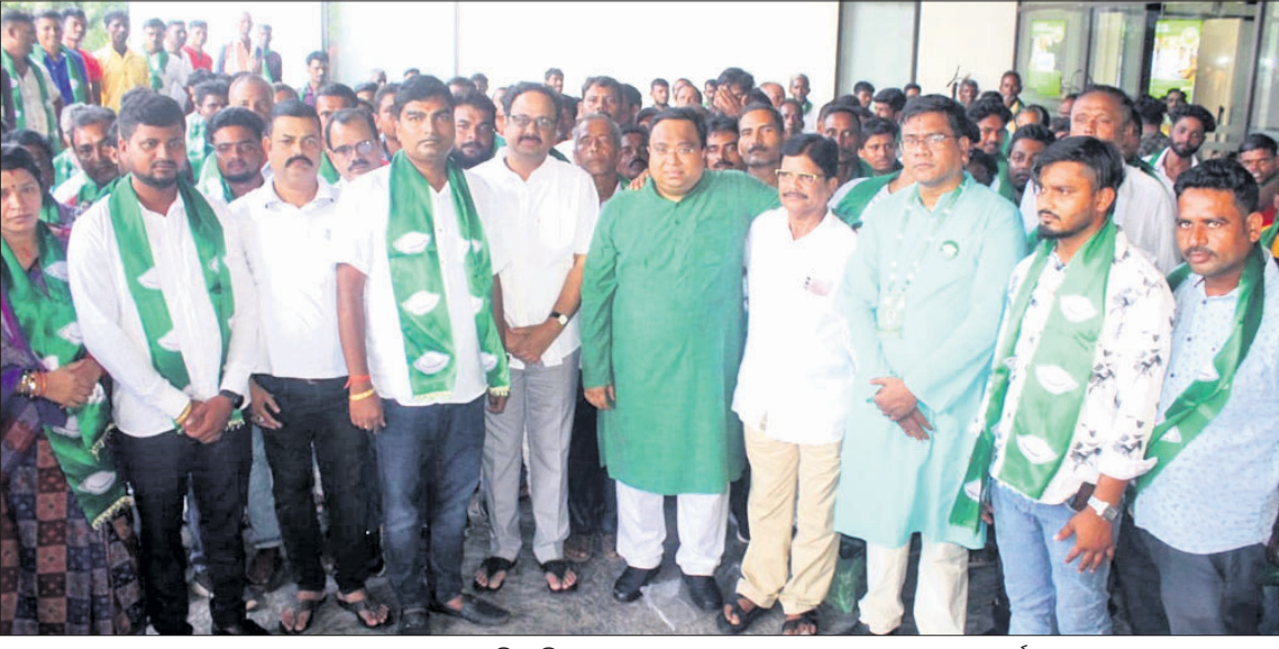
ଶଙ୍ଖ ଭବନରେ ମଙ୍ଗଳବାର ବିଜେଡି ନେତୃବୃନ୍ଦଙ୍କ ସହ ଦଳରେ ଯୋଗଦେଇଥିବା ଭାଜପା କର୍ମୀ।