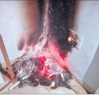
ବିସ୍ମୟ ବୋର୍ଡ ନିକଟରୁ ବ୍ୟାପିଥିବା ନିଆଁ।