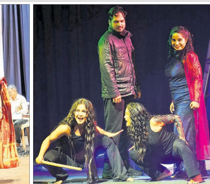
ଓଡ଼ିଶା ନାଟ୍ୟ ସଂଘ ପକ୍ଷରୁ ରବୀନ୍ଦ୍ର ମଣ୍ଡଳରେ ଚାଲିଥିବା ଜାତୀୟ ନାଟକ ମହୋତ୍ସବର ଚେଷ୍ଟା କରାଯାଉଥିବା ବେଳେ ସଙ୍ଗୀତ ପରିବେଷଣ କରାଯାଇଛି। ମଙ୍ଗଳବାର ସନ୍ଧ୍ୟାରେ ପରିବେଷିତ ଅପମା ନାଟକ 'ଅଭିନୟନ ମାକ୍‌ଡେଫ୍'ର ଏକ ଦୃଶ୍ୟ।