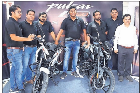
ଏନ୍ ୧୫୦ର ନୂଆ ପଲ୍ସର ଏନ୍ ୧୫୦ର ଅନାବରଣ କରାଯାଇଛି।