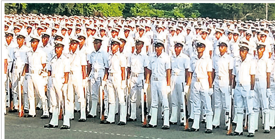
ଭାରତୀୟ ନୌସେନାର ତିଳିକା ଶାଖା ତାଲିମ କେନ୍ଦ୍ରରେ ମଙ୍ଗଳବାର ଅନୁଷ୍ଠିତ ପ୍ରଶିକ୍ଷଣପ୍ରାପ୍ତ ୨୮୯୫ ନୌସେନା ଅଗ୍ନିଶମକ ପାଠିଆଉଟ୍ ପରେ।

ରାସ୍ତାରେ ପ୍ରାଥମିକ ଭାବେ ୧୮୬୪ ପାଥଶୋଳ ବିହୀନ କରାଯାଇଛି। ତେବେ ବର୍ଷା କାରଣରୁ ଏହି ସଂଖ୍ୟା ଆହୁରି ବଢିବା ନେଇ ୩ ଜୋନର କାର୍ଯ୍ୟନିର୍ବାହୀ ଯନ୍ତ୍ରୀ ପୂର୍ବନା ଦେଇଛନ୍ତି। ପ୍ରମୁଖ ରାସ୍ତା ଓ ଆଭ୍ୟନ୍ତରୀଣ ରାସ୍ତାରେ ମରାମତି କରାଯିବ। ବିଏମ୍‌ସି ଅଞ୍ଚଳରେ ବିଭିନ୍ନ ବିଭାଗ ଦ୍ୱାରା ରାସ୍ତା କରାଯାଇ ଥିବାରୁ ସମସ୍ତ ବିଭାଗ ସହ ସମନ୍ୱୟ ରଖି ମରାମତି କାର୍ଯ୍ୟ କରାଯିବ। ଏଥିରେ ୩ ଜୋନର କାର୍ଯ୍ୟନିର୍ବାହୀ ଯନ୍ତ୍ରୀଙ୍କୁ ତଥ୍ୟ ସହଜରେ ଦେବାକୁ କୁହାଯାଇଛି। ପୂଜା ପୂର୍ବରୁ ସମସ୍ତ ମରାମତି କାମ ସରିବା ନେଇ ସୂଚନା ଦିଆଯାଉଥିବା ବୋଲି କହିଛନ୍ତି। ସମସ୍ତ ପ୍ରକାର ମରାମତି ପରେ ବି କାର୍ଯ୍ୟ ଆଗେଇ ପାରିନାହିଁ।