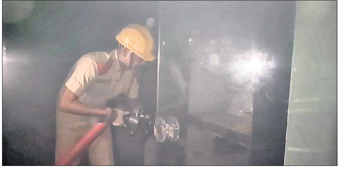
ଅଗ୍ନିଶମ କର୍ମଚାରୀ ନିଆଁ ଲିଭାଇଛନ୍ତି।

ଭୁବନେଶ୍ୱର ବାଣାବିହାର ଛକସ୍ଥିତ ମେଟ୍ରୋ ଟାଉନରେ ଅଗ୍ନିକାଣ୍ଡ ଘଟିଛି। ପଞ୍ଚମ ମହଲାରେ ଏକ ଅଫିସରେ ନିଆଁ ଲାଗିଯିବା ପରେ ଏଥିରେ ଦୁଇଜଣ ନାବାଳକ ଫସି ରହିଥିଲେ। ଖବର ପାଇ ଅଗ୍ନିଶମ ବାହିନୀ ସେମାନଙ୍କୁ ଉଦ୍ଧାର କରିବା ସହ ନିଆଁକୁ ଆୟତ୍ତ କରିଛି। ଯୋଗ୍ୟର ବିଳମ୍ବିତ ରାତିରେ ଏକକି ଅପରଣ ଘଟିଥିଲା। ଉଦ୍ଧାର ନାବାଳକଦ୍ୱୟଙ୍କ ସ୍ୱାସ୍ଥ୍ୟ ବସ୍ତ୍ର ଠିକ୍ ଥିବା ସୂଚନା ମିଳିଛି।