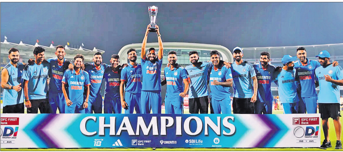
ଚ୍ରୁପି ସହ ସିରିଜ୍ ବିଜୟୀ ଭାରତୀୟ କ୍ରିକେଟ ଦଳ।

୨-୧ରେ ଜିତି ନେଇଛି। ଭାରତ ପକ୍ଷରୁ ରୋହିତ ଶର୍ମା, ବିରାଟ କୋହଲି ଓ ମହମ୍ମଦ ସିରାଜ ଏହି ମ୍ୟାଚରେ ପ୍ରତ୍ୟାବର୍ତ୍ତନ କରିଥିବା ବେଳେ ଶୁଭମନ ଚିଲ୍, ଲଗାନ କିଶନ, ଆର. ଅଶ୍ୱିନ ଓ ମହମ୍ମଦ ଶାମିକୁ ବିଶ୍ରାମ ଦିଆଯାଇଥିଲା। ଚ୍ୟୁ ଜିତି ବ୍ୟାଟିଂ କରିଥିଲା ଅଷ୍ଟ୍ରେଲିଆ। ଚ୍ୟୁ-୪ ଖେଳାଳି ଅର୍ଦ୍ଧଶତକ ହାସଲ କରିଥିବା ବେଳେ ଦଳ ବୃହତ ସ୍ତରରେ ବିଜୟୀ। ଓପନର ମିଡେଲ ମାର୍ଗ ସର୍ବାଧିକ ୯୬ ରନ ସ୍କୋର କରିଥିବା ବେଳେ