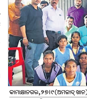
କାମାକ୍ଷାନଗର, ୨୭।୯ (ଅମଳାଦ ଖାନ)

ଦେବୀନାମ ଜିଲ୍ଲାର 'ଗୁରୁଦେବଜୀ ପାଠଶାଳା' ଏବଂ 'ମୋ ଦେବୀନାମ' ପକ୍ଷରୁ ମଙ୍ଗଳବାର କଳତାହାଡ଼ ବ୍ଲକ୍ କନ୍ଧରାସ୍ଥିତ ଓଡ଼ିଶା ଆଦର୍ଶ ବିଦ୍ୟାଳୟ ପରିସରରେ ବୁକ୍ସରୀୟ ମୋ ଦେବୀନାମ ମହୋତ୍ସବ ଏବଂ ମୋ ପ୍ରତିଭା ମୋ ପରିଚୟ ସାଂସ୍କୃତିକ ଓ ଶିକ୍ଷା ଭିତ୍ତିକ ପ୍ରତିଯୋଗିତା ଅନୁଷ୍ଠିତ ହୋଇଯାଇଛି। ଏଥିରେ ଚିତ୍ରାଙ୍କନ, ପ୍ରବନ୍ଧ, ବକ୍ତୃତା, ସଙ୍ଗୀତ ଆଦି ପ୍ରତିଯୋଗିତା