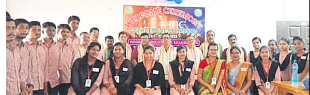
ହିନ୍ଦୋଳ କଲେଜ ପଦାର୍ଥ ବିଜ୍ଞାନ ବିଭାଗ ପକ୍ଷରୁ ଯୁକ୍ତ ୩ ପ୍ରଥମ ବର୍ଷ ଛାତ୍ରାଛାତ୍ରୀଙ୍କୁ ସ୍ୱାଗତ ସମ୍ବର୍ଦ୍ଧନା ଦିଆଯାଇଛି।