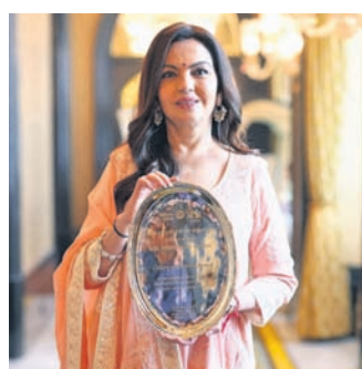
ନୀତା ଏମ୍ ଅଧ୍ୟାୟା