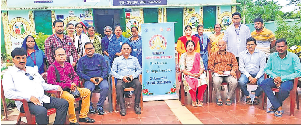
ଓଡ଼ାପଡ଼ା ବ୍ଲକ କାଞ୍ଚିବିଶା ସ୍ୱାସ୍ଥ୍ୟ ଓ ଆରୋଗ୍ୟ ଉପକେନ୍ଦ୍ର ପରିସରରେ ମୂଲ୍ୟାଙ୍କନ ପାଇଁ ଆସିଥିବା କେନ୍ଦ୍ରୀୟ ପ୍ରତିନିଧି ଦଳ।

ଏନ୍‌କ୍ୱାଏ ପୁରସ୍କାର ହାସଲ କରିଥିବା ଏହି ସ୍ୱାସ୍ଥ୍ୟ ଓ ଆରୋଗ୍ୟ ଉପକେନ୍ଦ୍ରଗୁଡ଼ିକ ହେଲା ଓଡ଼ାପଡ଼ା ବ୍ଲକର କାଞ୍ଚିବିଶା ଓ ଗୁଣ୍ଡଦେଇ ସ୍ୱାସ୍ଥ୍ୟ ଓ ଆରୋଗ୍ୟ ଉପକେନ୍ଦ୍ର, ଗଂଦିଆ ବ୍ଲକର କାବେରା ମାଧ୍ୟମ ସ୍ୱାସ୍ଥ୍ୟ ଓ ଆରୋଗ୍ୟ ଉପକେନ୍ଦ୍ର ଏବଂ ହିନ୍ଦୋଳ ବ୍ଲକର ଚିତ୍ରଲପୁର ସ୍ୱାସ୍ଥ୍ୟ ଓ ଆରୋଗ୍ୟ ଉପକେନ୍ଦ୍ର। ଗତ ଅଗଷ୍ଟ ୨୭ ୪ ତାରିଖ ପର୍ଯ୍ୟନ୍ତ ଏହି ସ୍ୱାସ୍ଥ୍ୟ ଉପକେନ୍ଦ୍ର ଗୁଡ଼ିକର ସ୍ୱଚ୍ଛତା, ମାନବ ସମ୍ବଳ, ରୋଗୀଙ୍କ ମତାମତ, ରୋଗୀ ସଂଖ୍ୟା, ଗୋଷ୍ଠୀ ସହଭାଗିତାକୁ ଆଧାର କରି ଜାତୀୟ ମାନ ନିର୍ଦ୍ଧାରଣ କମିଟିର ଏକ କେନ୍ଦ୍ରୀୟ ପ୍ରତିନିଧି ଦଳଙ୍କ ଦ୍ୱାରା ଏହାର ମୂଲ୍ୟାଙ୍କନ ପାଇଁ ଆସିଥିବା କେନ୍ଦ୍ରୀୟ ପ୍ରତିନିଧି ଦଳ କରାଯାଇଥିଲା। ଉକ୍ତ ମୂଲ୍ୟାଙ୍କନ ଆଧାରରେ ଏହି ସ୍ୱାସ୍ଥ୍ୟ ଉପକେନ୍ଦ୍ର ଗୁଡ଼ିକ ଉଲ୍ଲେଖନୀୟ ସଫଳତା ଲାଭ କରି ପୁରସ୍କୃତ ହୋଇଥିବା କେନ୍ଦ୍ର ସ୍ୱାସ୍ଥ୍ୟ ଓ ପରିବାର କଲ୍ୟାଣ ମନ୍ତ୍ରାଳୟ ପକ୍ଷରୁ ରାଜ୍ୟ ସରକାରଙ୍କୁ ପୂରନା ପ୍ରଦାନ କରାଯାଇଛି। ଏହି ସଫଳତା ପଛରେ ମାନ ନିର୍ଦ୍ଧାରଣ କମିଟିର ଏକ କେନ୍ଦ୍ରୀୟ ସମେତ ସ୍ୱାସ୍ଥ୍ୟ ବିଭାଗର ସମସ୍ତ କର୍ମଚାରୀଙ୍କ ଅବଦାନ ରହିଛି। ଏହି ସଫଳତା ସମଗ୍ର ପ୍ରଦେଶରେ ଉଲ୍ଲେଖନୀୟ ସଫଳତା ହାସଲ କରି ଅଧିକ ସ୍ୱାସ୍ଥ୍ୟ ସେବାକୁ କିପରି ପୁରସ୍କୃତ ହେବେ ସେ ଦିଗରେ କାର୍ଯ୍ୟ କରିବାକୁ ଜିଲା ପୁଞ୍ଜ ପ୍ରତିରୋଧକ ଦାମ ଆଣିବା ଲାଗି ସ୍ୱାସ୍ଥ୍ୟ ବିଭାଗର ସମସ୍ତ ଅଧିକାରୀ ଓ କର୍ମଚାରୀଙ୍କୁ ଆହ୍ୱାନ ଦେଇଛନ୍ତି।