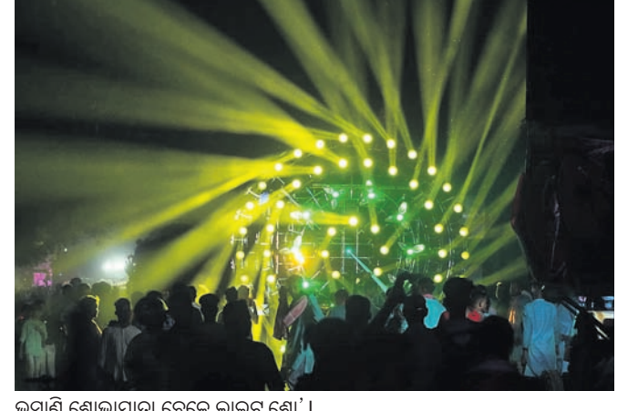
ଭବାଣି ଶୋଭାଯାତ୍ରା ବେଳେ ଲାଇଟ୍ ଶୋ'।