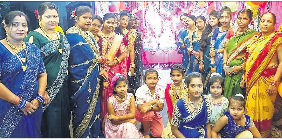
ଦୋଳମଣ୍ଡପ ସାହିରେ ଖୁଦୁରୁକୁଣୀ ଓଷା ପାଳନ ଅବସରରେ ଓଷା ପାଳନୀମାନେ।

ଦେଢ଼ନାଲ ସହର ଦୋଳମଣ୍ଡପ ସାହିରେ ମଙ୍ଗଳା ମନ୍ଦିର ନିକଟରେ ଖୁଦୁରୁକୁଣୀ ଓଷା ପାଳନ ହୋଇଯାଇଛି।