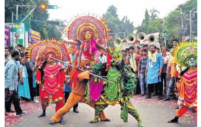
ସହରରେ ଭବାଣି ଶୋଭାଯାତ୍ରା ସମୟରେ ସାଂସ୍କୃତିକ କାର୍ଯ୍ୟକ୍ରମ।

ମେଡ କାଞ୍ଚନ ଚଳିତରୁ ବାହାରି ରାଜା ଛକ ଦେଇ ତିଆରି ହେବୁ ଯାଇଥିଲା। ମୋଟାମୋଟି ଭାବେ ଶୁଙ୍ଖାକାର ସହ ଭବାଣି ଉତ୍ସବ ଅନୁଷ୍ଠିତ ହୋଇଥିଲା। ଅନ୍ୟପକ୍ଷରେ ମଦ୍ୟପକ୍ଷ ସାବାଜି କରିବାକୁ ଖୋଦ୍ ଥାନାଧିକାରୀ ସହରରେ ପଇତରା ମରିଥିଲେ। କେତେକଟା ମଦ୍ୟପକ୍ଷ ଠାରୁ କରମାନା ଆଦାୟ କରାଯାଉଥିବା ଥାନା ପକ୍ଷରୁ ସୂଚନା ପ୍ରଦାନ କରାଯାଇଛି।