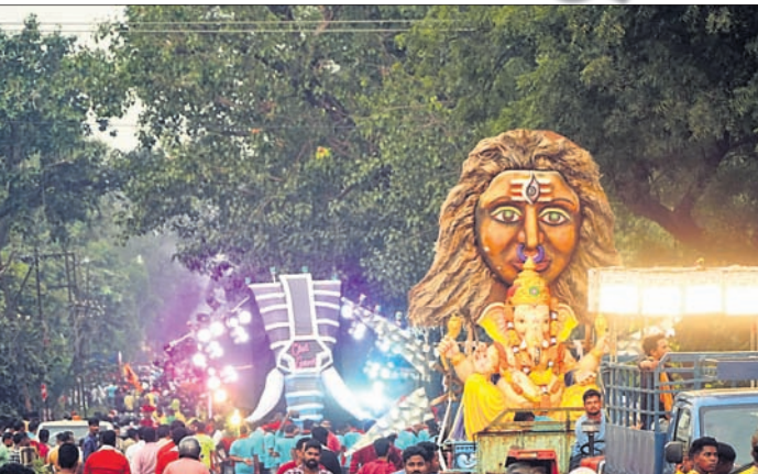
ରୋକି ପାରି ନ ଥିଲା। କଳିକଟ ଲାଇଟର ତାଳେ ତାଳେ ପିଲା ଠାରୁ ବୁଢ଼ା ପର୍ଯ୍ୟନ୍ତ ସମସ୍ତେ ଝୁମି ଉଠିଥିଲେ। ପୂର୍ବରୁ ଗଣେଶ ପୂଜା ସେଷ୍ଟାଲ କମିଟି ପକ୍ଷରୁ ଲବେରି ମାଧ୍ୟମରେ ଧାର୍ଯ୍ୟ କରାଯାଇଥିବା ୨୨ଟି ମେଡ ପଛକୁ ପଛ ରହିଥିଲା। ଗୁପ୍ତ ଏ'ରେ ଥିବା ୧୪ଟି ମେଡ ଥାନା ଛକକୁ ବାହାରି ବଜାର ଛକ ଦେଇ ଯାଇଥିଲା। ସେହିଭଳି ଗୁପ୍ତ ବି'ରେ ଥିବା ୮ଟି

ଅନୁଗୋଳ ସହରରୁ ରୁଧିବାର ମେଲାଣି ନେଇଛି ଅଗ୍ରପୂଜ୍ୟ ଶ୍ରୀ ଗଣେଶ। ଅପରାହ୍ନରେ ଏହି ବିଦାୟ ପର୍ବ ଅନୁଷ୍ଠିତ ହୋଇଥିଲା। ଚଳିତବର୍ଷ ମେଲାଣି ଉତ୍ସବକୁ ଯୁବପିଠା ଧୂମଧାମରେ ପାଳନ କରିଥିଲେ। ଧାତିକି ଧାତିକି ବ୍ରାହ୍ମ ବ୍ୟାଣ୍ଡ ସାଙ୍ଗକୁ ଆଖି ଝଲିଝଲିଦେଲା ଭଳି ଲାଇଟ୍ ଶୋ'ରେ ସହର ଝଲିଝଲି