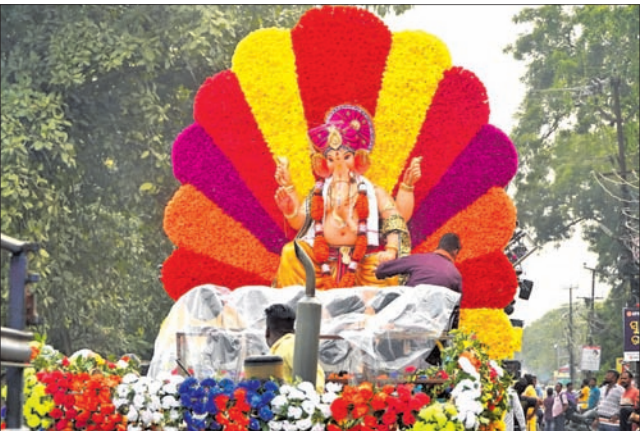
ଅନୁଗୋଳ, ୨୭।୯ (ଅମିତ କୁମାର ସାମଲ)

ଅନୁଗୋଳ ସହରରୁ ରୁଧିବାର ମେଲାଣି ନେଇଛି ଅଗ୍ରପୂଜ୍ୟ ଶ୍ରୀ ଗଣେଶ। ଅପରାହ୍ନରେ ଏହି ବିଦାୟ ପର୍ବ ଅନୁଷ୍ଠିତ ହୋଇଥିଲା। ଚଳିତବର୍ଷ ମେଲାଣି ଉତ୍ସବକୁ ଯୁବପିଠା ଧୂମଧାମରେ ପାଳନ କରିଥିଲେ। ଧାତିକି ଧାତିକି ବ୍ରାହ୍ମ ବ୍ୟାଣ୍ଡ ସାଙ୍ଗକୁ ଆଖି ଝଲିଝଲିଦେଲା ଭଳି ଲାଇଟ୍ ଶୋ'ରେ ସହର ଝଲିଝଲି