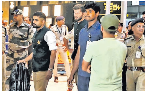
ଭାରତରେ ପହଞ୍ଚିବା ପରେ ପାକିସ୍ତାନ ଅଧିନାୟକ ବାବର ଆକମ୍ ଓ ଅନ୍ୟମାନେ।

ଆଇସିସି ଦିନିକିଆ କ୍ରିକେଟ ବିଶ୍ୱକପର ଉନ୍ମତ୍ତା ବଢ଼ିଛି। ଦୀର୍ଘ ୭ ବର୍ଷ ବ୍ୟବଧାନରେ ପାକିସ୍ତାନ କ୍ରିକେଟ ଦଳ ପ୍ରଥମଥରପାଇଁ ଭାରତରେ ପହଞ୍ଚିଛି। ବାବର ଆକମ୍ ନେତୃତ୍ୱାଧୀନ ପାକିସ୍ତାନ ଦଳ ରୁଧିରା ଲାହୋରକୁ ରୁଦ୍ଧ ବାଟଦେଇ ଏଠାରେ ପହଞ୍ଚିଛି। ଭାରତର ୧୦ ଗ୍ରାଉଣ୍ଡରେ କ୍ରିକେଟ ବିଶ୍ୱକପ ଅଭ୍ୟାସର ୫ରୁ ଆରମ୍ଭ ହେବ। ବିଶ୍ୱକପ ପୂର୍ବରୁ ପାକିସ୍ତାନ ଚଳିତ ମାସ ୨୯ ତାରିଖରେ ଲୁଗାଲୁଗା ବିପକ୍ଷରେ ଏହାର ପ୍ରଥମ ଖେଳିବ। ଏହାପରେ ଅଭ୍ୟାସର ୩ରେ ଅଷ୍ଟ୍ରେଲିଆ ସହ ଦ୍ୱିତୀୟ ଖେଳିବ। ଏହାପରେ ଖେଳିବିଜୟୀ ପ୍ରସ୍ତୁତ କରିବ। ବିଶ୍ୱକପରେ ପାକିସ୍ତାନ ଏହାର ପ୍ରଥମ ମ୍ୟାଚ