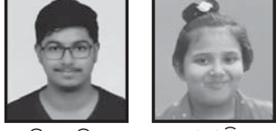
ଚିତ୍ରାମଣି ପରିବାରର ସଦସ୍ୟମାନଙ୍କର ଫଟୋ