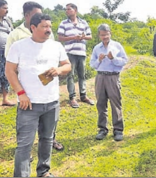
ଭିଡ଼ିଭୂମି ଅନୁଧ୍ୟାନ କରୁଥିବା ଅଧିକାରୀମାନେ।

ଦେଢ଼ନାଲ ଜିଲାର କାମାକ୍ଷାନଗର ବ୍ଲକର ବାଉଁଶିଆ ଗ୍ରାମଠାରେ ଗ୍ରାମ୍ୟ ଶିଳ୍ପ ଉଦ୍ୟାନ ପ୍ରତିଷ୍ଠା ନେଇ ପଞ୍ଚାୟତ ସମିତି ପକ୍ଷରୁ ଏକ ପ୍ରସ୍ତାବ ଗୃହିତ ହୋଇଛି। ଏ ନେଇ ରୁଧିରା ବିଡ଼ି ଓ ଅଧିକାରୀ