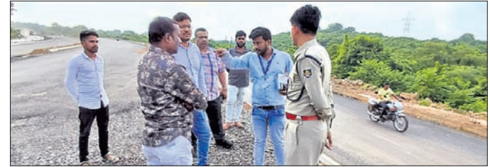
ଜାତୀୟ ରାଜପଥ ନିର୍ମାଣ କାମ ଯାଞ୍ଚକଲେ ପ୍ରତିନିଧି ଦଳ।

ଦେଢ଼ନାଲ ଜିଲାପାଳଙ୍କ ନିର୍ଦ୍ଦେଶକ୍ରମେ ଏକ କମିଟି ଗଠନ କରାଯାଇ ନିର୍ମାଣ ଏକ ପ୍ରତିନିଧି ଦଳ ଓଡ଼ାପଡ଼ା ବ୍ଲକର କଣ୍ଟାବଣିଆଠାରୁ ୫୫ ନଂ. ଜାତୀୟ ରାଜପଥର ସହର ବ୍ଲକ ବଳଦିଆବନ୍ଧ ପର୍ଯ୍ୟନ୍ତ ନିର୍ମାଣ କାର୍ଯ୍ୟ ଯାଞ୍ଚ କରିଛନ୍ତି। ଜାତୀୟ ରାଜପଥ ନିର୍ମାଣ କାର୍ଯ୍ୟ ସମ୍ପର୍କରେ ଆଗଭ୍ରମ ଥିବାରୁ ଜନ ପ୍ରତିନିଧି ଓ ସାଧାରଣରେ ଚାନ୍ଦ ଅଧିକାରୀଙ୍କୁ ପ୍ରକାଶ ପାଇଛି। କାମ ଗ୍ରାମ୍ୟ କର୍ମଚାରୀଙ୍କୁ ଉପସ୍ଥିତ କରି ଏକ ସମୀକ୍ଷା ବୈଠକକୁ ଡାକି ତଥ୍ୟ ଦେଖିବାକୁ ଅଭିଯୋଗ ହୋଇଛି।