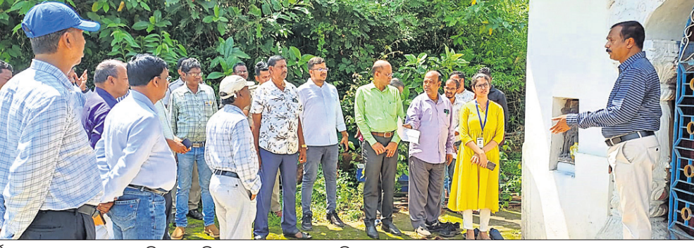
ନିର୍ମାଣାଧୀନ ଆମ ବସ୍ତୁଷ୍ଟ ପରିସରରେ ଜିଲାପାଳ ଓ ଅନ୍ୟ ପ୍ରଶାସନିକ ଅଧିକାରୀମାନେ।

ଦେଢ଼ନାଲ ବସ୍ତୁଷ୍ଟଠାରେ ନିର୍ମାଣାଧୀନ ଆମ ବସ୍ତୁଷ୍ଟକୁ ରୁଧିରା ଜିଲାପାଳଙ୍କ ସମେତ ପ୍ରଶାସନିକ ଅଧିକାରୀମାନେ ପରିଦର୍ଶନରେ ଯାଇଥିଲେ। ବସ୍ତୁଷ୍ଟ ପରିସରରେ ଥିବା ମନ୍ଦିରର ଉଦ୍ଧେଦ କରାଯିବା ପାଇଁ ପୂର୍ବରୁ ନିଷ୍ପତ୍ତି ହୋଇଥିବାରୁ ଦେବୋତ୍ତର ବିଭାଗ ସହଯୋଗରେ ଠାକୁରଙ୍କୁ ଅନ୍ୟତ୍ର ସ୍ଥାନାନ୍ତରିତ କରାଯାଇଥିଲା। ସେହିପରି