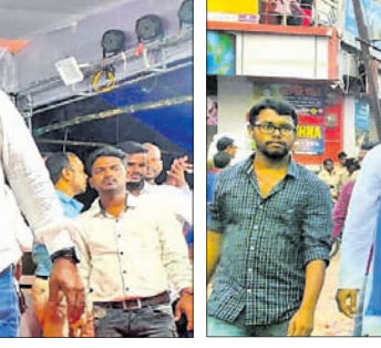
ଭବାଣିରେ ସାମିଲ ହୋଇଥିବା କୁବର ଗୋଲ୍ଡେନ କୁବର ସଦସ୍ୟମାନେ।