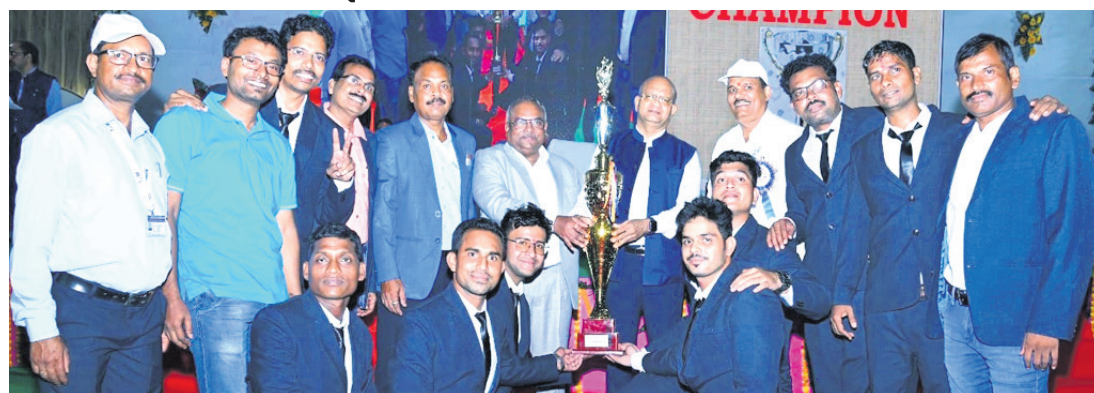
ତାଳଚେର, ୨୭/୯ (ମନୋଜ ନନ୍ଦ)