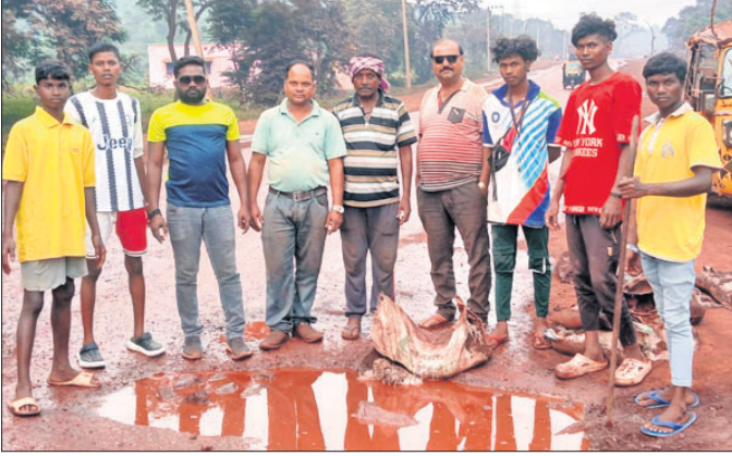
ବିଶ୍ୱାସ ଯୁବକ ସଂଘ ସଦସ୍ୟମାନେ।

ବେଝୁବର ଜିଲ୍ଲା ଯୋଡ଼ା-କୁରୁଡ଼ି ରାସ୍ତା ମରାମତି ଅଭାବକୁ ଶୋଚନୀୟ ଅବସ୍ଥା ହୋଇପଡ଼ିଛି। ଏହି ରାସ୍ତାରେ ଦୈନିକ ଅନେକ ହଜାର ସଂଖ୍ୟାରେ ଖଣିଜ ବୋହେଇ ଟ୍ରକ୍ ଚଳାଚଳ ହେତୁ ରାସ୍ତାର ବହୁ ସ୍ଥାନରେ ଖାଲଖମା ଦୃଶ୍ୟ ହୋଇଛି।