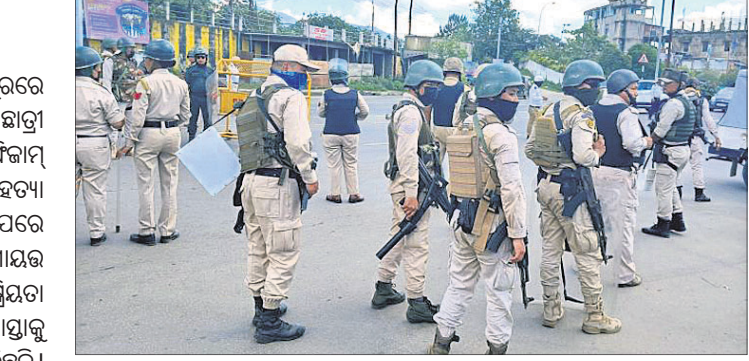
ମେଲିତ ଛାତ୍ରୀ ଓ ଛାତ୍ରଙ୍କ ହତ୍ୟା ପ୍ରତିବାଦରେ ମଣ୍ଡଳରେ ଖୁସି ଲାଗିଲା । ମୋକାଇଗଣ୍ଡାମାନେ ବିଶ୍ୱୋଦ୍ଧ ବେଳେ ପୁରୁଣା ବକର କଡ଼ା ପ୍ରହରା ।

ଜାତିଆଣ ହିଂସା ପ୍ରଭାବିତ ମଣ୍ଡଳରେ ମେଲିତ ସମ୍ପ୍ରଦାୟର ନିଷେଧକ ଛାତ୍ରୀ ଲୁଣ୍ଠାଣୀଙ୍କ ହିଜାମ୍ ଏବଂ ଛାତ୍ର ଫିକାମ୍ ହେମନିଜିତଙ୍କୁ ଅପହରଣ ଓ ହତ୍ୟା କରାଯାଇଥିବା ଜଣାପଡ଼ିବା ପରେ ବିରୋଧରେ ଚାଲିଥିବା ମାମଲାର ଖୋଜତାଡ଼ ପାଇଁ ପଞ୍ଜାବ, ହରିୟାଣା, ରାଜସ୍ଥାନ, ଉତ୍ତରାଖଣ୍ଡ, ଉତ୍ତର ପ୍ରଦେଶ, ଦିଲ୍ଲୀ ଓ ଚଣ୍ଡିଗଡ଼ରେ ଚଢ଼ାଉ ବେଳେ ବନ୍ଧୁକ, ଅନ୍ୟ ଅସ୍ତ୍ରଶସ୍ତ୍ର, ଡିଜିଟାଲ ଉପକରଣ ଏବଂ ଆପରିଜନକ ସାମଗ୍ରୀ ଜବତ କରାଯାଇଛି ।