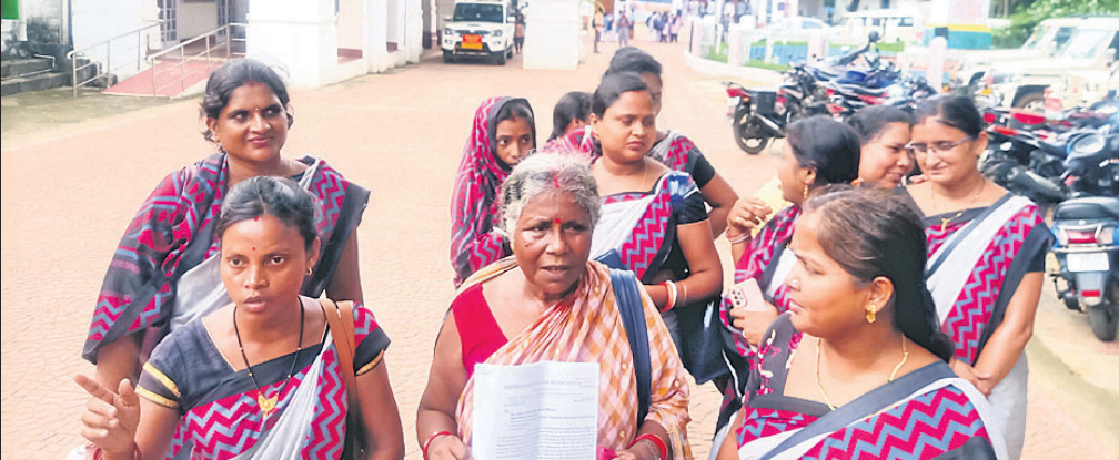
ଜିଲ୍ଲାପାଳଙ୍କୁ ଭେଟିବାକୁ ଆସିଥିବା ବ୍ୟାଙ୍କମିତ୍ରୀ ସଂଘର କର୍ମଚାରୀମାନେ।