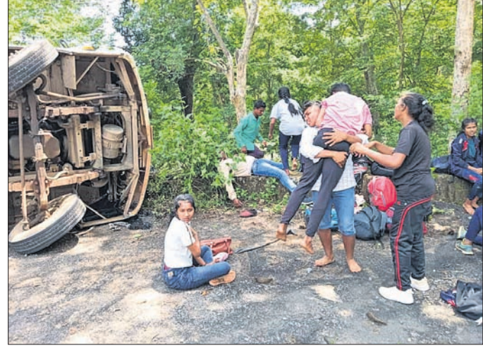
ଘାଟିରେ ବସ୍ ଓଲଟିବା ପରେ ଆହତଙ୍କୁ ଉଦ୍ଧାର କରାଯାଇ ଡାକ୍ତରଖାନା ନିଆଯାଇଛି ।

ଚନ୍ଦ୍ରାହାଣ୍ଡି/ଝରିଗାଁ/ନବରଙ୍ଗପୁର, ୨୭।୯ (ଦିଲୀପ ଦାସ/ କିଶୋର ଚନ୍ଦ୍ର ମଣ୍ଡଳ/ସଦାଶିବ ପ୍ରହରାଜ)