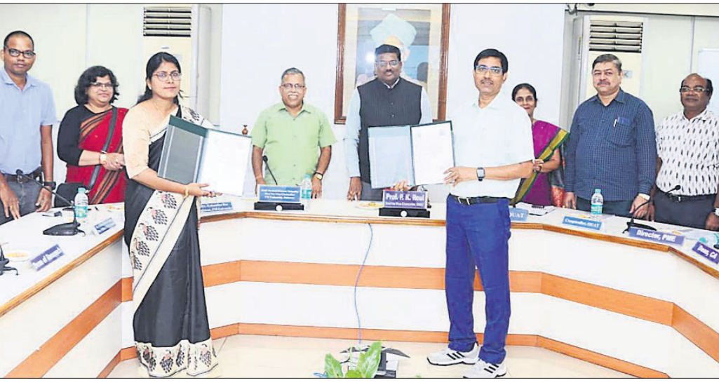
ବିଶ୍ୱବିଦ୍ୟାଳୟ ରୁଷାମଣାପତ୍ର ସ୍ୱାକ୍ଷର କରାଯାଇଛି।