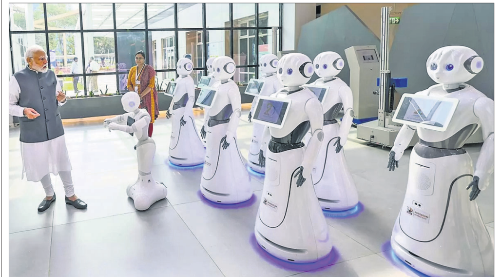
ପ୍ରଧାନମନ୍ତ୍ରୀ ନରେନ୍ଦ୍ର ମୋଦି କୁସୁଧାର ସାଙ୍ଗରେ ସିବି ଆହମ୍ମଦାବାଦର ରୋବୋଟିକ୍ ଗ୍ୟାଲେରି ପରିଦର୍ଶନ କରୁଛନ୍ତି ।

ନୂଆଦିଲ୍ଲୀ, ୨୭।୯: ଇଣ୍ଡିଆର ନାଗରୀକ ସେବାକ୍ଷେତ୍ର ଫର୍ କ୍ରମ୍ପା କନସିଆସ୍‌ମେନ୍ସ (ଇଫାଲ) ହେଉଛି ଦେଶରେ ସବୁଠାରୁ ବଡ଼ ଓକି । ଏହି ଧର୍ମୀୟ ସଂସ୍ଥା ନିଜ ଗୋଶାଳାଗୁଡ଼ିକର ଗୋରୁଙ୍କୁ କଂସେଇମାନଙ୍କୁ ବିକ୍ରି କରୁଛି ବୋଲି ଭାଜପା ଏମ୍ପି ମାନେକା ଗାନ୍ଧୀ ଗାନ୍ଧୀଙ୍କୁ କହିଛନ୍ତି । ତାଙ୍କ ମତରେ ଇଫାଲ ଗୋଶାଳା ପରିଚାଳନା କରି ସରକାରଙ୍କଠାରୁ ବିପୁତ ଜମି ଓ ଅନ୍ୟ ସୁବିଧାଗୁଡ଼ିକ ହାସଲ କରୁଛି । ଫାଲଦା ଉଠାଇବା ପରେ ଗୋରୁଙ୍କୁ କଂସେଇଙ୍କ ହାତରେ ଚେକିଦେଉଛି । ପ୍ରାଣୀ ସୁରକ୍ଷା ଉପରେ ମତ ରଖୁଥିବା ପୂର୍ବତନ କେନ୍ଦ୍ରମନ୍ତ୍ରୀ ମାନେକାଙ୍କ ଏହି ମତବ୍ୟ ସାମାଜିକ ଗଣମାଧ୍ୟମରେ ବହୁଳ ପ୍ରସାରିତ ହୋଇ ବିବାଦ ସୃଷ୍ଟି କରିଛି । ତେବେ ଇଫାଲ ଏହି ଅଭିଯୋଗକୁ ଛାଡ଼ିନାହିଁ ଓ ନିର୍ଦ୍ଦେଶ ଦେଇଛନ୍ତି ।