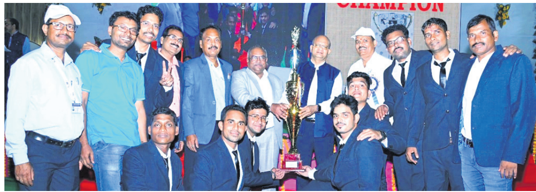
ତାଳଚେର, ୨୭/୯ (ମନୋଜ ନନ୍ଦ)

ଅନୁରୋଧ କିଲା ତାଳଚେରରେ ଏମ୍‌ସିଏଲ୍ ଜଗନ୍ନାଥ କ୍ଷେତ୍ରରେ ୨୭ତମ କ୍ଷେତ୍ରୀୟ ଶ୍ରେଣୀ ଉଦ୍‌ଯାପିତ ପ୍ରତିଯୋଗିତା ଉଦ୍‌ଯାପିତ ହୋଇଯାଇଛି।