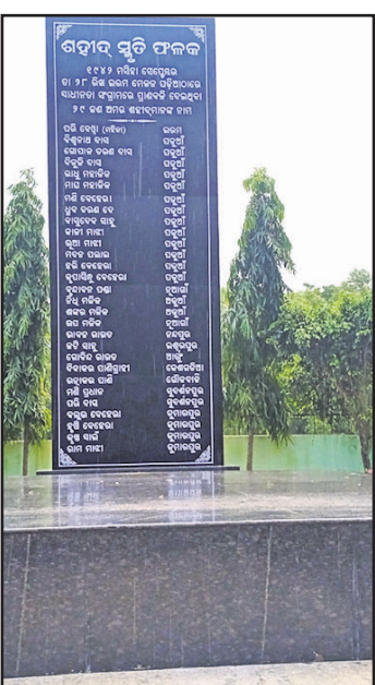
ଶହାଦ ସ୍ମୃତି ପୀଠ । ଅନ୍ୟପକ୍ଷେ ଭାରତ ସ୍ତମ୍ଭ ଆଧୋଲନରେ ଶହାଦ ହୋଇଥିବା ସଂଗ୍ରାମୀଙ୍କ ମଧ୍ୟରୁ ପରୀ ବେଝା ହେଉଛନ୍ତି ।

ବାସୁଦେବପୁର, ୨୭।୯ (ନାରାୟଣ ପ୍ରସାଦ ବାରିକ) ଭଦ୍ରକ ଜିଲ୍ଲା ବାସୁଦେବପୁର ଇରମ ମେଳଣ ପଡ଼ିଆଠାରେ ବୃତ୍ତିଶ ଫୌଜଙ୍କ ଗୁଳିରେ ଶହାଦ ହୋଇଥିବା ସଂଗ୍ରାମୀଙ୍କ ଉଦ୍‌ଘୋଷଣା ପ୍ରତିମୂର୍ତ୍ତି ପାଇଁ ଉଦ୍‌ଘୋଷଣା କରାଯାଇଛି । ଶହାଦ ପୀଠର ପୂର୍ଣ୍ଣ ବିକାଶ ପାଇଁ ରାଜ୍ୟ ସରକାର ପ୍ରାୟ ୧୦୯୪-୧୫୧୫ରେ ରାଜ୍ୟ ପର୍ଯ୍ୟଟନ ସ୍ତମ୍ଭର ମାନ୍ୟତା ଦେଇଥିଲେ । ଏଥିସହ ସଂସ୍କୃତି, ପର୍ଯ୍ୟଟନ ବିଭାଗ ପ୍ରଦତ୍ତ ଅର୍ଥରେ ପୀଠର ଉନ୍ନତୀକରଣ ହୋଇଥିବା ବେଳେ ଚଳିତବର୍ଷ ଏହି ପୀଠକୁ ମୁଖ୍ୟମନ୍ତ୍ରୀ ଉନ୍ନୟନ ଯୋଜନାରେ ସାମିଲ କରାଯାଇ ବିକାଶ କାର୍ଯ୍ୟ ଚାଲୁରହିଛି । ଚଳିତ ବର୍ଷ ପୀଠର ୮୧ ତମ ବାର୍ଷିକ ଉତ୍ସବରେ ମୁଖ୍ୟ ଅତିଥିଭାବେ ରାଜ୍ୟପାଳ ଯୋଗଦେବା କାର୍ଯ୍ୟକ୍ରମ ଥିବା ବେଳେ ପୋଲିସ ପ୍ରଶାସନ ଚଳଚ୍ଚିତ୍ର ହୋଇପଡ଼ିଛି । ପ୍ରକାଶ ଯେ, ୧୯୪୨ ସେପ୍ଟେମ୍ବର ୨୮ରେ ଉନ୍ମୋଚନ ଇରମ ମେଳଣ ପଡ଼ିଆରେ ଲୋମହର୍ଷଣକାରୀ ଗୁଳିକାଣ୍ଡ ହୋଇଥିଲା । ସ୍ୱାଧୀନତା ଆଣିବା ପାଇଁ ବାସୁଦେବପୁର ତଥା ନଦୀଘେର ଅଞ୍ଚଳର ୫ ହଜାରରୁ ଊର୍ଦ୍ଧ୍ୱ ସଂଗ୍ରାମୀ ପଡ଼ିଆଠାରେ ଇଂରେଜ ସରକାରଙ୍କ ବିରୋଧରେ ଏକତ୍ତ ହୋଇ ସଭା କରୁଥିବା ବେଳେ