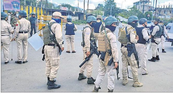
ମେଲିତ ଛାତ୍ରା ଓ ଛାତ୍ରୀଙ୍କ ହତ୍ୟା ପ୍ରତିବାଦରେ ମଣିପୁରର ଷ୍ଟେସ ଇଫାଲ ଜିଲ୍ଲା ମୋଜାଭାଙ୍ଗୋମୀରେ ବିଶୋଧ ବେଳେ ପୁରୁଷା ବଳର କଡ଼ା ପ୍ରହର।