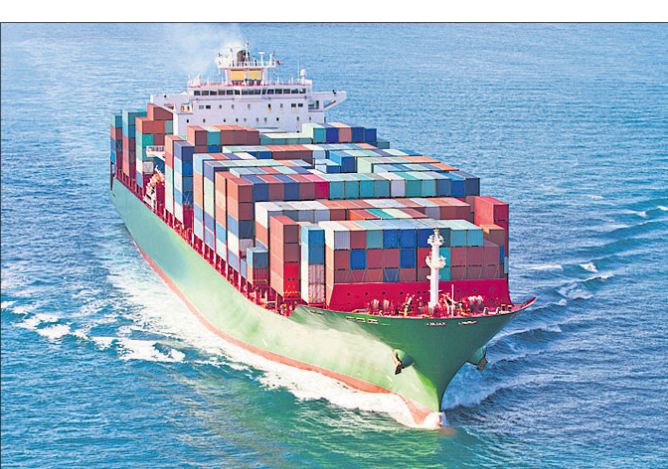
ଇଣ୍ଡିଆ-ଗଭର୍ନମେଣ୍ଟାଲ ମେରିଟାଇମ୍ ଅର୍ଗାନାଇଜେସନ୍ କର୍ମସାଧନରେ ଅର୍ଗାନାଇଜେସନ୍ (ଆଇଏମ୍ଏଫ୍) ଗଠନ କରାଯାଇଥିଲା... (Text continues with details of the organization)

ଶିକାରୀ ଜୀବନ ଛାଡ଼ି ମଣିଷ ଚାଷବାସ କରିବାପରେ ନିଜ ଆଖପାଖରେ ଥିବା ଜନସମୂହ ମଧ୍ୟରେ ଦେଶନେଶ କାରବାର ଆରମ୍ଭ କରିଥିଲା... (Text continues with details of the economic development)