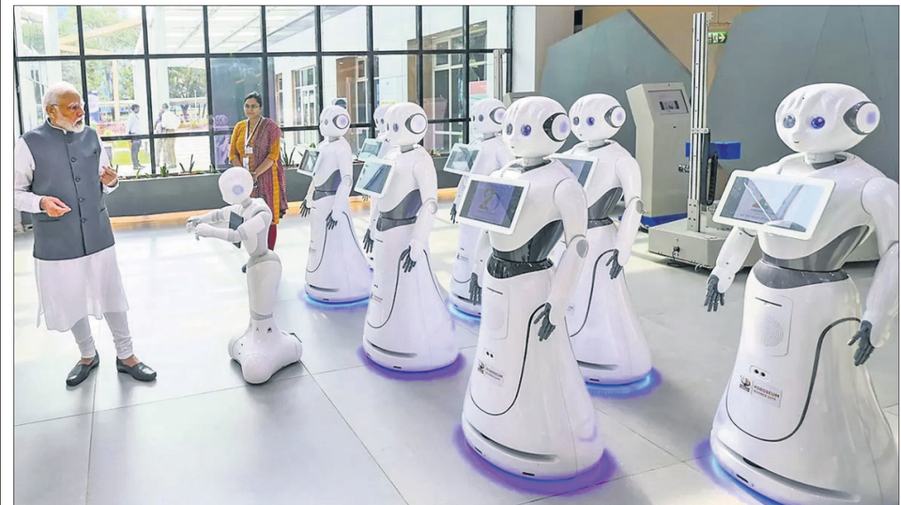
ପ୍ରଧାନମନ୍ତ୍ରୀ ନରେନ୍ଦ୍ର ମୋଦି କୁସବାର ସାଲବୁ ସିଟି ଅହମ୍ମଦାବାଦର ରୋବୋଟିକ୍ ଗ୍ୟାଲେରି ପରିଦର୍ଶନ କରୁଛନ୍ତି।

ନୂଆଦିଲ୍ଲୀ, ୨୭।୯: ଇଣ୍ଡିଆନ ଗଣନୀୟ ସେବାକାରୀ ଫର କ୍ରିଷ୍ଣା କନସିଆସେନ୍ସ (ଇନ୍ଦିଆ) ହେଉଛି ଦେଶରେ ସବୁଠାରୁ ବଡ଼ ଠକ... (Text continues with details of the scam)