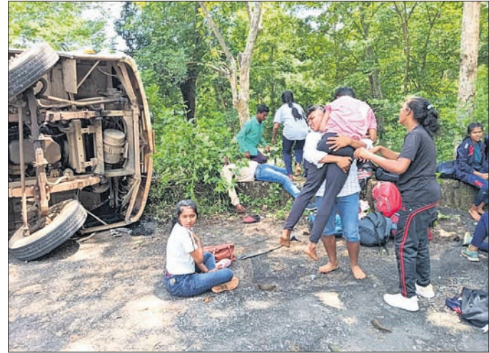
ଘାଟିରେ ବସ୍ ଓଲଟିବା ପରେ ଆହତଙ୍କୁ ଉଦ୍ଧାର କରାଯାଇ ଡାକ୍ତରଖାନା ନିଆଯାଇଛି ।

ଚନ୍ଦ୍ରାହାଣ୍ଡି/ଝରିଗାଁ/ନବରଙ୍ଗପୁର, ୨୭।୯ (ଦିଲୀପ ଦାସ/ କିଶୋର ଚନ୍ଦ୍ର ମଣ୍ଡଳ/ସଦାଶିବ ପ୍ରହରାଜ)