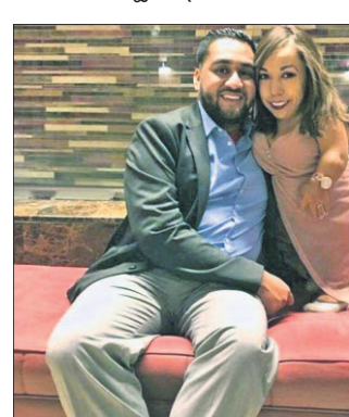
ଲାଗୁଛି କାଳେ ତାଙ୍କ ଶାଶୁ ଏହି ସମ୍ପର୍କକୁ ସ୍ୱାମୀଙ୍କର ବିବାହରେ ଭଲ ପାଇ ବାହା ହେବା କ୍ଷେତ୍ରରେ ସମସ୍ତଙ୍କ ଶାଶୁପତର ଲୋକ ତାଙ୍କ ସମ୍ପର୍କକୁ... (Text continues with details of the relationship)

ଝାଟ୍ଟିଂଟନ: ଅନେକ ସମୟରେ ମଣିଷଙ୍କ ଉଚ୍ଚତା ଅତି କମ୍ ହୋଇଥିବାରୁ ସେମାନଙ୍କୁ ଜୀବନସାଥୀ ମିଳିବା କଷ୍ଟକର ହୋଇଥାଏ... (Text continues with details of the issue)