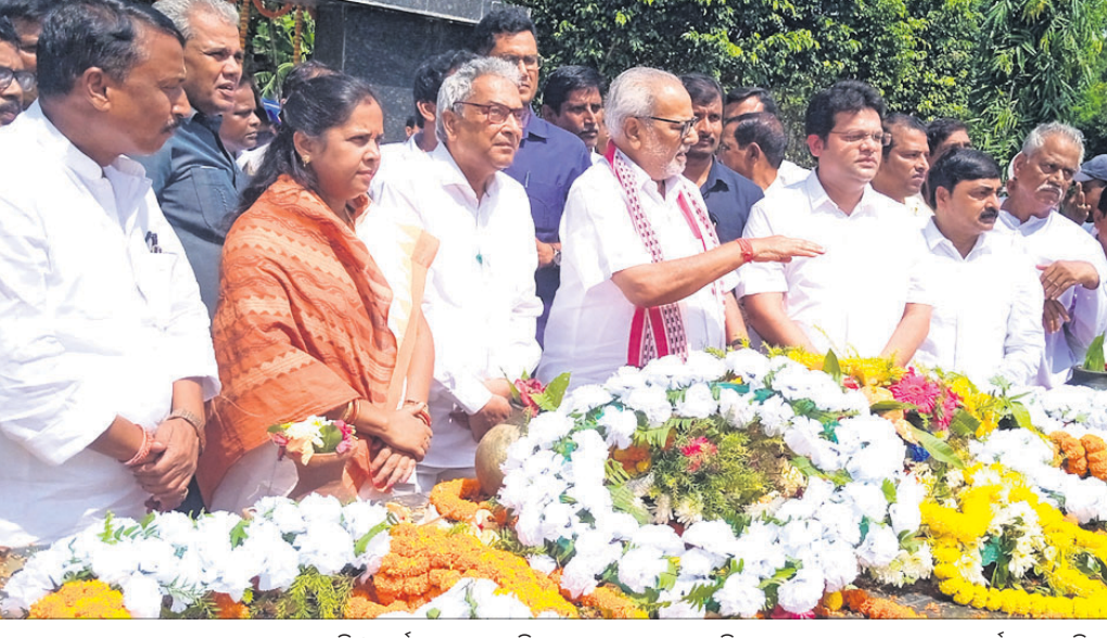
ରାଜ୍ୟପାଳ ପ୍ରଫେସର ଗଣେଶ ଲାଲ, ସଂସ୍କୃତି ଓ ପର୍ଯ୍ୟଟନ ମନ୍ତ୍ରୀ ଅଶ୍ୱିନୀ ପାତ୍ରଙ୍କ ସହ ଅନ୍ୟ ଅତିଥିମାନେ ଶହୀଦ ପୀଠରେ ମାଲ୍ୟାପର୍ଣ୍ଣ କରୁଛନ୍ତି।