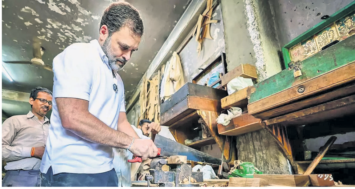
ଦିଲ୍ଲୀ କାର୍ତ୍ତିନଗର ଫର୍ନିଚର ମାର୍କେଟରେ କାଠକାମ କରୁଛନ୍ତି ରାହୁଲ ଗାନ୍ଧୀ