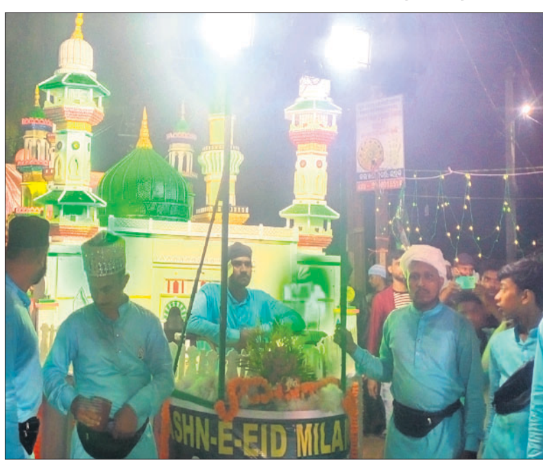
ଭଦ୍ରକ ସହରରେ ମହମ୍ମଦଙ୍କ ଜୟନ୍ତୀ ପାଳନ କରାଯାଇଛି ।

ଭଦ୍ରକ, ୨୮।୯ (ସନାତନ ରାଉତ) - ଭଦ୍ରକ ସହରରେ ପ୍ରଫେଟ ମହମ୍ମଦଙ୍କ ଜୟନ୍ତୀ (ଇଦ୍-ମିଲାଦ୍-ନବୀ) ରୁଜୁରୁ ମହାଆଡ଼ମ୍ବର ସହ ଶାନ୍ତିଶୃଙ୍ଖଳାରେ ପାଳନ କରାଯାଇଛି ।