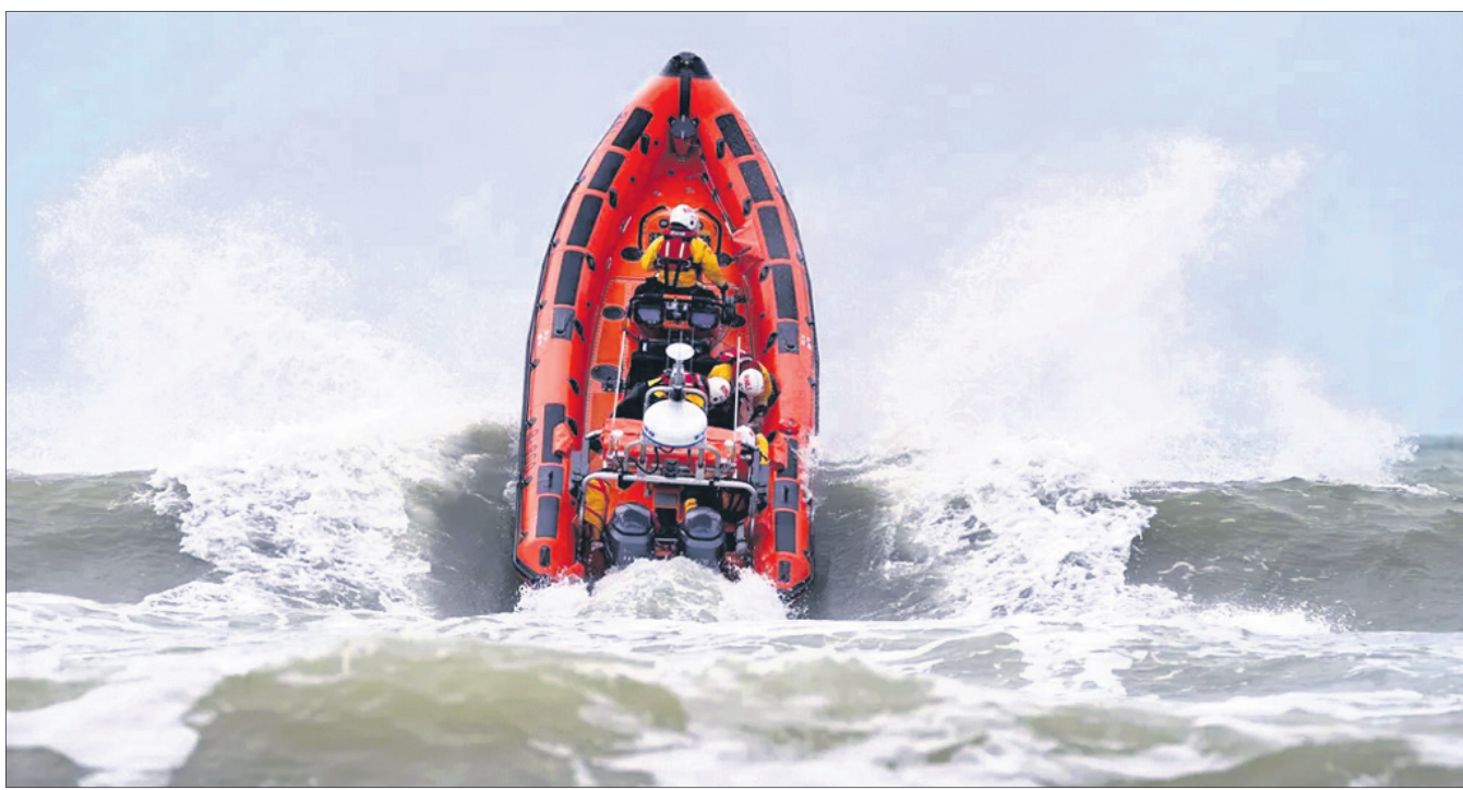
କରୁଣା ସ୍ଥିତିରେ ଲୋକଙ୍କୁ ଉଦ୍ଧାର କରିବା ପାଇଁ ବ୍ରିଟେନ୍ ନେଇ ସର୍ବସାଧାରଣ ସେବାରେ ଲାଗିଥିବା ବେଳେ ଲାଭହୁଏବାନ୍ ଇନ୍ଫ୍ଲେଟ୍‌ବ୍ଲ ଥିବା ସମୟରେ ଚାଲିଥିବାବେଳେ ସମୁଦ୍ର କେଉଁ ଲାଭ ଆଗକୁ ବଦଳି ଏକ ବୋର୍ଡ୍ ।

ଅକ୍ଟୋବର ୧ରୁ ଅନଲାଇନ ଟେନିରେ ୨୮% ଜିଏସ୍ଟି ନୂଆଦିଲ୍ଲୀ,୨୮।୯: କେନ୍ଦ୍ର ସରକାର ଅକ୍ଟୋବର ୧ରୁ ଅନଲାଇନ ଟେନି ଉପରେ ୨୮ ପ୍ରତିଶତ ଦ୍ରବ୍ୟ ଓ ସେବା ଟିକସ (ଜିଏସ୍ଟି) ଲାଗୁ କରିବା ପାଇଁ ପ୍ରସ୍ତୁତ ଅଛନ୍ତି। କେନ୍ଦ୍ରୀୟ ପରୋକ୍ଷ ଟିକସ ଓ ସାମାଜିକ (ସିଏଆଇସି) ଅଧିକାର ସଞ୍ଚୟ ଅଗ୍ରାହ୍ୟ ଏହା ଯୋଗ୍ୟ କରିଛନ୍ତି। ବିଭିନ୍ନ ସେକ୍ଟରକୁ ଜିଏସ୍ଟି ପରିସରକୁ ଆଣି ଟିକସ ସଂଗ୍ରହ ବଢ଼ାଇବା ପାଇଁ ସରକାର ଉଦ୍ୟମ ଚଳାଇଥିବାବେଳେ ଅନଲାଇନ ଟେନି ଉପରେ ଜିଏସ୍ଟି ଲାଗୁ କରିବା ସେଥିରୁ ଅନ୍ୟତମ। ସବୁ ରାଜ୍ୟଙ୍କ ସହମତି ଏବଂ ଲୋକ ସଭାରେ ଜିଏସ୍ଟି ଆଇନ ଯଂଶୋଧନ ବିଲ୍ ଗୃହୀତ ହେବା ପରେ ଉପରୋକ୍ତ ପଦକ୍ଷେପ ନିଆଯାଇଛି। ରାଜ୍ୟଗୁଡ଼ିକର ବିଧାନସଭାରେ ଅନଲାଇନ ଟେନି ଉପରେ ଜିଏସ୍ଟି ହାର ପାଇଁ ଆଇନ ଆଣିବାକୁ ହେବ। କେତେକ ଅନଲାଇନ ଟେନି କମ୍ପାନୀକୁ କାରଣ ଦର୍ଶାଏ ନୋଟିସ୍ ଆଇନଗତ ପ୍ରକ୍ରିୟା ବୋଲି ସିଏଆଇସି ଅଧିକାର କରନ୍ତି।