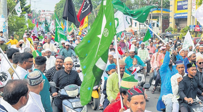
ପୁସଲମାନ ସମ୍ପ୍ରଦାୟର ଧାର୍ମିକ ଶୋଭାଯାତ୍ରା ସହର ପରିକ୍ରମା ।

ବାଲେଶ୍ୱର, ୨୮।୯ (ମାନସ ବିଶ୍ୱାଳ) - ବାଲେଶ୍ୱର ଜିଲ୍ଲାରେ ମହମ୍ମଦଙ୍କ ଜନ୍ମ ଉତ୍ସବ 'ଇଦ୍ ମିଲାଦ୍ ଉଦ୍ ନବି' ରୁଜୁରୁ ବାବଦରେ ପୂର୍ଣ୍ଣ ଆହ୍ୱାନ ଦିଆଯାଇଥିଲା ।