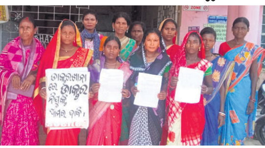
ଭାରପ୍ରାପ୍ତ ଡାକ୍ତରଙ୍କୁ ଦାବିପତ୍ର ଦେବାକୁ ଆସିଥିବା ମହିଳାମାନେ ।

ଜଳେଶ୍ୱର, ୨୮।୯ (ରବିନାରାୟଣ ପାତ୍ର) - ଜଳେଶ୍ୱର ମହମ୍ମଦନଗରପାଟଣା ଗ୍ରାମ ଉପସ୍ଥାପନ କେନ୍ଦ୍ରରେ ଦୀର୍ଘବର୍ଷ ଧରି ଡାକ୍ତର ନ ଥିବାରୁ ସାଧାରଣ ଚିକିତ୍ସା ଲୋକେ ସ୍ୱାସ୍ଥ୍ୟସେବାକୁ ବଞ୍ଚିତ ହୋଇଆସୁଛନ୍ତି ।