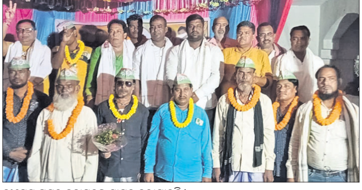
କଂଗ୍ରେସ ପକ୍ଷରୁ ନବାଗତଙ୍କୁ ସ୍ୱାଗତ କରାଯାଇଛି।

ଭୁବନେଶ୍ୱର, ୨୮୯(ପି.ପି.) ରାଜ୍ୟର ଚିଲିକା ବିଧାନ ସଭାକୁ ଛାଡ଼ି କଂଗ୍ରେସରେ ୬୪ ପରିବାର ପୂର୍ବତନ ଚିଲିକା ବିଧାନସଭା ଗଢ଼ିବୁ ଅଣ୍ଡାମାଡ଼। ଏହା ପୂର୍ବରୁ ସେ ଗଡ଼ ଅଗଷ୍ଟରେ ଆଲୋଚନା କରିଛନ୍ତି। ଏହା ପୂର୍ବରୁ ସେ ଗଡ଼ ଅଗଷ୍ଟରେ ଆଲୋଚନା କରିଛନ୍ତି।