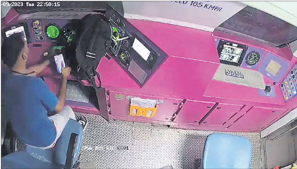
କର୍ମଚାରୀଙ୍କ ଦାୟିତ୍ୱହୀନତା ଯୋଗୁ ମଥୁରା ଷ୍ଟେସନରେ ମଙ୍ଗଳବାର ଲାଇନ୍‌ରୁ ଥୋଇଥିବା ଟ୍ରେନ୍‌ର ଭିଡ଼ିଓ ଗୁରୁବାର ଭାଇରାଲ ହୋଇଛି।

ପୋଲିଗନ୍ତୁ ଚାଲିଯାଇଥିଲା। ଫଳରେ ଟ୍ରେନ୍ ଡ୍ରାଉର୍ ଆଡ଼କୁ ମାଡ଼ିଯାଇଥିଲା। ଟ୍ରେନ୍ ଆଗକୁ ବଢ଼ିବା ସହ ଡେଇଁ ଏକ୍ସକୁ ଭାଇ ଏହାର କିଛି ଅଂଶ ଡ୍ରାଉର୍‌ଙ୍କୁ