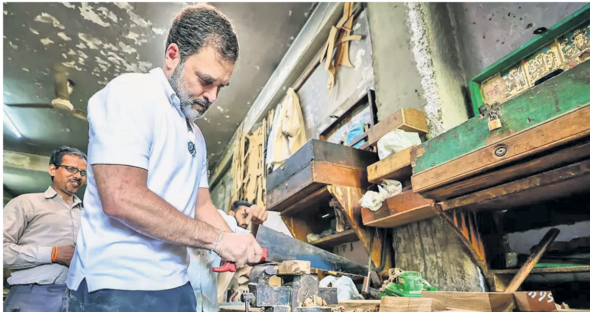
ଦିଲ୍ କାର୍ଯ୍ୟକାରୀ ଫର୍ମରେ ମାକେଟରେ କାଠକାମ କରୁଛନ୍ତି ରାହୁଲ ଗାନ୍ଧୀ