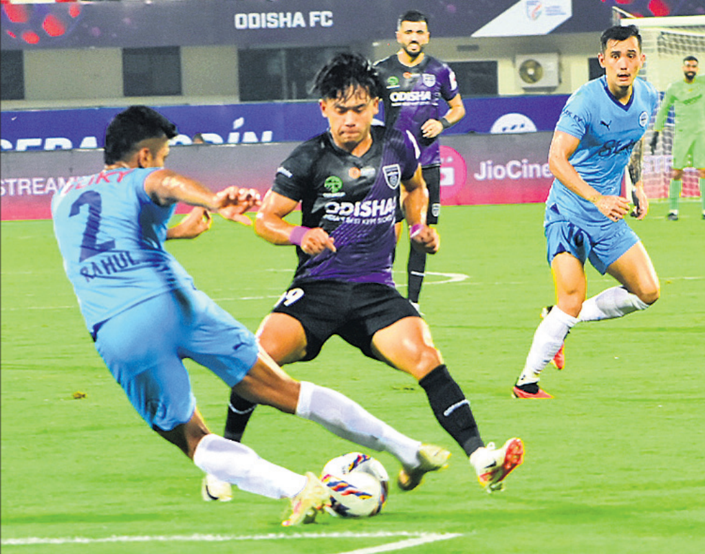
କଳିଙ୍ଗ ଷ୍ଟାଡିୟମରେ ଗୁରୁବାର ଓଡ଼ିଶା ଏଫସି ଓ ମୁମ୍ବାଇ ସିଟି ଏଫସି ମଧ୍ୟରେ ଅନୁଷ୍ଠିତ ଆଇଏସଏଲ୍ ମ୍ୟାଚ।

ଭାରତୀୟ ବିଶ୍ୱକପ୍ ଦଳ ରୋହତ ଶର୍ମା (ଅଧିନାୟକ), ହାର୍ଦ୍ଦିକ ପାଣ୍ଡ୍ୟ (ଉପଅଧିନାୟକ), ଶବମନ ରିଲ, ବିରାଟ କୋହଲି, ଶ୍ରେୟସ୍ ଅୟର, କେ.ଏଲ୍ ରାହୁଲ, ରବୀନ୍ଦ୍ର ଜାଡେଜା, ଶାର୍ଦ୍ଦୂଳ ଠାକୁର, ଯଶପ୍ରୀତ ବୁମରା, ମହମ୍ମଦ ସିରାଜ, କୁଲଦୀପ ଯାଦବ, ମହମ୍ମଦ ଶାମି, ରବିଚନ୍ଦ୍ର ଅଶ୍ୱିନ, ଇଶାନ କିଶନ, ସୂର୍ଯ୍ୟକ୍ୟୁମାର ଯାଦବ।