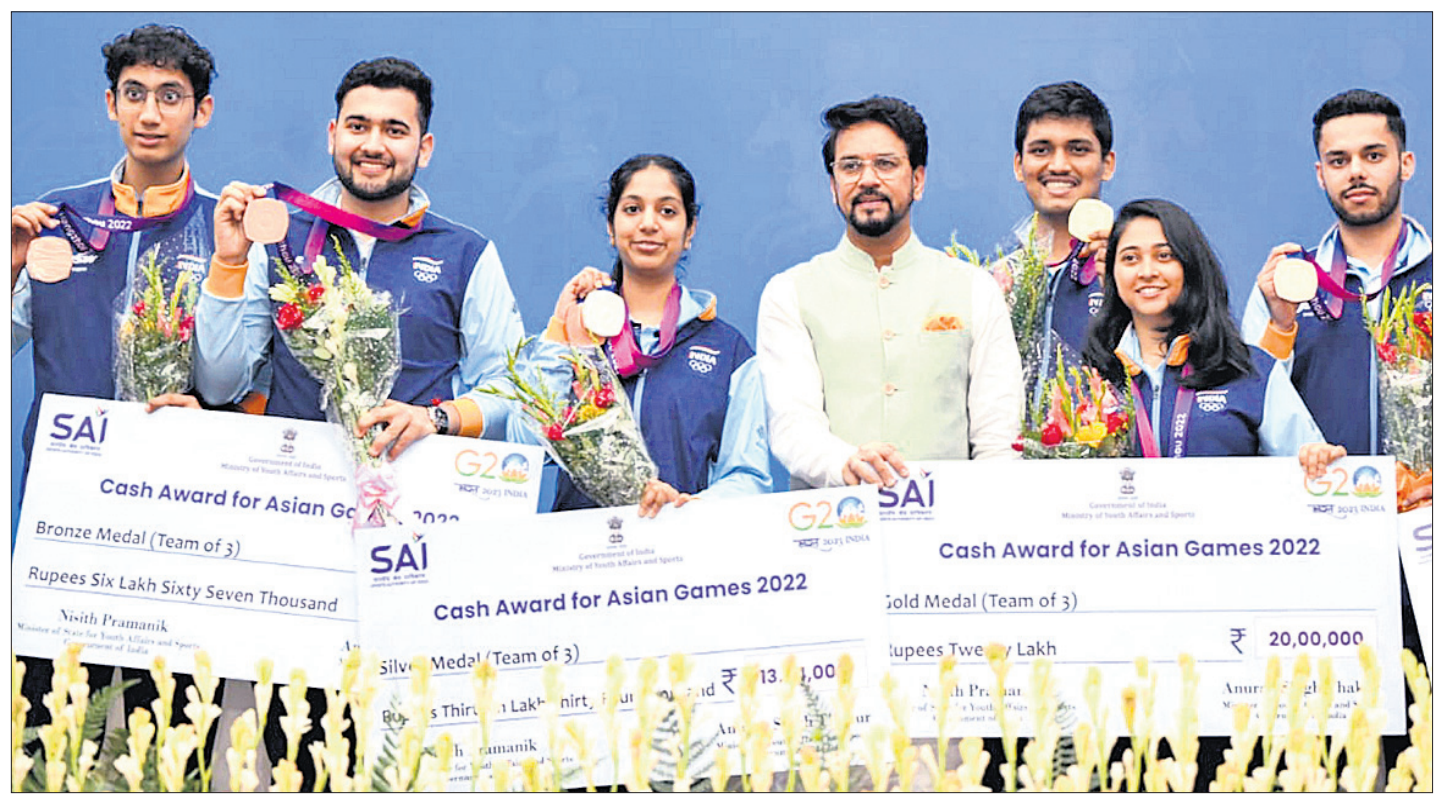
ଏସିଆନ ଗେମ୍ସ୍ରେ ପଦକ ଜିତି ଭାରତ ପ୍ରତ୍ୟାବର୍ତ୍ତନ କରିଥିବା ଜ୍ରାଡ଼ାବିଚ୍ଛୁ କେନ୍ଦ୍ର ଜ୍ରାଡ଼ାମନ୍ତ୍ରୀ ଅନୁରାଗ ଠାକୁର ଗୁରୁବାର ମୁକାବିଲାରେ ସମ୍ପର୍କିତ କରୁଛନ୍ତି।