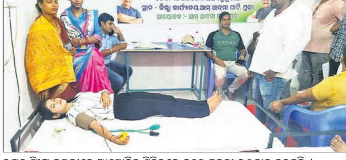
ଭଗତ ସିଂଙ୍କ ଜୟନ୍ତୀରେ ଆୟୋଜିତ ଶିବିରରେ କଣେ ଯୁବକ ରକ୍ତଦାନ କରୁଛନ୍ତି ।