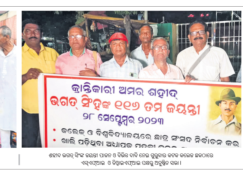
ଶହାଦ ଭଗତ୍ ସିଂହଙ୍କ ଜୟନ୍ତୀ ପାଳନ ଓ ବିଭିନ୍ନ ବାଦି ନେଇ ଗୁରୁବାର କଟକ କଲେଜ ଛକଠାରେ ଏସ୍‌ଏସ୍‌ଜି ଓ ବିଭିନ୍ନ ଏସ୍‌ଏସ୍‌ଜି ପକ୍ଷରୁ ଅନୁଷ୍ଠିତ ସଭା।