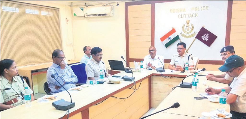
କାର୍ଯ୍ୟକ୍ରମରେ ଚିଲାପାଳ ଭବାନୀ ଶଙ୍କର ଚନ୍ଦ୍ରନାକ ସମେତ ବରିଷ୍ଠ ପୋଲିସ ଅଧିକାରୀ।