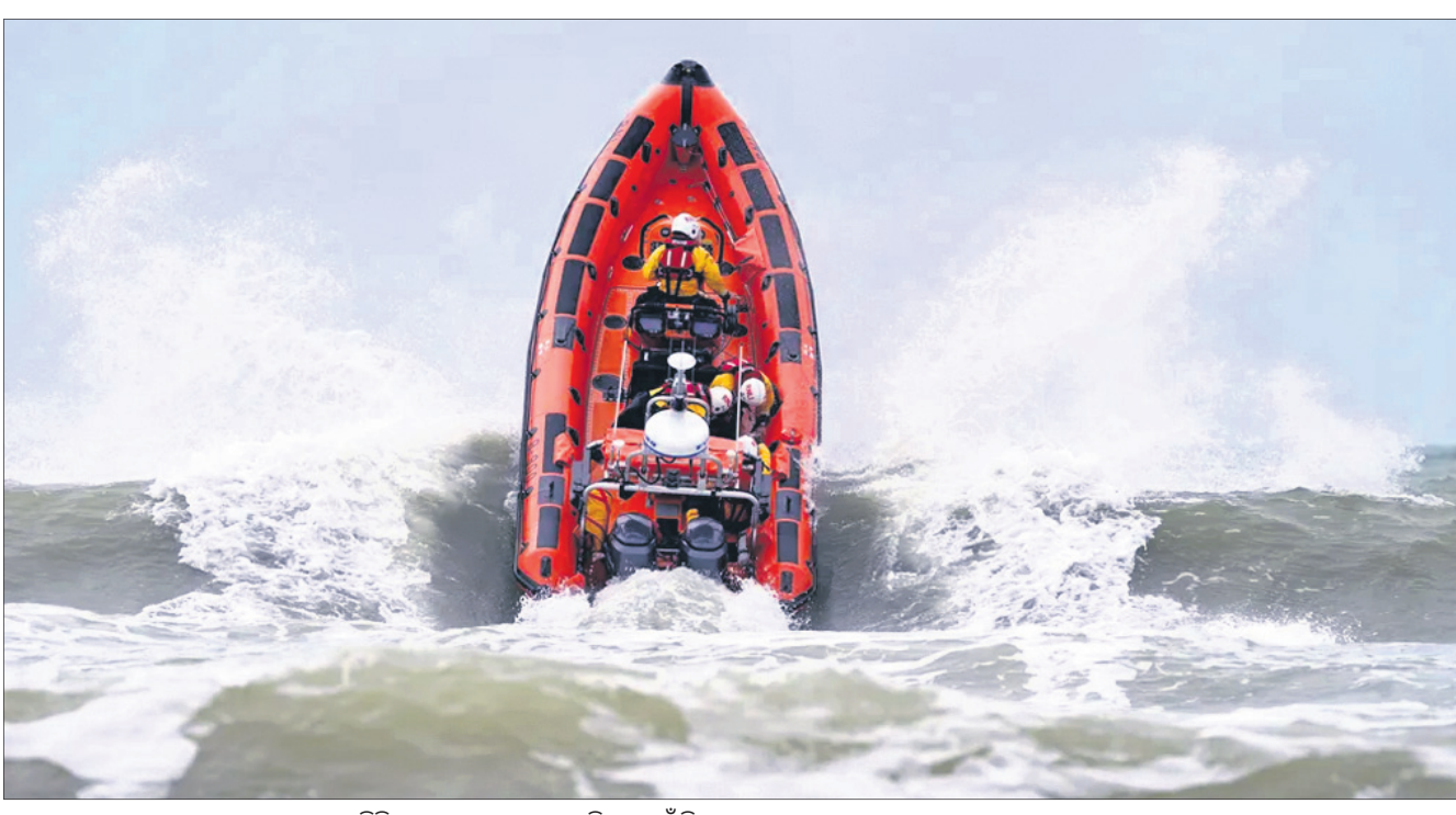
କରୁରା ଛିଟିରେ ଲୋକଙ୍କୁ ଉଦ୍ଧାର କରିବା ପାଇଁ ବ୍ରିଟେନର ଇଷ୍ଟ ସେକ୍ଟରରେ ରୟାଲ୍ ନ୍ୟାଶନାଲ୍ ଲାଇଫ୍‌ବୋଟ୍ ଇନ୍‌ଷ୍ଟିଚ୍ୟୁଶନ୍ ପକ୍ଷରୁ ଅଭ୍ୟାସ ଚାଳିଥିବାବେଳେ ସମୁଦ୍ର ଭେର ଭାଙ୍ଗି ଆଗକୁ ବଢ଼ିଛି ଏକ ବୋଟ୍।