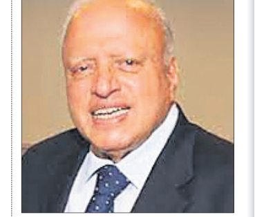
ଏମ୍‌ଏସ୍‌ ସ୍ୱାମୀନାଥନ୍ ନୂଆଦିଲ୍ଲୀ, ୨୮ତା