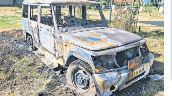
ଇମ୍ପାଲ୍ ଷ୍ଟେଟ୍ ଜିଲ୍ଲାରେ କୁଜି ଢୋ ଉଗ୍ରପଟ୍ଟାମାନେ ଏକ ଗାଡ଼ିକୁ ଜାଳିଦେଇଛନ୍ତି।

■ ଦିଲ୍ଲୀରେ ତେରା ପକାଇଛନ୍ତି ୨୦ ବିଧାୟକ ■ ହତ୍ୟାକାରୀଙ୍କ ବିରୋଧରେ କାର୍ଯ୍ୟାନୁଷ୍ଠାନ ଦାବି