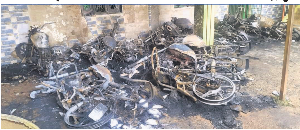
ଦୁର୍ଭିତ୍ତମାନେ ପୋଡ଼ିଦେଇଥିବା ପାଇନାସ୍ କର୍ମଚାରୀଙ୍କ ଗାଡ଼ି ।

ଭିକିରି, ୨୮।୯ (ପ୍ରଫୁଲ୍ଲ କୁମାର ବେହେରା) ଏକ ଘରୋଇ ପାଇନାସ୍ କମ୍ପାନୀ ଅଫିସ୍ ସମ୍ପୂର୍ଣ୍ଣରୂପେ ଥିବା କର୍ମଚାରୀଙ୍କ ୧୨ଟି ବାଇକ୍‌ରେ ନିଆଁ ଲାଗାଇ ପୋଡ଼ିଦେଇଛନ୍ତି ଦୁର୍ଭିତ୍ତ। ରାୟଗଡ଼ା ଜିଲ୍ଲା କାଶୀପୁର ବ୍ଲକ୍ ଭିକିରି ଅଞ୍ଚଳରେ ରୁଧିରାଜ ବିଳାସିତ ରାତିରେ ଏକକି ଅଧରଣ ଘଟିଛି। ସୌଭାଗ୍ୟବଶତଃ ନିଆଁ ଅଫିସ୍ ଭିତରକୁ ବ୍ୟାପି ନ ଥିବାରୁ ଅଫିସ୍ ଭିତରେ ଥିବା ୫ କର୍ମଚାରୀ ଦୁର୍ଭିତ୍ତଙ୍କୁ ଅନୁକ୍ରମେ ବର୍ତ୍ତିଯାଇଛନ୍ତି। ଏ ନେଇ ସମ୍ପୂର୍ଣ୍ଣ ପାଇନାସ୍ କମ୍ପାନୀ କର୍ତ୍ତୃପକ୍ଷ