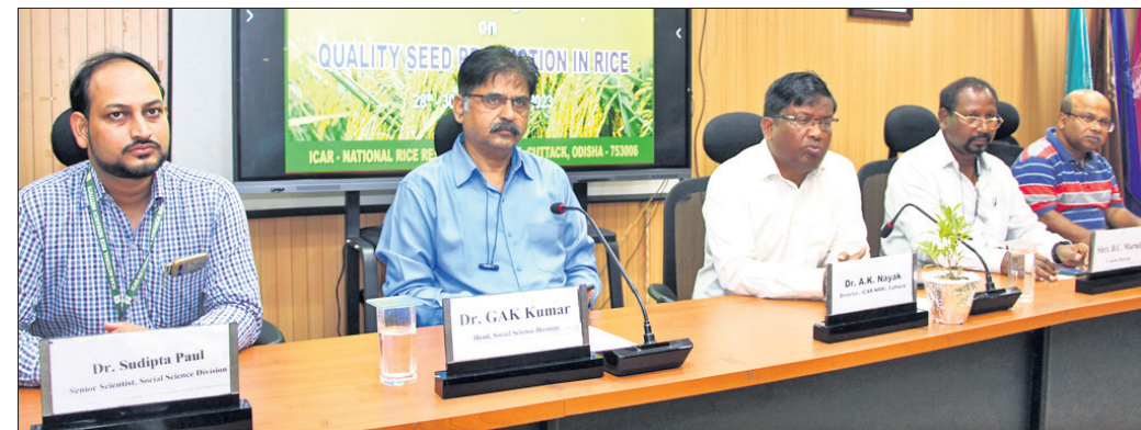
ପ୍ରଶିକ୍ଷଣ କାର୍ଯ୍ୟକ୍ରମରେ ମଞ୍ଚାଧୀନ ଅତିଥିମଣ୍ଡଳ।