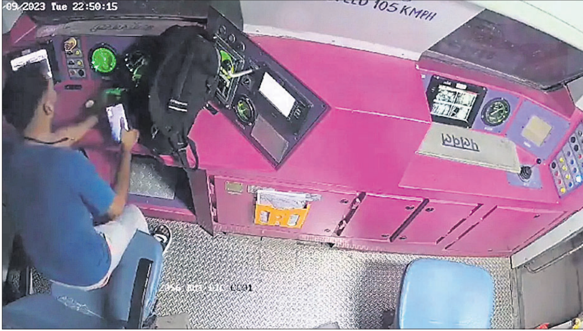
କର୍ମଚାରୀଙ୍କ ଦାୟିତ୍ୱହୀନତା ଯୋଗୁ ମଥୁରା ଷ୍ଟେସନରେ ମଙ୍ଗଳବାର ଲାଇନ୍‌ରୁ ଥୋଇଥିବା ଟ୍ରେନ୍ ଡାଲି ଓ ଗୁରୁବାର ଭାଇରାଲ ହୋଇଛି।

ପୋଲିଗନ୍ତୁ ଚାଲିଯାଇଥିଲା। ଫଳରେ ଟ୍ରେନ୍ ଡାଲି ଆଡ଼କୁ ମାଡ଼ିଯାଇଥିଲା। ଟ୍ରେନ୍ ଆଗକୁ ବଢ଼ିବା ସହ ଡେଇଁ ଏକ୍ସକୁ ଭାଇ ଏହାର କିଛି ଅଂଶ ପୁରୁଥିଲା।