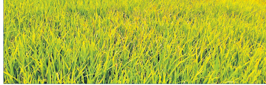
ପାଟଣା, ୨୮।୯ (ବୀରକିଶୋର ଦାଶ)

କେନ୍ଦୁଝର ଜିଲ୍ଲା ପାଟଣା ବ୍ଲକ୍ ଅଞ୍ଚଳରେ ଚଳିତ ବର୍ଷ ଖିରିଫ ରତୁ ଧାନବାସ ଆରମ୍ଭରେ ସ୍ୱଳ୍ପ ବୃଦ୍ଧିପାତ ଯୋଗୁ ଗଣ ପଛେଇଯାଇଥିଲା। ଏବେ ଧାନ ପୁଲ ଧରିବା ପୂର୍ବରୁ ଚକଡ଼ାପୋକ/ମାଟିଆରୁଣ୍ଡି ପୋକ ଲାଗିବାକୁ ଚାଷୀଙ୍କ ଚିନ୍ତା ବଢ଼ିଯାଇଛି। ଧାନର ଗର୍ଭ ଅବସ୍ଥାରେ ଏହି ପୋକ ଲାଗିବାକୁ ମଜା ମଳା ପୋଡ଼ିଯାଇଛି। ପାଟଣା ବ୍ଲକ୍‌ର ବୁଢ଼ା କାପୁଡ଼ି, ତେଣୁଆ,