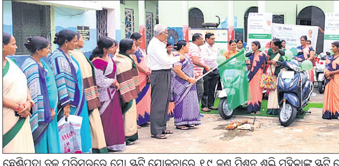
ଛେଣ୍ଡିପଦା ବ୍ଲକ ପରିସରରେ ମୋ ସୁଟି ଯୋଜନାରେ ୧୯ ଜଣ ମିଶନ ଶକ୍ତି ମହିଳାଙ୍କୁ ସୁଟି ଯୋଗାଣ ଦିଆଯାଇଛି।