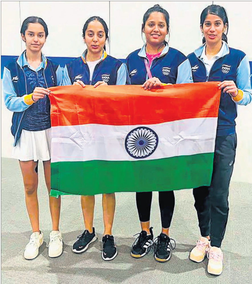
ଗ୍ରୋଜି ପଦକ ବିଜୟୀ ଭାରତୀୟ ମହିଳା ସ୍କ୍ୱାଶ୍ ଦଳ।

ହାଇଡ୍ରୋଜେନ(ପି.ଟି.) ଏସିଆନ ଗେମ୍ସରେ ଭାରତୀୟ ମହିଳା ସ୍କ୍ୱାଶ୍ ଦଳ ଗ୍ରୋଜି ପଦକରେ ସମୃଦ୍ଧ ହୋଇଛି। ଚେନ୍ନାଇ ପ୍ରତିଯୋଗିତାରେ ପ୍ରବେଶ କରି ସ୍ୱର୍ଣ୍ଣ ପଦକ ଆଶା ଉଠାଇ କରୁଥିବା ଶୁକ୍ରବାର ଅନୁଷ୍ଠିତ ପୁରୁଷ ବର୍ଗ ସେମିଫାଇନାଲରେ ସୌରଭ ଘୋଷାଳ ଓ ଅଭୟ ସିଂଲ୍ଲୁ ନେଇ ଗଠିତ ଭାରତୀୟ ଦଳ ତିନୋଟି ଚାମ୍ପିୟନ ମାଲେସିଆକୁ ପରାସ୍ତ କରିଛି। ଫାଇନାଲରେ