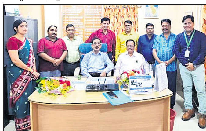
ଅନୁଗୋଳର ନୂଆ ଓ ବିଦାୟା ଜିଲ୍ଲା ମୁଖ୍ୟ ଚିକିତ୍ସା ଅଧିକାରୀଙ୍କୁ ସମ୍ବର୍ଦ୍ଧନା ଦିଆଯାଇଛି।