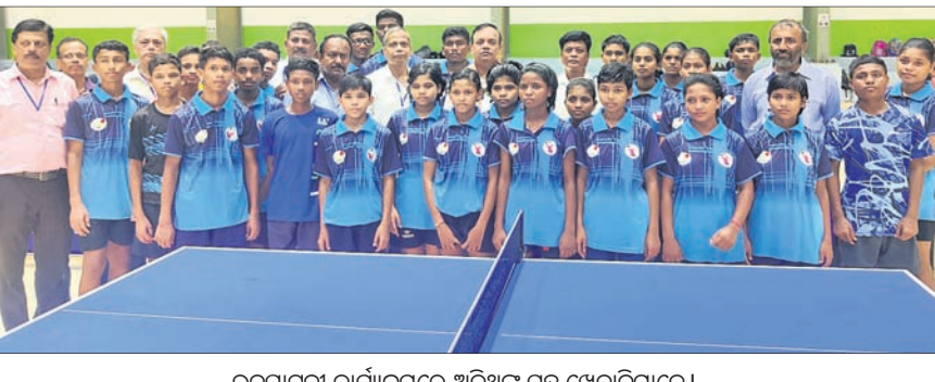
ଉଦ୍‌ଯାପନା କାର୍ଯ୍ୟକ୍ରମରେ ଅତିଥିଙ୍କ ସହ ଖେଳାଳିମାନେ।

ଭୁବନେଶ୍ୱର, ୨୯୯ (ତପନ ସାଲ୍) ଖୋର୍ଦ୍ଧାଜିଲା ଚେନ୍ନାଇ ଚେନିସ ଆସୋସିଏଶନ ଆନୁକୁଲ୍ୟରେ ରାଜ୍ୟ ର୍ୟାକିଙ୍ଗ୍ ଚେନ୍ନାଇ ଚେନିସ ଚାମ୍ପିୟନଶିପ୍ ଶୁକ୍ରବାର କିଙ୍ଗ୍ ବିଶ୍ୱବିଦ୍ୟାଳୟ ପରିସରରେଥିବା ବିଜୁ ପଟ୍ଟନାୟକ ଇନ୍ଦିରା ସ୍ମୃତିମନ୍ଦିରରେ ଆରମ୍ଭ ହୋଇଛି। ଅଭ୍ୟାସ ୨ ପର୍ଯ୍ୟନ୍ତ ଚାଲିବାକୁଥିବା ଏହି ପ୍ରତିଯୋଗିତାରେ ରାଜ୍ୟର ପାଠ୍ୟପାଠ୍ୟ ୨୫୦ ଖେଳାଳି ଅଂଶଗ୍ରହଣ କରିଛନ୍ତି। ପ୍ରତିଯୋଗିତା ୧୧, ୧୩, ୧୫, ୧୭ ଓ ୧୯ ବର୍ଷରୁ କମ୍ ବୟସ ବର୍ଗରେ ବାଳିକା ଓ ବାଳକ,