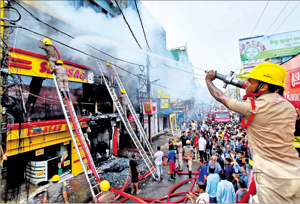
କଟକ ଚୌଧୁରୀବାବୁଠାରେ ଥିବା ଶାଢ଼ି ଶୋ'ରୁମ୍ରେ ଶୁକ୍ରବାର ଲାଗିଥିବା ନିଆଁକୁ ଅଗ୍ନିଶମ କର୍ମଚାରୀ ଲିଭାଇଛନ୍ତି।

ନୂଆଦିଲ୍ଲୀ, ୨୯/୯ ରାଷ୍ଟ୍ରପତି ଦ୍ରୌପଦୀ ମୂର୍ତ୍ତି ଶୁକ୍ରବାର ନୂଆ ମହିଳା ସଂରକ୍ଷଣ ବିଲ୍ରେ ସ୍ୱାକ୍ଷର କରିଛନ୍ତି। ଫଳରେ ଏହା ଏବେ ଆଇନରେ ପରିଣତ ହୋଇଛି। ଏହି ଆଇନ ବଳରେ ଲୋକ ସଭା ଓ ରାଜ୍ୟ ବିଧାନସଭାଗୁଡ଼ିକରେ ମହିଳାମାନଙ୍କୁ ୩୩% ଆସନ ସଂରକ୍ଷଣ ପ୍ରଦାନ ହେବ। ସଂସଦର ସ୍ୱତନ୍ତ୍ର ଅଧିବେଶନରେ ସରକାରଙ୍କ ପକ୍ଷରୁ ଆଇନମନ୍ତ୍ରୀ ଅର୍ଜୁନରାମ ମେଘାସିନି ସମିଧାନ ସଂଶୋଧନ ବିଲ୍ ଆଗତ କରିଥିଲେ। ଲୋକ ସଭାରେ ଏଆଇଏମଆଇଏମ୍ ୨ ସଦସ୍ୟଙ୍କୁ ଛାଡ଼ିଦେଲେ ସମସ୍ତ ସଦସ୍ୟ ଏହାକୁ ସମର୍ଥନ କରିଥିଲେ। ରାଜ୍ୟ ସଭାରେ ସର୍ବସମ୍ମତକ୍ରମେ ବିଲ୍ ପାରିତ ହୋଇଥିଲା। ଗୁରୁବାର ରାଜ୍ୟ ସଭା ଅଧିକ ତଥା ଉପରାଷ୍ଟ୍ରପତିଙ୍କଦ୍ୱାରା ପନକର ଏହା ଉପରେ ସ୍ୱାକ୍ଷର କରିଥିଲେ। ଏହା ପରେ ନାରୀଶକ୍ତି ବନ୍ଦନ ଅଧିନିୟମ, ୨୦୨୩କୁ ରାଷ୍ଟ୍ରପତିଙ୍କ ନିକଟକୁ ଅନୁମୋଦନ ପାଇ ପଠାଯାଇଥିଲା। ପରବର୍ତ୍ତୀ ଜନଗଣନା ଏବଂ ଲୋକ ସଭା ଓ ବିଧାନସଭା ନିର୍ବାଚନକ୍ରମାଗୁଡ଼ିକର ସାମା ପୁନଃ ନିର୍ଦ୍ଧାରଣ ପ୍ରକ୍ରିୟା ବେଳେ କେଉଁ ଆସନ ମହିଳା ପ୍ରାର୍ଥୀମାନଙ୍କୁ ଦିଆଯିବ।