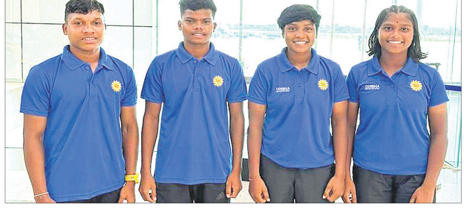
ଭାରତୀୟ ଦଳରେ ସାମିଲ ହୋଇଥିବା କିଙ୍ଗ୍ ଖେଳାଳି।