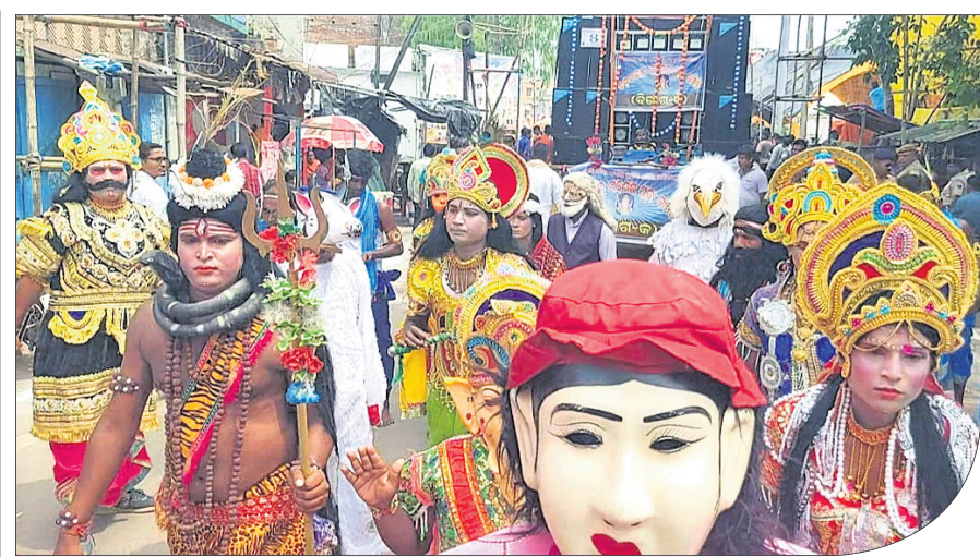
ଡାଳଚେରର ଗଣପର୍ବ ଗଣେଶ ପୂଜା ଅବସରରେ ଅନୁଷ୍ଠିତ ଭସାଣି ଗୋଭାପାତ୍ର ବେଳେ ରାଜ୍ୟ ବାହାରୁ ଆସିଥିବା ବିଭିନ୍ନ କଳାକାର ଦଳ ସାଂସ୍କୃତିକ କାର୍ଯ୍ୟକ୍ରମ ପରିବେଷଣ କରୁଛନ୍ତି।