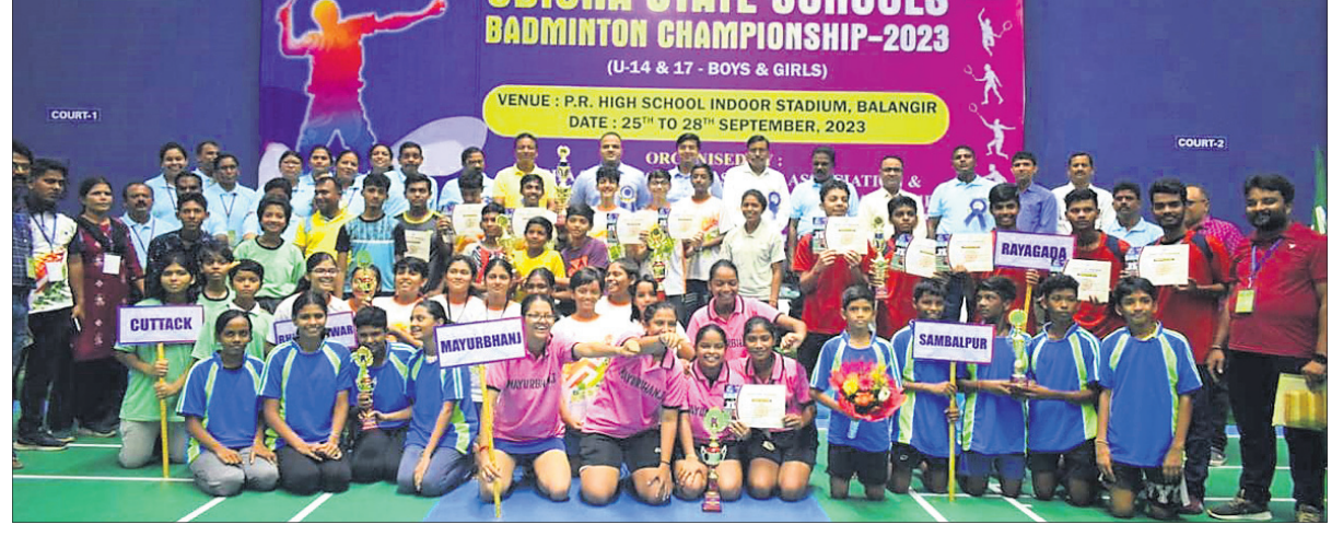
କୃପା ପ୍ରତିଯୋଗୀଙ୍କ ସହ ଉଦ୍‌ଯାପନା ଉତ୍ସବର ଅତିଥି ଓ ଆୟୋଜକ।