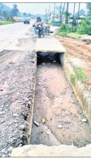
ଆରମ୍ଭ କରାଯାଇଥିଲେ ମଧ୍ୟ ଏହା ସମ୍ପୂର୍ଣ୍ଣ ହୋଇପାରିନାହିଁ। ଅନେକ ଅଞ୍ଚଳରେ

କିଶୋରନଗର ବ୍ଲକ ବଲଶା ଛକ, କଦଳୀପୁରୀ, ନନ୍ଦପୁରୀ, ଶରଧାପୁରୀ ଅଞ୍ଚଳରେ ଡ୍ରେନ୍ କାର୍ଯ୍ୟ ସରୁନାହିଁ। ଠିକାସଂସ୍ଥା ପକ୍ଷରୁ କାମ ସମାପ୍ତ କରାଯାଇ ନ ଥିବାରୁ ଏହାକୁ ନେଇ ଗ୍ରାମବାସୀ ଚିତ୍ତାରେ ପଡ଼ିଛନ୍ତି। ବାରମ୍ବାର ବଲଶା ଗ୍ରାମବାସୀ ରାସ୍ତା କାମ କରୁଥିବା ଠିକାସଂସ୍ଥାକୁ ଅଭିଯୋଗ କଲେ ମଧ୍ୟ କୌଣସି ସୁଫଳ ମିଳୁନାହିଁ। ଏ ନେଇ ଶୁକ୍ରବାର କଦଳୀପୁରୀ ଗ୍ରାମବାସୀ ଅନୁଗୋଳ ଜିଲାପାଳଙ୍କୁ ଏକ ଅଭିଯୋଗପତ୍ର ମାଧ୍ୟମରେ ଅବଗତ କରାଯାଇଛି। ଗ୍ରାମବାସୀ କହିଛନ୍ତି, ୨୦୨୦ ମସିହାକୁ ବଲଶା ଅଞ୍ଚଳରେ ଡ୍ରେନ୍ କାମ