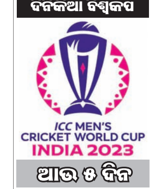
ଆଉ ଓ ଦିନ

ନିଜକୁ ପରଖି ପାରିବେ। ବ୍ୟାଟିଂ ଦୃଢ଼ତା ହେଉଛି ଇଂଲଣ୍ଡର ମୁଖ୍ୟ ଶକ୍ତି। ସାମ୍ କୁରାନ ଗ୍ରୀ ନମ୍ବରରେ ଏବଂ ଲିସ୍ଟିରେ ଭାରତୀୟ ବୋଲରଙ୍କୁ ଧିରେକ କରି ଟେଷ୍ଟ ଶତକ ହାସଲ କରିଥିବା କ୍ରିସ୍ ଫୁଲ୍ ୯ ନମ୍ବରରେ ବ୍ୟାଟିଂ କରିବାକୁ ଆସିବେ। ଏହି ଖେଳାଳିଙ୍କ ଉପସ୍ଥିତି ଦଳକୁ ବେଶ୍ ସକ୍ରିୟ କରିଛି। ବିଶ୍ୱକପରେ ଭାରତ ଶ୍ରେୟ ଆୟରଙ୍କୁ ନା ଇଶାନ କିଶନଙ୍କୁ ନେଇ ଖେଳିବ ଏହାକୁ ନେଇ ବିତର୍କ ଲାଗି ରହିଛି। ଆୟର ମିଲି ଓଭର ଗୁଡ଼ିକରେ ସ୍ପିନ୍ ବୋଲିଂକୁ ସଫଳତାର ସହ ପ୍ରକାଶିଲା କରି ଦିନିକିଆ ଇନିଂସ ରଢ଼ିବାରେ ସାହାଯ୍ୟ। ତାଙ୍କ ରେକର୍ଡ୍ ମଧ୍ୟ ଭଲ ଅଛି। ତେଣୁ ସେ ଦୁଇଟି ଇଲେଭେନରେ ରହିବାରେ ଅସୁବିଧା ନାହିଁ। ତେବେ ତାଙ୍କ ଇଣ୍ଡିଆ ସମୟରେ କିଶନ ପ୍ରତି ପୋକିଶନରେ ନିଜକୁ ପ୍ରମାଣିତ କରିଛନ୍ତି। ଏହା ବାମହାତୀ ବ୍ୟାଟର ମିଲିଥିବା ପ୍ରତି ସୁଯୋଗର ସବୁପଯୋଗ ମଧ୍ୟ କରିଛନ୍ତି। ମ୍ୟାଚ ଆରମ୍ଭ: ଅସରାହ୍ନ ୭ଟା