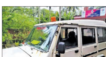
ଅପ୍ରଭା କୁଳ ୧୫ଟି ପଞ୍ଚାୟତକୁ ନେଇ ଗଠିତ । ଏହି କୁଳରେ ଆଇନଶୁଖିଳା ନିୟନ୍ତ୍ରଣ ସହ ଉପକୂଳ ଅଞ୍ଚଳ ସୁରକ୍ଷା ପାଇଁ ଅପ୍ରଭା ଥାନା ଓ ନୂଆଗଡ଼ ସାମୁଦ୍ରିକ ଥାନା ରହିଛି ।