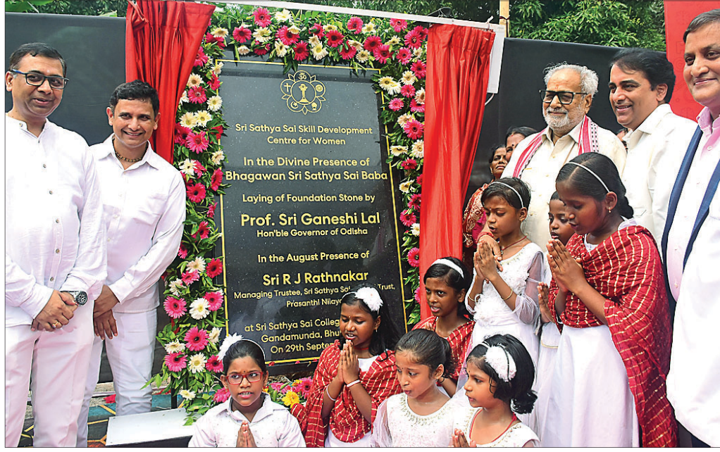
ସତ୍ୟବାଇ ଦକ୍ଷତା ବିକାଶ କେନ୍ଦ୍ରର ଭିତ୍ତିପଥର ସ୍ଥାପନ ଅବସରରେ ରାଜ୍ୟପାଳ ପ୍ରଫେସର ଗଣେଶୀ ଲାଲ୍ ଓ ଅନ୍ୟମାନେ।

ବଡ଼ ହାଟ ହେଉଛି ଯୁନିଟ୍-୧ ହାଟ। ବିଶେଷକରି ଏଠାରେ କମ୍ ଦାମରେ ସବୁ ପ୍ରକାର ଜିନିଷ ମିଳୁଥିବାରୁ ରାଜଧାନୀ ସମୟରେ କାହିଁ କେତେ ଦୂରକୁ ପ୍ରତିଦିନ ହଜାର ହଜାର ଲୋକ ଏଠାକୁ ଆସିଥାନ୍ତି।