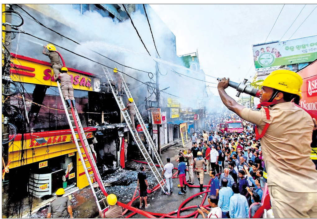
କଟକ ଚୌଧୁରୀବାବୁରାଠାରେ ଥିବା ଶାଢ଼ି ଶୋ'ରୁମ୍ରେ ଶୁକ୍ରବାର ଲାଗିଥିବା ନିଆଁକୁ ଅଗ୍ନିଶମ କର୍ମଚାରୀ ଲିଭାଇଛନ୍ତି।

ନୂଆଦିଲ୍ଲୀ, ୨୯/୯ ରାଷ୍ଟ୍ରପତି ଦ୍ରୌପଦୀ ମୂର୍ତ୍ତି ଶୁକ୍ରବାର ନୂଆ ମହିଳା ସଂରକ୍ଷଣ ବିଲ୍ରେ ସ୍ୱାକ୍ଷର କରିଛନ୍ତି। ଫଳରେ ଏହା ଏବେ ଆଇନରେ ପରିଣତ ହୋଇଛି। ଏହି ଆଇନ ବଳରେ ଲୋକ ସଭା ଓ ରାଜ୍ୟ ବିଧାନସଭାଗୁଡ଼ିକରେ ମହିଳାମାନଙ୍କୁ ୩୩% ଆସନ ସଂରକ୍ଷଣ ପ୍ରଦାନ ବୁଦ୍ଧି ରହିଛି। ସଂସଦର ସ୍ୱତନ୍ତ୍ର ଅଧିବେଶନରେ ସରକାରଙ୍କ ପକ୍ଷରୁ ଆଇନମନ୍ତ୍ରୀ ଅର୍ଜୁନରାମ ମେଘାଓଲ ସମିଧାନ ସଂଶୋଧନ ବିଲ୍ ଆଗତ କରିଥିଲେ। ଲୋକ ସଭାରେ ଏଆଇଏମଆଇଏମ୍ରେ ୨ ସଦସ୍ୟଙ୍କୁ ଛାଡ଼ିଦେଲେ ସମସ୍ତ ସଦସ୍ୟ ଏହାକୁ ସମର୍ଥନ କରିଥିଲେ। ରାଜ୍ୟ ସଭାରେ ସର୍ବସମ୍ମତରେ ବିଲ୍ ପାରିତ ହୋଇଥିଲା। ଗୁରୁବାର ରାଜ୍ୟ ସଭା ଅଧିକ ତଥା ଉପରାଷ୍ଟ୍ରପତିଙ୍କଦ୍ୱାରା ପନକର ଏହା ଉପରେ ସ୍ୱାକ୍ଷର କରିଥିଲେ। ଏହା ପରେ ନାରୀଶକ୍ତି ବନ୍ଦନ ଅଧିନିୟମ, ୨୦୨୩କୁ ରାଷ୍ଟ୍ରପତିଙ୍କ ନିକଟକୁ ଅନୁମୋଦନ ପାଇ ପଠାଯାଇଥିଲା। ପରବର୍ତ୍ତୀ ଜନଗଣନା ଏବଂ ଲୋକ ସଭା ଓ ବିଧାନସଭା ନିର୍ବାଚନମଣ୍ଡଳଗୁଡ଼ିକର ସୀମା ପୁନଃ ନିର୍ଦ୍ଧାରଣ ପ୍ରକ୍ରିୟା ବେଳେ କେଉଁ ଆସନ ମହିଳା ପ୍ରାର୍ଥୀମାନଙ୍କ ୟୁଟ୍ୟୁ-୨