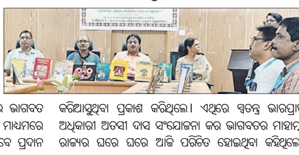
କରିଆସୁଥିବା ପ୍ରକାଶ କରିଥିଲେ। ଏଥିରେ ସ୍ୱତନ୍ତ୍ର ଭାଗପ୍ରାପ୍ତ ଶୁକ୍ଳ ପ୍ରତିଷ୍ଠା ହୋଇ ଭାଗବତ ସହ ମୁଖ୍ୟ ଯାତ୍ରା ମାଧ୍ୟମରେ ଲୋକଙ୍କୁ ଆଧୁନିକ ଚେତନାର ବାର୍ତ୍ତା ନିରତର ଭାବେ ପ୍ରଦାନ କରାଯାଇ ଘରେ ଘରେ ଆଜି ପରିଚିତ ହୋଇଥିବା କହିଥିଲେ।

ଭୁବନେଶ୍ୱର, ୨୯/୯ (ଶର୍ମିଷ୍ଠା ପାଣିଗ୍ରାହୀ) ରାଜ୍ୟ ପ୍ରଶାସନରେ ଶୁକ୍ରବାର ଭାଗବତ ଜନ୍ମ ପାଳିତ ହୋଇଛି। ଏହି ଅବସରରେ ଏକ ସ୍ୱତନ୍ତ୍ର ପୁସ୍ତକ ପ୍ରଦର୍ଶନୀ ଓ ଆଲୋଚନାଚକ୍ର ଅନୁଷ୍ଠିତ ହୋଇଥିଲା।