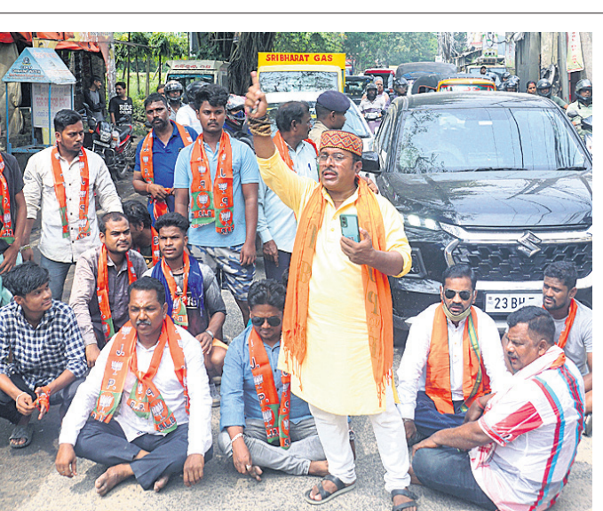
କଟକ ବାଖରାବାଦ ଗଣେଶ ଘାଟ ଅଞ୍ଚଳରେ ରାସ୍ତା ମରାମତି ଦାବିରେ ଶୁକ୍ରବାର ଭାଜପା କଟକ ନଗର ପକ୍ଷରୁ ରାସ୍ତାବନ୍ଦ କରାଯାଇଛି।