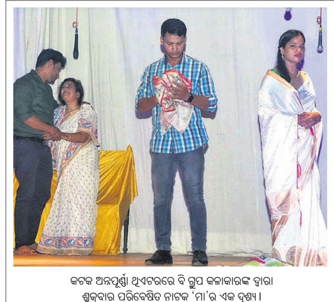
କଟକ ଅନୁଷ୍ଠାନୀୟ ଥିଏଟରରେ ବିଗ୍ରହ କଳାକାରଙ୍କ ଦ୍ୱାରା ଶୁକ୍ରବାର ପରିବେଷିତ ନାଟକ 'ମା'ର ଏକ ଦୃଶ୍ୟ।