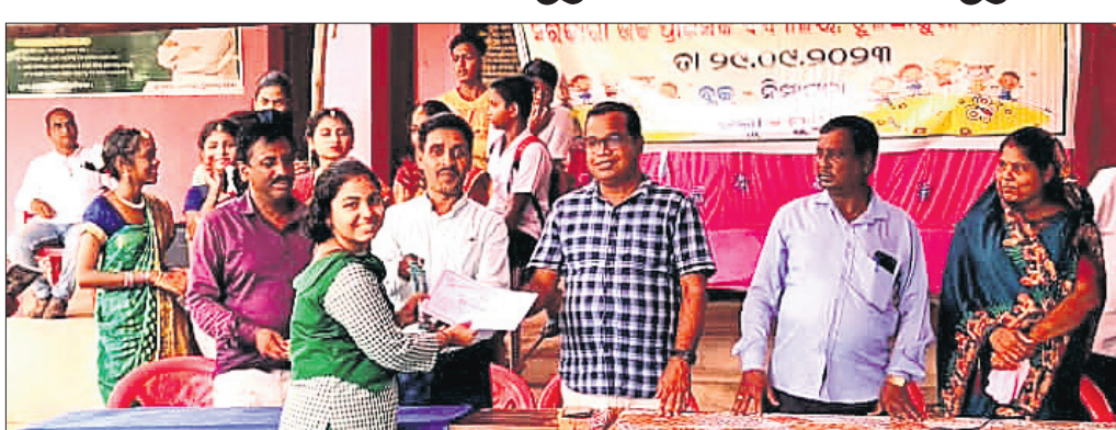
ନିମାପଡ଼ା କୃଷିର ସୁରକ୍ଷା ଶିଶୁ ମହୋତ୍ସବରେ ଅତିଥିମାନେ ଜଣେ କୃତୀ ପ୍ରତିଯୋଗୀଙ୍କୁ ପୁରସ୍କାର ପ୍ରଦାନ କରୁଛନ୍ତି ।