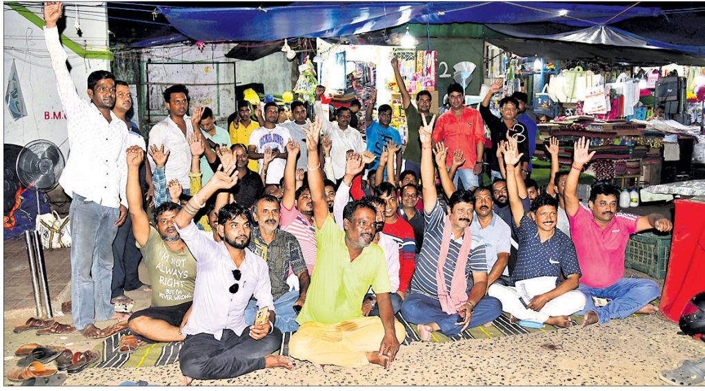
ହାଟ ପରିସରରେ ବ୍ୟବସାୟୀମାନେ ଧାରଣାରେ ବସିଛନ୍ତି।

ରାଜଧାନୀରେ ପୁଣି ପିନ୍ଧା ଚୋର ସକ୍ରିୟ ଘର ଭିତରୁ ମୋବାଇଲ୍, ଦାମୀ ଜିନିଷ ଚୋରି