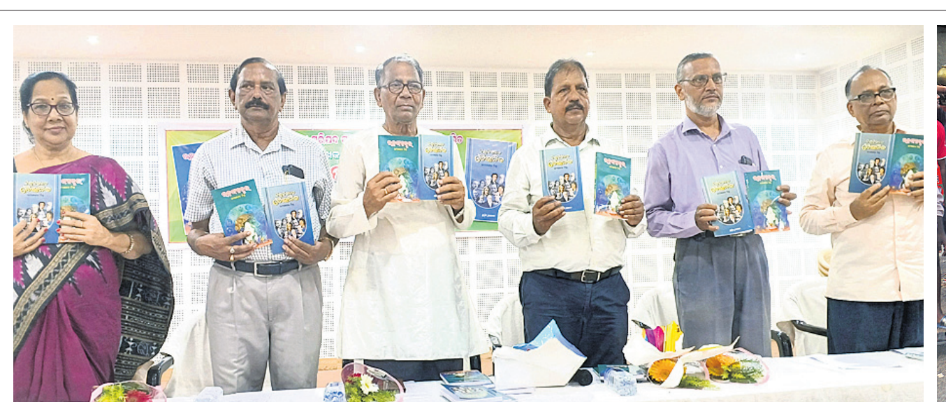
କଟକ ସାରକା ଭବନରେ ଶୁକ୍ରବାର ଲେଖକ ଉପାଦେୟ ପୁସ୍ତକ 'ରହସ୍ୟାବୁର୍ତ୍ତ' ଓ ଜୀବନୀ ପୁସ୍ତକ 'ବିଶ୍ୱବିଖ୍ୟାତ ବୈଜ୍ଞାନିକ'କୁ ଅଭିଯୋଗରେ ଉନ୍ମୋଚନ କରାଯାଇଛି।