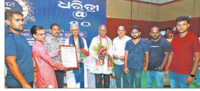
ଓଡ଼ିଶା ପାଠକ ସାମ୍ମୁଖ୍ୟ ଜଗତସିଂହପୁର ଚିଲାରାସ ଶାଖା