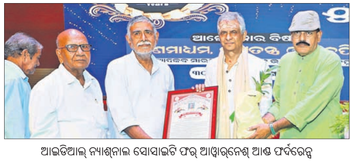
ଆଇଡିଆଲ୍ ନ୍ୟାଶନାଲ୍ ସୋସାଇଟି ଫର୍ ଆଓଏନଏ ଆଣ୍ଡ ଫର୍ଦ୍ଦରେସ୍