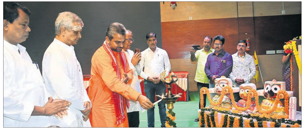
ଧରିତ୍ରୀର ୫୦ ବର୍ଷ ଉପଲକ୍ଷେ ଜଗତସିଂହପୁରସ୍ଥିତ ଆଦିକବି ସାରଳା ଦାସ ସଂସ୍କୃତି ଭବନରେ ଶନିବାର ଆୟୋଜିତ 'ଗଣତନ୍ତ୍ର, ଗଣମାଧ୍ୟମ ଓ ଯୁବପିଢ଼ି' ଶୀର୍ଷକ ଚିଲାରାସର ଆଲୋଚନାଚକ୍ରରେ ଅତିଥିମାନେ ପ୍ରାଥମ ପ୍ରକ୍ଷକନ କରୁଛନ୍ତି।