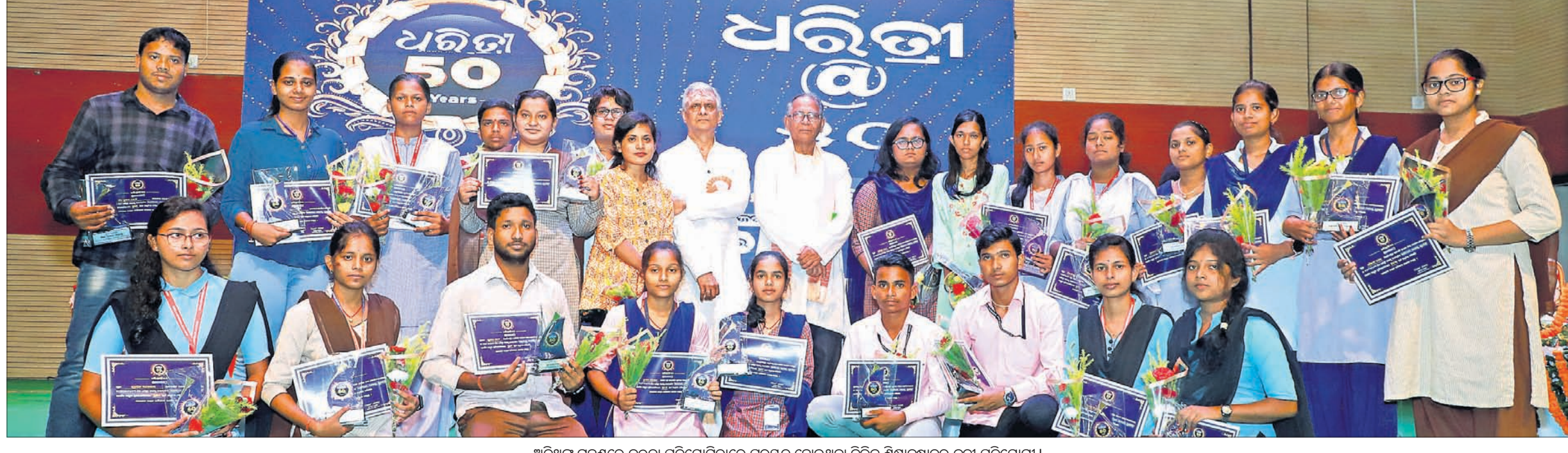
ଅତିଥିକ ଗହଣରେ ବକ୍ତା ପ୍ରତିଯୋଗିତାରେ ପୁରସ୍କୃତ ହୋଇଥିବା ବିଭିନ୍ନ ଶିକ୍ଷାନୁଷ୍ଠାନର କୃତୀ ପ୍ରତିଯୋଗୀ।