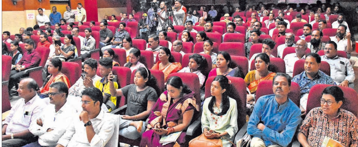
କାର୍ଯ୍ୟକ୍ରମରେ ଯୋଗଦେଇଥିବା ଅତିଥି ଓ ବୁଦ୍ଧିଜୀବୀମାନେ।