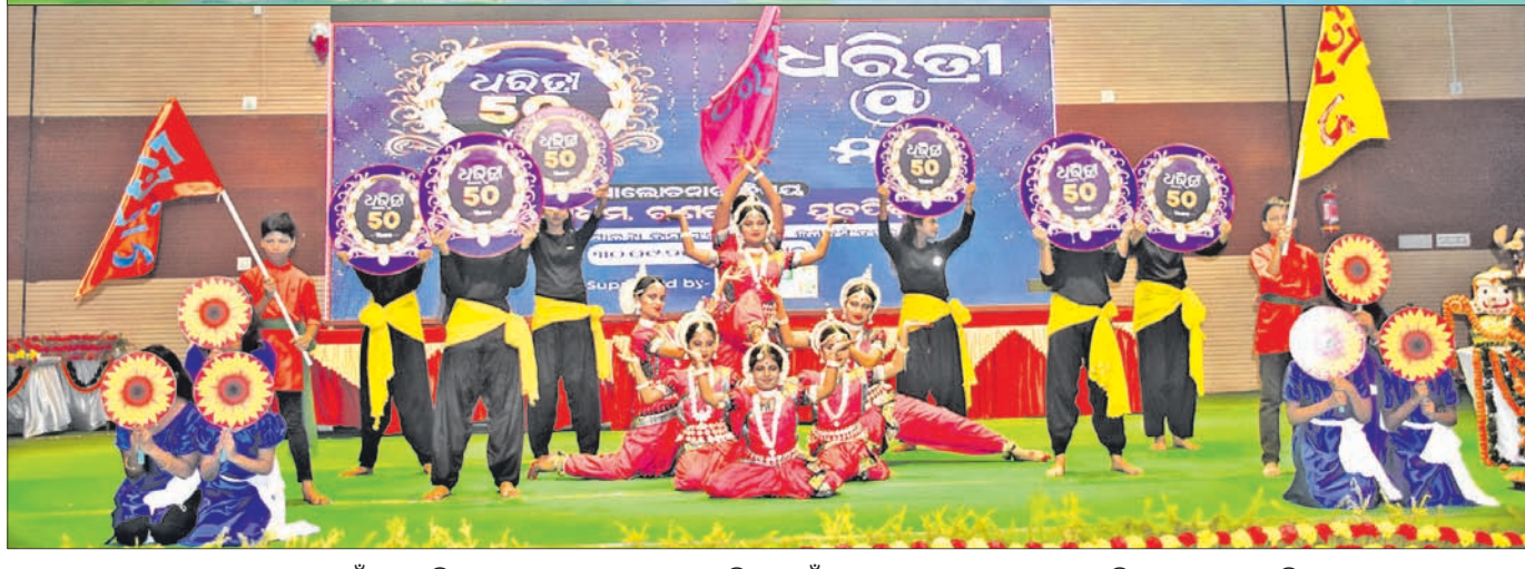
ଭୃଷ୍ଟାଚାରୀ ସାଲ କଳା ପ୍ରତିଷ୍ଠାନର କଳାକାରମାନଙ୍କ ଦ୍ୱାରା ଧରିତ୍ରୀ ପାଇଁ ସ୍ୱତନ୍ତ୍ର ସମ୍ମାନ ଦୃଷ୍ଟି ମାଧ୍ୟମରେ ପରିବେଷଣ କରାଯାଇଛି।