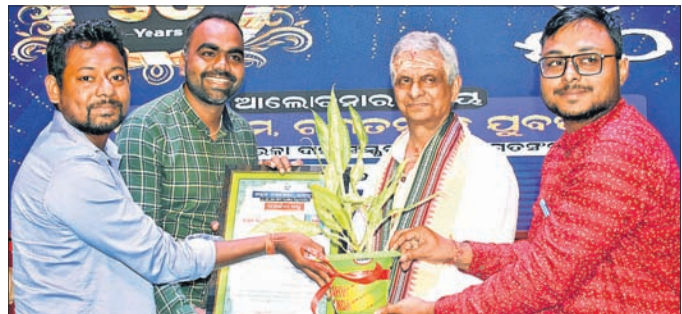
ପାରାଦୀପର ଆହ୍ୱାନ ପାଠକଶେଖର