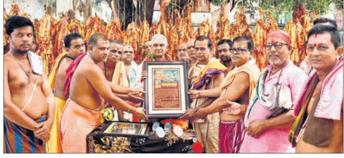
ମା' ଶାରଳା ମନ୍ଦିରର ପଢ଼ା ଓ ସେବାୟତଗଣ