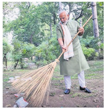
ନୂଆଦିଲ୍ଲୀ, ୧୧୧୦ (ପି.ଟି.)

ସ୍ଵଚ୍ଛତା ସହିତ ଫିଟ୍‌ନେସ୍ ଏବଂ ସୁସ୍ଥତା ଉପରେ ପ୍ରଧାନମନ୍ତ୍ରୀ ଜୋର ଦେଇଥିଲେ। ପ୍ରଧାନମନ୍ତ୍ରୀ ଓ ଦେଘାନପୁରୀୟା ଝାଡୁ ଧରି ଓକାଲବା ସହ ଅଲିଆ ଉଠାଇଥିବା ଭିଡ଼ିଓକୁ ଦେଖିବାକୁ ମିଳିଛି। ପ୍ରଧାନମନ୍ତ୍ରୀ ଏହି ଭିଡ଼ିଓକୁ ଏକ୍ସ୍‌ରେ ପୋଷ୍ଟ କରିଛନ୍ତି। ପ୍ରଧାନମନ୍ତ୍ରୀଙ୍କ ସମେତ କେନ୍ଦ୍ରମନ୍ତ୍ରୀ ଓ ଭାଜପା ନେତାମାନେ ଦେଶର ବିଭିନ୍ନ ସ୍ଥାନରେ ସ୍ଵଚ୍ଛତା କାର୍ଯ୍ୟକ୍ରମରେ ଭାଗ ନେଇଥିଲେ। ସ୍ଵଚ୍ଛତା ଅଭିଯାନରେ ଭାଗ ନେଇଥିଲେ। ସ୍ଵଚ୍ଛତା ଅଭିଯାନରେ ଭାଗ ନେଇଥିଲେ। ସ୍ଵଚ୍ଛତା ଅଭିଯାନରେ ଭାଗ ନେଇଥିଲେ।