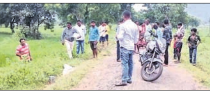
ଘଟଣାସ୍ଥଳରେ ପୋଲିସ୍ ଓ ସାହିକର୍ମିକ ଟ୍ରିପଲ୍ କରୁଛି।

ଅନ୍ୟପଟେ ବୁଦ୍ଧକ ମୃତଦେହ ପଡ଼ିଥିବା ଦେଖିବାକୁ ମିଳିଛି। ଖବର ପାଇ କୁନାଗଡ଼ ପୋଲିସ୍ ଘଟଣାସ୍ଥଳରେ ପହଞ୍ଚି ଛାନ୍ଦିନି ଆରମ୍ଭ କରିଛି। ଉକ୍ତ ଗ୍ରାମରେ ପୋଲିସ୍ ତଦତ୍ତ ଜାରି ରଖିଥିବା ସୂଚନା ମିଳିଛି। ବ୍ରଜ ଜେଲରେ ରହିଥିଲେ ମଧ୍ୟ ଗତ ୪୭୫ ବର୍ଷ ହେଲା ସେ ପାଟଣାଲରେ କିଛି ଦିନ ପାଇଁ ଘରକୁ ଯିବାଆସିବା କରିଆସି। ବ୍ରଜ ହତ୍ୟା କରିଥିବା ତାଙ୍କ