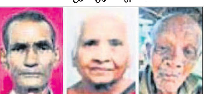
ଶ୍ୟାମଳାଲ ରାୟପୁର, ୧୧୧୦

ଗଣତନ୍ତ୍ର ଭାରତୀୟ ସମ୍ବିଧାନର ମୌଳିକ ଦୈନିକ୍ୟ ରୂପେ ସ୍ଵୀକୃତି ମିଳିଥିଲେ ମଧ୍ୟ ମତଦାନ ଏକ ମୌଳିକ ଅଧିକାର ନୁହେଁ। ଛତିଶଗଡ଼ର ୩ ଜଣ ବରିଷ୍ଠ ନାଗରିକ ଦେଶ ସ୍ଵାଧୀନତା ପୂର୍ବରୁ ଜନ୍ମ ହୋଇଥିଲେ ବି କେବେ ଭୋଟ ଦେଇନାହାନ୍ତି। ଛତିଶଗଡ଼ ବିଧାନସଭା ନିର୍ବାଚନରେ ସେମାନେ ପ୍ରଥମ ଥର ମତଦାନ କରିବାକୁ ଯାଉଛନ୍ତି।