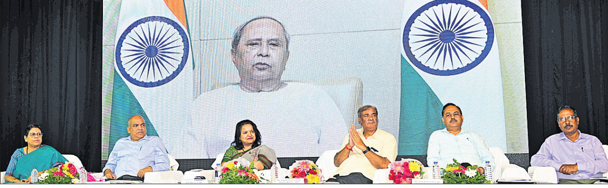
ଅନ୍ତର୍ଜାତୀୟ ବରିଷ୍ଠ ନାଗରିକ ଦିବସ ପାଳନ ଅବସରରେ ପୁଖ୍ୟମନ୍ତ୍ରୀ ନବୀନ ପଟ୍ଟନାୟକ ଭାର୍ତୀୟ ସମାଜରେ ବାରିଷ୍ଠ ନାଗରିକଙ୍କ ପ୍ରତି ଗୌରବ ଦେଖାଇବା ପାଇଁ ଏକ ସମାଜ ପାଳନ କରାଯାଇଥିଲା।