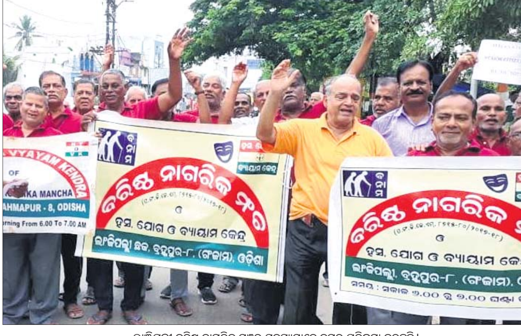
ଲୀଞ୍ଜିପଲୀ ବରିଷ୍ଠ ନାଗରିକ ମଞ୍ଚର ସଦସ୍ୟମାନେ ନଗର ପରିକ୍ରମା କରୁଛନ୍ତି।