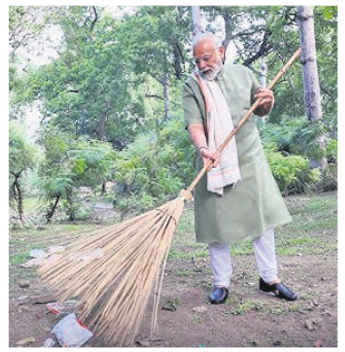
ନୂଆଦିଲ୍ଲୀ, ୧୧୧୦

ସ୍ଵଚ୍ଛତା ସହିତ ଫିଟ୍‌ନେସ୍ ଏବଂ ସୁସ୍ଥତା ଉପରେ ପ୍ରଧାନମନ୍ତ୍ରୀ ଜୋର୍ ଦେଇଥିଲେ। ପ୍ରଧାନମନ୍ତ୍ରୀ ଓ ଦେଘାନପୁରୀୟା ଖାଡୁ ଧରି ଓକାଲବା ସହ ଅଲିଆ ଉଠାଉଥିବା ଭିଡ଼ିଓକୁ ଦେଖିବାକୁ ମିଳିଛି। ପ୍ରଧାନମନ୍ତ୍ରୀ ଏହି ଭିଡ଼ିଓକୁ ଏକ୍ସ୍‌ରେ ପୋଷ୍ଟ କରିଛନ୍ତି। ପ୍ରଧାନମନ୍ତ୍ରୀଙ୍କ ସମେତ କେନ୍ଦ୍ରମନ୍ତ୍ରୀ ଓ ଭାଜପା ନେତାମାନେ ଦେଶର ବିଭିନ୍ନ ସ୍ଥାନରେ ସ୍ଵଚ୍ଛତା କାର୍ଯ୍ୟକ୍ରମରେ ଭାଗ ନେଇଥିଲେ। ସ୍ଵଚ୍ଛତା ଅଭିଯାନରେ ଭାଗ ନେଇଥିଲେ। ସ୍ଵଚ୍ଛତା ଅଭିଯାନରେ ଏବଂ ଭାଜପା ଅଧ୍ୟକ୍ଷ କେ.ପି. ନକ୍ଷା ଦିଲ୍ଲୀରେ ସ୍ଵଚ୍ଛତା ଅଭିଯାନରେ ନିଜକୁ ସାମିଲ କରାଇଥିଲେ। ପ୍ରଧାନମନ୍ତ୍ରୀଙ୍କ ଆହ୍ଵାନକୁ ଗ୍ରହଣ କରି ଏକଦିନ ସ୍ଵଚ୍ଛତା ଅଭିଯାନରେ ଭାଗ ନେଇ ଏବେ ଲାଗି ଥିଲେ।