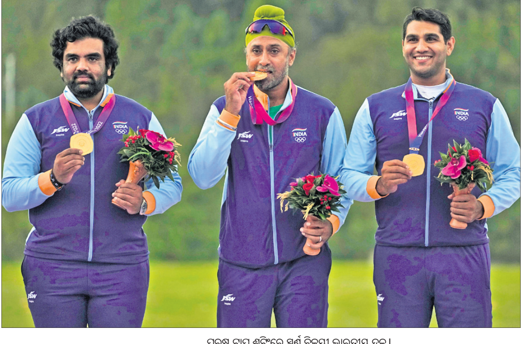
ପୁରୁଷ ଟ୍ରାୟ ଶୁଟିଂରେ ସ୍ୱର୍ଣ୍ଣ ବିଜୟୀ ଭାରତୀୟ ଦଳ।