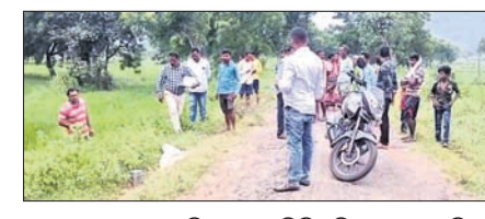
ଘଟଣାସ୍ଥଳରେ ପୋଲିସ୍ ଓ ସାଇଣ୍ଟିଫିକ୍ ଟିମ୍ ତଦନ୍ତ କରୁଛି।

ଅନ୍ୟପଟେ ବୃକ୍ଷକ ମୃତଦେହ ପଡ଼ିଥିବା ଦେଖିବାକୁ ମିଳିଛି। ଖବର ପାଇ ଜୁନାଗଡ଼ ପୋଲିସ୍ ଘଟଣାସ୍ଥଳରେ ପହଞ୍ଚି ଛାନ୍ଦିନି ଆରମ୍ଭ କରିଛି। ଉକ୍ତ ଗ୍ରାମରେ ପୋଲିସ୍ ତଦନ୍ତ ଜାରି ରଖିଥିବା ସୂଚନା ମିଳିଛି।