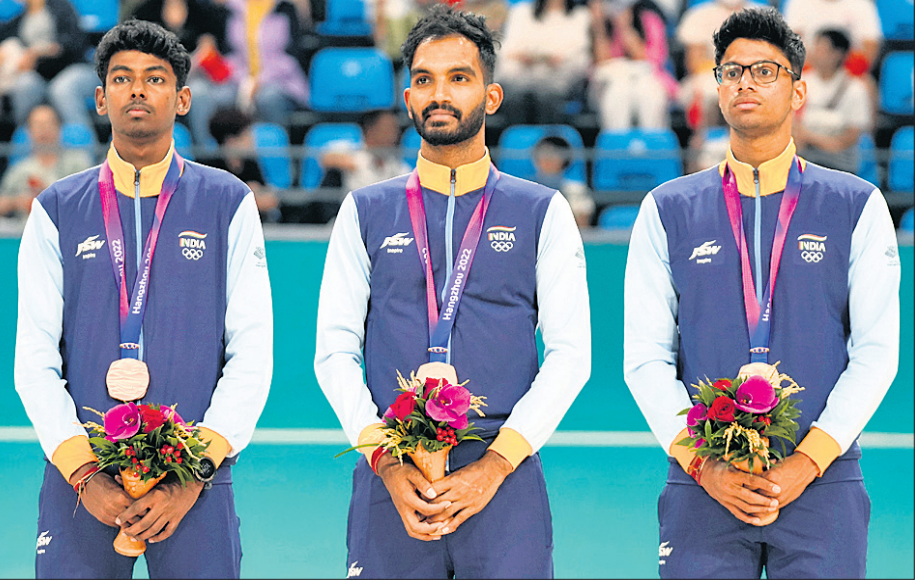
ଏସିଆନ ଗେମ୍ସ ୩୦୦୦ ମିଟର ଟିମ୍ ରିଲେ ଷ୍ଟେଟ୍ ଇଭେଣ୍ଟରେ ଗ୍ରୋଜା ପଦକ ବିଜୟୀ ଭାରତୀୟ ମହିଳା ଓ ପୁରୁଷ ଦଳ।