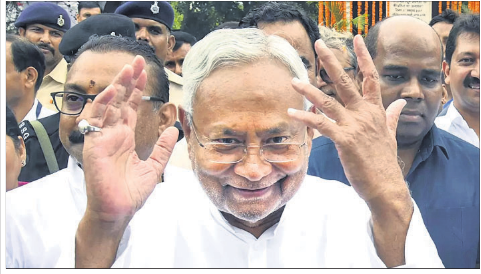
ଲାଇ ବାହାଦୁର ଶାସ୍ତ୍ରୀଙ୍କ ଜନ୍ମଦିନ ଅବସରରେ ପାଟଣାଠାରେ ଆୟୋଜିତ ସଭାରେ ବିହାର ମୁଖ୍ୟମନ୍ତ୍ରୀ ନୀତୀଶ କୁମାର ଖବରଦାତାଙ୍କୁ ଶାସ୍ତ୍ରୀଙ୍କ ସମ୍ପର୍କରେ ସୂଚନା ଦେଇଛନ୍ତି।