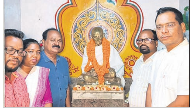
ଭବରା ଗାନ୍ଧୀ ମନ୍ଦିରରେ ଅନୁଷ୍ଠିତ କାର୍ଯ୍ୟକ୍ରମରେ ପ୍ରଶାସନିକ ଅଧିକାରୀ।

ଏସଏଆଇଙ୍କ ଦିଅର ଜଣେ ଲାଜୁ ସମସ୍ତ ଘଟଣା ସମ୍ପର୍କରେ ପୋଲିସ୍ ଠିକ୍ ତଥ୍ୟ ଦେବାକୁ ବୋଲି କହି ଅସନ୍ତୋଷ ପ୍ରକାଶ କରିଛନ୍ତି। ମୃତନାୟକ, ସୋମବାର ଅପରାହ୍ନରେ ଉଦ୍‌ତନଗର ଥାନା ଅଧୀନ ବିରଜାପାଲି ରୋଡ଼ରେ ଏକ କାର୍ (ନଂ.ଓଡ଼ିଶ-୧୪୩/୮୮୮୫) ଓ ରାଜଗୋଲ୍ଲୁ ନାମକ ଘରୋଇ ବସ୍ (ନଂ.ଓ.ଆର.୧୨୩/୦୯୨୫) ମଧ୍ୟରେ ଧକ୍କା ହୋଇଥିଲା।