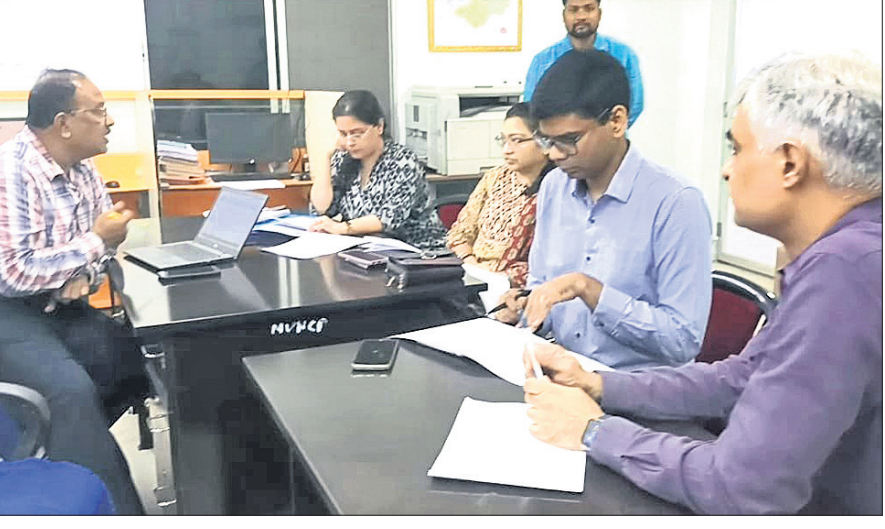
ଜିଲା ମୁଖ୍ୟ ଚିକିତ୍ସାଳୟରେ ଆଲୋଚନା କରୁଛନ୍ତି କେନ୍ଦ୍ରୀୟ ଟିମ୍।

ରୋଗ ପରୀକ୍ଷାକୁ ନେଇ ଶୋଭା ସମ୍ବୁଦ୍ଧ ହେବା ପରେ ପୁଣି ପରୀକ୍ଷା କର: ଡାକ୍ତରୀ ଦଳ