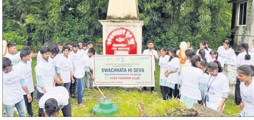
ଗାନ୍ଧୀ ଜୟନ୍ତୀ ଅବସରରେ ସଫେଇ କରାଯାଇଛି।