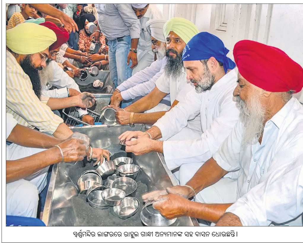
ସ୍ୱର୍ଣ୍ଣମନ୍ଦିର ଲାଙ୍ଗରରେ ରାହୁଲ ଗାନ୍ଧୀ ଅନ୍ୟମାନଙ୍କ ସହ ବାସନ ଧୋଉଛନ୍ତି।

ନାଟାଶ କୁମାର ସରକାର ବିହାର ଲୋକଙ୍କ ଗଢ଼ିବା ପରେ ଖୁବ୍‌ଶୀଘ୍ର ଏହି ସର୍ବେ ହେବ ଏବଂ ପ୍ରତ୍ୟେକ ବର୍ଷ ସେମାନଙ୍କ ଅଧିକାର ପାଇବେ ବୋଲି ବିରୋଧୀ ଦଳ କହିଛି। ଅନ୍ୟପକ୍ଷରେ ଜାତିଗଣନା ସର୍ବେ କେବଳ ଚାପି ଦେଇଥିଲେ। ବିହାର ସରକାରଙ୍କ ଜାତି ଜନଗଣନା ଭଳି କେନ୍ଦ୍ର ସରକାର ମଧ୍ୟ ବକେଟର ମାତ୍ର ୫ ପ୍ରତିଶତ ପରିଗଣନା କରିଥିଲେ। ସେଥିପାଇଁ ଭାରତର ଜାତି ପରିସଂଖ୍ୟାନ ଜାଣିବା ଗୁରୁତ୍ୱପୂର୍ଣ୍ଣ ବୋଲି