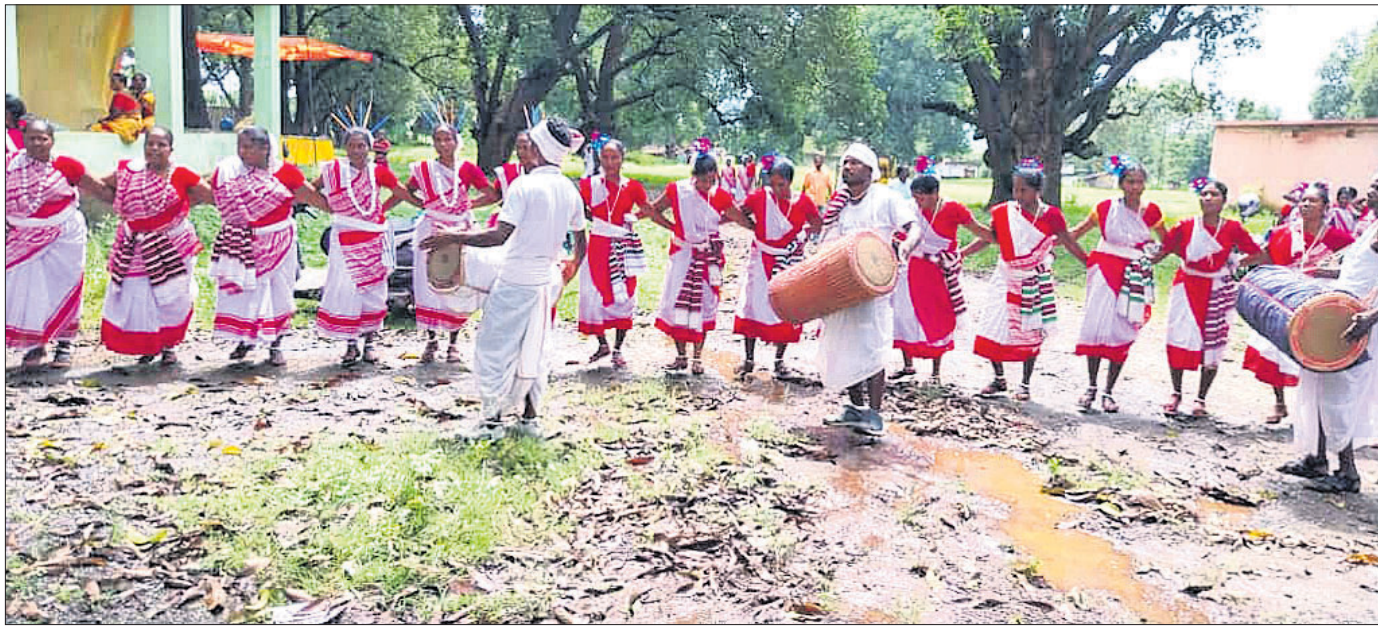
ଭୁବନେଶ୍ୱର ଲାଲ୍ କୋଲ୍ ଫାକ୍ଟରୀର ଆମ୍ବୁଗୁମ୍ଫା ଠାରେ ସେଣ୍ଟ୍ରାଲ୍ ହୋଟେଲ୍ ସମ୍ମୁଖରେ ଆଦିବାସୀ ନୃତ୍ୟ ପରିବେଷଣ କରୁଛନ୍ତି।