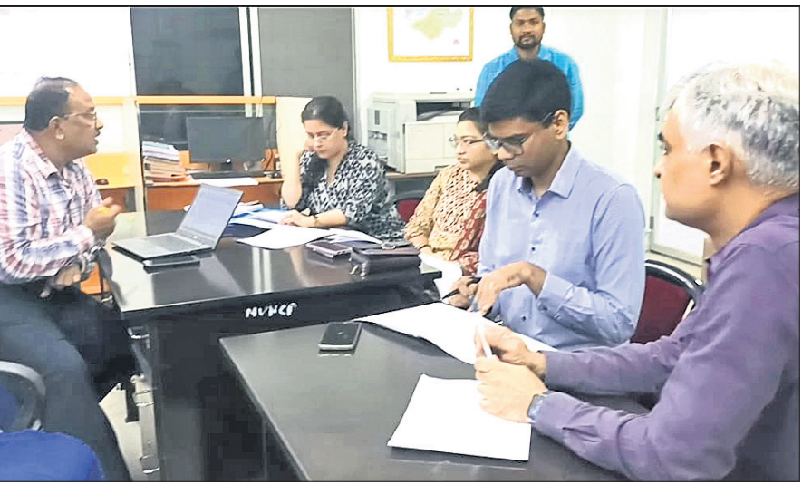
ଜିଲ୍ଲା ମୁଖ୍ୟ ଚିକିତ୍ସାଳୟରେ ଆଲୋଚନା କରୁଛନ୍ତି କେନ୍ଦ୍ରୀୟ ଚିମ୍।

ସମ୍ବଲପୁର ବୁଲିବାର ଉତ୍ସାହ ଓ ଜିଲ୍ଲା ମୁଖ୍ୟ ଚିକିତ୍ସାଳୟରେ ଯୋଗଦାନ କେନ୍ଦ୍ରୀୟ ଡାକ୍ତରୀ ଚିମ୍ ପହଞ୍ଚି ସ୍ୱର୍ ଚାଉଁଫସ୍ ରୋଗୀ ଚିକିତ୍ସା ନେଇ ସମୀକ୍ଷା କରିଥିଲେ। ଚିମ୍‌ସଭାରେ ଏବେ ୭ ଜଣ ସ୍ୱର୍ ଚାଉଁଫସ୍ ରୋଗୀ ଚିକିତ୍ସିତ ହେଉଛନ୍ତି। ଚିମ୍ ସଦସ୍ୟ ଉକ୍ତ ଖର୍ଚ୍ଚ ବୁଲି କିରଳି ଚିକିତ୍ସା କରାଯାଉଛି ଓ କ'ଣ ଔଷଧ ଦିଆଯାଉଛି ପଚାରି ବୁଝିଥିଲେ। ପରୀକ୍ଷାର ମଧ୍ୟ ବୁଲି ଦେଖୁଥିଲେ। ସୁସ୍ଥ ହୋଇଥିବା ରୋଗୀଙ୍କୁ ଆଖିପରେ ପରୀକ୍ଷା କରିବା ସହ ନେରୋଟିକ ରିପୋର୍ଟ ଆଦିର ପରେ ଡିସଚାର୍ଜ କରିବାକୁ କହିଥିଲେ। ଏହି ସମୟରେ ଚିମ୍‌ସଭା ଅଧ୍ୟକ୍ଷକ ପ୍ରଫେସର ଡା.