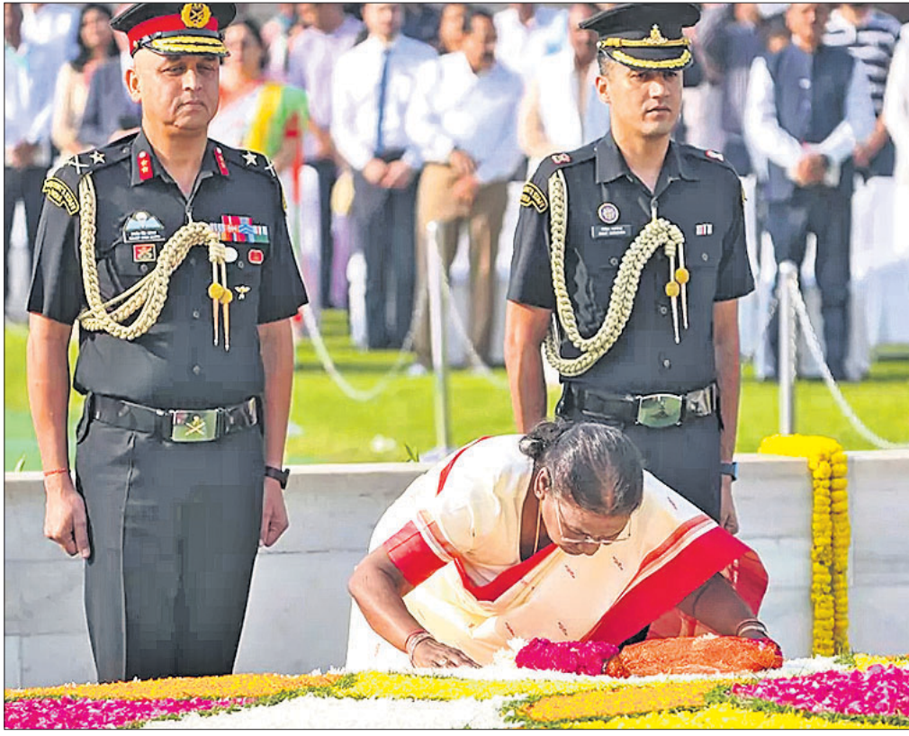
ମହାତ୍ମା ଗାନ୍ଧୀଙ୍କ ଜନ୍ମବାର୍ଷିକୀରେ ନୂଆଦିଲ୍ଲୀର ରାଜଗାଦସ୍ତିତ ଡାକ୍ ସମାଧିରେ ରାଷ୍ଟ୍ରପତି ଦ୍ରୌପଦୀ ମୁର୍ମୁ ଶ୍ରଦ୍ଧାଞ୍ଜଳି ଦେଇଛନ୍ତି।