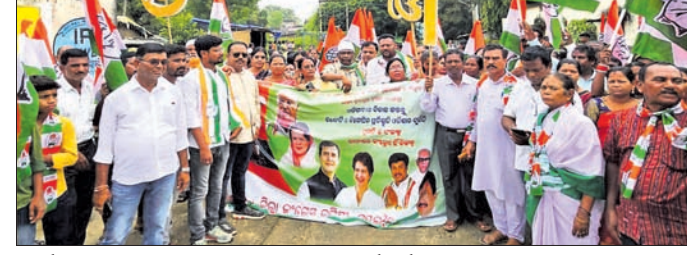
କାର୍ଯ୍ୟକ୍ରମରେ ସାମିଲ ହୋଇଥିବା ଦଳୀୟ କର୍ମକର୍ତ୍ତା।