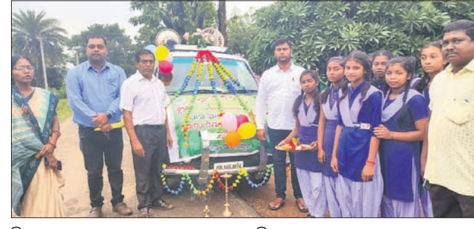
ଶିକ୍ଷା ସଚେତନତା ରଥ ଉଦ୍‌ଘାଟନ କରାଯାଇଛି।