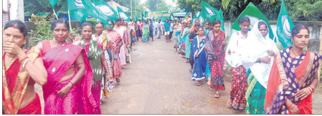
ବିଜେଡି ପକ୍ଷରୁ ସମ୍ଭାଷଣ କରାଯାଇଛି।

ଏହା ସମ୍ଭବ ହେଇଥିଲା ଶିକ୍ଷା ସଚେତନତା ରଥ ଉଦ୍‌ଘାଟନ କରାଯାଇଛି। ଏହା ସମ୍ଭବ ହେଇଥିଲା ଶିକ୍ଷା ସଚେତନତା ରଥ ଉଦ୍‌ଘାଟନ କରାଯାଇଛି। ଏହା ସମ୍ଭବ ହେଇଥିଲା ଶିକ୍ଷା ସଚେତନତା ରଥ ଉଦ୍‌ଘାଟନ କରାଯାଇଛି।