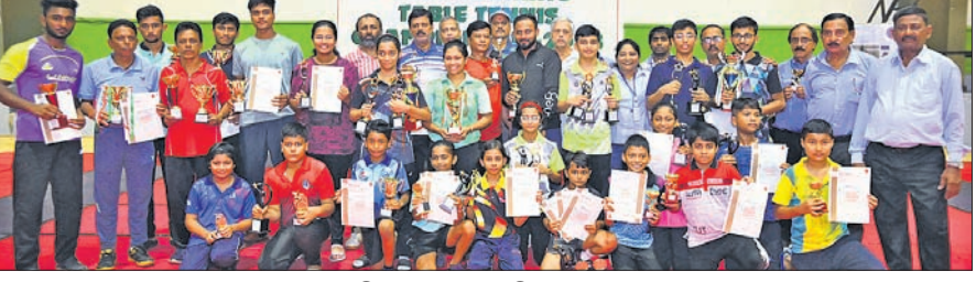
କୃତୀ ପ୍ରତିଯୋଗୀମାନେ ଅତିଥିକ ରାଜଶରେ।

ଭୁବନେଶ୍ୱର, ୨୧୦ (ତପନ ସାଲ) ଖୋର୍ଦ୍ଧା ଜିଲ୍ଲା ଚେନ୍ଦୁଳ ଚେନିସ ଆସୋସିଏସନ ଆନୁକୁଲ୍ୟରେ କିଛି ବିଶ୍ୱବିଦ୍ୟାଳୟର ବିଜୁ ପଟ୍ଟନାୟକ ଇନିଟୋର ଷ୍ଟାଡ଼ିୟମରେ ୧୬ତମ ରାଜ୍ୟ ର୍ୟାଲିଜ୍ ଚେନ୍ଦୁଳ ଚେନିସ ଚାମ୍ପିୟନସିପ୍ ଯୋଜନାରେ ଉଦ୍‌ଘାଟିତ ହୋଇଛି।