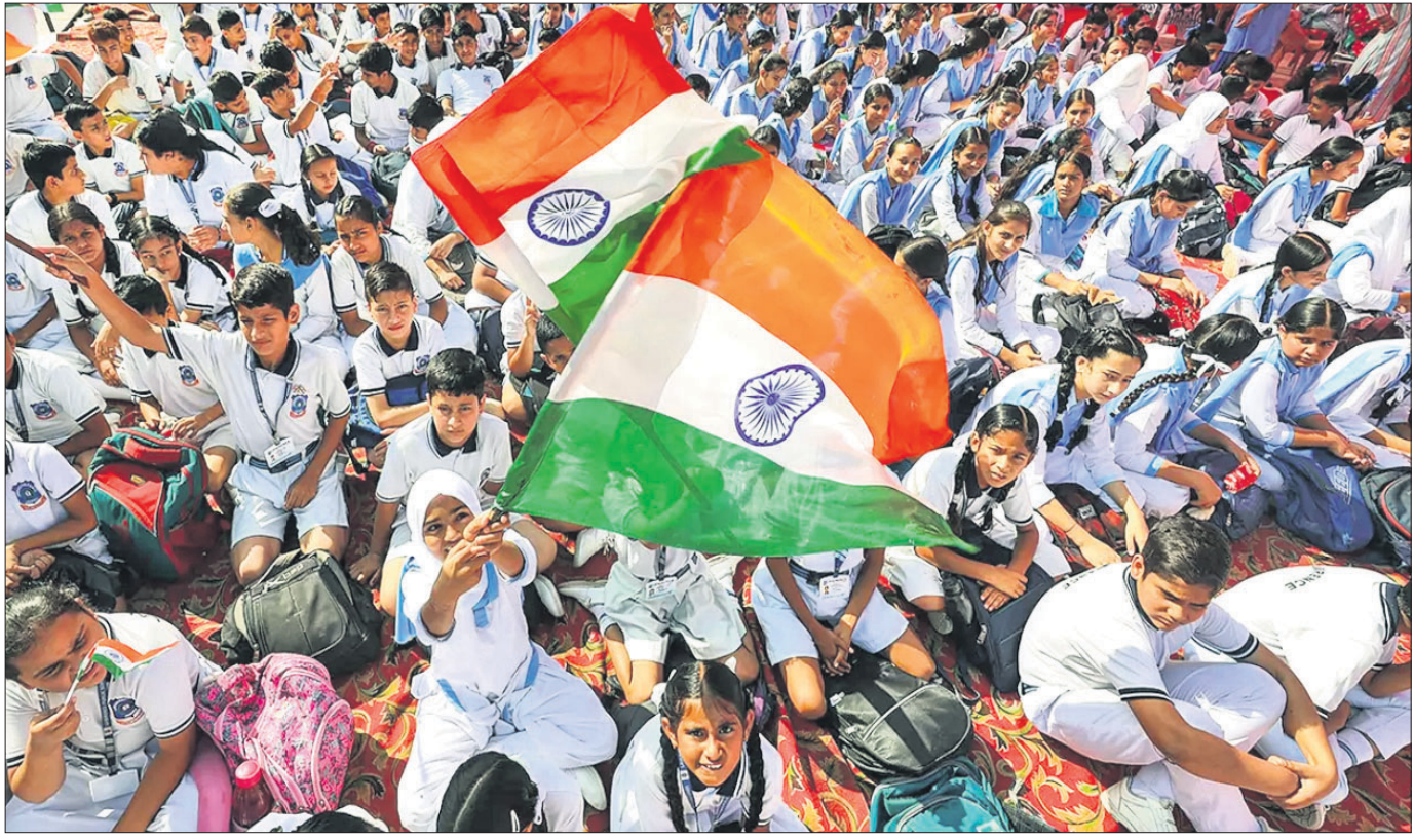
ଗାନ୍ଧୀ ଜୟନ୍ତୀ ଅବସରରେ ଜମ୍ମୁର ମୁବାରକ ମଞ୍ଚିଠାରେ ସ୍କୁଲପିଲାମାନେ ମହାତ୍ମା ଗାନ୍ଧୀଙ୍କୁ ଶ୍ରଦ୍ଧାଞ୍ଜଳି ଜଣାଇଛନ୍ତି।