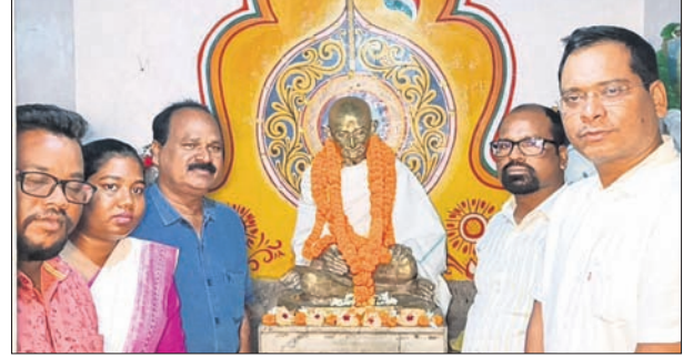
ଭବରା ଗାନ୍ଧୀ ମନ୍ଦିରରେ ଅନୁଷ୍ଠିତ କାର୍ଯ୍ୟକ୍ରମରେ ପ୍ରଶାସନିକ ଅଧିକାରୀ।