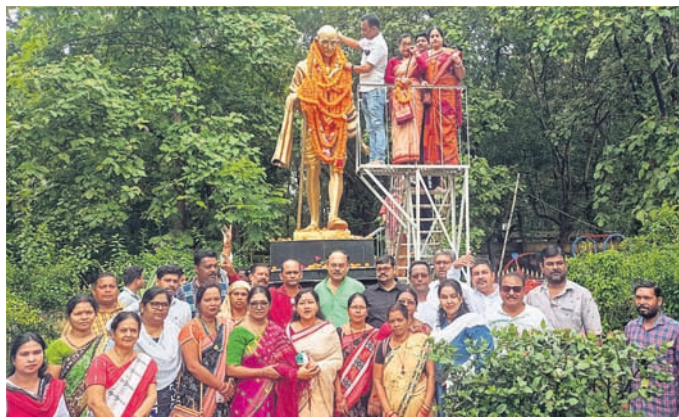
ମହାତ୍ମା ଗାନ୍ଧୀଙ୍କ ପ୍ରତିମାପୂର୍ବକ ମାର୍ଚ୍ଚନା କରାଯାଇଛି।

ଭୁବନେଶ୍ୱର ମହାନଗର ନିଗମ (ଏସ୍.ଏମ.ଏସ୍) ବିଜେଡି ପକ୍ଷରୁ ଗାନ୍ଧୀ ଜୟନ୍ତୀ ପାଇଁ ପ୍ରତିମାପୂର୍ବକ ମାର୍ଚ୍ଚନା କରାଯାଇଛି। ଏହାଛଡା ବିଜେଡି ପକ୍ଷରୁ ଆଦିବାସୀ ସଂସ୍କୃତି, ପରମ୍ପରା ଓ ଜ୍ଞାନ ପ୍ରସାରଣ କାର୍ଯ୍ୟକ୍ରମର ଫଳାଫଳ ଭାବେ ଆଦିବାସୀ ନୃତ୍ୟ ପରିବେଷଣ କରୁଛନ୍ତି।