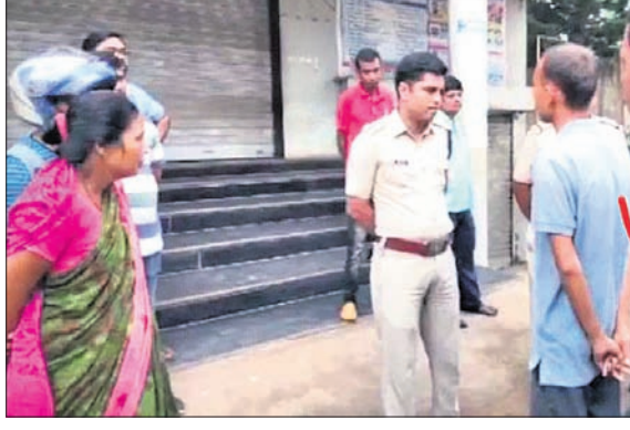
ସମ୍ପର୍କୀୟଙ୍କ ସହ ଥାନା ଅଧିକାରୀ ଆଲୋଚନା କରୁଛନ୍ତି।