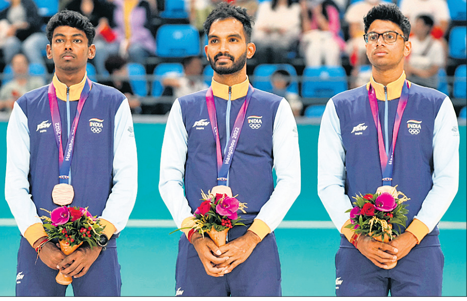
ଏସିଆନ ଗେମ୍ସର ୩୦୦୦ ମିଟର ଟିମ୍ ରିଲେ ଷ୍ଟେଟ୍ ଇଭେଣ୍ଟରେ ଗ୍ରୋଜା ପଦକ ବିଜୟୀ ଭାରତୀୟ ମହିଳା ଓ ପୁରୁଷ ଦଳ।