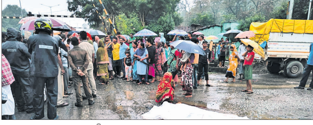
ଜାତୀୟ ରାଜପଥ ଅବରୋଧ କରାଯାଇଛି।