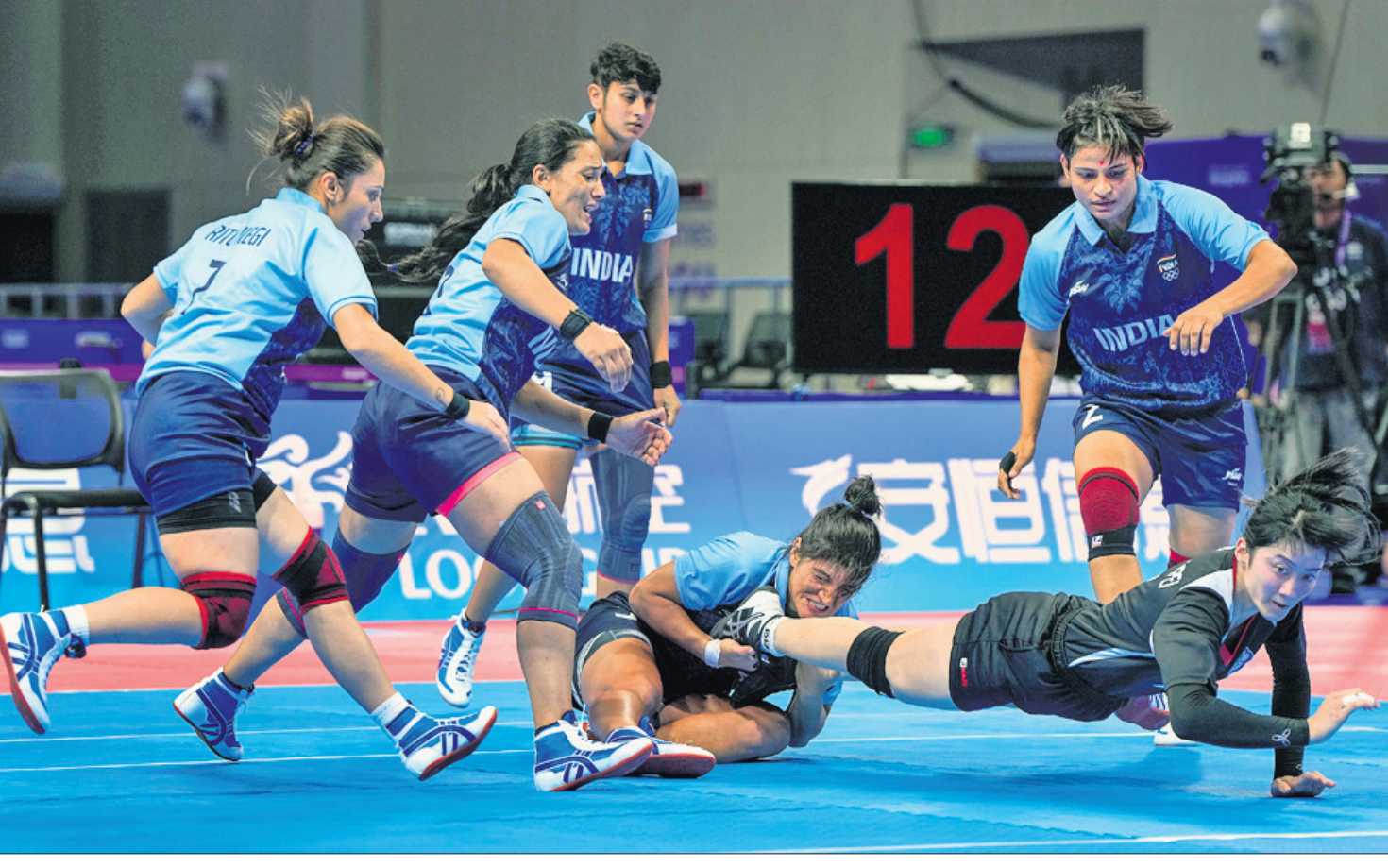
ଗାଜନାର ହାଜଣେରେ ଚାଲିଥିବା ଏସିଆନ ଗେମ୍‌ରେ ଯୋଦ୍ଧା ଭାବେ ଓ ଗାଜନିକ ତାଳପେ ମଧ୍ୟରେ ଅନୁଷ୍ଠିତ ମହିଳା କବାଡ଼ି ମ୍ୟାଚର ଏକ ସଂଘର୍ଷପୂର୍ଣ୍ଣ ମୁହୂର୍ତ୍ତ।