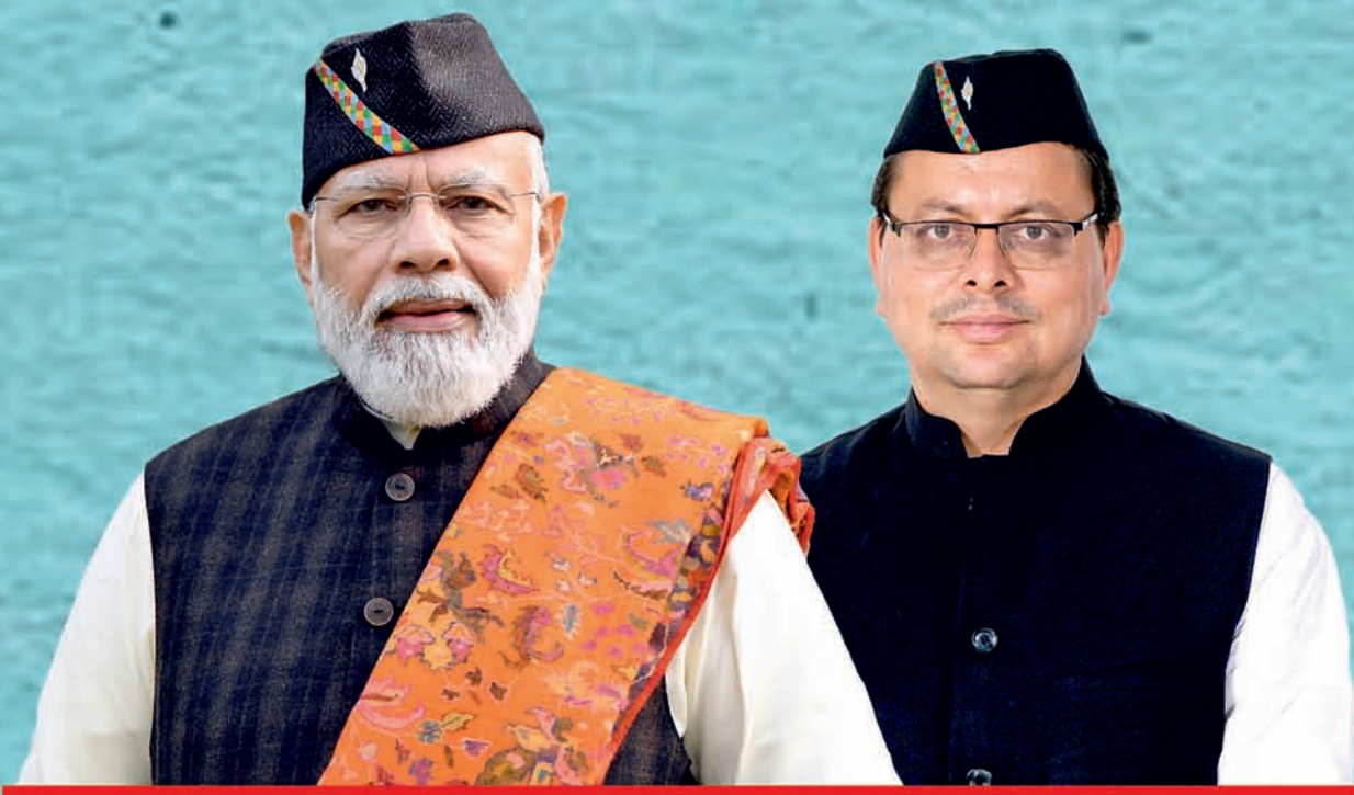
Narendra Modi Prime Minister