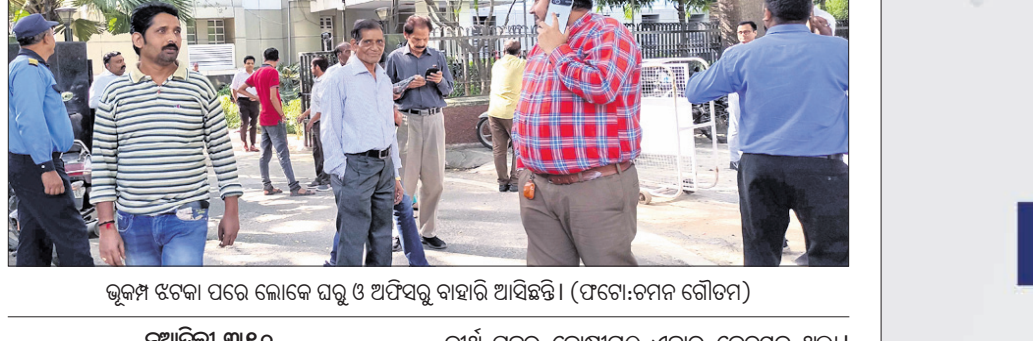
ଭୂକମ୍ପ ଝଟକା ପରେ ଲୋକେ ଘରୁ ଓ ଅଫିସରୁ ବାହାରି ଆସିଛନ୍ତି।

ନୂଆଦିଲ୍ଲୀ, ୩୧୦ ୪ଟି ଭୂକମ୍ପରେ ମଙ୍ଗଳବାର ଥିବିଠିକି ପଡ଼ୋଶୀ ନେପାଳ। ୬.୨ ଟାକ୍ଟରା ବିଶିଷ୍ଟ ଏହି ଭୂକମ୍ପ ଏତେ ଶକ୍ତିଶାଳୀ ଥିଲା ଯେ, ଏହାର ପ୍ରଭାବ ଦିଲ୍ଲୀ-ଏନ୍‌ସିଆର୍ ସମେତ ଉତ୍ତର ଭାରତରେ ଅନୁଭୂତ ହୋଇଛି। ନ୍ୟାଶନାଲ୍ ସେଣ୍ଟର ଫର୍ ସେସମୋଲୋଜି (ଏନ୍‌ସିଏସ୍) ପକ୍ଷରୁ କୁହାଯାଇଛି ଯେ, ଅପରାହ୍ ୨ଟା ୨୫ରେ ୪.୬ ଟାକ୍ଟରା ପ୍ରଥମ ଭୂକମ୍ପ ପଶ୍ଚିମ ନେପାଳରେ ଅନୁଭୂତ ହୋଇଥିଲା। ଏହା ପରେ ୨ଟା ୫୧ରେ ୬.୨ ଟାକ୍ଟରା ଆଉ ଏକ ଭୂକମ୍ପ ହୋଇଥିଲା। ୩.୬ ଏବଂ ୩.୧ ଟାକ୍ଟରା ଟୁଟାୟ ଓ ଚତୁର୍ଥ ଭୂକମ୍ପ ଯଥାକ୍ରମେ ୩ଟା ୬ ଓ ୩ଟା ୧୯ ମିନିଟ୍‌ରେ ହୋଇଥିଲା। ଉତ୍ତରାଖଣ୍ଡର