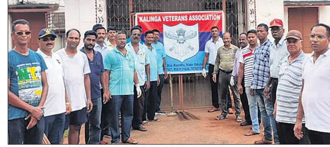
କାର୍ଯ୍ୟକ୍ରମରେ କଳିଙ୍ଗ ଭେଟେରାନ ଆସୋସିଏସନ କର୍ମକର୍ମୀ ଏବଂ ଅନ୍ୟମାନେ।

ରୋଗରେ ପୀଡ଼ିତ ହୋଇ ପ୍ରାଣ ହରାନ୍ତି। ଏହାକୁ ନନ୍-ଏମଏଲସି ଭାବେ ପଞ୍ଜୀକରଣ କରାଯାଇଥାଏ। ତେବେ ଏମଏଲସିରେ ପଞ୍ଜୀକୃତ ବ୍ୟକ୍ତିଙ୍କ ମୃତଦେହ ସକ୍ୱାର କରାଯିବା ପାଇଁ ହରିଶ୍ଚନ୍ଦ୍ର ଯୋଜନାରୁ ଅର୍ଥ ବିନିଯୋଗ କରାଯାଇଥାଏ। ମାତ୍ର ନନ୍-ଏମଏଲସି ପଞ୍ଜୀକୃତ ବ୍ୟକ୍ତିଙ୍କ ମୃତଦେହ ସକ୍ୱାର ପାଇଁ ବଡ଼ ମେଡିକାଲ ନିର୍ଦ୍ଦେଶ ପାଣ୍ଠିରୁ ଟଙ୍କା ଖର୍ଚ୍ଚ ହୋଇଥାଏ। ହେଲେ ମେଡିକାଲ କର୍ତ୍ତୃପକ୍ଷ ଉକ୍ତ ଖର୍ଚ୍ଚ ବହନ କରି ନନ୍-ଏମଏଲସି ମୃତଦେହକୁ ଏମଏଲସି ଭାବେ ପଞ୍ଜୀକରଣ କରି ସକ୍ୱାର ବ୍ୟବସ୍ଥା କରିବା ପାଇଁ ପୋଲିସକୁ କହିଛନ୍ତି ବୋଲି ଜନେକ ପୋଲିସ ଅଧିକାରୀ ସୂଚନା ଦେଇଛନ୍ତି। ତେବେ ସେହିଭଳି ରହିଥାଏ, ସେମାନଙ୍କ ଶବ ବ୍ୟବହାର ହୁଏ। ଅପମୃତ୍ୟୁ ମାମଲା ରୁକ୍ତ କରାଯିବା ସହିତ ଏହାକୁ ଏମଏଲସିରେ ପଞ୍ଜୀକରଣ କରାଯାଇଥାଏ। ଏମଏଲସିରେ ପଞ୍ଜୀକରଣ ପରେ ପୋଲିସ ଏହି ପ୍ରସଙ୍ଗରେ ହସ୍ତକ୍ଷେପ କରିବା ସହ ସମ୍ପୂର୍ଣ୍ଣ ବ୍ୟକ୍ତିଙ୍କ ମୃତଦେହ ସକ୍ୱାର ନିମନ୍ତେ ପଦକ୍ଷେପ ନେଇଥାଏ। ସହଜରେ କରାଯାଇ ପାରିବ ସେ ନେଇ ଉଦ୍ଦିଷ୍ଟ ଗାଇଡଲାଇନରେ ପରିବର୍ତ୍ତନ ଆଣିବା ଦିଗରେ ନିବେଦନ କରାଯିବ।