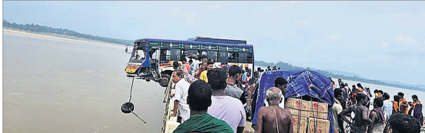
ବାଙ୍କୀ/ତମପଡ଼ା, ୩।୧୦ (ଝାଲେନ୍ଦ୍ର ମୋହନ ମିଶ୍ର/ସତ୍ୟ ରଞ୍ଜନ ସାହୁ)

କଟକ ଜିଲା ବାଙ୍କୀ ଜାତପୁଞ୍ଜିଆ-ପୁରୁଣୁପୁର ମହାନଦୀ ପୋଲରେ ମଙ୍ଗଳବାର ଏକ ଯାତ୍ରାବାହୀ ବସ୍ ଘଟଣାଗ୍ରସ୍ତ ହୋଇଛି। ଅନୁଗୋଳରୁ ଭୁବନେଶ୍ୱର ଆଡ଼ିକୁ ଯାଉଥିବା ଏହି ବସ୍ ଭାରସାମ୍ୟ ହରାଇ ପୋଲର ବାଡ଼ାରେ ଘଟି ହୋଇଯାଇଥିଲା। ବସ୍ଟି ନଦୀକୁ ଝୁଲି ରହିଥିବାବେଳେ ସୌଭାଗ୍ୟବଶତଃ ବସ୍ ମଧ୍ୟରୁ ଯାତ୍ରୀମାନେ ସୁରକ୍ଷିତ ଭାବେ ଉଦ୍ଧାର ହୋଇପାରିଥିଲେ। ଫଳରେ ୩୦ ଯାତ୍ରୀଙ୍କ ସମେତ ବସ୍ ଡ୍ରାଇଭର ଏବଂ କର୍ମଚାରୀ ଏକ ବଡ଼ ଦୁର୍ଘଟଣାରୁ ବର୍ତ୍ତି ଯାଇଛନ୍ତି।