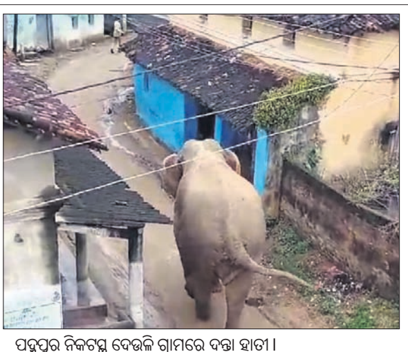
ପଦ୍ମପୁର ନିକଟସ୍ଥ ଦେଉଳି ଗ୍ରାମରେ ଦକ୍ଷା ହାତୀ।