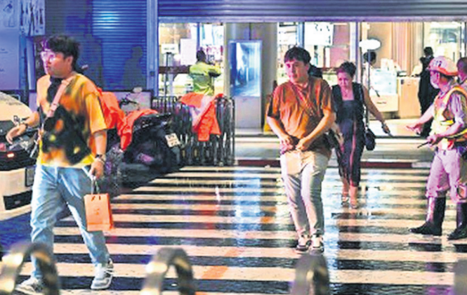
ଗୁଳିକାଣ୍ଡ ପରେ ମଲ୍‌ରୁ ବାହାରିଥିବା ଆହତ ଲୋକେ।

ଆଇଲାଖରେ ବନ୍ଧୁକ ହିଂସା ନୂଆ ରୁହେଁ। ଗତବର୍ଷ ଜଣେ ପୂର୍ବତନ ପୋଲିସ୍ ଅଫିସର ଏକ ନର୍ସରି ସ୍କୁଲରେ ଗୁଳି ଚଳାଇବାକୁ ୨୨