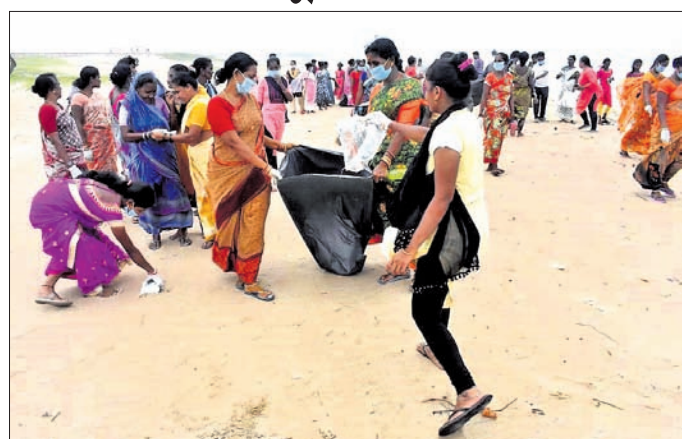
ପୁରୀ ମ୍ୟୁନିସିପାଲିଟି ଏବଂ ଏସ୍‌ସିଏଲ୍ ପାଠକୋଶ ନିକଟରେ ଉପକୂଳ ସଫେଇ କରାଯାଇଛି ।