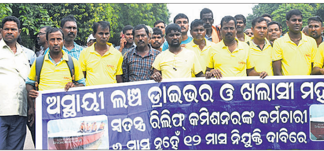
ଅସ୍ଥାୟୀ ଲକ୍ଷ୍ମି ଭ୍ରାଜଭର ଓ ଖଲାସି ମହାସଂଘ ପକ୍ଷରୁ କୋଇଲି ପିପ୍ପାଳିରେ ବିକ୍ଷୋଭ ପ୍ରଦର୍ଶନ କରାଯାଇଛି।

ଜିଲ୍ଲାରେ ଭ୍ରାଜଭର ଓ ଖଲାସି ମିଶ୍ରି ୫୦୮ ଜଣ କର୍ମଚାରୀ କାର୍ଯ୍ୟରେ ଅଛନ୍ତି। ଜଣେ ଭ୍ରାଜଭର ମାତ୍ର ୧୧, ୧୦୦ ଟଙ୍କା ପାଉଛନ୍ତି। ଏତିକି ଅର୍ଥରେ ୬ ମାସ କାମ କରି ବର୍ଷପାଳ ପରିବାର ତଳାଇବା ସେମାନଙ୍କ ପକ୍ଷେ କଷ୍ଟକର ହୋଇପଡ଼ିଛି। ତେଣୁ ବିଭିନ୍ନ କୃଷି ବିକ୍ଷୋଭ ପ୍ରଦର୍ଶନ କରାଯାଇଛି। ମହାସଂଘର କର୍ମକର୍ତ୍ତା କହିଛନ୍ତି ଯେ, ଭ୍ରାଜଭର ଓ ଖଲାସିମାନଙ୍କୁ ଖାଲିଥିବା ଅସ୍ଥାୟୀ ଲକ୍ଷ୍ମି ଭ୍ରାଜଭର ଓ ଖଲାସିମାନଙ୍କୁ ଅନୁସାରେ ୬ମାସିଆ ଠିକା କର୍ମଚାରୀ ଭାବେ ବନ୍ଦୀ ବନ୍ଦୀ ସମୟରେ ବୋଟ ଚଳାଇବା ଏବଂ ବାଟ୍ୟା ଭଳି ପ୍ରାକୃତିକ ବିପର୍ଯ୍ୟୟ ହେବା ପରେ କାର୍ଯ୍ୟରେ ନିଯୋଜିତ କରିବା ପାଇଁ ଆୟୋଜନକାରୀମାନେ ଦାବି କରିଛନ୍ତି।