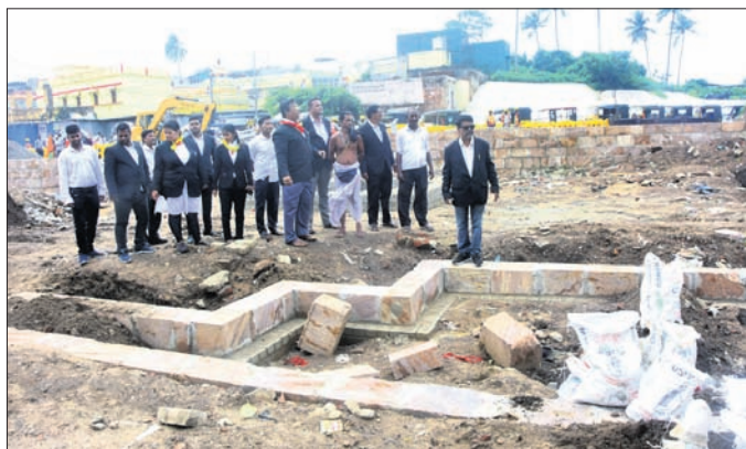
ବୁଲି ଦେଖୁଛନ୍ତି ଆଇନଜୀବୀ ।

ସେବାୟତଙ୍କଠାରୁ ଆରମ୍ଭ କରି ବିଭିନ୍ନ ସାମାଜିକ ଅନୁଷ୍ଠାନ ପକ୍ଷରୁ ଶ୍ରୀମନ୍ଦିର ଚାରିଦ୍ୱାର ଖୋଲିବା ନେଇ ବହୁ ସମୟରେ ଦାବି ଓ ବିରୋଧ ପ୍ରଦର୍ଶନ ହୋଇଆସୁଛି । ତେବେ ଶ୍ରୀମନ୍ଦିର ଚାରିଦ୍ୱାରରେ ଚାଲିଥିବା ପରିକ୍ରମା ମାର୍ଗର ନିର୍ମାଣ କାର୍ଯ୍ୟ ଶେଷ ହେବା ପରେ ପରିଚାଳନା କମିଟି ଓ ଅନ୍ୟମାନଙ୍କ ସହ ଆଲୋଚନା କରାଯାଇ ନିଷ୍ପତ୍ତି ନିଆଯିବ ବୋଲି ପ୍ରଶାସନ ପକ୍ଷରୁ କୁହାଯାଇଥିଲା । ତେବେ ପରିକ୍ରମା କାର୍ଯ୍ୟ ଶେଷ ହେବାପରେ ବିଳମ୍ବ ହେବା ଏବଂ ପ୍ରଶାସନ ଜାଣିଶୁଣି ଭକ୍ତମାନଙ୍କ ପାଇଁ ଚାରିଦ୍ୱାର ଖୋଲିନଥିବା ଅଭିଯୋଗ କରି ଶ୍ରୀକନ୍ୟାଅ ସେନା ପକ୍ଷରୁ