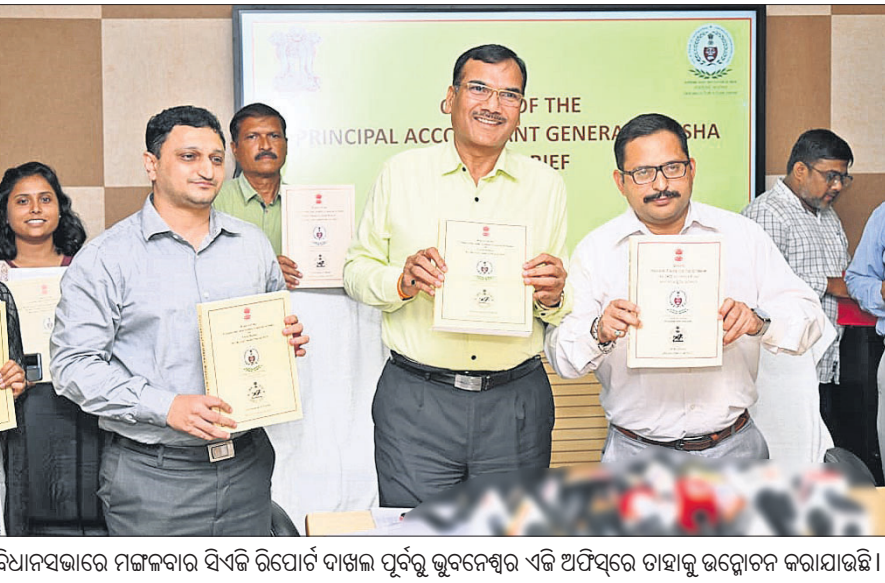
ବିଧାନସଭାରେ ମଙ୍ଗଳବାର ସିଏସି ଗିରଫ ଦାଖଲ ପୂର୍ବରୁ ଭୁବନେଶ୍ୱର ଏକ ଅଫିସରେ ଚାହାନ୍ତୁ ଉଦ୍ଦୋଚନ କରାଯାଇଛି।

ଗୋଲ୍ଡ ଟ୍ରେସିଂ ସେଣ୍ଟର ଚଢ଼ାଇ ଦିଆଯାଇ ପୂର୍ବରୁ ଭୁବନେଶ୍ୱର ଏକ ଅଫିସରେ ଚାହାନ୍ତୁ ଉଦ୍ଦୋଚନ କରାଯାଇଛି।