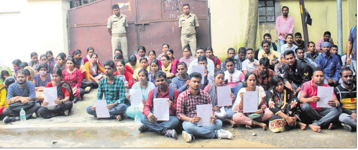
ଓଡ଼ିଶା ରାଜ୍ୟ ଆରକ୍ଷା ସୁହ ନିର୍ମାଣ ଓ କଲ୍ୟାଣ ନିଗମ ଦ୍ୱାରା ପରିଚାଳିତ ଜୁନିୟର ଆସିଷ୍ଟାଣ୍ଟ ବିଶ୍ୱପୁରେ ସଂଖ୍ୟୋପ ଦାବିରେ ମଙ୍ଗଳବାର ଷ୍ଟାମ୍ପ ସିଲେକ୍ସନ ଅର୍ପଣ ସମ୍ବନ୍ଧରେ ଆଶାଯାକ ଧାରଣା।