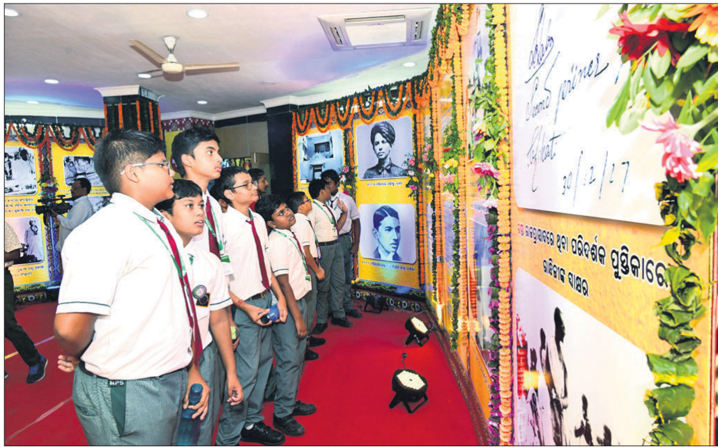
ପିଲାମାନେ ଫଟୋଗ୍ରାଫି ପ୍ରଦର୍ଶନୀକୁ ବୁଲି ଦେଖୁଛନ୍ତି।