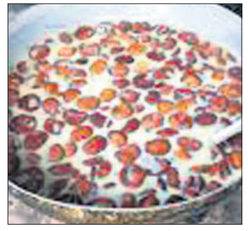
କେନ୍ଦ୍ରାପଡ଼ା, ୩୧୦ (କରକାଥ ଧଳ)

କେନ୍ଦ୍ରାପଡ଼ା ରସାବଳିକୁ ଜିଆଇ ଟ୍ୟାଗ୍ ମିଳାଇଛି। ଡିପାର୍ଟମେଣ୍ଟ ଅଫ ଫୁଡ୍ ପ୍ରୋସେସିଂ ଏଣ୍ଡ ଡାକ୍ତରୀ (ଜିଆଇ) ଟ୍ୟାଗ୍ ମିଳାଇଛି। କେନ୍ଦ୍ରାପଡ଼ା ରସାବଳି ମିଷ୍ଟାନ ନିର୍ମାତା ସଂଘ ଓ ଅନ୍ୟ ସମ୍ପର୍କିତ ପକ୍ଷରୁ ହୋଇଥିବା ଆବେଦନ (ନଂ. ୮୦୨/୨୩/୧୨/୨୦୨୧) ସମ୍ପର୍କରେ ଡିପାର୍ଟମେଣ୍ଟ ଅଫ ଫୁଡ୍ ପ୍ରୋସେସିଂ ଏଣ୍ଡ ଡାକ୍ତରୀ ପ୍ରମାଣ ପତ୍ର ନଂ. ୫୦୮ରେ ଏହାକୁ ପଞ୍ଜୀକୃତ କରାଯାଇଛି। ଏହି ପ୍ରମାଣପତ୍ରର ବୈଧତା ଆସନ୍ତା ୨୦୩୧ ଡିସେମ୍ବର ଶେଷ ପର୍ଯ୍ୟନ୍ତ ରହିବ ବୋଲି ସୂଚନା ଦିଆଯାଇଛି। ୧୫ ପୃଷ୍ଠା-୨