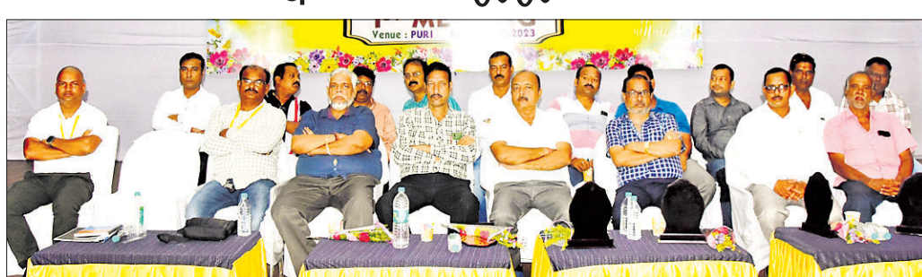
ପୋଲିଟି ଟ୍ରେଡର୍ସ ଆସୋସିଏସନ ବୈଠକରେ ମହାସାନ ଅତିଥିମାନେ।

ଓଡ଼ିଶା ପୋଲିଟି ଟ୍ରେଡର୍ସ ଆସୋସିଏସନର ପ୍ରଥମ ବୈଠକ ଗଠନ ହଲଠାରେ ମଙ୍ଗଳବାର ଅନୁଷ୍ଠିତ ହୋଇଯାଇଛି। ବିଭିନ୍ନ ରାଜ୍ୟରୁ ପ୍ରାୟ ୩୫୫ ଟ୍ରେଡର୍ସ ଏଥିରେ ଯୋଗ ଦେଇଥିଲେ। ବ୍ୟବସାୟୀ ଓ କର୍ମଚାରୀ ମଧ୍ୟରେ ସମନ୍ୱୟ ରହିଲେ କୁକୁଡ଼ା ଚାଷ ଓ ଚାଷୀର ଉନ୍ନତି ହୋଇପାରିବ ବୋଲି ବୈଠକରେ ମତପ୍ରକାଶ ପାଇଥିଲା। ଏବଂ କେନ୍ଦ୍ର ସରକାରଙ୍କ ମଧ୍ୟରେ ସମନ୍ୱୟ ଆଭାବକୁ ପ୍ରସ୍ତାବିତ ପାଇକ ସ୍ଥାନକା ସାଧାରଣରେ ମତପ୍ରକାଶ ପାଇଛି। ଶ୍ରେୟ ମନ୍ତ୍ରାଳୟରେ ସ୍ଥାନକା ନିର୍ମାଣରେ ବିକଳ ଘଟୁଛି ଚର୍ଚ୍ଚା ହେଉଛି। ଖୁବ୍‌ଶୀଘ୍ର ନିର୍ମାଣ ଆରମ୍ଭ କରିବା ଲାଗି ଦାବି ହୋଇଛି।