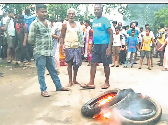
ଭବ୍ୟ ଲୋକେ ରାସ୍ତାବରୋଧ କରିଛନ୍ତି।

ସୂଚନା ଅନୁଯାୟୀ, ରୁକ୍ଷକାର ମଧ୍ୟାହ୍ନ ସମୟରେ ଟ୍ରକ୍‌ଟି ରାଜ୍ୟ ଉପରାଧିକାରୀଙ୍କୁ ଆକ୍ରମଣ କରିଥିଲା।