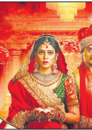
(ବାମକୁ) ଧାରାବାହିକ 'ତୁ ମୋ ସାଥୀରେ', 'ସନ୍ଧ୍ୟା ରାଗିଣୀ' ଏବଂ 'ଶକ୍ତି'ର ଦୃଶ୍ୟ