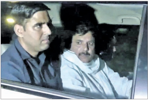
ଏସପିର ରାଜ୍ୟ ସଭା ସଦସ୍ୟ ସଞ୍ଜୟ ସିଂଙ୍କୁ ଇତି ପକ୍ଷରୁ ଗିରଫ କରି ନିଆଯାଇଛି।