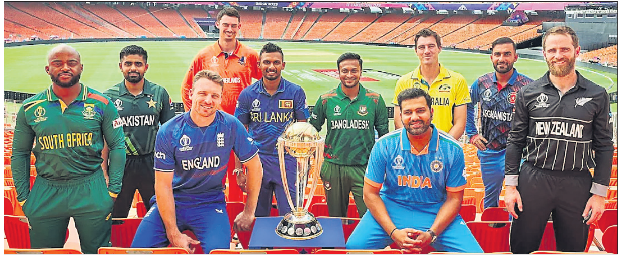
ଆଇସିସି କ୍ରିକେଟ ବିଶ୍ୱକପ୍ ଆରମ୍ଭ ହେବା ପୂର୍ବରୁ ଭୁବନେଶ୍ୱର ଅଫିସ୍‌ରେ କ୍ୟାପଟେବୁ ଡେ'ରେ ଯୋଗ ଦେଇଥିବା ୧୦ ଦଳର ଅଧିନାୟକ।

ବୌଦ୍ଧ ଗମନ ଧର ପାଇଁ ୫୦ ଓଭର ବିଶିଷ୍ଟ ବିଶ୍ୱକପ୍ ଆୟୋଜନ କରିବାକୁ ଯାଉଛି। ଅନ୍ତର୍ଜାତୀୟ ଦିନିକିଆ ଫର୍ମାଟକୁ ନୂତନ ଶୈଳୀରେ ଖେଳାଯାଇପାରିବ। ଏହା ଅଧିକ ଆକର୍ଷଣୀୟ ହୋଇପାରିବ। ଏ ପ୍ରସଙ୍ଗରେ ଭାରତୀୟ ଦଳର ପ୍ରଦର୍ଶନ ସହାୟକ ହେବ। ମୋ ମତରେ ଏଥର ଭାରତ ଓ ଇଂଲଣ୍ଡ ହେଉଛନ୍ତି ଦୁଇ ପ୍ରମୁଖ ଚାଲଚଳା ଯୁଦ୍ଧ। ଇଂଲଣ୍ଡ ଦଳ ବୋଲି ଓ ଫିଲ୍ଡରେ ଖୁବ୍ ଭଲ। ଅନ୍ୟମାନଙ୍କ ଭଳି ଚୁମ୍ବିତ ଫିଲ୍ଡରେ କ୍ରମେ ଉପରକୁ ଉଠିବ। ଦଳ ବୋଲି ଉପରେ ମୋର ନଜର ରହିଛି। ମୋ ବାସ୍ତବ୍ୟ ଦିଲ୍ଲୀରେ ବାହୁ ପ୍ରଦର୍ଶନ ମାତ୍ରରେ ସାମାନ୍ୟ ରକ୍ତ ଯିବିବି। ବିଶ୍ୱକପ୍ ଖେଳାଯିବାକୁ