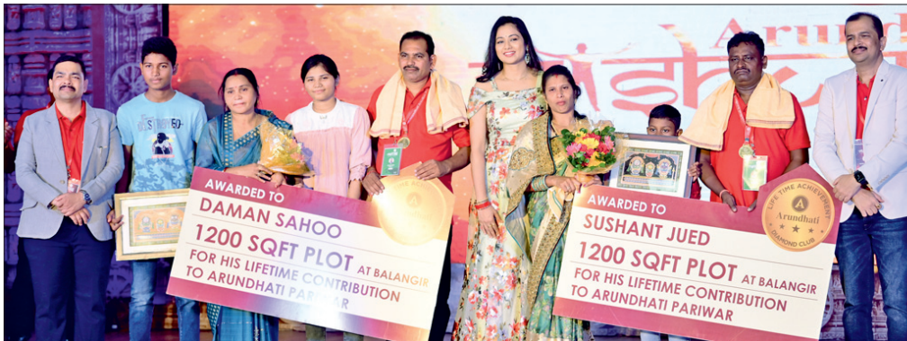
ବାର୍ଷିକ ଉତ୍ସବରେ କର୍ମଚାରୀଙ୍କୁ ବାସ୍ତବ୍ୟ ଜମି ଉପହାର

ପ୍ରମୁଖ ପ୍ରୟୋଗରେ ବ୍ୟବହାର କରାଯିବ। ସେହିଭଳି ଚିଠି ଆଲୁମିନିୟମ ରତ୍ନ ଗ୍ରାହକମାନଙ୍କୁ ଲୋ ସାଗ୍ର ଉକ୍ତ ଶକ୍ତି, ଉଚ୍ଚ ଶକ୍ତି ଓ ଅଧିକ ସ୍ଥାୟିତ୍ୱ ପ୍ରଦାନ କରିବ। ଏହି ଗୁଣଗୁଡ଼ିକ ହାଇ ଟେକ୍ନୋଲୋଜି ଗ୍ରାହକମାନଙ୍କ ଗ୍ରାହ୍ୟ ଓ ଅଧିକାଂଶ ପାଇଁ ଉପଯୋଗୀ ଓ ଉଚ୍ଚ ଉତ୍ପାଦନ ପାଇଁ ଉପଯୋଗୀ ହୋଇଥାଏ। ସେହିପରି ଏବଂ ୫୯ ଆଲୁମିନିୟମ ରତ୍ନ ଉକ୍ତ ଶକ୍ତି ଓ ଉଚ୍ଚ ଉତ୍ପାଦନ, ଉଚ୍ଚ ଶକ୍ତି ନିର୍ବାପନ ଓ ଉଚ୍ଚ କରୋଷ୍ଟି ଧାରଣରେ ସହାୟତା କରିଥାଏ। ବେଦାନ୍ତ ଆଲୁମିନିୟମର ବହୁ ପ୍ରକାର ଉତ୍ପାଦ ନୂତନ ଉତ୍ପାଦ ଓ ଉତ୍ପାଦନରେ ପ୍ରବେଶ ସମ୍ପର୍କରେ ଘୋଷଣା କରାଯାଇଛି। କମ୍ପାନୀର ନୂତନ ଉତ୍ପାଦନ ଚିଠି, ଏବଂ ୫୯ ଓ ୮୯ ଆଲୁମିନିୟମ ରତ୍ନ ଉତ୍ପାଦନ ଓ ୮୯ ଆଲୁମିନିୟମ ରତ୍ନ ଉତ୍ପାଦନ ପ୍ରକଳ୍ପ ଉପରେ ଉନ୍ନତ କରାଯାଇଛି। ଏପରିକି କମ୍ପାନୀ ଶକ୍ତି ଓ ଗ୍ରାହକମାନଙ୍କ ଉପଯୋଗୀ ପାଇଁ ଉତ୍ପାଦନ ଓ ଉତ୍ପାଦନରେ ଉନ୍ନତ କରାଯାଇଛି। ଏପରିକି ଉତ୍ପାଦନ ଓ ଉତ୍ପାଦନରେ ଉନ୍ନତ କରାଯାଇଛି। ଏପରିକି ଉତ୍ପାଦନ ଓ ଉତ୍ପାଦନରେ ଉନ୍ନତ କରାଯାଇଛି।