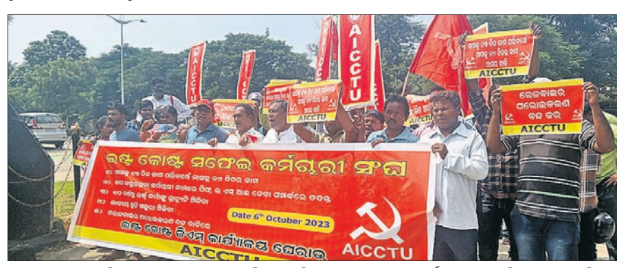
ଚନ୍ଦ୍ରଶେଖରପୁରସ୍ଥିତ ଇଷ୍ଟକୋଷ୍ଟ ରେଲ୍ୱେର ଜିଏମ୍ ଅଫିସ୍ ଆଗରେ ସଫେଇ କର୍ମଚାରୀମାନେ ବିକ୍ଷୋଭ କରୁଛନ୍ତି।

ମାସକୁ ୨୬ ଦିନ କାମ, ଇପିଏସ୍ ସହ ଇଏସ୍ଆଇ ଲାଗୁ, ସଫେଇ କର୍ମଚାରୀଙ୍କ ଲାଗି ବିଶ୍ରାମଗୃହ, ଗ୍ରାହ୍ୟକର୍ତ୍ତା ପ୍ରଦାନ ଓ ଠିକ ବୋନସ ପ୍ରଦାନ ପାଇଁ ଏଆଇସିସିମିସୁ ସହଯୋଗୀ ଇଷ୍ଟ କୋଷ୍ଟ ସଫେଇ କର୍ମଚାରୀ ସଂଘ ଦାବି କରିଛି। ଏହି ପରିପ୍ରସ୍ଥାବରେ ଶୁକ୍ରବାର ସଫେଇ କର୍ମଚାରୀମାନେ ଏକ ଶୋଭାଯାତ୍ରାରେ ବାହାରି ଜିଏମ୍ ଅଫିସ୍ ଘେରାଇ କରିବା ସହ ଧାରଣା ଦେଇଥିଲେ। ଏଆଇସିସିମିସୁର ରାଜ୍ୟ ସମ୍ପାଦକ