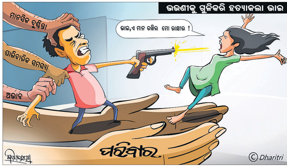
ଭଉଣୀକୁ ଗୁଳିକରି ହତ୍ୟାକଲ୍ଲା ଭାଇ