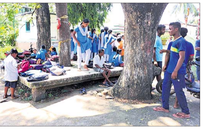
ବିଦ୍ୟାଳୟ ବାହାରେ ଛାତ୍ରଛାତ୍ରୀ ।

ଖଲିକୋଟ ବୁକ ଅନ୍ତର୍ଗତ ବିଜୁପାପୁର ପଞ୍ଚାୟତର ଚଣ୍ଡୀପୀଠ ଉଚ୍ଚପ୍ରାଥମିକ ବିଦ୍ୟାଳୟରେ ଶୁକ୍ରବାର ଦୁଇ ଜଣ ଶିକ୍ଷକଙ୍କ କାର୍ଯ୍ୟରେ ଅସନ୍ତୋଷ ପ୍ରକାଶ କରି ସେମାନଙ୍କ ବଦଳି ଦାବିରେ ସ୍କୁଲର ପୁଖ୍ୟ ଫାଟକରେ ତାଲା ପକାଇଥିଲେ ଗ୍ରାମବାସୀ। ସୂଚନା ଅନୁଯାୟୀ ଏହି ବିଦ୍ୟାଳୟରେ ପ୍ରଥମକୁ ଅଷ୍ଟମ ଶ୍ରେଣୀ ଯାଏଁ ଛାତ୍ରାଛାତ୍ରୀ ପାଠ ପଢ଼ନ୍ତି। ଏଠାରେ ୪ଜଣ ମହିଳା ଶିକ୍ଷୟିତ୍ରୀ ଏବଂ ଜଣେ ପୁରୁଷ ଶିକ୍ଷକ ଅଛନ୍ତି। ଗ୍ରାମବାସୀଙ୍କ କହିବା ଅନୁଯାୟୀ କେତେକ ଶିକ୍ଷୟିତ୍ରୀ ଠିକ ସମୟରେ ବିଦ୍ୟାଳୟକୁ ନ ଆସିବା, ପାଠ ପଢ଼ା ସମୟରେ ମୋବାଇଲ୍ ଗପିବା, ବିଦ୍ୟାଳୟ ପରିସର ଘାସ ଓ