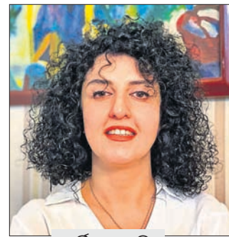
ନର୍ତ୍ତକୀ ମହମ୍ମଦ ଚିକିତ୍ସା ନୋବେଲ କମିଟି ନିଷ୍ପତ୍ତି ନେଇଛି। ତିସସମ୍ଭର ୧୦ରେ ତାଙ୍କୁ ପୁରସ୍କାର ଦାବୀରେ ୧୧ ନିୟୁତ ଯୁକ୍ତତ୍ୱ ଗ୍ରାହକ (ପାଖାପାଖି ୧ ନିୟୁତ ଡଲାର) ମିଳିବ। ନର୍ତ୍ତକୀ ଏକାଧାରରେ ଜଣେ ମାନବାଧିକାର ପ୍ରବକ୍ତା ଏବଂ ସ୍ୱାଧୀନତା ସଂଗ୍ରାମୀ। ଇରାନରେ ୯ ପୃଷ୍ଠା-୨

ମହିଳାମାନଙ୍କ ଅଧିକାର, ଗଣତନ୍ତ୍ର ପାଇଁ ଅଭିଯାନ ଚଳାଇବା ସହ ବହୁବର୍ଷ ଧରି ଇରାନରେ ମୁଖ୍ୟବନ୍ଧୁ ବିରୋଧରେ ଲଢ଼େଇ କରୁଥିବା ଅଧିକାର କର୍ମୀ ନର୍ତ୍ତକୀ ମହମ୍ମଦ ଚିକିତ୍ସ ବର୍ଷ ନୋବେଲ ଶାନ୍ତି ପୁରସ୍କାର ପାଇଁ ମନୋନୀତ ହୋଇଛନ୍ତି। ଶାନ୍ତି ପାଇଁ ନୋବେଲ ପାଇବାରେ ସେ ୧୯୯୮ ମହିଳା ନାରୀମାନଙ୍କ ଉପରେ ହେଉଥିବା ଅତ୍ୟାଚାର ବିରୋଧରେ ଲଢ଼େଇ କରି ତାଙ୍କୁ ଅନେକଥର କେଲ ସିବାକୁ ପଡ଼ିଛି। ମହିଳା ଅଧିକାର, ମାନବାଧିକାର ଏବଂ ସମସ୍ତଙ୍କ ପାଇଁ ସ୍ୱାଧୀନତା ନିମନ୍ତେ ସଂଘର୍ଷ କରିଆସୁଥିବା ନର୍ତ୍ତକୀଙ୍କୁ ନୋବେଲ ଶାନ୍ତି ପୁରସ୍କାର ପ୍ରଦାନ ନିମନ୍ତେ ନରଫ୍ରେଡ