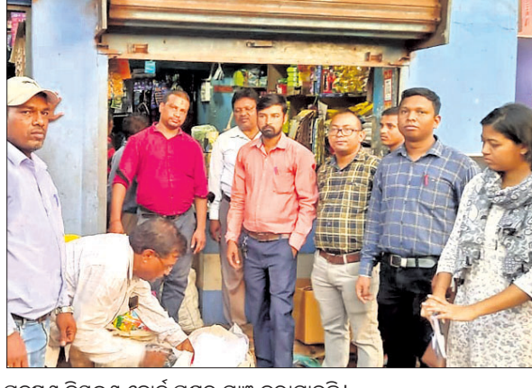
ପ୍ରତ୍ୟକ୍ଷ ନିୟନ୍ତ୍ରଣ ବୋର୍ଡ ପକ୍ଷରୁ ଯାଅ ଜରାଯାଇଛି।

ବୋକାନରେ ଯାଅ ଜରାଯାଇଥିଲା। ଯାଅ ବେଳେ ପ୍ରାୟ ଏକ କୁଇଲିଆରୁ ଉର୍ଦ୍ଧ୍ୱ ପାଣ୍ଡିକା ପକ୍ଷରୁ ଯୋଡ଼ା ସହରର ବିଭିନ୍ନ ବୋକାନଗୁଡ଼ିକରେ ଶୁକ୍ରବାର ଯାଅ ଜରାଯାଇଛି।