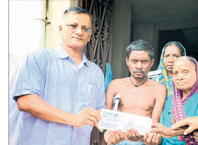
ଭିକ୍ଷାପୁର ବୁଦ୍ଧିଆଙ୍କୁ ସହାୟତା ଦେବା ପାଇଁ ଉପକ୍ରମ କରାଯାଇଛି ।