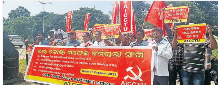
ଚନ୍ଦ୍ରଶେଖରପୁରସ୍ଥିତ ଇଷ୍ଟକୋଷ୍ଟ ରେଲ୍‌ୱେ ଜିଏମ୍ ଅଫିସ ଆଗରେ ସଫେଇ କର୍ମଚାରୀମାନେ ବିଶୋଭ କରୁଛନ୍ତି।

ମାସକୁ ୨୬ ଦିନ କାମ, ଇପିଏସ୍ ସହ ଇଏସ୍‌ଆଇ ଲାଗୁ, ସଫେଇ କର୍ମଚାରୀଙ୍କ ଲାଗି ବିଶ୍ରାମଗୃହ, ଗ୍ରାହ୍ୟକର୍ତ୍ତା ପ୍ରଦାନ ଓ ଠିକ ବୋନସ ପ୍ରଦାନ ପାଇଁ ଏଆଇସିସିଟିରୁ ସହଯୋଗ ଇଷ୍ଟ କୋଷ୍ଟ ସଫେଇ କର୍ମଚାରୀ ସଂଘ ଦାବି କରିଛି। ଏହି ପରିପ୍ରସ୍ତାବରେ ଶୁକ୍ରବାର ସଫେଇ କର୍ମଚାରୀମାନେ ଏକ ଶୋଭାଯାତ୍ରାରେ ବାହାରି ଜିଏମ୍ ଅଫିସ ଘେରାଇ କରିବା ସହ ଧାରଣା ଦେଇଥିଲେ। ଏଆଇସିସିଟିରୁ ରାଜ୍ୟ ସମ୍ପାଦକ