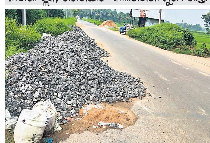
ରାସ୍ତା କଟକରେ ମେଟାଲ ଓ ବାଲି ଗଦା ହୋଇ ରହିଛି ।

ନାଉଗାଁ ବ୍ଲକ୍, ଶିଖରଯାତ-ବାଲିଭଞ୍ଜରା ମୁଖ୍ୟ ରାସ୍ତା