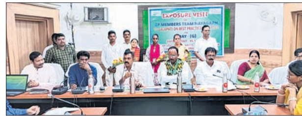
ଗସ୍ତରୁ ଫେରିବା ପରେ ଜିଲା ପରିଷଦ ସଦସ୍ୟମାନେ ।

ନିର୍ମିତାକୁ ଏପରି ପଦକ୍ଷେପ ନିଆଯାଇଛି। ଅନୁପକ୍ଷରେ ପ୍ରଧାନ ଶିକ୍ଷକଙ୍କୁ କହିଛନ୍ତି ଯୁକ୍ତଦିନ ପୂର୍ବେ ଖଲ୍ଲିକୋଟ ଏବଂ ବିଦ୍ୟାଳୟକୁ ଆସି ବିଦ୍ୟାଳୟ ପରିଚାଳନା କମିଟି ଏବଂ ସ୍କୁଲ ଶିକ୍ଷକମାନଙ୍କୁ ଶିକ୍ଷକ ସହ ଆଲୋଚନା କରି ଯାଇଥିଲେ ଏବଂ ଅଭିଯୋଗ ଗ୍ରହଣ କରିଥିଲେ। ବିଦ୍ୟାଳୟରେ ଶିକ୍ଷକମାନଙ୍କୁ ମଧ୍ୟରେ ମନମାଳିନ୍ୟ ରହିଥିବା ଦେଖାଯାଇଛି। ଶୁକ୍ରବାର ସିଆରସି ନିର୍ବାହକ ମିଶ୍ର, ଖଲ୍ଲିକୋଟ ବିଭାଗ ସଦସ୍ୟମାନ ପକ୍ଷୀ ବିଦ୍ୟାଳୟରେ ପହଞ୍ଚି ଗ୍ରାମବାସୀ, ସ୍କୁଲ ଏସଏମସି ସହ ଆଲୋଚନା କରି ଖୁବ୍ ଶୀଘ୍ର ପଦକ୍ଷେପ ନିଆଯିବ ବୋଲି ପ୍ରତିଶ୍ରୁତି ଦେବାପରେ ବିଦ୍ୟାଳୟ ସ୍ୱାଭାବିକ ଭାବେ ଖୋଲିଥିଲା।