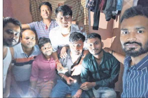
ସିକିମ୍‌ରେ ଫସି ରହିଥିବା ଯୁବକମାନେ।