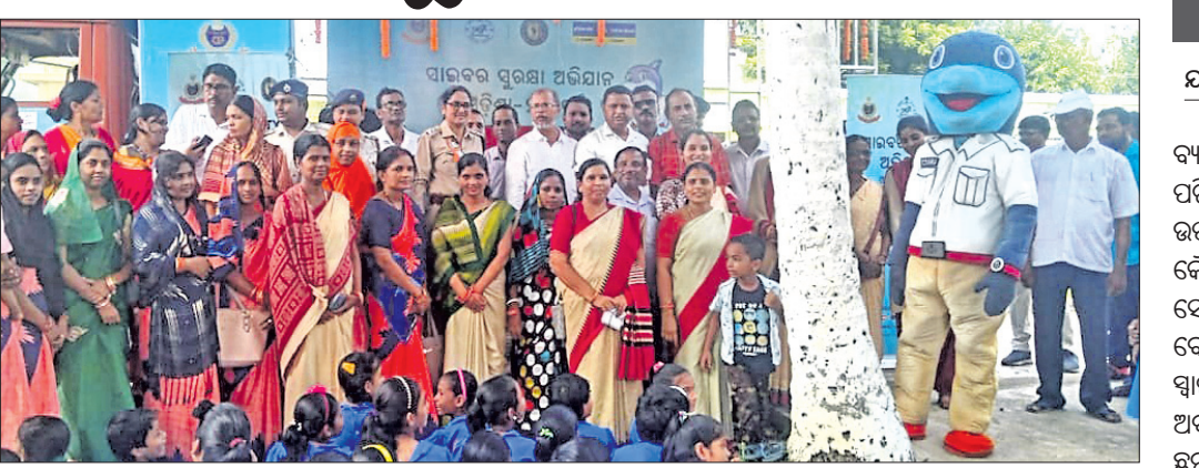
ଏକ ବିଦ୍ୟାଳୟରେ ସାଇବର ସୁରକ୍ଷା ସଚେତନତା କରାଯାଇଛି।

ବାଲିଚନ୍ଦ୍ରପୁର, ୨୧୦ (ବିରିକା ପ୍ରସାଦ ସାହୁ) ମହାବିଦ୍ୟାଳୟ, ପତରାଜପୁର ସରକାରୀ ଉଚ୍ଚ ବିଦ୍ୟାଳୟ, ବାଲିଚନ୍ଦ୍ରପୁର ବଜାର ମଧ୍ୟ ଭାଗ ଓ ୫୩୩ ନଂ. କାଟୋଇ ରାଜପଥର ଶୁକ୍ରବାର ସାଇବର ସୁରକ୍ଷା ସଚେତନତା କାର୍ଯ୍ୟକ୍ରମ ଅନୁଷ୍ଠିତ ହୋଇଯାଇଛି। ଏନେଇ ଏକ ସଚେତନତା ଗାଡ଼ି ମାସକର୍ତ୍ତ ସହ ବିଭିନ୍ନ ସ୍ଥାନ ଭ୍ରମଣ କରି ଡାକବାକି ଯନ୍ତ୍ର ଓ ପଥପ୍ରାଚ୍ଚ ନାଟକ ମାଧ୍ୟମରେ ଜନସାଧାରଣଙ୍କୁ ସଚେତନ କରାଯାଇଛି। ଏହାସହ ଆନା ଅନ୍ତର୍ଗତ ଉକ୍ତ କାର୍ଯ୍ୟକ୍ରମ ବାଲିଚନ୍ଦ୍ରପୁର ସାହାଯ୍ୟପୁର