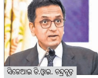
ସିଜେଆଇ ଡି.ଓ.ଇ. ଚନ୍ଦ୍ରଚୂଡ଼