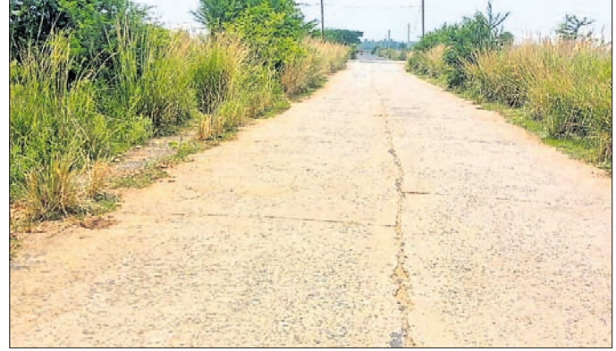
୨୦ ନଂ. ଏନ୍‌ଏଚ୍‌ରେ ବୁଲକଡ଼ରେ ଅନାବନା ଗଛ ଉଠିଛି।