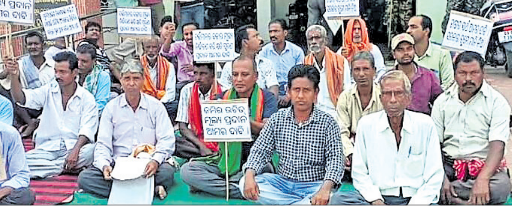
କ୍ଷତିପୂରଣ ଦାବିରେ ଧାରଣାରେ ବସିଥିବା ଗାଈକରିମାନେ।

ଯାଜପୁର ଜିଲାର ୨୦ ନୟର ଜାତୀୟ ରାଜପଥ କୁଆଖୁଆଠାରୁ କର୍ମାଗୋଲା ପର୍ଯ୍ୟନ୍ତ ସମ୍ପ୍ରଦାୟ ନିମନ୍ତେ ଜମି ଅଧିଗ୍ରହଣ କାର୍ଯ୍ୟ କାରି ରହିଛି। ଏଥିପାଇଁ ଯାଜପୁର ପୌରାଞ୍ଚଳ ୫ କି.ମି. ବ୍ୟାପାର୍ଚ୍ଚ ପରିମିତ ଅଞ୍ଚଳ ତଥା ଅବଦଳପୁରଠାରୁ ମିରଗାନ୍ଧପୁରର ଗାଈକରିକୁ ଅଧିଗ୍ରହଣ ପାଇଁ ଜାତୀୟ ରାଜପଥ କର୍ତ୍ତୃପକ୍ଷଙ୍କ ତରଫରୁ ନୋଟିସ କରାଯାଇଛି। ତେବେ ଦର କମ୍ ଥିବା ଜାଣିବା ପରେ ଗାଈକରିମାନେ ବିରୋଧ କରିଛନ୍ତି। ତେଣୁ ପୌରାଞ୍ଚଳ ଓ ସହରାଞ୍ଚଳ ଅନୁନ ୫କି.ମି. ବ୍ୟାପାର୍ଚ୍ଚ ପରିମିତ ଅଞ୍ଚଳର ସମସ୍ତ ଗାଈକରି ଧାର୍ଯ୍ୟ ମୂଲ୍ୟକୁ ସମାନ ହିସାବରେ ସ୍ଥିର କରି କ୍ଷତିପୂରଣ ପ୍ରଦାନ ଦାବିରେ ଶୁକ୍ରବାର ଅଞ୍ଚଳର ଗାଈକରିମାନେ ଜିଲ୍ଲାପାଳଙ୍କ କାର୍ଯ୍ୟାଳୟ ସମ୍ମୁଖରେ ଧାରଣା ଦେଇଛନ୍ତି।