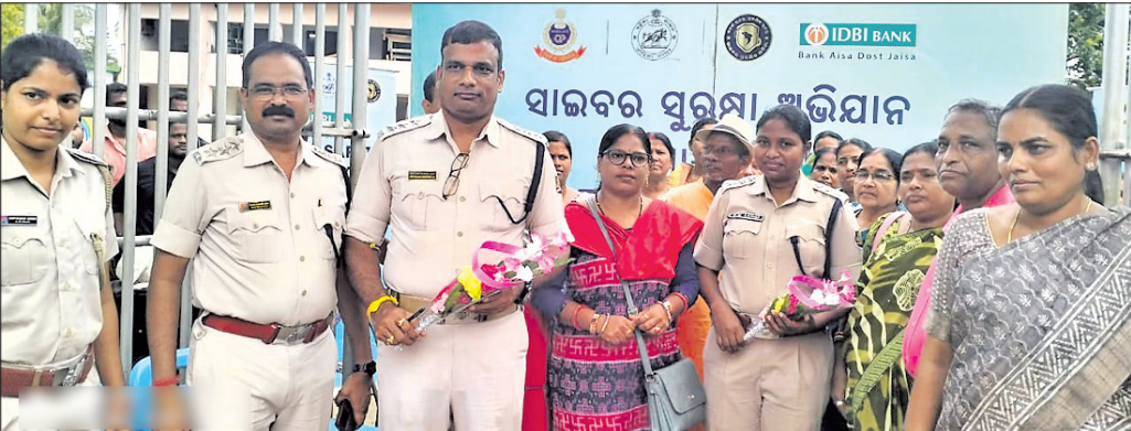
ରାଜନଗରରେ ସାଇବର ସୁରକ୍ଷା ସଚେତନତା ରଥକୁ ସାଗତ କରାଯାଇଛି ।

ରାଜନଗର, ୨୧୦ (ଭାଷ୍ଟବ ରାଉତରାୟ) ସଚେତନତା ହିଁ ସୁରକ୍ଷା । ସାଇବର ଅପରାଧ ପୁରା ବିଷୟବସ୍ତୁ ପାଇଁ ଆହ୍ୱାନ ସୃଷ୍ଟି କରିଛି । କେବଳ ସଚେତ ଓ ସଚେତନତା ଦ୍ୱାରା ହିଁ ଏହାର ମୁକାବିଲା କରାଯାଇପାରିବ । ଏହି ବାର୍ତ୍ତା ନେଇ କେନ୍ଦ୍ରାପଡ଼ା ଜିଲ୍ଲା ପୋଲିସ୍