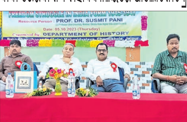
ଆଲୋଚନାଚକ୍ରରେ ଯୋଗଦେଇଥିବା ଅତିଥିମାନେ।