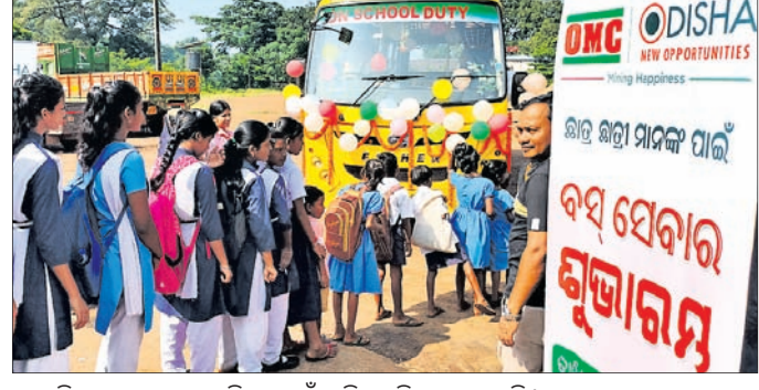
ସ୍କୁଲ ପିଲାମାନେ ବସରେ ଯିବା ପାଇଁ ଧାଡ଼ିରେ ଠିଆ ହୋଇଛନ୍ତି।