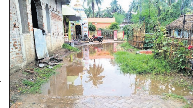
ନିର୍ମାଣରେ ତ୍ରୁଟି ଯୋଗୁ ଗାଁ ରାସ୍ତାରେ ପାଣି ଜମି ରହୁଛି ।

ଗ୍ରାମବାସୀ ବାରମ୍ବାର ବ୍ଲକ୍ ପ୍ରଶାସନ, କେଲ ଓ ସରପଞ୍ଚଙ୍କ ନିକଟରେ ଅଭିଯୋଗ କଲେ ମଧ୍ୟ କୌଣସି ସୁଫଳ ମିଳୁନାହିଁ । ଅନ୍ୟପକ୍ଷରେ ଖଡ଼ିଆଣ୍ଡା ପଞ୍ଚାୟତ ଦାୟିତ୍ୱରେ ଥିବା ଯତ୍ନା ଦିନା କୌଣସି ପୁଲିନିରେ ବ୍ୟବହାର ଅନୁପଯୋଗୀ ରାସ୍ତା