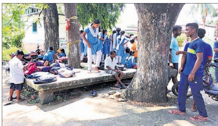
ବିଦ୍ୟାଳୟ ବାହାରେ ଛାତ୍ରଛାତ୍ରୀ । ବିଦ୍ୟାଳୟ ପରିସର ଘାସ ଓ ଅନାବନା ରକ୍ଷା ପାଇଁ ଛାତ୍ରଛାତ୍ରୀଙ୍କୁ ଶିକ୍ଷା ଦିଆଯାଇଛି ।

ନିର୍ମିତାକୁ ଏପରି ପଦକ୍ଷେପ ନିଆଯାଇଛି। ଅନୁପକ୍ଷରେ ପ୍ରଧାନ ଶିକ୍ଷକଙ୍କୁ କହିଛନ୍ତି ଯୁକ୍ତଦିନ ପୂର୍ବେ ଖଲ୍ଲିକୋଟ ଏବଂ ବିଦ୍ୟାଳୟକୁ ଆସି ବିଦ୍ୟାଳୟ ପରିଚାଳନା କମିଟି ଏବଂ ସ୍କୁଲ ଶିକ୍ଷକମାନଙ୍କୁ ଶିକ୍ଷକ ସହ ଆଲୋଚନା କରି ଯାଇଥିଲେ ଏବଂ ଅଭିଯୋଗ ଗ୍ରହଣ କରିଥିଲେ। ବିଦ୍ୟାଳୟରେ ଶିକ୍ଷକମାନଙ୍କୁ ମଧ୍ୟରେ ମନମାଳିନ୍ୟ ରହିଥିବା ଦେଖାଯାଇଛି। ଶୁକ୍ରବାର ସିଆରସି ନିର୍ବାହକ ମିଶ୍ର, ଖଲ୍ଲିକୋଟ ବିଭାଗ ସଦସ୍ୟମାନ ପକ୍ଷୀ ବିଦ୍ୟାଳୟରେ ପହଞ୍ଚି ଗ୍ରାମବାସୀ, ସ୍କୁଲ ଏସଏମସି ସହ ଆଲୋଚନା କରି ଖୁବ୍ ଶୀଘ୍ର ପଦକ୍ଷେପ ନିଆଯିବ ବୋଲି ପ୍ରତିଶ୍ରୁତି ଦେବାପରେ ବିଦ୍ୟାଳୟ ସ୍ୱାଭାବିକ ଭାବେ ଖୋଲିଥିଲା।