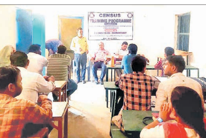
ପ୍ରଶିକ୍ଷଣ ଶିବିରରେ ଉପସ୍ଥିତ ଯୁବକମାନଙ୍କୁ ପ୍ରଶିକ୍ଷଣ ପ୍ରଦାନ କରାଯାଇଛି ।