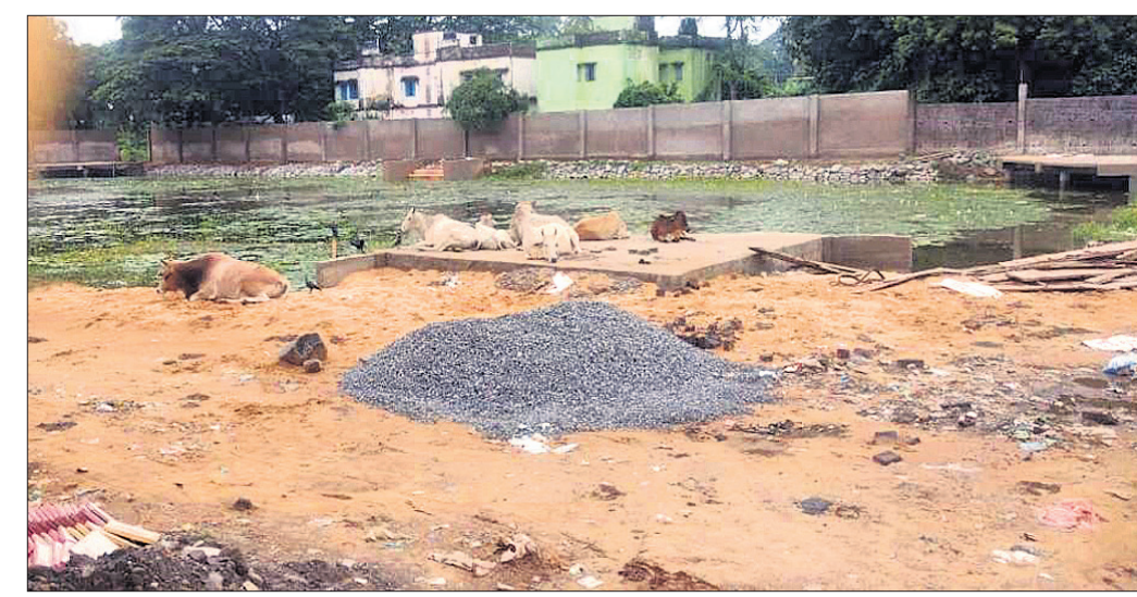
ପଟ୍ଟାମୁଖାଇ କଟକର ପୋଖରୀ କାର୍ଯ୍ୟ ସରି ନ ଥିବାରୁ ଏହା କଟକରେ ପରିପୂର୍ଣ୍ଣ ହୋଇଛି ।

ମାମଲା ରୁଜୁ କରିଥିଲେ । ପଟ୍ଟାମୁଖାଇ ତହସିଲଦାର, ମୁନିସିପାଲିଟି ନିର୍ବାହୀ ଅଧିକାରୀ, ଉପଜିଲ୍ଲାପାଳ ଓ ଜିଲ୍ଲାପାଳଙ୍କ ବିରୋଧରେ ମାମଲା ରୁଜୁ କରିଥିଲେ । ଏହାର କବାବରେ ପକ୍ଷମାନେ ଲୋକ ଅବାଳତରେ ହାକର ହୋଇ ପୋଖରୀର ପୁନର୍ନିର୍ମାଣ, ସାମା ନିର୍ଦ୍ଦେଶ ଓ କ୍ଷତି ପରିବର୍ତ୍ତନ ପାଇଁ ଲିଖିତ ପ୍ରତିଶ୍ରୁତି ଦେଇଥିଲେ । ତେବେ ପୋଖରୀର ମାପରୂପ କରାଯାଇ ୧.୨୫ ଡିଗ୍ରୀଲ ଜାଗା ଚିହ୍ନଟ କରାଯାଇ ବଗାୟତରୁ ପୋଖରୀ ଜଳାଶୟ କ୍ଷତି ପରିବର୍ତ୍ତନ କରାଯାଇଥିଲା । ଏହାର ଖନନ ପାଇଁ ରାଜ୍ୟ ସରକାର ୧ କୋଟି ୯୨ ଲକ୍ଷ ଟଙ୍କା ପ୍ରଦାନ କରିଥିଲେ । କିନ୍ତୁ ଏହି କାମ ଠିକ୍ ଭାବେ କରା ନ ଯିବାରୁ ଏବେ କଟକର ପୋଖରୀ ବିଜେ ଅଲିଆ, ଆର୍ବିଜନା ପତି କଟଡ଼ା ପୋଖରୀରେ ପରିଣତ ହୋଇଛି । ଅଳ୍ପ ପାଣି ଥିବାରୁ ପାଣି ପତ୍ତିଗ୍ରହଣମୟ ଦେଇଛନ୍ତି । ମାତ୍ର ପୌର ନିର୍ବାହୀ ପ୍ରତି ସହରରେ ଜଳାଶୟ ରହିବ ବୋଲି ପୁଖ୍ୟମନ୍ତ୍ରୀ ନବୀନ ପଟ୍ଟନାୟକ ନିର୍ଦ୍ଦେଶ ଦେଇଛନ୍ତି ।