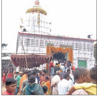
ଅଲି, ୨୧୦ (ବନମାଳା ସେନାପତି)

ଶ୍ରୀଲକ୍ଷ୍ମୀବରାହ ଜୀଉ ମନ୍ଦିରର ହେବ ସୌନ୍ଦର୍ଯ୍ୟକରଣ