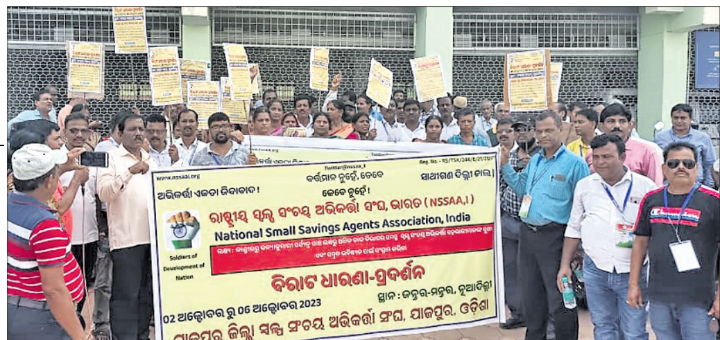
ଜିଲ୍ଲାପାଳଙ୍କ କାର୍ଯ୍ୟାଳୟ ସମ୍ମୁଖରେ ରାଷ୍ଟ୍ରୀୟ ସ୍ତରର ଶୋଭାଯାତ୍ରା ।