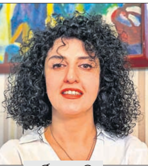
ନର୍ତ୍ତକୀ ମହମ୍ମଦ ଚିକିତ୍ସା ନୋବେଲ କମିଟି ନିଷ୍ପତ୍ତି ନେଇଛି। ତିସେମ୍ବର ୧୦ରେ ତାଙ୍କୁ ପୁରସ୍କାର ଦାବୀରେ ୧୧ ନିୟୁତ ଯୁକ୍ତରାଷ୍ଟ୍ର ଦାଲାର (ପାଖାପାଖି ୧ ନିୟୁତ ଡଲାର) ମିଳିବ। ନର୍ତ୍ତକୀ ଏକାଧାରରେ ଜଣେ ମାନବାଧିକାର ପ୍ରବନ୍ଧ ଏବଂ ସ୍ୱାଧୀନତା ସଂଗ୍ରାମୀ। ଇରାନରେ ୯ ପୃଷ୍ଠା-୨

ମହିଳାମାନଙ୍କ ଅଧିକାର, ଗଣତନ୍ତ୍ର ପାଇଁ ଅଭିଯାନ ଚଳାଇବା ସହ ବହୁବର୍ଷ ଧରି ଇରାନରେ ମୁଖ୍ୟବନ୍ଧୁ ବିରୋଧରେ ଲଢ଼େଇ କରୁଥିବା ଅଧିକାର କର୍ମୀ ନର୍ତ୍ତକୀ ମହମ୍ମଦ ଚିକିତ୍ସ ବର୍ଷ ନୋବେଲ ଶାନ୍ତି ପୁରସ୍କାର ପାଇଁ ମନୋନୀତ ହୋଇଛନ୍ତି। ଶାନ୍ତି ପାଇଁ ନୋବେଲ ପାଇବାରେ ସେ ୧୯୯୮ ମହିଳା ନାରୀମାନଙ୍କ ଉପରେ ହେଉଥିବା ଅତ୍ୟାଚାର ବିରୋଧରେ ଲଢ଼େଇ କରି ତାଙ୍କୁ ଅନେକଥର କେଲ ସିବାକୁ ପଡ଼ିଛି। ମହିଳା ଅଧିକାର, ମାନବାଧିକାର ଏବଂ ସମସ୍ତଙ୍କ ପାଇଁ ସ୍ୱାଧୀନତା ନିମନ୍ତେ ସଂଘର୍ଷ କରିଆସୁଥିବା ନର୍ତ୍ତକୀଙ୍କୁ ନୋବେଲ ଶାନ୍ତି ପୁରସ୍କାର ପ୍ରଦାନ ନିମନ୍ତେ ନରଓଡ଼େର