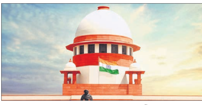
ଭିଜିଟି ଖଣ୍ଡପୀଠ ଏନେଇ ବିହାର ସରକାରଙ୍କୁ ନୋଟିସ୍ ଜାରି କରିବା ସହ ପରବର୍ତ୍ତୀ ଶୁଣାଣି ୨୦୨୪ ଜାନୁଆରୀକୁ ଆରମ୍ଭ କରିବେ।