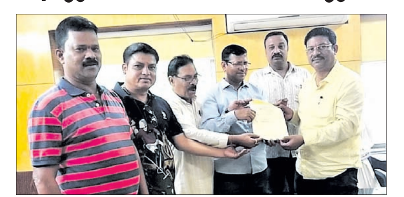
ସିଦ୍ଧି ଯୋଗାଯୋଗ ପକ୍ଷରୁ ଦାବିପତ୍ର ପ୍ରଦାନ କରାଯାଇଛି।