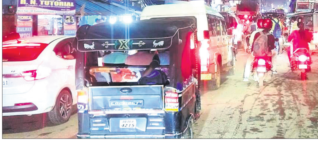
ବ୍ୟାସନଗର ଚୋରବାହକ ନିକଟରେ ଗ୍ରାଫିକ କାମ।

ଯାଜପୁର ଜିଲାର ବୁଲ ପ୍ରମୁଖ ସହର ଯାଜପୁର ଚାଉଳ ଏବଂ ବ୍ୟାସନଗରରେ ରୂପରେଖ ବଦଳିବାର ଲାଗିଛି। କିନ୍ତୁ ଏହି ବୁଲ ସହରରେ ଗ୍ରାଫିକ ସମସ୍ୟା କିଛି ନୁହାଁ କଥା ରୁହେଁ ପୌର ପରିଷଦ, ପ୍ରଶାସନ ଓ ପୋଲିସର ଉଦ୍ୟୋଗିତା ସହରସ୍ତରୀୟ ସମସ୍ତ ରାସ୍ତା କଡ଼କୁ ବଡ଼ ବଡ଼ ବୋକାଳ ଓ ବ୍ୟବସାୟୀ ପ୍ରତିଷ୍ଠାନ ଜବରଦସ୍ତୀ କରିଛନ୍ତି। ସହରର ଅଣଓସିଆ ରାସ୍ତା ସହ ବାଲି, ମୋରମ ଆଦି ଭାରିପାନ ଚଳାଚଳ ସହରବାସୀ ତଥା ଜ୍ଞାତ୍ରାହାତ୍ରଙ୍କ ପାଇଁ ବିପଦ ହୋଇଛି। ଏତିହାସିକ ତଥା ଅତି ପୁରାତନ ସହରସ୍ତରୀୟ ହୋଇଥିଲେ ହେଁ ପୌରସମ୍ମା ପକ୍ଷରୁ ଆବଶ୍ୟକ ଯୋଜନା ହୋଇ ନ ଥିବାରୁ ଏହାର ପରିଣାମ ଉଭୟ ସହରବାସୀଙ୍କ ପାଇଁ କାଳ ହେଉଛି। ଜିଲାର କଳିଙ୍ଗନଗରରେ ନବେ ଦଶକ ପରେ ଶିଳ୍ପ ପ୍ରତିଷ୍ଠା ଆରମ୍ଭ ହୋଇଥିଲା। ସେହିଦିନଠାରୁ ବ୍ୟାସନଗରର ଆୟତନ ଓ ଲୋକ ସଂଖ୍ୟା ବୃଦ୍ଧି ହୋଇ ବହୁଛି। ଏହାବଦ୍ଧ ଏକାଧିକ ଖଣି କମ୍ପାନୀ ଜିଲାର କାଳିଆପାଣି ଅଞ୍ଚଳରେ କ୍ରୋମାଇଟ ଉତ୍କାଳନ କରୁଛି। ଏବେ ସହରର ଲୋକସଂଖ୍ୟା ପ୍ରାୟ ବୁଲ ଲକ୍ଷ ପାଖାପାଖି ହୋଇଛି। କ୍ରମଶଃ ଶ୍ରମ ଉପନିବେଶନା, ଯାଜପୁର,୬୧୦(ହର୍ଷବର୍ଦ୍ଧନ ବେହେରା)