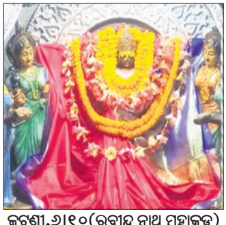
ଜଗଣୀ, ୬।୧୦ (ରବୀନ୍ଦ୍ର ନାଥ ମହାକୁଡ଼)

ଜଗଣୀର ଆରାଧ୍ୟ ଦେବୀ ମା' ଉତ୍ତରାୟଣୀଙ୍କ ପୀଠରେ ଆରମ୍ଭ ହୋଇଛି ଷୋଳପୂଜା। ପୂଜାସମ୍ପାଦନା ପାଇଁ ନିର୍ଦ୍ଦେଶ ଦିଆଯାଇଛି।