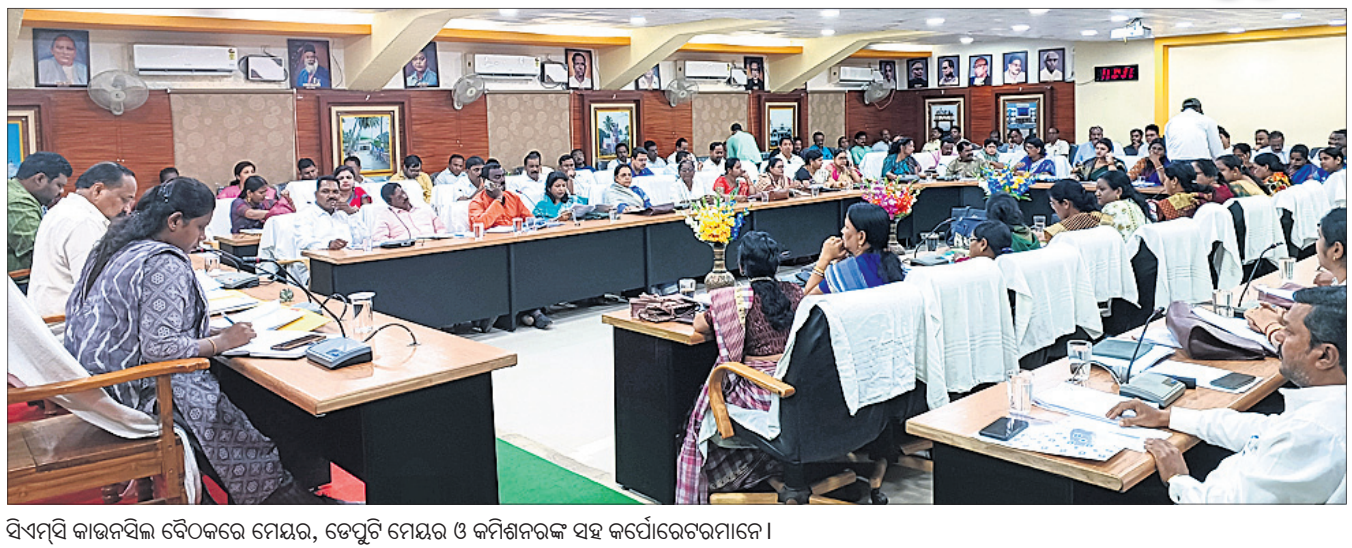
ସିଏମ୍‌ସି କାର୍ଯ୍ୟକ୍ରମ ବୈଠକରେ ମେୟର, ଡେପ୍ୟୁଟି ମେୟର ଓ କର୍ମଚାରୀଙ୍କ ସହ କର୍ମଚାରୀମାନେ।