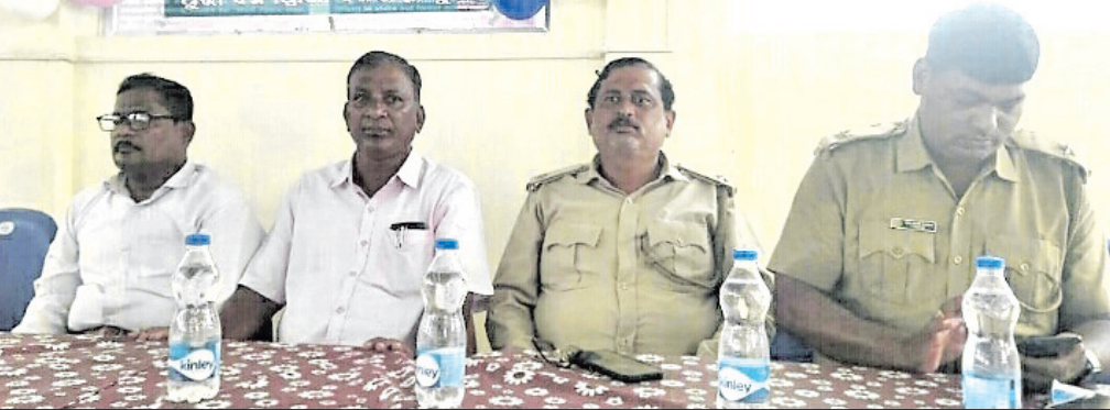
ବନ୍ୟପ୍ରାଣୀ ସପ୍ତାହ ପାଳନ କାର୍ଯ୍ୟକ୍ରମରେ ମଞ୍ଚାସୀନ ଅତିଥି ।

ବନ୍ୟପ୍ରାଣୀ ସୁରକ୍ଷା ଆଇନ ପ୍ରଣୟନ ସହ, ବନ୍ୟଜନ୍ତୁମାନଙ୍କୁ ସୁରକ୍ଷା ଦେବା ପାଇଁ ଏହି ଆଇନର ମୂଳ ଉଦ୍ଦେଶ୍ୟ ବୋଲି ପ୍ରକାଶ କରିଥିଲେ। ସମସ୍ତଙ୍କର ମିଳିତ ସହଯୋଗରେ ପ୍ରାଣୀମାନଙ୍କର ସୁରକ୍ଷା ଓ ସଂରକ୍ଷଣ ଜରୁରୀ ବୋଲି ସମ୍ମିଳିତ ଭାବେ ମତପ୍ରକାଶ ପାଇଥିଲା। ଜଙ୍ଗଲ, ପରିବେଶ ଓ ଜଳ ସାହୁ ପରିବର୍ତ୍ତନ ବିଭାଗ ଦ୍ୱାରା ଆୟୋଜିତ ଏହି ସମାବେଶରେ, ବିଦ୍ୟାଳୟର ଛାତ୍ରଛାତ୍ରୀ, ମହିଳା ଦଳ, ବନ ବିଭାଗର କର୍ମଚାରୀ, ବନ ବିଶ୍ୱାଳ ଯୋଗଦେଇଥିଲେ। ବସ୍ତାମାନେ ୧୯୭୨ ମସିହାରେ ଓଡ଼ିଶା ସରକାରଙ୍କ