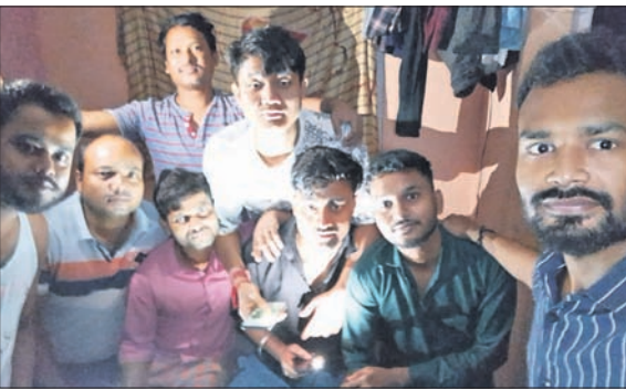
ସିକିମ୍‌ରେ ଫସି ରହିଥିବା ସୁନ୍ଦରମାନେ।

ଇଲାକାର ଖୁଲ୍‌ଲେ ବୁକର ଖୁଲ୍‌ଲେ ୧୫୦ ମିଟର ଦୂରରେ ହୋଇଛି ଏହି ପ୍ରକାଶକରୀ ବନ୍ଦ୍ୟା। ସେମାନେ ଶ୍ଯାୟ କାର୍ଯ୍ୟରେ ରହିଥିବା ବେଳେ ଜଳବନ୍ଦୀ