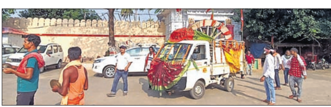
ଆଗାଯାଇଛି। ସାକ୍ଷୀଗୋପାଳ ମନ୍ଦିର ସେବାୟତ ସଂଘର ଅନୁରୋଧକ୍ରମେ ଶ୍ରୀମନ୍ଦିର ପ୍ରଶାସନ ପକ୍ଷରୁ ପ୍ରଦାନ କରାଯାଇଥିବା ରଥ ଚକକୁ ଆଧ୍ୟାତ୍ମିକ

ସାକ୍ଷୀଗୋପାଳ, ୬ ଅକ୍ଟୋ (ବିଶୋଇ ମହାପାତ୍ର/ପ୍ରଶାନ୍ତ କୁମାର ବାରିକ): ଶ୍ରୀକାଳୀମନ୍ଦିର ଦର୍ଶନ ପାଇଁ ସାକ୍ଷୀଗୋପାଳ ମନ୍ଦିରରେ ରଥାୟିତ ଶ୍ରୀବଳଭଦ୍ର ଜାଉଜ ତାଳଧ୍ୱଜ ରଥଚକ ଗୋଟିଏ ଚକ। ଶ୍ରୀକ୍ଷେତ୍ରରୁ ଶୁକ୍ରବାର ଶାରଦୀୟ ପୂଜା ପ୍ରାରମ୍ଭରେ ରଥ ଚକଟି ସାକ୍ଷୀଗୋପାଳ ମନ୍ଦିରକୁ