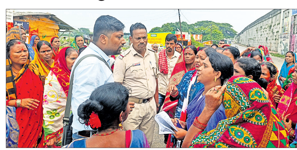
ଉତ୍ତମ ମହିଳାଙ୍କୁ ପୋଲିସ୍ ବୁଝାଶୁଝା କରୁଛି ।

ପିପିଲି ଜଗନ୍ନାଥପୁର ପଞ୍ଚାୟତରେ ନିର୍ମାଣ ଶକ୍ତି କାଫେରେ ବେଆଇନ୍ ଗୃହ ନିର୍ମାଣକୁ ବିରୋଧ କରି ସ୍ତ୍ରୀମାନଙ୍କ ଶତାଧିକ ମହିଳା ଧାରଣା ଦେଇଥିଲେ। ବେଆଇନ୍ କାଫେ ନିର୍ମାଣକୁ ବିରୋଧ କରି ମହିଳାଙ୍କ ଆନ୍ଦୋଳନ ଚାଲୁଥିବାବେଳେ ଆନ୍ତୋଶର ଶିକାର ହୋଇଥିଲେ ଯାକପୁର ଅଞ୍ଚଳକୁ ଆସିଥିବା ସରକାରୀ ଅଧିକାରୀ। ପିପିଲି ରୁକ୍ ବିପିଏମ୍‌ଙ୍କ ପ୍ରାୟୋଜିତ ବୈଠକରେ ଯୋଗଦେଇ ଯାକପୁର ଅଞ୍ଚଳର ପ୍ରାୟ ୧୫ରୁ ଉର୍ଦ୍ଧ୍ୱ ରୁକ୍ ଓ ନିଶନ ଶକ୍ତି କର୍ମଚାରୀମାନେ ହତହତ ହୋଇଥିଲେ। ପରିସ୍ଥିତି ଏଭଳି ହୋଇଥିଲା ଯେ ରାଜରାଷ୍ଟ୍ର ଉପରେ ପ୍ରାୟ ଅଧରାଘା କାଳ ମହିଳାଙ୍କ ଦ୍ୱାରା ଅଟକ ରହିଥିଲେ ମହିଳା ଓ ପୁରୁଷ କର୍ମଚାରୀ। ସ୍ଥାନୀୟ ଜନସାଧାରଣ ଓ