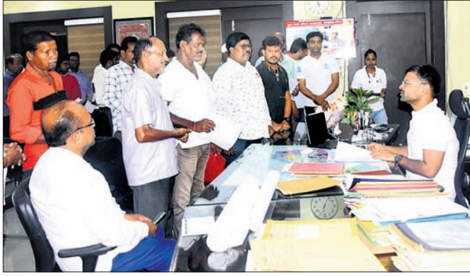
ଅଭିଭାବକମାନେ ଜିଲ୍ଲାପାଳ ସମ୍ମୁଖେ ଦାବିପତ୍ର ପ୍ରଦାନ କରୁଛନ୍ତି।

ପୁରୀ ସହରରେ ଅଙ୍ଗନୱାଡ଼ି କେନ୍ଦ୍ର ସମସ୍ୟା ନେଇ ଅଭିଭାବକମାନେ ଶୁକ୍ରବାର ଆନ୍ଦୋଳନକୁ ଓହ୍ଲାଇଥିଲେ। ସେମାନେ ଜିଲ୍ଲାପାଳ ସମ୍ମୁଖେ ଏକ ଦାବିପତ୍ର ଦେଇଛନ୍ତି। ଦାବିପତ୍ରରେ ଉଲ୍ଲେଖ କରାଯାଇଛି ଯେ, ପୁରୀ ସହରରେ ୮୦ଟି ଅଙ୍ଗନୱାଡ଼ି କେନ୍ଦ୍ର କାର୍ଯ୍ୟକ୍ରମ ରହିଥିବା ବେଳେ ମାତ୍ର ୨୩ଟି ଅଙ୍ଗନୱାଡ଼ି କେନ୍ଦ୍ରର ନିଜସ୍ୱ ଗୃହ ଅଛି। ତନ୍ମଧ୍ୟରୁ ୨୨ଟିରେ ଶୌଚାଳୟ ଓ ପାନୀୟ ଜଳ ସୁବିଧା ହୋଇନାହିଁ। ଅବଶିଷ୍ଟ ୫୭ଟି ଅଙ୍ଗନୱାଡ଼ି କେନ୍ଦ୍ରର ନିଜସ୍ୱ ଗୃହ ନ ଥିବାରୁ ଶିଶୁମାନେ ବହୁ ଅସୁବିଧାର ସମ୍ମୁଖୀନ ହେଉଛନ୍ତି। ସମସ୍ତ ଅଙ୍ଗନୱାଡ଼ି କେନ୍ଦ୍ରକୁ ନିଜସ୍ୱ ଗୃହ ଦେବା ପାଇଁ ଅଙ୍ଗନୱାଡ଼ି କେନ୍ଦ୍ରର ସ୍ଥାନ ଅନୁମୋଦନ ପାଇଁ ତତ୍ତ୍ୱସ୍ୱଳପକାରକୁ ଅନୁରୋଧ କରାଯାଇଥିଲେ ମଧ୍ୟ ପଦକ୍ଷେପ ନିଆଯାଇନାହିଁ। ଫଳରେ ପାଇଁ ଉପଯୁକ୍ତ ପରିବେଶ ଓ ଖେଳପଡ଼ିଆ ଅଭାବ ସାଙ୍ଗକୁ ରୋଗେଶ୍ୱଳ ସମସ୍ୟା ରହିଛି। ସେହିପରି ଶୌଚାଳୟ ବ୍ୟବସ୍ଥା ନାହିଁ। ବର୍ତ୍ତମାନ ପୁରୀ ୫୭ଟି ଅଙ୍ଗନୱାଡ଼ି କେନ୍ଦ୍ରରୁ ୩୯ଟି ନିର୍ମାଣ ୯୦ ପ୍ରତିଶତ ସରିଛି।