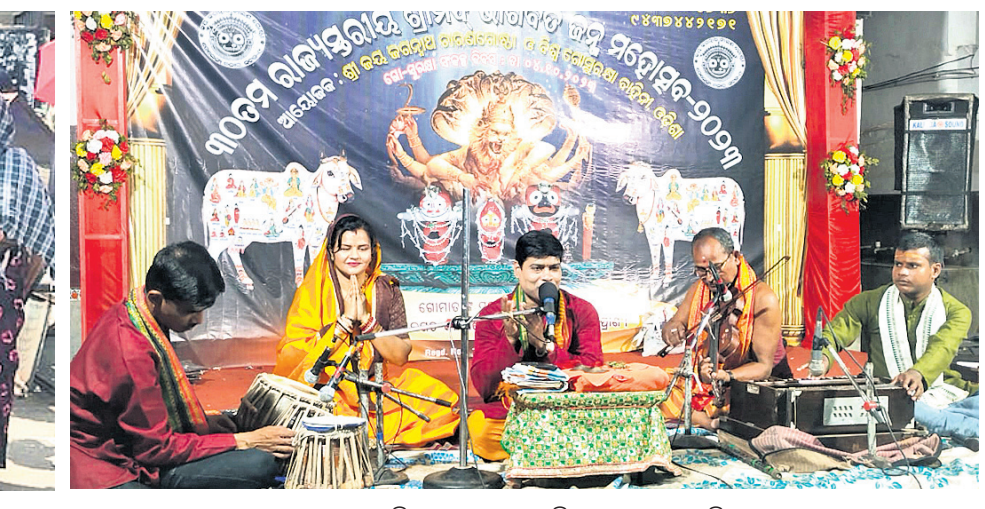
କଟକ ଚେଲେଙ୍ଗା ବନାରସ୍ଥିତ ରଘୁନାଥକାଠ ମନ୍ଦିର ପ୍ରାଙ୍ଗଣରେ ଅନୁଷ୍ଠିତ ରାଧ୍ୟାପୁରାଣ ଶ୍ରୀମନ୍ଦିର ଭାଗବତ କବ୍ ମହୋତ୍ସବରେ ଅନୁଷ୍ଠିତ ପ୍ରବଚନ କାର୍ଯ୍ୟକ୍ରମ।