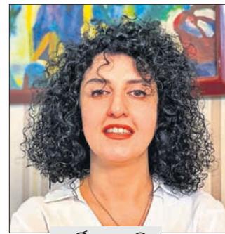
ନର୍ତ୍ତୀଙ୍କୁ ନୋବେଲ ଶାନ୍ତି ପୁରସ୍କାର ପ୍ରଦାନ ନିମନ୍ତେ ନରଫ୍ରେଡ଼

ନର୍ତ୍ତୀଙ୍କୁ ନୋବେଲ ଶାନ୍ତି ନର୍ତ୍ତକୀମାନଙ୍କ ଅଧିକାର, ଗଣତନ୍ତ୍ର ପାଇଁ ଅଭିଯାନ ଚଳାଇବା ସହ ବହୁବର୍ଷ ଧରି ଇରାନରେ ମୁଖ୍ୟତଃ ବିରୋଧରେ ଲଢ଼େଇ କରୁଥିବା ଅଧିକାର କର୍ମୀ ନର୍ତ୍ତୀଙ୍କୁ ନୋବେଲ ଶାନ୍ତି ପୁରସ୍କାର ପାଇଁ ମନୋନୀତ ହୋଇଛନ୍ତି। ଶାନ୍ତି ପାଇଁ ନୋବେଲ ପାଇବାରେ ସେ ୧୯୯୮ ମସିହା ମାନ୍ୟତାପ୍ରାପ୍ତ ହେଉଥିବା ଅତ୍ୟାଚାର ବିରୋଧରେ ଲଢ଼େଇ କରି ତାଙ୍କୁ ଅନେକଥର କେଲ ସିବାକୁ ପଡ଼ିଛି। ମହିଳା ଅଧିକାର, ମାନବାଧିକାର ଏବଂ ସମସ୍ତଙ୍କ ପାଇଁ ସ୍ୱାଧୀନତା ନିମନ୍ତେ ସଂଗ୍ରାମ କରିଆସୁଥିବା ନର୍ତ୍ତୀଙ୍କୁ ନୋବେଲ ଶାନ୍ତି ପୁରସ୍କାର ପ୍ରଦାନ ନିମନ୍ତେ ନରଫ୍ରେଡ଼