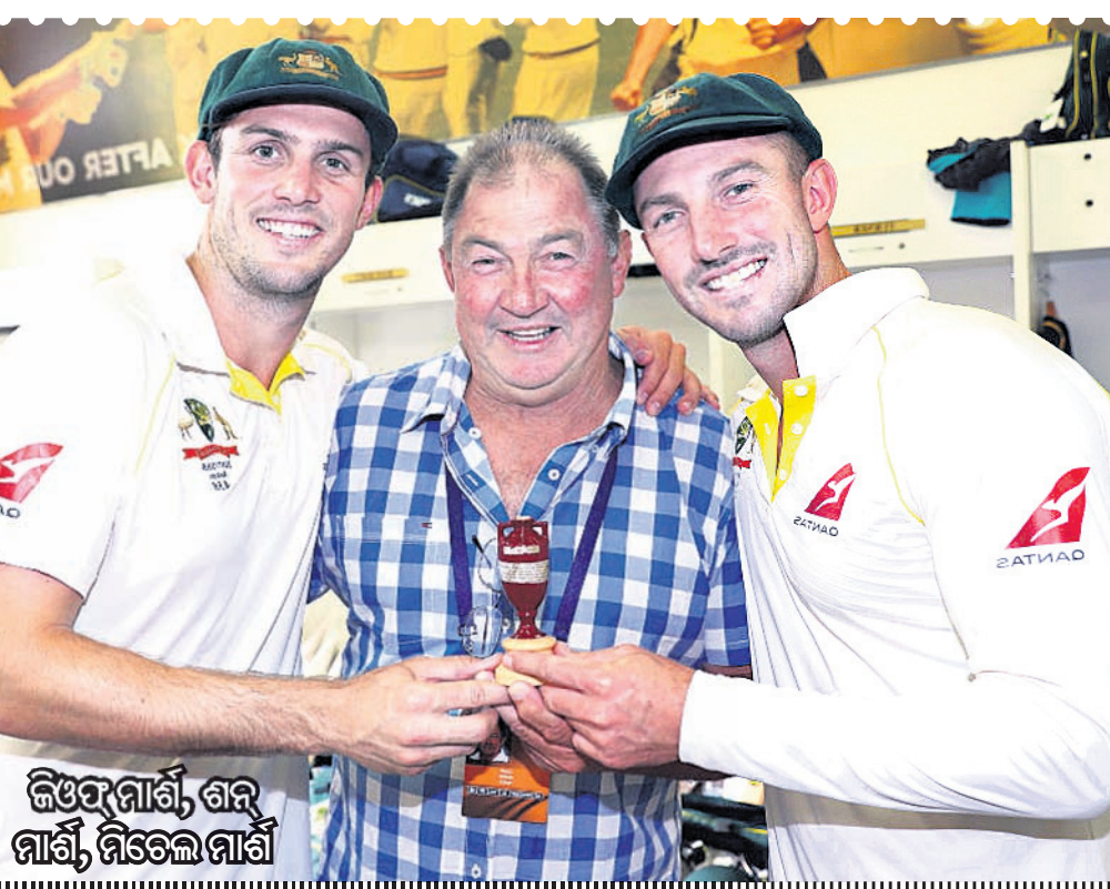
ଜିଓଫ୍ ମାର୍ଶ୍, ଶାନ୍ ମାର୍ଶ୍, ମିଚେଲ୍ ମାର୍ଶ୍

ଅଷ୍ଟ୍ରେଲିଆର ଏହି ପିତା-ପୁତ୍ର ଯୋଡ଼ିରେ ୩ ଜଣ ଯାକ ଅନ୍ତର୍ଜାତୀୟ କ୍ରିକେଟ ଖେଳିଥିବା ବେଳେ ବିଶ୍ୱକପ ମଧ୍ୟ ଖେଳିଛନ୍ତି। ଜିଓଫ୍ ମାର୍ଶ୍ ୧୯୮୭ ବିଶ୍ୱକପ ବିଜୟୀ ଦଳର ସଦସ୍ୟ ରହିଥିଲେ। ବୁଇଟ୍ ଶତକ ସହ ସେ ୮୩ ମ୍ୟାଚ୍ରେ ଖେଳିଥିଲେ ୪୨୮ ରନ୍। ୨୦୧୫ରେ ବିଶ୍ୱକପରେ ରହିଥିବା ଅଷ୍ଟ୍ରେଲିଆ ଦଳର ସଦସ୍ୟ ରହିଥିଲେ ମିଚେଲ୍ ମାର୍ଶ୍। ଉକ୍ତ ସଂସ୍କରଣରେ ସେ