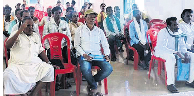
ପ୍ରଶିକ୍ଷଣ ଶିବିରରେ ଯୋଗଦେଇଥିବା କଳାକାରମାନେ

ଜଗଣୀ ରୁକ୍ମ ପକ୍ଷରୁ ଆୟୋଜିତ ରୁକ୍ମଦିନିଆ ରୁକ୍ମପୁରୀୟ ସଂସାଧନ ସଭ୍ୟଙ୍କ ପ୍ରଶିକ୍ଷଣ ଶିବିର ଉଦ୍‌ଘାଟିତ ହୋଇଯାଇଛି।