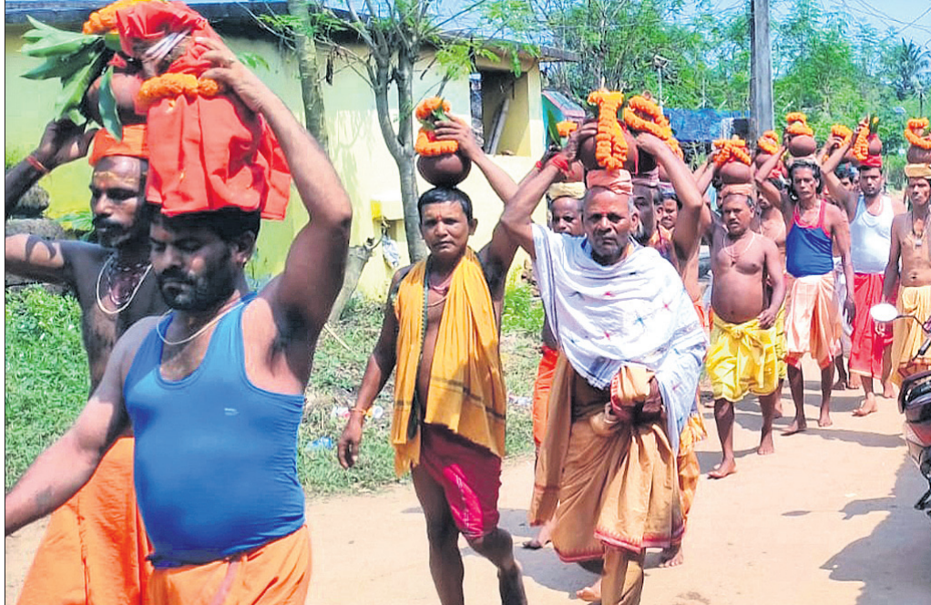
ବୋଲଗଡ଼: ମା' କାଳିକାଙ୍କ ପୀଠରେ ଷୋଡ଼ଶ ଦିବସୀୟ ପୂଜା ଅବସରରେ ଶୁକ୍ରବାର ଅନୁଷ୍ଠିତ କଳ୍ୟାଣ ଶୋଭାଯାତ୍ରା।

ରଖିବାକୁ ନିର୍ଦ୍ଦେଶ ଦେଇଥିଲେ। କୌଣସି ଡିଲର କିମ୍ବା ବ୍ୟବସାୟୀ ଏହି କୀଟନାଶକ ବିକ୍ରି କରୁଥିବା ଧରାପଡ଼ିଲେ କଡ଼ା କାର୍ଯ୍ୟାନୁଷ୍ଠାନ ହେବ ବୋଲି ଜିଲା ଆରକ୍ଷୀ ଅଧିକାରୀଙ୍କ ଦ୍ୱାରା କଡ଼ାକଡ଼ି ଯାଞ୍ଚ କରାଯିବ।