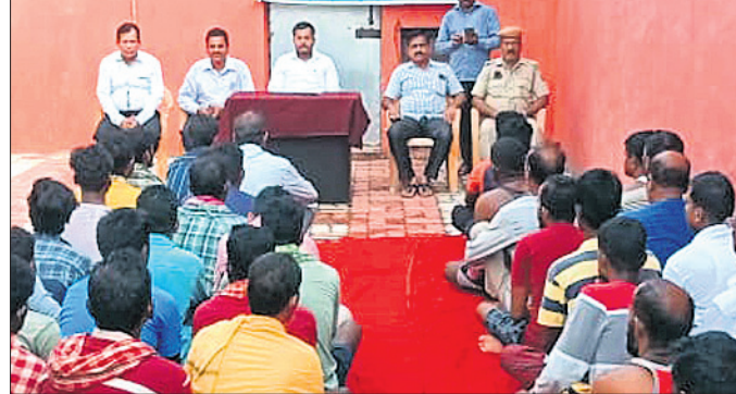
ଆଇନ ସଚେତନତା ଶିବିରରେ ଉପସ୍ଥିତ ଅତିଥି ଏବଂ ଅତିବାସୀ।