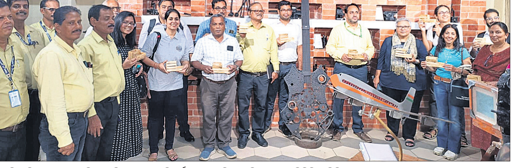
ଖପୁରିଆସ୍ଥିତ ସରକାରୀ ଶିଳ୍ପ ଚାଳିତ କେନ୍ଦ୍ର ପରିଦର୍ଶନରେ ଆସିଥିବା ବିଶ୍ୱବ୍ୟାଙ୍କ, ଡିଜିଟି ପ୍ରତିନିଧି ଦଳ।