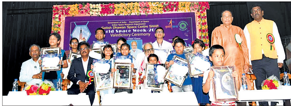
ଉତ୍ସବରେ ରାଜ୍ୟପାଳ ପ୍ରଫେସର ଗଣେଶ ଲାଲ୍ ଏବଂ ଅନ୍ୟ ଅତିଥିଙ୍କ ଉପସ୍ଥିତିରେ ପୁରୀରୁ କୃତୀ ପ୍ରତିଯୋଗୀମାନେ।