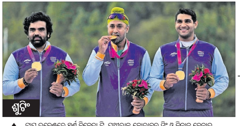
▲ ପ୍ରାୟ ଭଲକେଶ୍ୱର ସର୍ବ ବିଜୟୀ ବି. ପୁଆରାଜ, ଗୋରାବେ ବି ଓ ବିନାୟ ଚେନାୟ