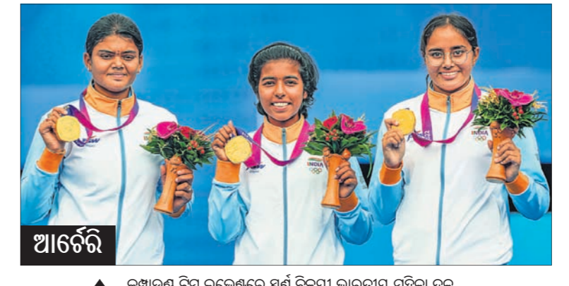
▲ କମ୍ପାଉଣ୍ଡ ବିମ୍ବ ଭିକେଶ୍ୱର ସର୍ବ ବିଜୟୀ ଭାରତୀୟ ମହିଳା ଦଳ