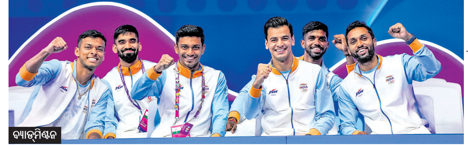
▲ ଏତିହାସିକ ଗୋପାଳ ବିଜେତା ଭାରତୀୟ ପୁରୁଷ ବ୍ୟାଡମିଣ୍ଟନ ଦଳ