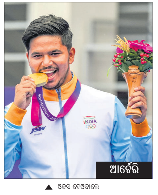
▲ ଓଡ଼ିଶା ଚେକେଟେଲ