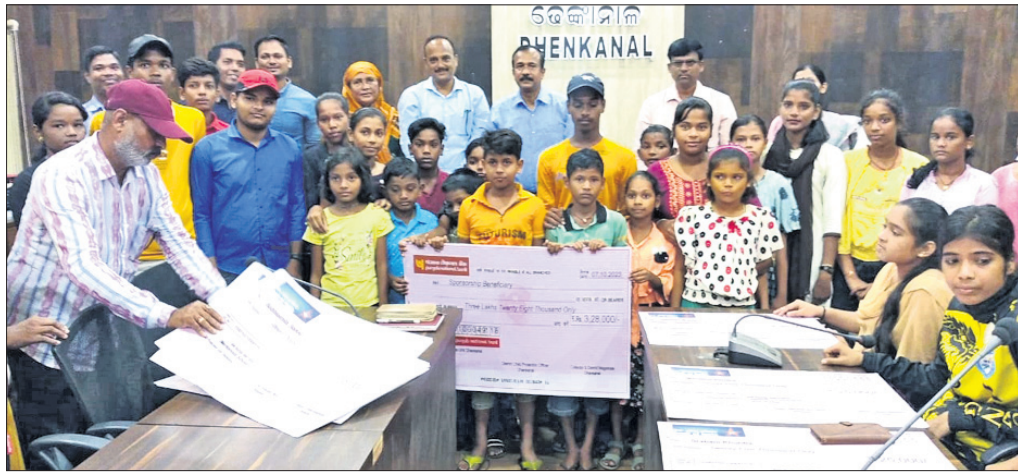
ଆର୍ଥିକ ଦୁର୍ବଳ ଓ ଅନାଥ ପିଲାଙ୍କୁ ପ୍ରୋତ୍ସାହନ ରାଶି ପ୍ରଦାନ କରାଯାଇଛି ।