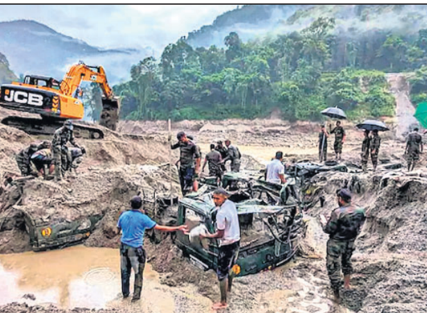
ନୂଆଦିଲ୍ଲୀ,୨୧୧୦: ସିକିମ୍ରେ ବନ୍ୟା ପ୍ରଭାବରେ ଆକ୍ରମଣ ହେଉଥିବା ସମୟରେ ଉଦ୍ଧାର କର୍ମଚାରୀଙ୍କୁ ଦେଖାଯାଇଛି।