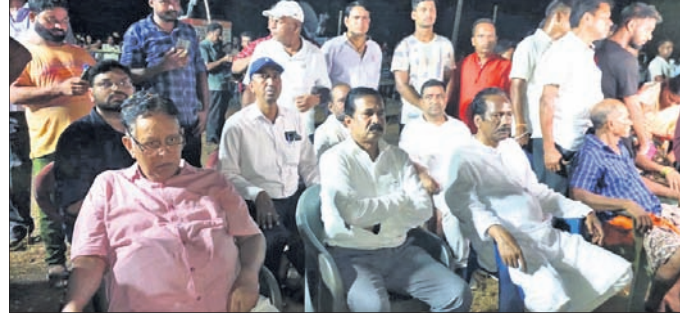
ଅତିନି ସଂସ୍କାର ବେଳେ ରାଜନେତା, ପ୍ରଶାସନିକ ଅଧିକାରୀମାନେ ଉପସ୍ଥିତ ଅଛନ୍ତି।