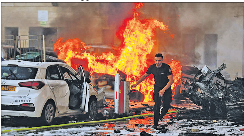
ଗାଜା ସ୍ତ୍ରୀରୁ ରକେଟ୍ ମାଡ୍ କରାଯିବା ପରେ ଇସ୍ରାଏଲର ଆଶ୍ୱକେଲୋନ୍‌ରେ ଜଣେ ବ୍ୟକ୍ତି ପ୍ରାଣ ବିକଳରେ ବୌଦ୍ଧୁଛନ୍ତି।

ଗୋଟିଏ ମୁଦ୍‌ ସରିନାହିଁ, ଆଉ ଏକ ମୁଦ୍‌ ପୁଣି ଚେକିଲାଣି। ରୁଷିଆ-ୟୁକ୍ରେନ୍ ସଂଘର୍ଷ ଶନିବାର ୫୯୧ ଦିନରେ ପହଞ୍ଚିଥିବାବେଳେ ଇସ୍ରାଏଲ ଉପରେ ପାଲେଷ୍ଟାଇନ୍‌ର କଠୋରପନ୍ଥା ଗୋଷ୍ଠୀ ହମାସ୍ ପକ୍ଷରୁ ୫,୦୦୦ ରକେଟ୍ ମାଡ୍ କରାଯାଇଛି। ଏହି ଅତର୍କିତ ଆକ୍ରମଣରେ ୧୦୦ ସାଧାରଣ ନାଗରିକ ନିହତ ହୋଇଛନ୍ତି। ୭୪୦ରୁ ଊର୍ଦ୍ଧ୍ୱ ଆହତ ହୋଇଥିବାକୁ ମୃତ୍ୟୁସଂଖ୍ୟା ବଢ଼ିବା ଆଶଙ୍କା କରାଯାଇଛି। ଇସ୍ରାଏଲ ପ୍ରଧାନମନ୍ତ୍ରୀ ବେଞ୍ଜାମିନ୍ ନେତାନ୍ୟାହୁ ବିଦ୍ରୋହୀ ହମାସ୍‌ର ଚ୍ୟାଲେଞ୍ଜକୁ ଗ୍ରହଣକରି ମୁଦ୍‌ ଘୋଷଣା କରିଛନ୍ତି। ଇସ୍ରାଏଲର ଜବାବା କାର୍ଯ୍ୟାନୁଷ୍ଠାନରେ ପ୍ରାୟ ୨୦୦ ପାଲେଷ୍ଟିନୀୟ ନିହତ ହୋଇଛନ୍ତି। ଯୋଗାଣ ଶୃଙ୍ଖଳ ବାଧାପ୍ରାପ୍ତ ହୋଇ ଅତ୍ୟାବଶ୍ୟକ ସାମଗ୍ରୀଗୁଡ଼ିକର ଦରଦାମ୍ ଆକାଶକୁ ଉଡ଼ି ଚାଲିଛି। ଏଭଳି ସମୟରେ ଆଉ ଏକ ମୁଦ୍‌ର ସମ୍ଭାବ୍ୟ ପରିଣାମକୁ ନେଇ ବିଶ୍ୱାସୀ ଚିନ୍ତିତ।