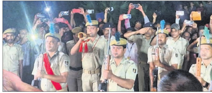
ଶୁଶ୍ରୁଣରେ ଶେଷକୃତ୍ୟ ବେଳେ ପୋଲିସ ପକ୍ଷରୁ ସମ୍ମାନ ପ୍ରଦାନ କରାଯାଇଛି।