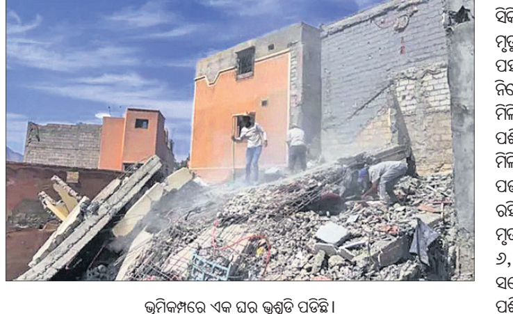
ଭୂମିକମ୍ପରେ ଏକ ଘର ଭୁଙ୍ଗି ପଡ଼ିଛି।

ଏବେ ବି ଶତାଧିକ ନିଷୋଜ: ସିକିମ୍ରେ ଅତୀକ୍ରମଣ ବନ୍ୟାଜନିତ ମୃତ୍ୟୁସଂଖ୍ୟା ଶନିବାର ୫୬ରେ ପହଞ୍ଚିଥିବାବେଳେ ଏବେ ବି ଶତାଧିକ ନିଷୋଜ ଅଛନ୍ତି।