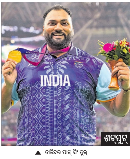
▲ ଗଜିନ୍ଦର ପାଲ୍ ବିଂ ତୁର