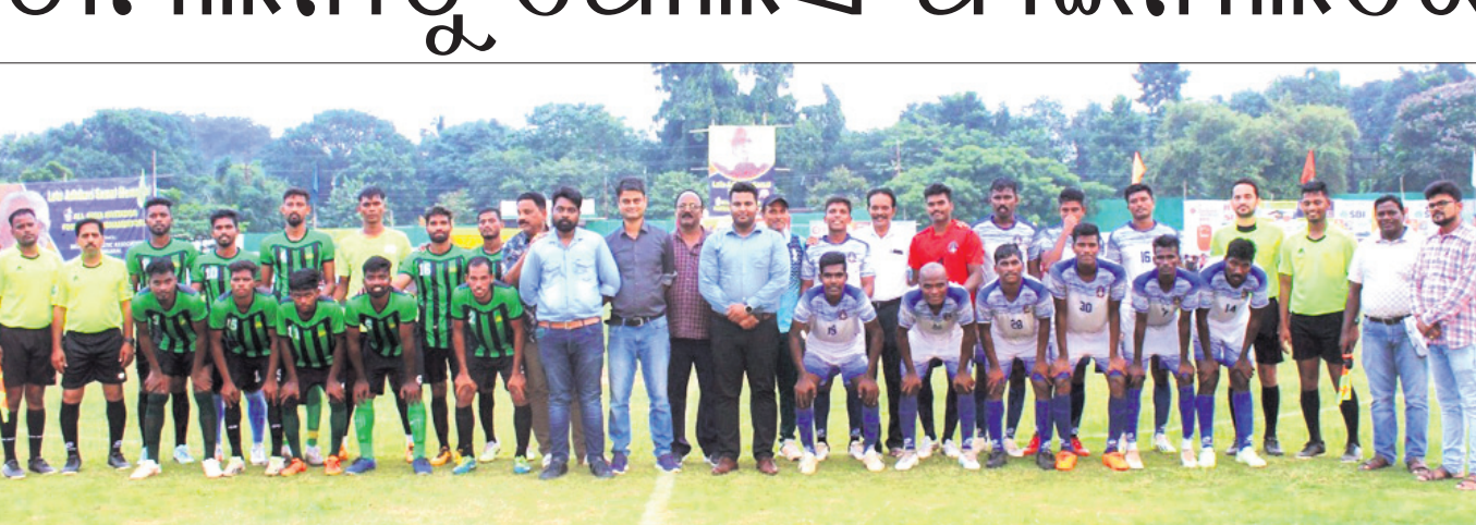
ପ୍ରଥମ ସେମି ଫାଇନାଲ ମ୍ୟାଚ ପୂର୍ବରୁ ଅତିଥିଙ୍କ ସହ ଖେଳାଳିମାନେ ।