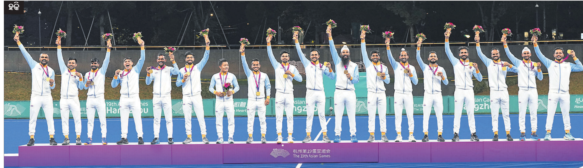
▲ ଏସିଆନ୍ ଗେମ୍ସରେ ସର୍ବ ପଦକ ବିଜୟୀ ଭାରତୀୟ ପୁରୁଷ ହକି ଦଳ