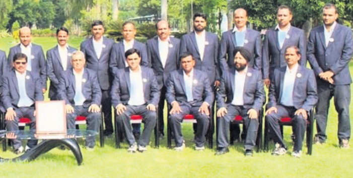
ଜିଏମ୍ଆର୍‌କୁ ବ୍ରିଟିଶ କାଉନସିଲ ପକ୍ଷରୁ ୫୫୫ ଲକ୍ଷ ଟଙ୍କା ପ୍ରଦାନ କରାଯାଇଛି ।

କମଳାକାନ୍ତ ଉତ୍ତମ ବୃତ୍ତି ସମ୍ପନ୍ନ ସ୍ୱାସ୍ଥ୍ୟ ଓ ସୁରକ୍ଷା ସମ୍ପର୍କରେ ପୂର୍ଣ୍ଣାଙ୍ଗୁଣୀ ସମାକ୍ଷା କରାଯାଇ ବ୍ରିଟିଶ କାଉନସିଲ ଏହି ରେଟ୍ ପ୍ରଦାନ କରିଛନ୍ତି । ଜିଏମ୍ଆର୍ କମଳାକାନ୍ତ ଏନର୍ଜୀ ଲିମିଟେଡ୍‌ର ସବୁବେଳେ ବୃତ୍ତି ସମ୍ପନ୍ନ ସ୍ୱାସ୍ଥ୍ୟ ଓ ସୁରକ୍ଷା ପରିଚାଳନାରେ ଉତ୍ତମ