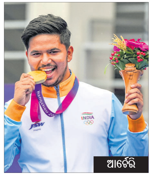
▲ ଓପେନ୍ ଟେବଲ