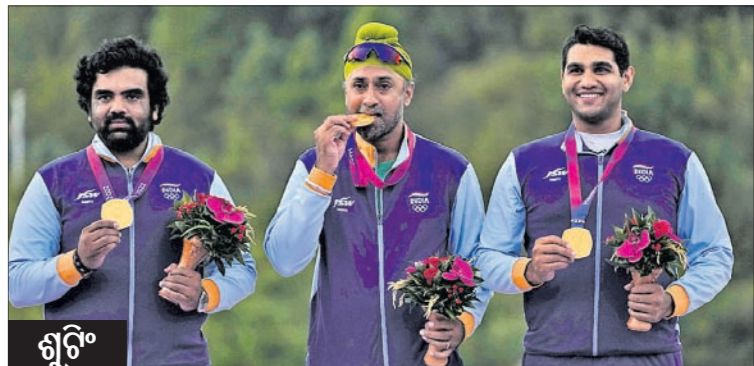
▲ ପ୍ରାୟ ଭଲେକ୍ସରେ ସର୍ବ ବିଜୟୀ ବି. ପୁଆରାଜ, ଗୋରାବେ ବି ଓ ବିନାୟ ଦେବନା