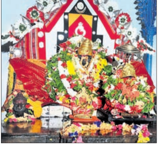
ଏହାପରେ ଶ୍ରୀ ଜଗନ୍ନାଥଙ୍କ ମହାପ୍ରସାଦ ସମର୍ପଣ କରାଯାଇଥିଲା । ପାଞ୍ଚିପାଠ, ସ୍ୱର୍ଣ୍ଣ ଅଳଙ୍କାରରେ ମଣ୍ଡିତ କରାଯାଇ ଥିଲା ।

ତିର୍ତ୍ତୋଲ ବ୍ଲକ କନକପୁରସ୍ଥିତ ପ୍ରସିଦ୍ଧ ଶକ୍ତିପୀଠ ଝଙ୍କଡ଼ ଶାରଳା ପୀଠରେ ଶୁକ୍ରବାର ଶାରଦୀୟ ପାର୍ବଣର ଷୋଳପୂଜା ଆରମ୍ଭ ହୋଇଛି । ମା'ଶାରଳାଙ୍କ ଏହି ପୂଜା ମୂଳାଷ୍ଟମୀଠାରୁ ଆରମ୍ଭ ହୋଇ ୨୧ ତାରିଖ ମହାଷ୍ଟମୀ ପର୍ଯ୍ୟନ୍ତ ଚାଲିବ । ପାର୍ବଣ ଷୋଳପୂଜାର ମୂଳାଷ୍ଟମୀ ତିଥିରେ ମା'ଙ୍କ ପହୁଡ଼ ଘଟା ନାଚି ପରେ ମଙ୍ଗଳା ଆଳତି ହୋଇଥିଲା । ପରେ ମଧୁସ୍ନାନ, ଦଶଦିଗପାଳ ପୂଜା, ପାର୍ଶ୍ୱ ଦେବାଦେବୀଙ୍କ ପୂଜା, ପଞ୍ଚାମୃତ ମାର୍ଜନା କରାଯାଇ ମା'ଙ୍କୁ ସ୍ୱର୍ଣ୍ଣ ଅଳଙ୍କାରରେ ମଣ୍ଡିତ କରାଯାଇ ଥିଲା ।