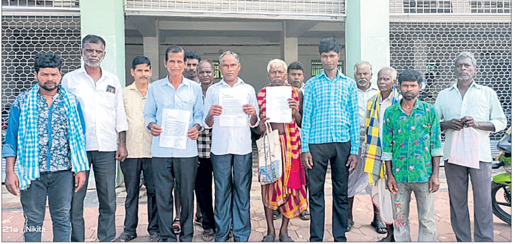
ଜିଲାପାଳଙ୍କୁ ଭେଟିବାକୁ ଆସିଥିବା ଚାଷୀମାନେ ।