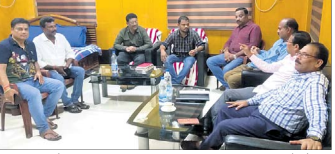
ବୈଠକରେ ପୂର୍ଣ୍ଣ ବିଭାଗ ଅଧିକାରୀ ଓ ଯାଜପୁରରୋଡ଼ ସିଭିଲ ସୋସାଇଟିର କର୍ମକର୍ତ୍ତା ।

ପୂର୍ଣ୍ଣ ବିଭାଗର ପ୍ରତିଶ୍ରୁତି ପରେ ଯାଜପୁରରୋଡ଼ ସିଭିଲ ସୋସାଇଟି ପକ୍ଷରୁ ହେବାକୁ ଥିବା ଆନ୍ଦୋଳନକୁ ସ୍ଥଗିତ ରଖାଯାଇଛି । ଯାଜପୁରରୋଡ଼ ସହରର ଚୋରବା ବାଇପାସଞ୍ଚଳକୁ ସେରବାକ୍ ହେବ ପର୍ଯ୍ୟନ୍ତ ରାସ୍ତାର ଉପଯୁକ୍ତ ମରାମତି ସହ ଅନ୍ୟକେତେକ ସମସ୍ୟା ନେଇ ସିଭିଲ ସୋସାଇଟି ପକ୍ଷରୁ ୫ ତାରିଖରେ ପାଣିକୋଲି ପୂର୍ଣ୍ଣ ବିଭାଗ ଅଧୀକାରୀଙ୍କୁ ଯତ୍ନାତ୍ମକ ଦାବିପତ୍ର ପ୍ରଦାନ କରାଯାଇଥିଲା । ରାସ୍ତା ମରାମତି ପାଇଁ ଯଦି ୮ ତାରିଖ ସୁଦ୍ଧା ବିଭାଗୀୟ ପ୍ରତିଶ୍ରୁତି ଦିଆ ନ ଯାଏ ତେବେ ରାସ୍ତାରୋକୋ କରାଯିବ ବୋଲି ଚେତାବନୀ ଦିଆଯାଇଥିଲା । ଉକ୍ତ ବିଷୟକୁ ନେଇ ଅଧୀକାରୀଙ୍କୁ ପୂର୍ଣ୍ଣତରଫ ଦଲେଇଙ୍କ ନିର୍ଦ୍ଦେଶକ୍ରମେ ପୂର୍ଣ୍ଣ ବିଭାଗ ଅଧିକାରୀ ଓ ସିଭିଲ ସୋସାଇଟି ସଭ୍ୟଙ୍କ ମଧ୍ୟରେ ଏକ ମିଳିତ ବୈଠକ ଧବଳଗିରିସ୍ଥ