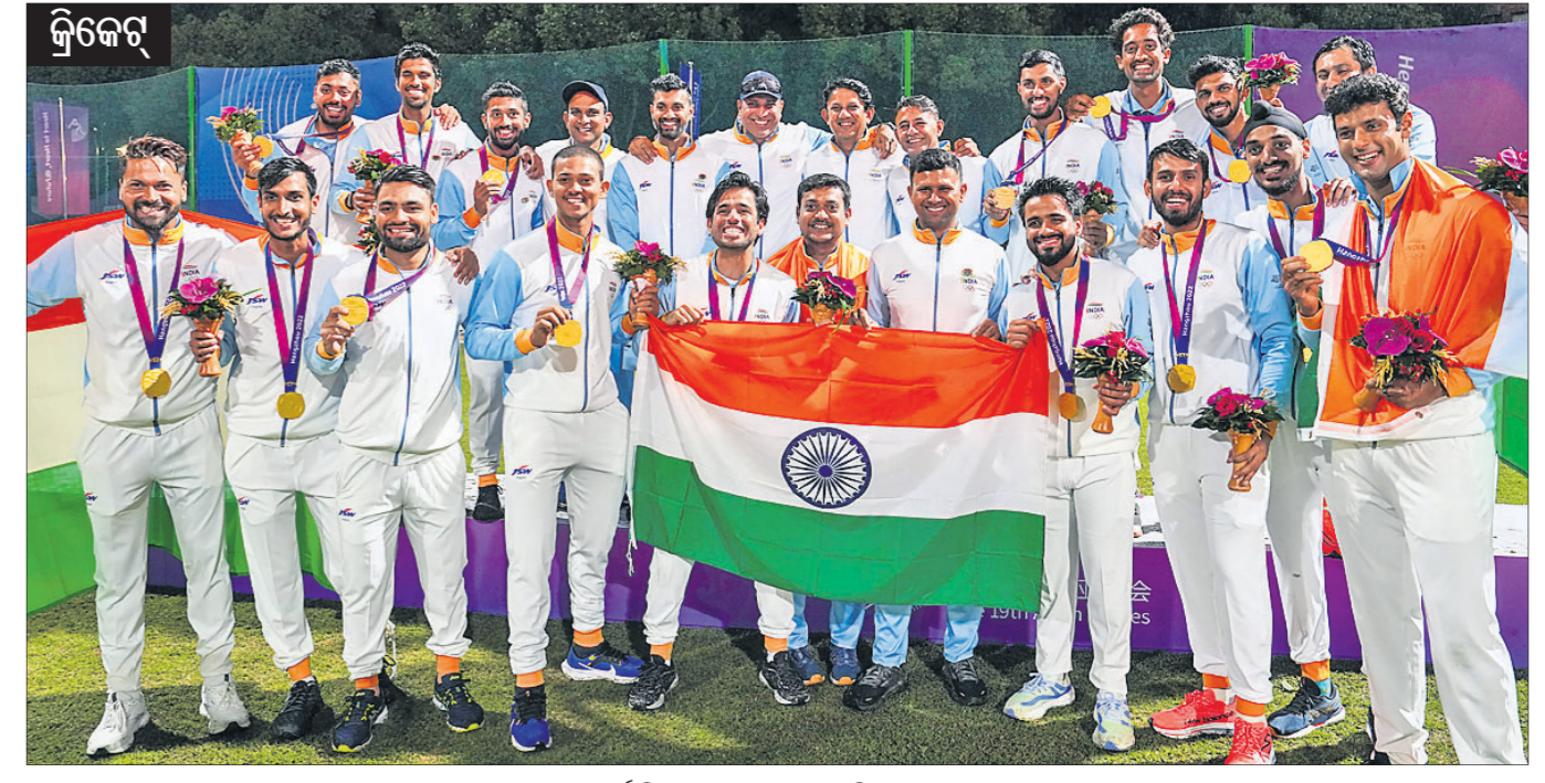
▲ ସର୍ବ ବିଜୟୀ ଭାରତୀୟ ପୁରୁଷ କ୍ରିକେଟ ଦଳ