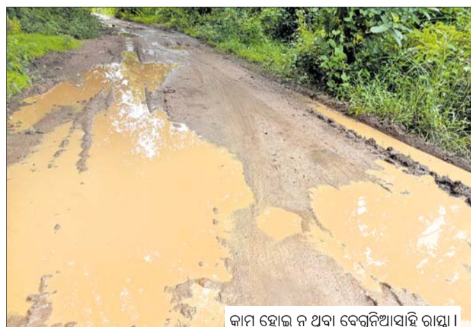
କାମ ହୋଇ ନ ଥିବା ବେଳୁନିଆସାହି ରାସ୍ତା ।

ପୂର୍ବରୁ ଅନୁଯାୟୀ, ମାଲିସାହି ବେକ୍ସିନିଆ ସାହିଠାରୁ ରାସ୍ତାର ଉନ୍ନତକରଣ ପାଇଁ ଏମ୍ବିଏନ୍ଆରଇଡିଏସ୍ରେ ୮।୭।୨୦୨୦ରେ ୯ ଲକ୍ଷ ଟଙ୍କା ମଞ୍ଜୁର ହୋଇଥିଲା । ସେଥିରେ ବୃତ୍ତିତ ହୋଇଥିବା