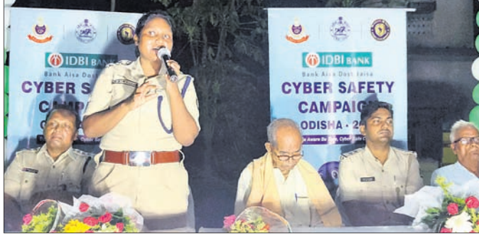
ସଚେତନତା ସଭାରେ ମହାସାଧନ ଅତିଥି ।

କେନ୍ଦ୍ରାପଡ଼ା ଜିଲାର ବିଭିନ୍ନ ସ୍ଥାନରେ ସାଇବର ସଚେତନତା ରଥ ପରିକ୍ରମା କରାଯାଇ ପାରୁଛି । ଶନିବାର ମହାକାଳପଡ଼ା ଥାନା ପରିସରରେ ଏହି ରଥ ପହଞ୍ଚି ଥିଲା । ଏହାକୁ ବିଭିନ୍ନ ମହଲରେ ସ୍ୱାଗତ କରାଯାଇଥିଲା । ଅତ୍ୟାଧୁନିକ ଜ୍ଞାନ କୌଶଳ ପ୍ରୟୋଗ କରି କିପରି ସାଧାରଣ ଲୋକଙ୍କୁ ସାଇବର ଅପରାଧମାନେ ଠକୁଛନ୍ତି ତା' ଉପରେ ରୋକ୍ ଲଗାଇବା ପାଇଁ ରାଜ୍ୟ ସରକାରଙ୍କ ନିର୍ଦ୍ଦେଶରେ ଲୋକମାନଙ୍କୁ ସଚେତନତା କରାଯାଇଥିଲା । ଗ୍ରାମାଞ୍ଚଳରେ ଶିକ୍ଷିତ ଯୁବତୀଯୁବକ ଅନୁଲୋଚନରେ କିପରି ସାଇବର ଠକାମାନଙ୍କୁ ଚିହ୍ନିବେ ନୃତ୍ୟ, ସଙ୍ଗୀତ ଓ ନାଟକ ମାଧ୍ୟମରେ ସ୍ଥାନୀୟ ଲୋକମାନଙ୍କୁ ସଚେତନ କରାଯାଇଥିଲା । ଅପରପକ୍ଷେ ସାଇବର ଅପରାଧମାନେ ଅତ୍ୟାଧୁନିକ ଜ୍ଞାନ