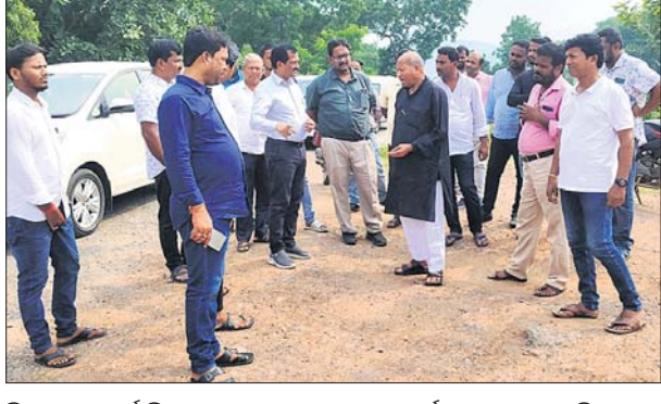
ବିଧାୟକ ଓ ପୁର ବିଭାଗ ଅଧିକାରୀମାନେ ରାସ୍ତା କାର୍ଯ୍ୟ ସମାପ୍ତ କରୁଛନ୍ତି।

ବନ୍ଧିଖୋଳ,୭୧୦ (ପ୍ରତ୍ୟକ୍ଷ କୁମାର ପୂଜା): କଟକ ଚାରବଟିଆ ପୁର ବିଭାଗ ଡିଜିଟାଲ ଅଧୀନ ବଡ଼ଚଣା ଉପଖଣ୍ଡର ବିଭିନ୍ନ ରାସ୍ତା ନିର୍ମାଣ କାର୍ଯ୍ୟର ଶନିବାର ସମାପ୍ତ କରାଯାଇଛି।