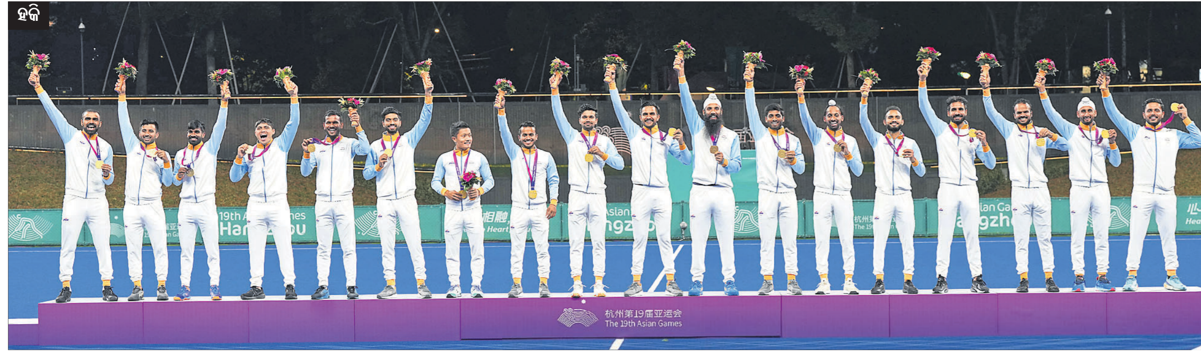
▲ ଏସିଆନ୍ ଗେମ୍ସରେ ସର୍ବ ପଦକ ବିଜୟୀ ଭାରତୀୟ ପୁରୁଷ ହକି ଦଳ