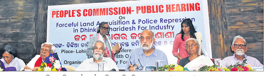
ଜନଆନ୍ଦୋଳନ ଜନଶୁଣାଣିରେ ସୁପ୍ରିମକୋର୍ଟର ପୂର୍ବତନ ବିଚାରପତି ଜଷ୍ଟିସ ମଦନ ଭାମରାଓ ଲୋକ୍ଯୁ ଓ ଅନ୍ୟମାନେ।