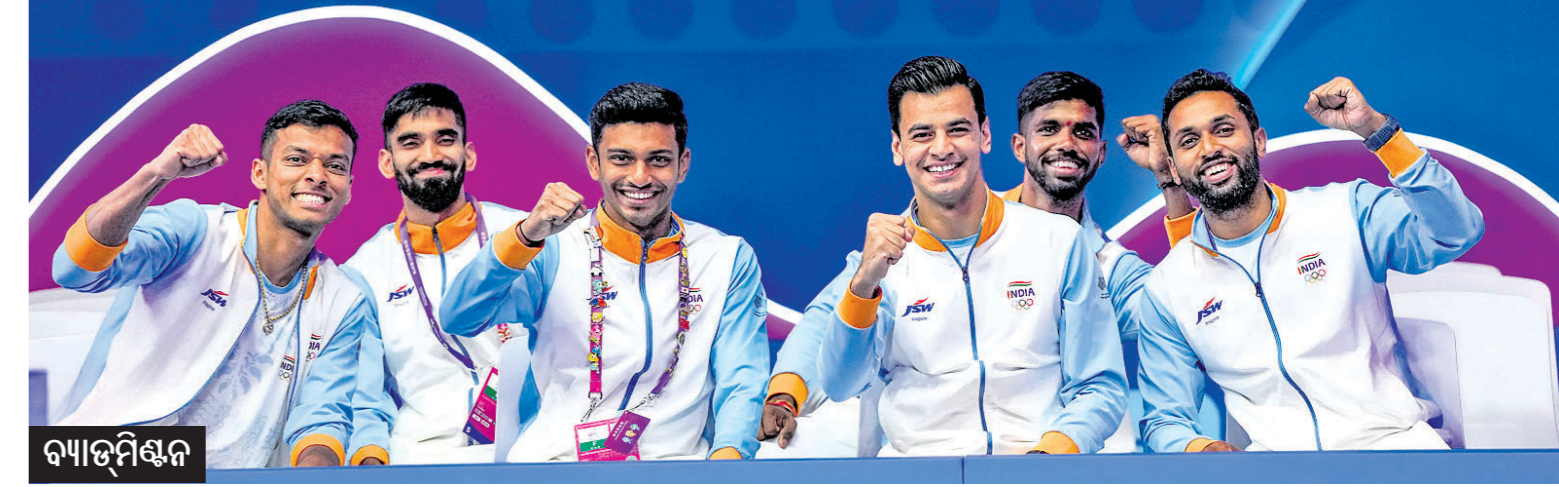
▲ ଐତିହାସିକ ଗୋପାଳ ବିଜୟୀ ଭାରତୀୟ ପୁରୁଷ ବ୍ୟାଡମିଣ୍ଟନ ଦଳ