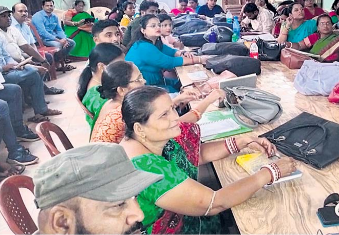
ତାଲିମ ଶିବିରରେ ଭାଗ ନେଇଥିବା ଆଶା ଓ ସ୍ୱାସ୍ଥ୍ୟକର୍ମୀ ।