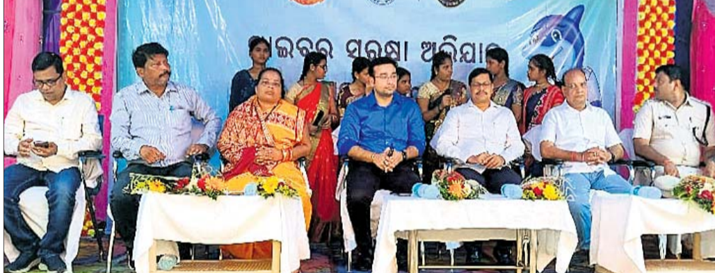
ସାଇବର ସଚେତନତା ସଭାରେ ମଞ୍ଚାସନ ଅତିଥି ।