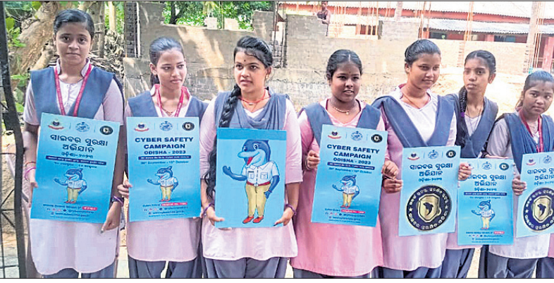
ଛାତ୍ରାମାନେ ସାଇବର ଅପରାଧ ସମ୍ପର୍କରେ ସଚେତନତା କରୁଛନ୍ତି ।