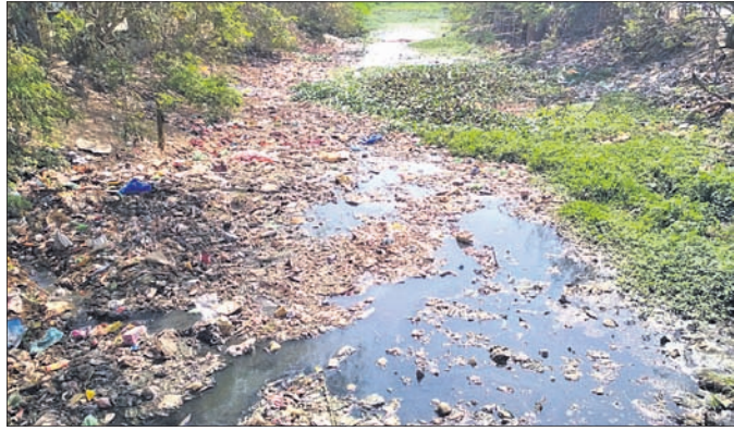
ବର୍ଜ୍ୟବସ୍ତୁରେ ଗୋବରା କେନାଲ ପୋତି ହୋଇ ପଡ଼ିଛି ।

ସିଙ୍ଗଲ ୟୁଜ ପ୍ଲାଷ୍ଟିକ ଓ ପଲିଥିନ ବ୍ୟବହାର ସମ୍ପୂର୍ଣ୍ଣ ବର୍ଜନ ପାଇଁ ପ୍ରଧାନମନ୍ତ୍ରୀ ନରେନ୍ଦ୍ର ମୋଦି ଗତ ୨୦୧୬ ଗାନ୍ଧୀ ଜୟନ୍ତୀରେ ଆହ୍ୱାନ ଦେଇଥିଲେ । ଏହାକୁ ଲିପିଧାରଣରେ ୬ ବର୍ଷ ବିତିଛି । ସେହିପରି ବର୍ଷ ବସ୍ତୁ ପରିଚାଳନା ଆଇନକୁ ରୁଚୁର ଦେବାକୁ ନ୍ୟାଶନାଲ ଗ୍ରୀନ ଟ୍ରିଷ୍ଟିମାଲ (ଏନଜିଟି) ନିର୍ଦ୍ଦେଶ ଦେବାସହିତ ଏଥିରେ ବ୍ୟତିକ୍ରମ ହେବାକୁ କେନ୍ଦ୍ରାପଡ଼ା ପୌର ପ୍ରଶାସନକୁ ୨୪ ଲକ୍ଷ ଟଙ୍କା ଜରିମାନା ଦେବାକୁ ଗତ ଦେଢ଼ ବର୍ଷ ପୂର୍ବେ ନୋଟିସ ହୋଇଛି । ଏହାସତ୍ତ୍ୱେ ଏହାର ପରିଚାଳନାରେ ପୌର ପ୍ରଶାସନ ପଛରେ ପଡ଼ିଛି ।