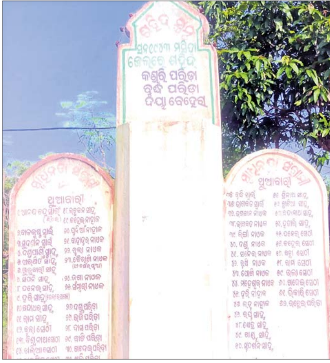
ଶହୀଦ ପ୍ରସ୍ତ ।

ଭାରତ ସ୍ୱାଧୀନତା ସଂଗ୍ରାମର ମହାନ ଚର୍ଚ୍ଚାସ୍ତ୍ର ନୂଆଗାଁ ବ୍ଲକର ଥୁଆବାରା ଓ କୁଶବିତା ମାଟି ହୋଇଯାଇଛି ଅଖୋଳା ଅଲୋଡ଼ା । ଦେଶ ସ୍ୱାଧୀନତା ହେବାର ୭୬ ବର୍ଷ ପରେ ବି ଏହି ଗାଁ ପାଇ ପାରି ନାହିଁ ଐତିହାସିକ ପୀଠର ମାନ୍ୟତା । ଥୁଆବାରା ଗାଁ କେବଳ ଆଦର୍ଶ ଗାଁ ନାମପତ୍ରକରେ ଓ କୁଶବିତା ଗାଁ ବିଧାୟକଙ୍କ ପୋଷ୍ୟ ଗାଁ ନାଁରେ ବିକାଶର ଫାଇଲ ଭିତରେ ବନ୍ଧା ହୋଇ ରହିଛି । କେବଳ ଅକ୍ଟୋବର ୧୦ରେ ଥୁଆବାରା ଗାଁରେ ଶହୀଦଙ୍କୁ ପୋଲିସର ଚୋପ ସଲୀମା ଦିଆଯାଏ । ସରକାରଙ୍କ ଚରଫତୁ ଶହୀଦ ଦିବସ ପାଳନ ପାଇଁ ୧୦ ହଜାର ବଙ୍କା ଦେବା ବ୍ୟତୀତ ଆଉ କିଛି ବ୍ୟବସ୍ଥା ନାହିଁ । କୁଶବିତା ଗାଁକୁ ନିବାସୀକୁରାଣ୍ଡା ନ ଥିଲେ ପ୍ରଶାସନ ନୀରବତା ଅବଲମ୍ବନ କରୁଛି ବୋଲି ଅଭିଯୋଗ ହୋଇଛି । ସମୟ ଥିଲା ଥୁଆବାରା ମାଟିର ଗାଁ ଶୁଣିଲେ ରାଜ୍ୟବାସୀଙ୍କ ମନରେ ଅକ୍ତୋବର ଶହୀଦଙ୍କୁ ସୃଷ୍ଟି ହେଉଥିଲା । ଏହାର ଐତିହ୍ୟ, ଗୌରବଗାଥା ମନେପକାଇଲେ ସ୍ୱତନ୍ତ୍ର ପ୍ରତ୍ୟେକରେ ମାଟିର ଧୂଳିକଣିକା ପ୍ରତି ପୁଣ୍ୟ ନଇଯାଏ । ତେବେ ସ୍ୱାଧୀନତା ପରେ ଗାଁର ଅବସ୍ଥା ଦେଖିଲେ ପ୍ରଶାସନିକ ଅବ୍ୟବସ୍ଥା ଓ ରାଜନୈତିକ ଲକ୍ଷାଣୁତ୍ତର ଅଭାବ ସ୍ପଷ୍ଟ ବାରି ହେଉଛି । ଗ୍ରାମର ସମସ୍ତ ୬୦ ପରିବାର ସ୍ୱାଧୀନତା ସଂଗ୍ରାମରେ ପଠକ ପଢ଼ି ଖାସ ଦେଇଥିଲେ । ଦେଶକୁ ସ୍ୱାଧୀନ କରିବା ପାଇଁ ଯେଉଁ ସଂଗ୍ରାମୀମାନେ ଆଗକୁ ମାଡ଼ି ଚାଲିଥିଲେ ସେମାନେ ଏବେ ମାଟିର କବର ତଳେ ରହି ଗଲେଣି । ସ୍ୱାଧୀନତା