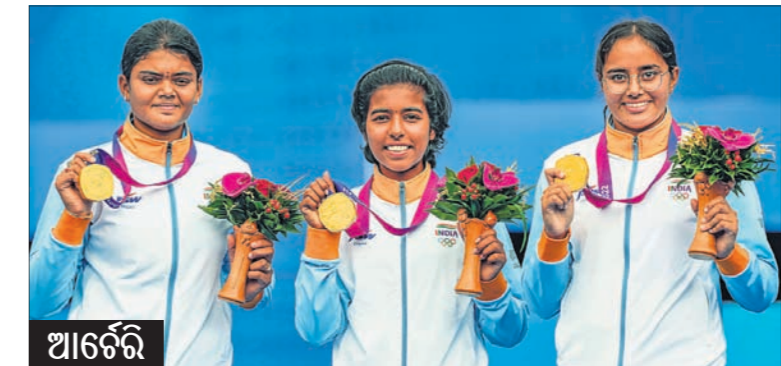
▲ କମ୍ପାଉଣ୍ଡ ବିମ୍ବ ଭରେଣ୍ଡରେ ସର୍ବ ବିଜୟୀ ଭାରତୀୟ ମହିଳା ଦଳ