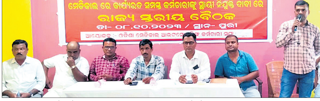
ମେଡିକାଲ ଆଉଟସୋର୍ସିଂ କର୍ମଚାରୀଙ୍କ ରାଜ୍ୟସ୍ତରୀୟ ସମାବେଶରେ ଉପସ୍ଥିତ କର୍ମକର୍ତ୍ତାମାନେ ।

ମେଡିକାଲ ଆଉଟସୋର୍ସିଂ କର୍ମଚାରୀଙ୍କ ରାଜ୍ୟସ୍ତରୀୟ କର୍ମଚାରୀଙ୍କ ରାଜ୍ୟସ୍ତରୀୟ ସମାବେଶରେ ଉପସ୍ଥିତ କର୍ମକର୍ତ୍ତାମାନେ ।