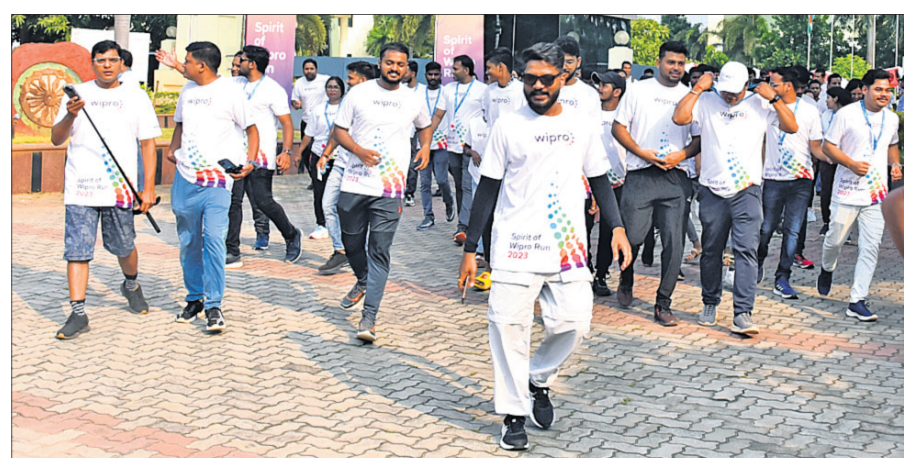
ଓପ୍ରୋ ପକ୍ଷରୁ ରବିବାର ଭୁବନେଶ୍ୱରରେ ଅନୁଷ୍ଠିତ ଗଣଦୌଡ଼ ।