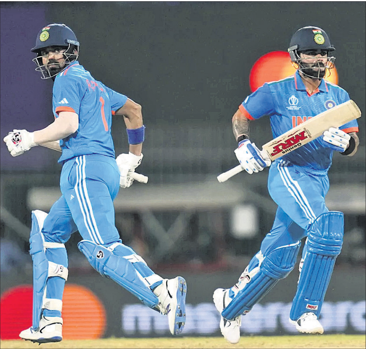
ଚେନାଇରେ ରବିବାର ଅନୁଷ୍ଠିତ ଦିନିକିଆ କ୍ରିକେଟ ବିଶ୍ୱକପର ଅଷ୍ଟେଲିଆ ବିପକ୍ଷ ମ୍ୟାଚରେ ଶତକାନ୍ଦ ଭାଗ୍ୟାଦାର ଅବସରରେ ଲୋକେଶ ରାହୁଲ ଓ ବିରାଟ କୋହଲି। (ରିପୋର୍ଟ: ଖେଳପୃଷ୍ଠା)