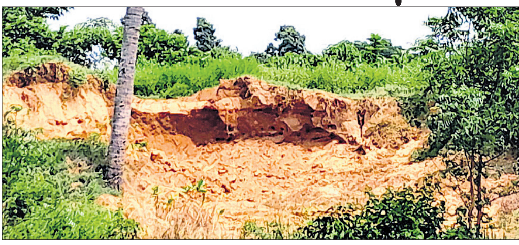
ତଡ଼ା ଯାଇଥିବା ନଦୀବନ୍ଧ ।

ସିପିଲିରେ ବାଲି ମାଫିଆଙ୍କ ଦୌରାନ୍ତ ବଦଳାରେ ଲାଗିଛି । ବେଆଇନ ଭାବେ ଶହଶହ ଟ୍ରାକ୍ ବାଲି ହରିଲୁଟି କରୁଥିବା ବେଳେ ବନ୍ଧ ପାର୍ଶ୍ୱରେ ପାହାଡ଼ ଉତ୍ତର ବାଲି ଗଦା କରି ନଦୀବନ୍ଧକୁ ତାଡ଼ି ପକାଉଛନ୍ତି ।