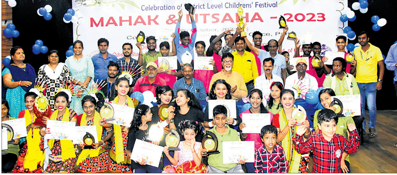
ପୁରୀ: ସଂସ୍କୃତି ଭବନ ପରିସରରେ ଆୟୋଜିତ ପ୍ରତିଭା ଉତ୍ସବ ମହକ ଓ ଉତ୍ସାହ କାର୍ଯ୍ୟକ୍ରମରେ ଉପସ୍ଥିତ ଅତିଥିଙ୍କ ଗହଣରେ କୃତୀ ପ୍ରତିଭାଧାରୀ ।