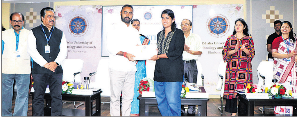
ମନ୍ତ୍ରୀ ପ୍ରତିରଞ୍ଜନ ଘଡ଼ାଇ ଜଣେ ଛାତ୍ରୀଙ୍କୁ ପୁରସ୍କାର ପ୍ରଦାନ କରୁଛନ୍ତି ।