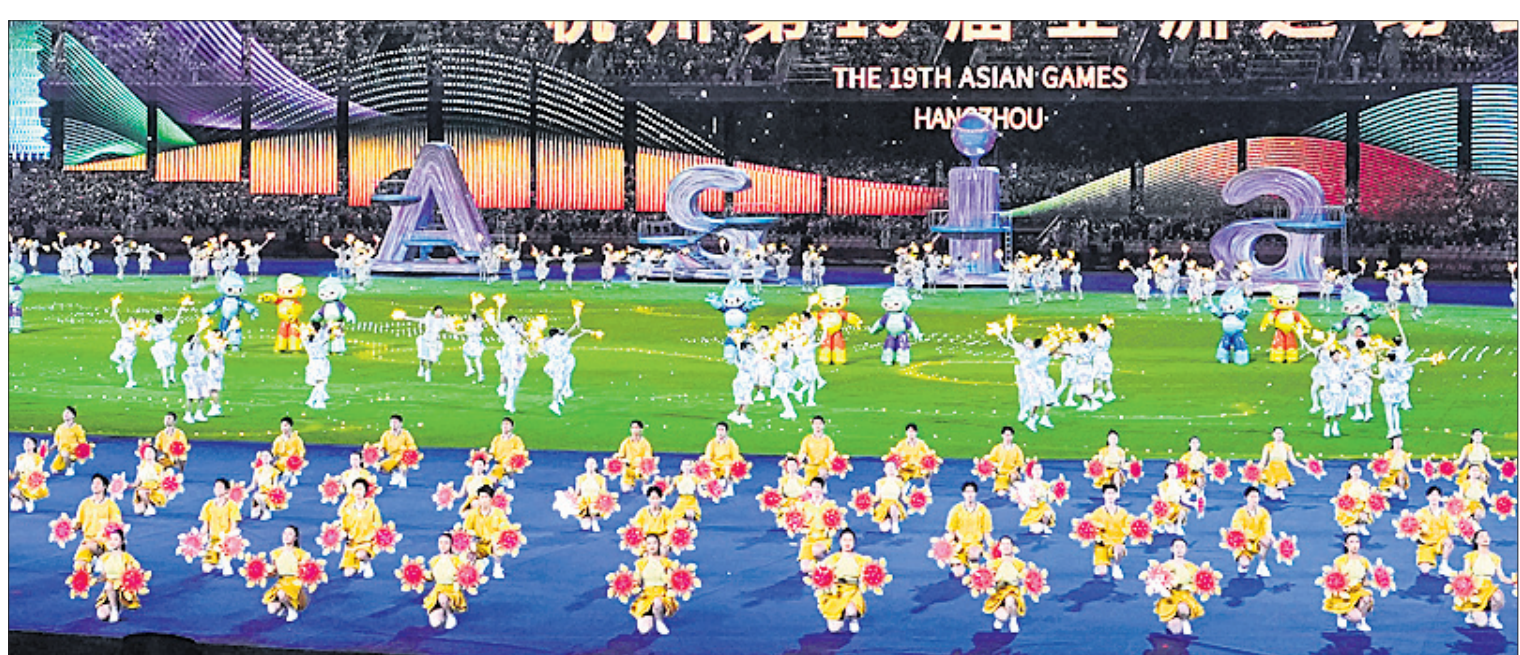
ରଙ୍ଗାରଙ୍ଗ କାର୍ଯ୍ୟକ୍ରମ ଅବସରରେ କଳାକାରମାନେ ।

ଗ୍ଲାନରେ ରହିଥିଲେ । ଭାରତ ଚଳିତ ବର୍ଷ ନିଜର ଶ୍ରେଷ୍ଠ ପ୍ରଦର୍ଶନ କରିବା ସହିତ ୧୦୭ ପଦକ ହାସଲ କରି ଚତୁର୍ଥ ସ୍ଥାନରେ ରହି ଅଭିଯାନ ଶେଷ କରିଛି । ଏହା ମଧ୍ୟରେ ୨୮ ସ୍ୱର୍ଣ୍ଣ, ୩୮ ରୌପ୍ୟ ଓ ୪୧ ବ୍ରୋଞ୍ଜ ପଦକ ରହିଛି । ୧୬ ଦିନର ଏହି ମେଗା ଇଭେଣ୍ଟରେ ୧୩ ବିଶ୍ୱ ରେକର୍ଡ, ୨୬ଟି ଏସିଆନ୍ ରେକର୍ଡ ହୋଇଥିବା ବେଳେ ୯୭ ଗେମ୍ସ ରେକର୍ଡ ହୋଇଥିଲା । ଉଦ୍‌ଯାପନୀ ଉତ୍ସବରେ ଭାରତୀୟ ହକି ଦଳର ଗୋଲକିପର ପି.ଆର୍. ଶ୍ରୀକେଶ ଧୂଳାବାହକ ସାଜିଥିଲେ । ଶେଷରେ ୧୯୫୧ ଏସିଆନ୍ ଗେମ୍ସର ମଶାଲ ଆଇଡି ନାଭୋୟା ଗଭର୍ନରଙ୍କୁ ପ୍ରଦାନ କରାଯାଇଥିଲା ।