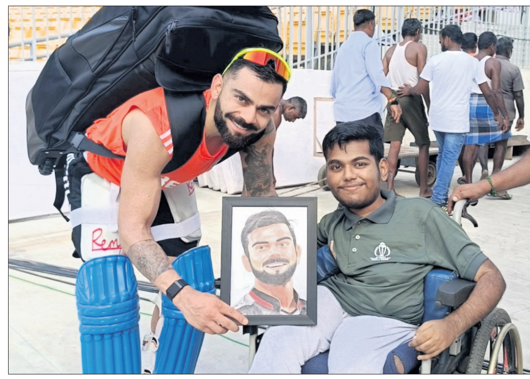
କୌଣସି ଦିନିକିଆ ପ୍ରଶଂସକଠାରୁ ନିଜର ଏକ ପଛଡିତ୍ର ଗ୍ରହଣ କରୁଛନ୍ତି ବିରାଟ କୋହଲି ।