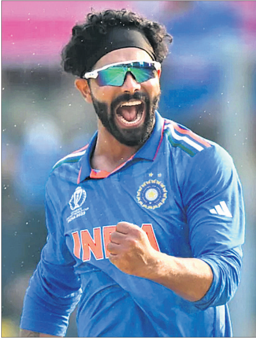
ଉଇକେଟ ନେବା ପରେ ରବୀନ୍ଦ୍ର ଜାଡେଜାଙ୍କ ପ୍ରତିକ୍ରିୟା ।

ଚେନାଇରେ ଚେପକ୍ ଷ୍ଟାଡ଼ିୟମରେ ବିଜୟ ସହ ଭାରତ ଦିନିକିଆ କ୍ରିକେଟ ବିଶ୍ୱକପ ଅଭିଯାନ ଆରମ୍ଭ କରିଛି । ବିରାଟ କୋହଲି ଓ ଲୋକେଶ ରାହୁଲଙ୍କ ଶତକାନ୍ତ ଭାଗ୍ୟାବଳୀ ବଳରେ ଘରୋଇ ଦଳ ରବିବାର ଅଷ୍ଟ୍ରେଲିଆକୁ ୬ ଉଇକେଟରେ ପରାସ୍ତ କରିଛି । ସିନିଂ ଟ୍ରାକ୍ରେ ଭାରତୀୟ ବୋଲରଙ୍କୁ ଉଚିତ ପୂଜାବିଳା କରି ନ ପାରି ଅଷ୍ଟ୍ରେଲିଆ ୪୯. ୩ ଓଭରରେ ୧୯୯ ରନକରି ଅଲଆଉଟ ହୋଇଥିଲା । ଭାରତ ୪୧.୨ ଓଭରରେ ୪ ଉଇକେଟ ହରାଇ ୨୦୧ ରନ ସଂଗ୍ରହ କରି ନେଇଥିଲା । ୯୭ ରନରେ ଅପରାଜିତ ରହିଥିବା ଲୋକେଶ ରାହୁଲ ଫ୍ଲୋୟର ଅର୍ଥ ଦି ମ୍ୟାଚ୍ ବିବେଚିତ ହୋଇଥିଲେ । ୨୦୦ ରନ ବିଜୟ ଲକ୍ଷ୍ୟର ପଛା କରି ଭାରତ ମାତ୍ର ୨ ରନରେ ୩ଟି ଉଇକେଟ ହରାଇ ସାଂଘାତିକ ବ୍ୟାଟିଂ ବିପର୍ଯ୍ୟାୟର ସମ୍ମୁଖୀନ ହୋଇଥିଲା । ଓପନର ଅଧିନାୟକ ରୋହିତ ଶର୍ମା ଓ ଇଶାନ କିଶନ ଏବଂ ୪ ନମ୍ବର ବ୍ୟାଟର ଶ୍ରେୟସ ଆୟର ଖାତା ଖୋଲିପାରି ନ ଥିଲେ । ଲୋଶ୍ ହାଜେଲଉଡ଼ ଓ ମିଚେଲ ଷ୍ଟାର୍କ ଘାତକ ବୋଲିଂ କରି ଭାରତକୁ ବ୍ୟାକ୍ସୁରୁକୁ ଠେଲି ଦେଇଥିଲେ । ମାତ୍ର ଫୁଲ ନିର୍ଭରଯୋଗ୍ୟ ବ୍ୟାଟର ବିରାଟ କୋହଲି ଏବଂ ଲୋକେଶ ରାହୁଲ କେବଳ ଯେ ଇନିଂସ ସମ୍ପାଦିଥିଲେ ତା' ନୁହେଁ ଦୁଇ ବ୍ୟାଟିଂ କରି ଭାରତକୁ ବିଜୟ ଦିଗରେ ଅଗ୍ରସର କରାଇଥିଲେ । ୭.୩ ଓଭରରେ ଦଳୀୟ ଷ୍ଟୋର ୨୦ ଥିବାବେଳେ ହାଜେଲଉଡ଼ଙ୍କ ବଳରେ କ୍ୟାଚ ଦେଇଥିଲେ କୋହଲି । ମାତ୍ର ମିଚେଲ ମାର୍ଗ ଚାହା ଡ୍ରପ୍ କରିଥିଲେ । କୋହଲି ସେତେବେଳେ ମାତ୍ର ୧୨ ରନ କରିଥିଲେ । ଏହା ଅଷ୍ଟ୍ରେଲିଆ ପାଇଁ ମହଙ୍ଗା ପଡ଼ିଥିଲା । ଆଉ ପଛକୁ ଫେରି ଚାହିଁ ନ ଥିଲେ ବିରାଟ । ସେ ୪ର୍ଥ ଉଇକେଟରେ ରାହୁଲଙ୍କ ସହ ୧୬୫ ରନର ଭାଗାବୀରି ଚଢ଼ି ଭାରତକୁ