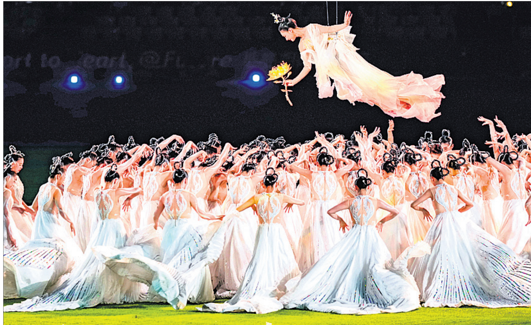
ଏସିଆନ୍ ଗେମ୍ସର ଉଦ୍‌ଯାପନୀ ଉତ୍ସବରେ କଳାକାରମାନେ ନୃତ୍ୟ ପରିବେଷଣ କରୁଛନ୍ତି ।