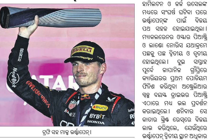
ଟ୍ରଫି ସହ ମାକ୍ସ ଭର୍ଷ୍ଟାପେନ୍‌।

ଲୋସେଲ୍(କାତାର), ୯।୧୦(ଏପି) ରେଡ୍‌ବୁଲ୍‌ର ମାକ୍ସ ଭର୍ଷ୍ଟାପେନ୍‌ ପୁଣି ଫର୍ମୁଲା ଓପନ ଚାମ୍ପିୟନ ହୋଇଛନ୍ତି। ରବିବାର ସେ କାତାର ଗ୍ରାଉଣ୍ଡ ଜିତିଛନ୍ତି। ୨୦୨୩ ସିଜନରେ ଏହା ହେଉଛି ତାଙ୍କର ୧୪ତମ ଗ୍ରାଉଣ୍ଡ ବିଜୟ। ଶନିବାର