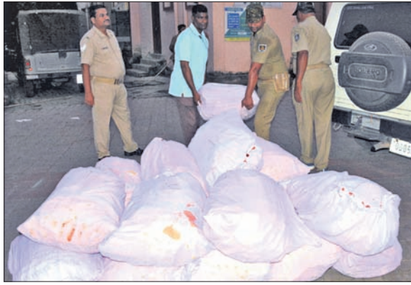
କର୍ମ କର୍ମ ସିରପ।

ଡିଏସ୍‌ପିଓ କରିଥିଲା। ସେଠାରେ ଏକ ବୋଲିରେ ୬ ଜଣ କର୍ମ ସିରପ ବିକ୍ରି ନେଇ କଥାବାର୍ତ୍ତା କରୁଥିଲେ। ଏହି ସମୟରେ ପୋଲିସ୍ ଯୋଜନାବଦ୍ଧ ଭାବେ ସେମାନଙ୍କୁ ଯେଉଁଠି ଥାନାରେ ପକାୟନ କରିବାକୁ ସୁଯୋଗ ପାଇ ନ ଥିଲେ। ସେଠାରୁ ୬ଜଣଙ୍କୁ ପୋଲିସ୍ ଚିରଫ କରିବା ସହ ସେମାନଙ୍କଠାରୁ ଏକ ଡାଏରି, ୫ ହଜାର ୪୦୦ ବୋତଲ କର୍ମ ସିରପ ଓ ନଗଦ ୧୨ ହଜାର ଟଙ୍କା, ୨ ମୋଟରସାଇକେଲ (୭୫୧୫ଟି-୮୭୫୮ ଓ ୭୫୧୫ଟି-୮୨୪୬) ଜବତ