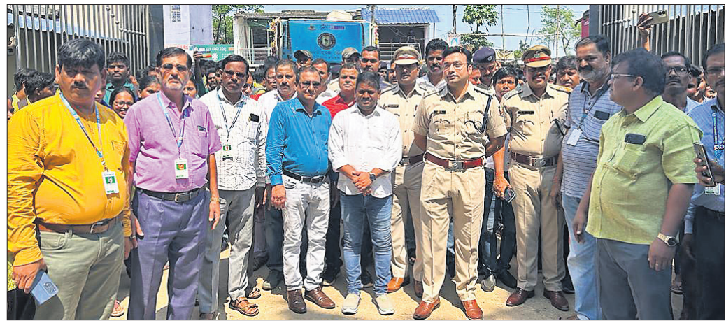
ଭାପୁରରେ ସାଇବର ସଚେତନତା ରଥକୁ ପୋଲିସ୍ ଓ କନସାଧାରଣଙ୍କ ପକ୍ଷରୁ ସ୍ୱାଗତ କରାଯାଇଛି।

ନୟାଗଡ଼ ଜିଲ୍ଲା ସଚେତନତା ଆନା ଅନ୍ତର୍ଗତ ବାହାଡ଼ା ବଜାରରେ ସୋମବାର ସାଇବର ସୁରକ୍ଷା ସଚେତନତା ରଥକୁ ସ୍ୱାଗତ କରାଯାଇଛି।