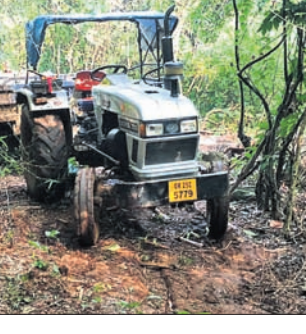
ଏସବୁ ଟ୍ରାକ୍ଟର ଚାଳକ ଓ ସହଯୋଗୀ ବନ କର୍ମଚାରୀଙ୍କୁ ଦେଖି ଗାଡ଼ି ଚାଳିଥିବାରୁ ୫୬ ଧାରାରେ ଗାଡ଼ି ଜବତ କରିବା ସହ ୨ଟି ମାମଲା ରୁଜୁ କରାଯାଇଥିବା ରେଞ୍ଜର ନିଖୁଳେ ମାମଲା ସୂଚନା ଦେଖାଯାଇଛି।

ସୋମବାର ଓଡ଼ିଶା ବନାଞ୍ଚଳ ଅନ୍ତର୍ଗତ ବାହାଡ଼ାଖେଲୀ ସେକ୍ଟର ନାରୀଆଥ ସଂରକ୍ଷିତ ଜଙ୍ଗଲ ଓ ଓଡ଼ିଶା ସେକ୍ଟର ତେନ୍ତି ଜଙ୍ଗଲରୁ ବନ ବିଭାଗ ୨ଟି ଟ୍ରାକ୍ଟର ଜବତ କରିଛି।