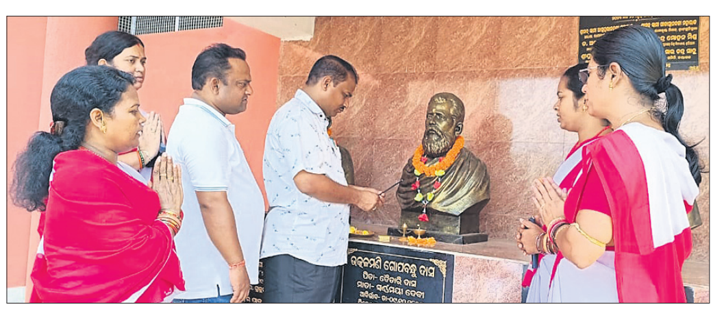
ନୟାଗଡ଼ ସରକାରୀ ଶିଶୁବିଦ୍ୟାଳୟ ପରିସରରେ ଥିବା ଗୋପବନ୍ଧୁଙ୍କ ପ୍ରତିମୂର୍ତ୍ତିରେ ପୂଷ୍ପମାଳ୍ୟ ଅର୍ପଣ କରାଯାଇଛି।

ଓଡ଼ିଶାର ଉତ୍କଳମଣି ପଣ୍ଡିତ ଗୋପବନ୍ଧୁ ଦାସଙ୍କ ଜୟନ୍ତୀ ନୟାଗଡ଼ ହାଉସିଂ ବୋର୍ଡ଼ ନିକଟ ଶ୍ରୀରାମକୃଷ୍ଣ ଆଦର୍ଶ ଶିକ୍ଷାକେନ୍ଦ୍ର ପରିସରରେ ଅନୁଷ୍ଠିତ ହୋଇଛି।