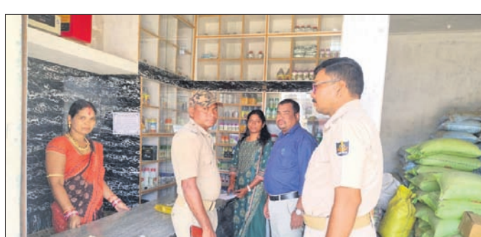
ଏକ ସାର ଦୋକାନରେ ଅଧିକାରୀମାନେ ଚଢ଼ାଉ କରୁଛନ୍ତି।

ଚିଟଲାଗଡ଼, ୯୧୦ (ଶରତ ମିଶ୍ର) ବଲାଙ୍ଗୀର ଜିଲ୍ଲା ଚିଟଲାଗଡ଼ ଉପଖଣ୍ଡରେ ସରକାରୀ କଟକଣା ଜାରି କରିଥିବା କାର୍ତ୍ତବୀର ପାରାକାଟ ଚୋରଦାର ବିକ୍ରି ହେଉଛି।