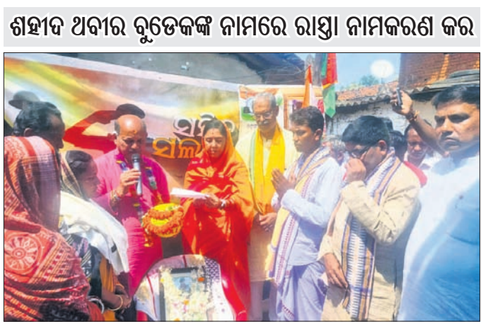
ଶହୀଦ ଅବୀର ବୃତ୍ତକଳା ନାମରେ ରାସ୍ତା ନାମକରଣ କର