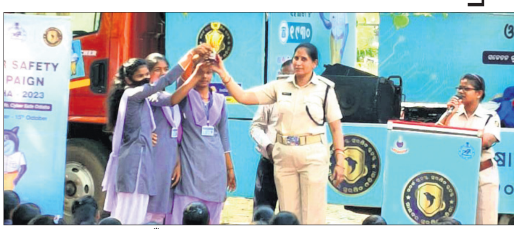
ଦେଓଗାଁ ମୁକ୍ତ ବୁକ୍ସ କଲେଜରେ କୃତୀ ଛାତ୍ରୀଙ୍କୁ ପୁରସ୍କୃତ କରାଯାଇଛି।