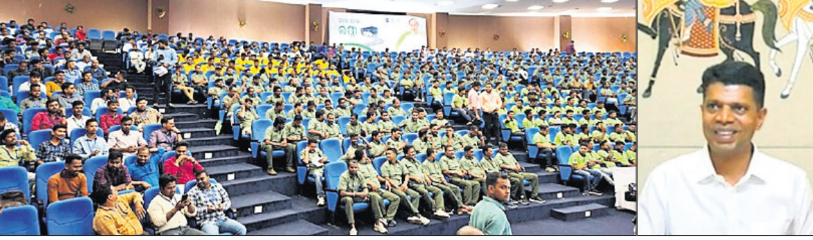
ଲୋକସେବା ଭବନ କର୍ମଚାରୀମାନଙ୍କ ସେତୁରେ 'ଲକ୍ଷ୍ମୀ' ଯୋଜନାର ବସ୍ କର୍ମଚାରୀମାନଙ୍କ ସହିତ ଆଲୋଚନା କରୁଛନ୍ତି ୫-ଟି ସ୍ୱତନ୍ତ୍ର ଭି.କେ. ପାଞ୍ଚିଆନ ।

ଭୁବନେଶ୍ୱର, ୯୧୧୦(ପୁନିଃ ମିଶ୍ର) ମୁଖ୍ୟମନ୍ତ୍ରୀଙ୍କ ବ୍ୟକ୍ତିଗତ ସ୍ୱତନ୍ତ୍ର (୫-ଟି) ଭି.କେ. ପାଞ୍ଚିଆନ ଯୋଗଦାନ କରି 'ଲକ୍ଷ୍ମୀ' ଯୋଜନାର ବସ୍ କର୍ମଚାରୀମାନଙ୍କ ସହିତ ଆଲୋଚନା କରି ସେମାନଙ୍କୁ ନିର୍ଦ୍ଦେଶ ଦେବା ଯୋଗାଇ ଦେବାକୁ ପରାମର୍ଶ ଦେଇଛନ୍ତି। ଲୋକସେବା ଭବନ କର୍ମଚାରୀମାନଙ୍କ ସେତୁରେ ଆୟୋଜିତ କାର୍ଯ୍ୟକ୍ରମରେ ବସ୍ ଡ୍ରାଇଭର, କଣ୍ଡକ୍ତର ଓ ମ୍ୟାନେଜରମାନଙ୍କୁ