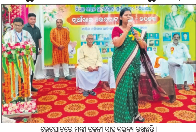
ଭେଟଘାଟରେ ମନ୍ତ୍ରୀ ରୁକ୍ମିଣୀ ସାହୁ ବକ୍ତବ୍ୟ ରଖିଥିଲେ।