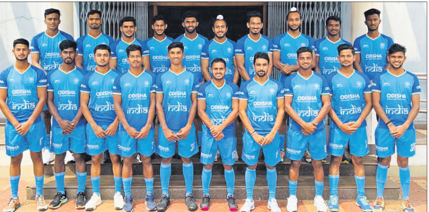
ସୁଲତାନ ଜୋହର କପ୍ ପାଇଁ ମନୋନୀତ ଭାରତୀୟ ହକି ଦଳ।

ବେଙ୍ଗାଳୁରୁ, ୯।୧୦ ସୁଲତାନ ଜୋହର କପ୍ ଟୁର୍ନିୟମେଣ୍ଟ ହକି ଦଳର ଗଠନ ହେଉଛି ଏହା ଗଠନ ଦିନରୁ ହେବ। ପୂର୍ବରୁ ଏହି ପ୍ରତିଯୋଗିତାରେ ଯେଉଁ ଲେଖାଏ ଦଳ ଖେଳୁଥିବାବେଳେ ଏଥର ଏହା ଗଠନ ଦିନରୁ ହେବ।