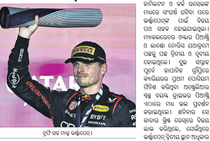
ଟ୍ରଫି ସହ ମାକ୍ସ ଭର୍ଷ୍ଟାପେନ୍।

ଲୋସେଲ(କାତାର), ୯।୧୦(ଏସି) ରେଡ୍ ବୁଲ୍ ମାକ୍ସ ଭର୍ଷ୍ଟାପେନ୍ ପୁଣି ଫର୍ମୁଲା ଓପନ ଚାମ୍ପିୟନ ହୋଇଛନ୍ତି। ରବିବାର ସେ କାତାର ଗ୍ରାଉଣ୍ଡ ଛାଡ଼ିଛନ୍ତି। ୨୦୨୩ ବିଜୟରେ ଏହା ହେଉଛି ତାଙ୍କର ୧୪ତମ ଗ୍ରାଉଣ୍ଡ ବିଜୟ। ଶନିବାର ଆସୁଥିବା ଟିଏମ୍ ୧୬ରେ ସେ ତାଙ୍କର ଚତୁର୍ଥ ଗାଇଡଲ ହାସଲ କରିସାରିଥିଲେ। ରେଡ୍ ବୁଲ୍ ଡ୍ରାଇଭର ପୋଲ୍ ପୋଲିଶନରୁ ରେସ୍ ଆରମ୍ଭ କରିଥିଲେ। ପ୍ରଥମ କର୍ନରେ ୧୪ତମ ଗ୍ରାଉଣ୍ଡ ବିଜୟ। ଶନିବାର