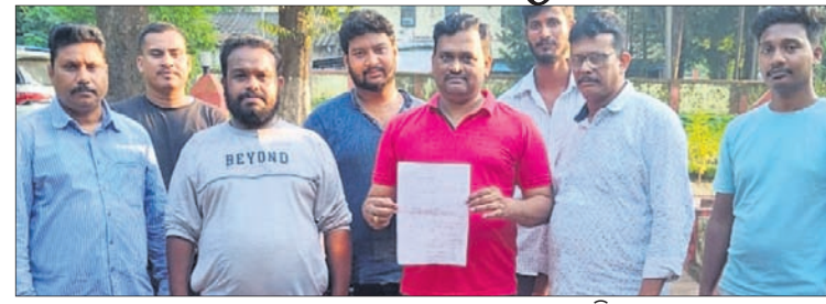
ଭାଜପା ନେତାମାନେ ଇସ୍ତଫା ପତ୍ର ଦେଖାଉଛନ୍ତି।

ବାଲିମେଳା ଏନ୍-ଏସି ୨୦ ଭାଜପା ନେତାଙ୍କ ସମୂହ ଇସ୍ତଫା ଦେଇଛନ୍ତି।