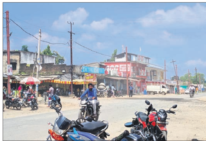
ଧୂଳିଗୁଣ୍ଡ ଉଡ଼ୁଥିବା ଲୋଇସିଂହା ଚାରିଛକ ରାସ୍ତା।

ଲୋଇସିଂହା, ୯୧୦ (ପୁଣ୍ୟ ଚନ୍ଦ୍ର) ବଲାଙ୍ଗୀର-ବରଗଡ଼ ୨୬ ନଂ ଜାତୀୟ ରାଜପଥ ପ୍ରଶସ୍ତିକରଣ କାମ ମନ୍ଦିର ଗତିରେ ଚାଲିଛି।