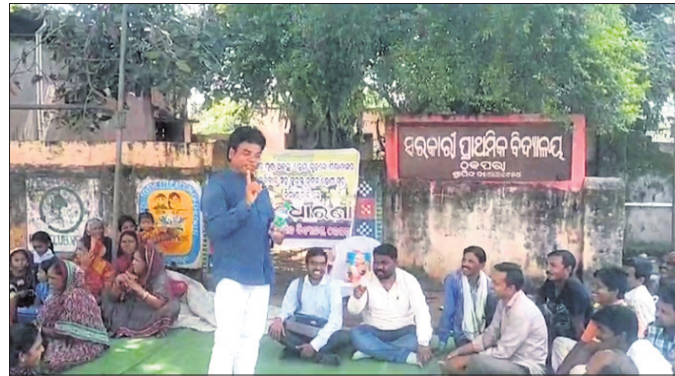
ସ୍କୁଲ ସମ୍ମୁଖରେ ଅଭିଭାବକମାନେ ଧାରଣା ଦେଇଛନ୍ତି।