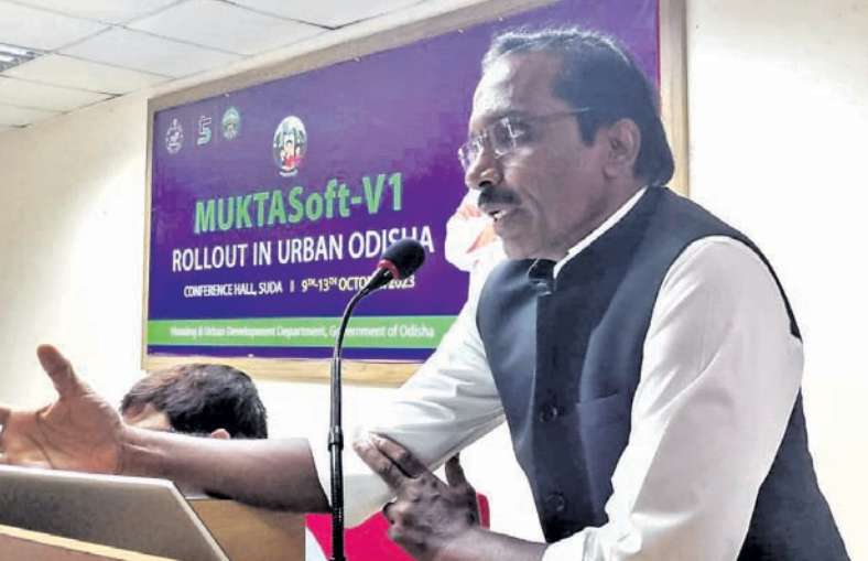
କାର୍ଯ୍ୟକ୍ରମରେ ବିଭାଗୀୟ ପ୍ରମୁଖ ଶାସନ ସଚିବ ଡି.ମାଧୁରାୟନଙ୍କ ଉଦ୍‌ବୋଧନ ଦେଖିବାକୁ।

ସହରାଞ୍ଚଳର ଗରିବ ଅଧିବାସୀଙ୍କ ଜୀବିକା ସୁରକ୍ଷା ନିମନ୍ତେ ଗୋଷ୍ଠୀ ଦ୍ୱାରା ସଞ୍ଚାଳିତ ତଥା ସମାଜର ସାଧାରଣ ସ୍ତରରୁ ଯୋଜନା ପ୍ରସ୍ତୁତ କରୁଥିବା 'ମୁକ୍ତାମହା କର୍ମଚଂଚର ଅଭିଯାନ-ମୁକ୍ତା' ଓଡ଼ିଶା ସରକାରଙ୍କ ଏକ ପ୍ରମୁଖ ପଦକ୍ଷେପ ରୂପେ ଆବୃତ ହୋଇଛି।