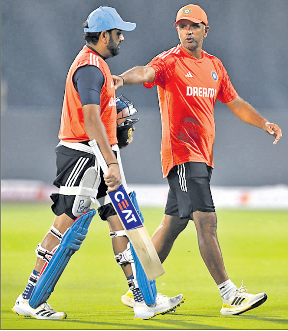
ନେତୃ ସେବନରେ ଅଧିନାୟକ ରୋହିତ ଶର୍ମାଙ୍କ ସହ କୋଚ୍ ରାହୁଲ ଦ୍ରାଭିଡ଼।

ଦିନିକିଆ କ୍ରିକେଟ ବିଶ୍ୱକପର ଅଷ୍ଟେଲିଆ ବିପକ୍ଷ ପ୍ରଥମ ମ୍ୟାଚରେ ସଂଘର୍ଷପୂର୍ଣ୍ଣ ବିଜୟ ପରେ ରୁଧିରା ନୂଆଦିଲ୍ଲୀର ଅରୁଣ ଜେଟଲି ଷ୍ଟାଡ଼ିୟମରେ ଆଫଗାନିସ୍ତାନ ବିପକ୍ଷରେ ଖେଳିବ ଭାରତ। ଚେନ୍ନାଇର ଶ୍ୱେତ ଗ୍ରୀନ ଖେଳି ଫେରିଥିବା ଭାରତ ଏକ ନୂତନ ଭେଙ୍ଗୁରେ ଖେଳିବ। ଦିଲ୍ଲୀରେ ଖେଳା ଯାଇଥିବା ପ୍ରଥମ ମ୍ୟାଚରେ ୭୦୦ରୁ ଅଧିକ ରନ୍ ସଂଗୃହୀତ ହୋଇଥିଲା। ପିଚ୍ ଫେସ୍ ବୋଲରଙ୍କୁ ସାମାନ୍ୟ ସହାୟତା କରୁଥିବା ବେଳେ ପ୍ରଥମ ମ୍ୟାଚର ବଳରେ ଗୋଟିଏ ପରିବର୍ତ୍ତନ ଦେଖିବାକୁ ମିଳିପାରେ। ଚେନ୍ନାଇରେ ଖେଳୁଥିବା ରବିଚନ୍ଦ୍ରନ ଅଶ୍ୱିନଙ୍କ ସ୍ଥାନରେ ଭାରତ ମହମ୍ମଦ ଶାମିଙ୍କୁ ଖେଳାଇପାରେ। ବିଶ୍ୱକପ ପୂର୍ବରୁ ଭିନ୍ନ ଭିନ୍ନ ଭେଙ୍ଗୁରେ ଆହୁଜ୍ଞ କରିବା ଭାରତ ପାଇଁ ବଡ଼ ଚ୍ୟାଲେଞ୍ଜ ରହିବ ବୋଲି ରୋହିତ ଶର୍ମା କହିଥିଲେ। ଚଳିତ ବିଶ୍ୱକପରେ ଭାରତ ୮ଟି ଭିନ୍ନ ଭିନ୍ନ ଭେଙ୍ଗୁରେ ଏହାର ମ୍ୟାଚଗୁଡ଼ିକ ଖେଳିବାକୁ ଥିବାବେଳେ ଏହା ଦଳ ପାଇଁ ସବୁଠାରୁ ବଡ଼ ଚ୍ୟାଲେଞ୍ଜ ଭାବରେ ଉଭା ହେବ।