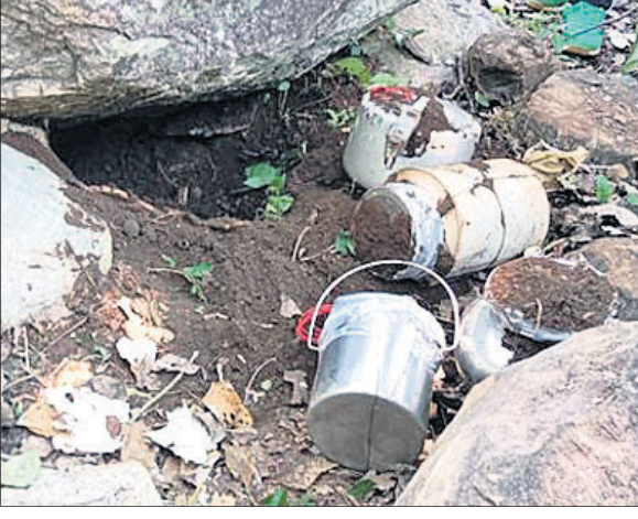
ମାଲକାନଗିରି, ୧୦.୧୦(ସୂର୍ଯ୍ୟୋଧନ ପାତ୍ର)

ମାଲକାନଗିରି ଜିଲା ପଡ଼ିଆ ସଦର ବ୍ଲକରେ ଥିବା ୧୪୨ ବାଟାଲିୟନ ବିଏସ୍‌ଏଏ ଯବାନଙ୍କ ଦ୍ୱାରା ୫ ଟିପିନ୍ ବୋମା ଜବତ କରାଯାଇଛି।