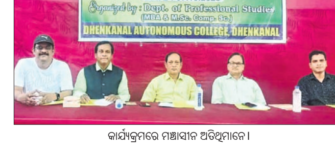
କାର୍ଯ୍ୟକ୍ରମରେ ମଞ୍ଚସାଥୀ ଅତିଥିମାନେ।

ଦେଈନାଳ, ୧୦୧୦ (ରତନ ନାୟକ) ଦେଈନାଳର ପୋଲ ଡଳକୁ ଓଲଟିଲା ଟ୍ରେଲର ଦିଲ୍ଲୀ ଗରଖାଳ ଏପ୍ରିଲ ୨-୧ରେ ବିଜୟୀ ହେବ।