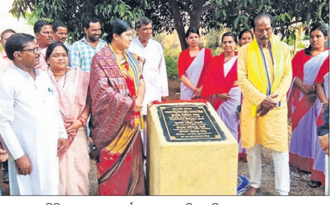
ଭିତ୍ତିପ୍ରସ୍ତର ସ୍ଥାପନ କାର୍ଯ୍ୟକ୍ରମରେ ଏମ୍ପିଙ୍କ ସହିତ ଅନ୍ୟମାନେ।