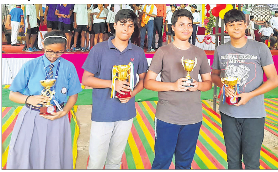
ପୁରସ୍କାର ସହ କୃତା ପ୍ରତିଯୋଗୀ।