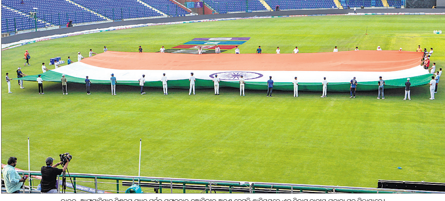
ଭାରତ-ଆଫଗାନିସ୍ତାନ ବିଶ୍ୱକପ ମ୍ୟାଚ ପୂର୍ବରୁ ମଙ୍ଗଳବାର ନୂଆଦିଲ୍ଲୀର ଅରୁଣ ଜେଟଲି ଷ୍ଟାଡ଼ିୟମରେ ଏକ ବିରାଟ ଜାତୀୟ ପତାକା ସହ ପିଲାମାନେ।