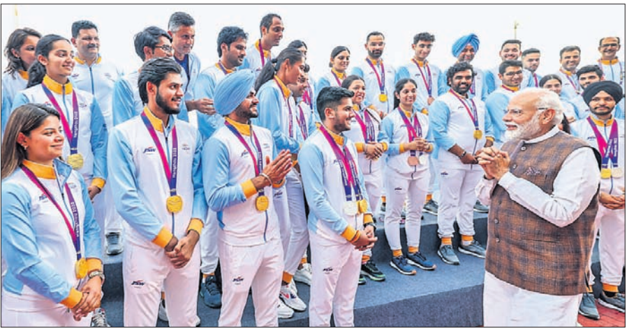
ନୂଆଦିଲ୍ଲୀରେ ମଙ୍ଗଳବାର ଏସିଆନ ଗେମ୍ ପଦକ ବିଜେତାଙ୍କ ସହ ପ୍ରଧାନମନ୍ତ୍ରୀ ନରେନ୍ଦ୍ର ମୋଦି।

ଖେଳାଳି, କୋର୍ଟ, ଟ୍ରେନିଂ ଓ ପିଲିଓ ମାନଙ୍କୁ ଧ୍ୟାନବାଦ ଜଣାଇଥିଲେ। ବିଦେଶ ମାଟିରେ ଏହା ଭାରତର ସର୍ବଶ୍ରେଷ୍ଠ ପ୍ରଦର୍ଶନ ହୋଇଥିବା ବେଳେ ଏକ କ୍ରୀଡ଼ା ରାଷ୍ଟ୍ର ଭାବରେ ଆମେ ସିଡି ବିନରେ ଯାଉଥିବା ନେଇ ହୃଦୟୋପ ହେଉଛି ବୋଲି ମୋଦି କହିଥିଲେ। ଭାରତ ଚଳିତ ଗେମ୍ରେ ୨୮ ସ୍ୱର୍ଣ୍ଣ, ୩୮ ରୌପ୍ୟ ଓ ୪୧ ବ୍ରୋଞ୍ଜ ସହିତ ସମୁଦାୟ ୧୦୭ ପଦକ ହାସଲ କରିଛି। ଏହା ସହିତ ଖେଳାଳି ମାନଙ୍କୁ ଏହି ସପକାତକୁ ସ୍ୱଦେଶୀ ଚିକିତ୍ସା ସପକାତ ସହିତ ପ୍ରଧାନମନ୍ତ୍ରୀ ଭୂଜନା କରିଥିଲେ। ଛୁଟି, ଆର୍ଟେରୀ, ସ୍ମାଗରେ ଭାରତ ଏହାର ସର୍ବଶ୍ରେଷ୍ଠ ପ୍ରଦର୍ଶନ କରିଥିବା ବେଳେ ମହିଳା କ୍ରିକେଟ ଓ ପୁରୁଷ କ୍ରିକେଟ ଦଳ ପ୍ରଥମ ଥର ସ୍ୱର୍ଣ୍ଣ ପଦକ ହାସଲ କରିଥିଲେ। ମହିଳା ଶର୍ତ୍ତରେ ୭୨ ବର୍ଷରେ, ୪୪୪୦୦ ମିଟର ଡିଲେରେ ୬୧ ବର୍ଷ ପରେ, ଇଣ୍ଡିଆନରେ ୪୧ ଓ ବ୍ୟାଟମିନିଂରେ ୪୦ ବର୍ଷ