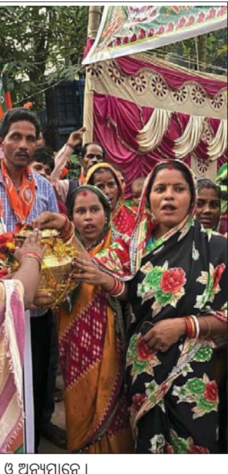
କାର୍ଯ୍ୟକ୍ରମରେ ଯୋଗଦେଇଥିବା ଭାବପା ନେତା ଓ ଅନ୍ୟମାନେ ।

କୋଇଲିପୁର ପଞ୍ଚାୟତରେ କାମ ନ କରି ୮ଟି ପ୍ରଜାକୁ ଫର୍ମା ଦିଲ ଯତ୍ନା