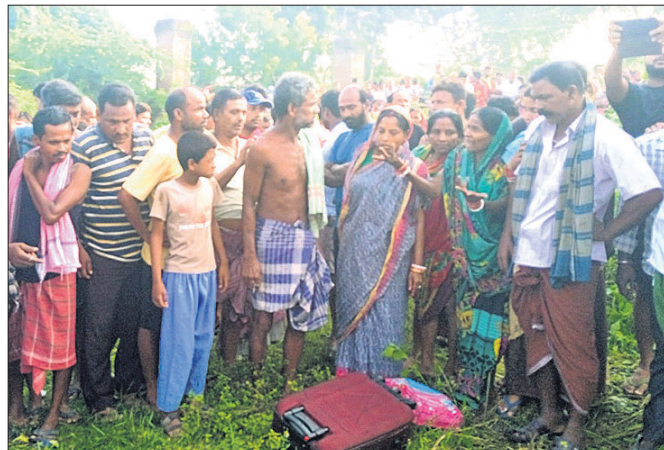
ଘଟଣାସ୍ଥଳରେ ଲୋକଙ୍କ ଭିଡ଼ । ବାସୁଦେବପୁର, ୧୦.୧୦ (ନାରାୟଣ ପ୍ରସାଦ ବାରିକ)

ସ୍ତ୍ରୀଙ୍କ ତତ୍ପରିପି ହତ୍ୟା କରି ରାସ୍ତାକଡ଼ରେ ଫିଙ୍ଗିଦେଲେ ସ୍ୱାମୀ । ଏଭଳି ଏକ ନୃଶଂସ ଘଟଣା ଦେଖିବାକୁ ମିଳିଛି ଭଦ୍ରକ ଜିଲ୍ଲା ବାସୁଦେବପୁର ବ୍ଲକ ଖରିବା ବିନାୟକପୁର ପଞ୍ଚାୟତର ସେମାନଙ୍କ ପରିବାର ଲୋକଙ୍କୁ ହସ୍ତାନ୍ତର କରାଯାଇଥିଲା । ମାତ୍ର ଏହାପରେ ବି ଆହୁରି ୨୮ଟି ମୃତଦେହ ଅତିହୀନ ରହିଯାଇଥିଲା । ତେଣୁ ଅନ୍ତିମ ସଂସ୍କାର ପାଇଁ ଅଗଷ୍ଟ ୨୫ରେ ସିଏଆଇ ପକ୍ଷରୁ ଖୋର୍ଦ୍ଧା ଜିଲ୍ଲାପାଳଙ୍କୁ ଠିକି ଲେଖାଯାଇଥିଲା । ଏନେଇ ଅକ୍ଟୋବର ୭ରେ ଖୋର୍ଦ୍ଧା ଜିଲ୍ଲାପାଳ ଠିକିଲେଖିବା ପରେ ବିଏମ୍‌ସି ଏମ୍‌ସି ଗଠିକରି ମଙ୍ଗଳବାରଠାରୁ ସଂସ୍କାର ପ୍ରକ୍ରିୟା ଆରମ୍ଭ କରିଛି ।