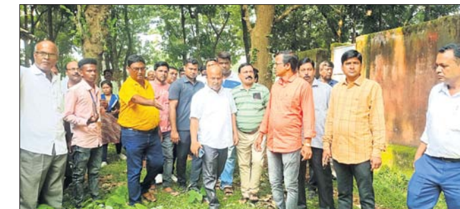
ବିଧାୟକ ଓ ଅନ୍ୟମାନେ ଜେନାପୁର କଲେଜ ପରିଦର୍ଶନ କରୁଛନ୍ତି ।

କୋଇଲିପୁର ପଞ୍ଚାୟତରେ କାମ ନ କରି ୮ଟି ପ୍ରଜାକୁ ଫର୍ମା ଦିଲ ଯତ୍ନା