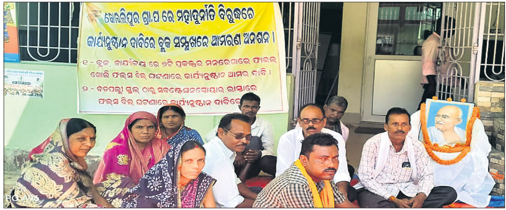
ବୁଦ୍ଧ କାର୍ଯ୍ୟାଳୟ ଆଗରେ ନିର୍ବାଚିତ ପ୍ରତିନିଧିମାନେ ଧାରଣାରେ ବସିଛନ୍ତି ।

କୋଇଲିପୁର ପଞ୍ଚାୟତରେ କାମ ନ କରି ୮ଟି ପ୍ରଜାକୁ ଫର୍ମା ଦିଲ ଯତ୍ନା