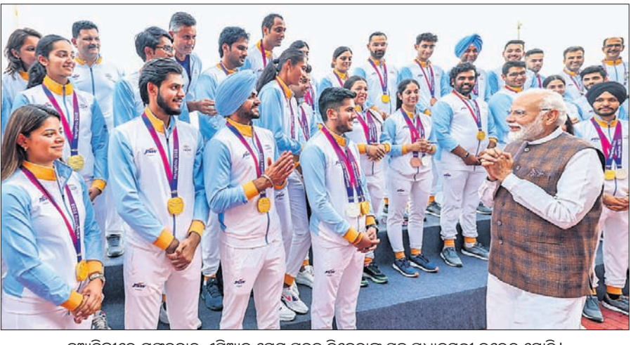
ନୂଆଦିଲ୍ଲୀରେ ମଙ୍ଗଳବାର ଏସିଆନ ଗେମ୍ ପଦକ ବିଜେତାଙ୍କ ସହ ପ୍ରଧାନମନ୍ତ୍ରୀ ନରେନ୍ଦ୍ର ମୋଦି।

ପରେ ଭାରତ ପଦକ ହାସଲ କରିଥିଲା। ଦଶନ୍ଧି ଧରି ଭାରତ ଏହି ସବୁ ଇଭେଣ୍ଟରେ ପଦକ ହାସଲ କରି ନ ଥିବା ବେଳେ ଖେଳାଳି ମାନଙ୍କ ପ୍ରୟାସରେ ହିଁ ଏହା ସମ୍ଭବ ହୋଇ ପାରିଛି। ଭାରତ ପଦକ ହାସଲ କରିଥିବା ଇଭେଣ୍ଟ ମଧ୍ୟରୁ ୨୦ଟି ରେ ପ୍ରଥମ ଥର ପୋଡିୟମ ଫିନିଶ କରିବାରେ ସମର୍ଥ ହୋଇଥିବା ବେଳେ ଦେଶର ସୁବିଖ୍ୟାତି ପାଇଁ ଏହା ଏକ ନୂତନ ରାସ୍ତା ଉନ୍ମୁଳ୍ଲ କରିଛି। ପ୍ରଧାନମନ୍ତ୍ରୀ ଦେଶର ନାରୀଶକ୍ତିକୁ ପ୍ରଶଂସା କରିବା ସହିତ ମହିଳା ଆଧିକାରୀଙ୍କୁ ଏହାର ଶ୍ରେୟ ଦେଇଥିଲେ। ଭାରତ ଯେତେକ ପଦକ ଜିତିଛି ଏହାର ଅଧାରୁ ଅଧିକ ମହିଳା ଖେଳାଳି ମାନେ ଜିତିଥିବା ବେଳେ ପୁରୁଷ ଖେଳାଳିଙ୍କ ଠାରୁ କୌଣସି ରୁଣ୍ଡରେ କମ୍ ରୁହୁଛି ବୋଲି ପ୍ରମାଣିତ କରିଛି। ମହିଳା କ୍ରିକେଟ ଦଳ ପଦକ ଜିତି ଆରମ୍ଭ କରିଥିବା ବେଳେ ବକ୍ସିଂରେ ଭାରତୀୟ ଖେଳାଳି ସର୍ବାଧିକ ପଦକ ବିଜୟୀ ହେବାର ରେକର୍ଡ୍ କରୁଛନ୍ତି। ଆଧିକାରୀଙ୍କୁ ମଧ୍ୟ ଭାରତୀୟ ମହିଳା ଖେଳାଳି ମାନେ ଚମତ୍କାର ପ୍ରଦର୍ଶନ କରିଛନ୍ତି। ପୂର୍ବରୁ ମଧ୍ୟ ଆମର ଆଧିକାରୀ ମାନେ ଭଲ ପ୍ରଦର୍ଶନ କରୁଥିଲେ। ୨୦୧୪ ପରଠାରୁ ସରକାରଙ୍କ ଉଦ୍ୟମ କାରଣରୁ ଏଥିରେ ଉନ୍ନତି ଆସିଛି। ୨୦୧୪ ପରଠାରୁ କ୍ରୀଡ଼ା ବଜେଟ୍‌କୁ ୩ ଗୁଣ ବୃଦ୍ଧି କରାଯାଇଥିବା ବେଳେ ଖେଳାଳି ଇଣ୍ଡିଆ ଓ ଟ୍ୟୁରେ ଭାରତ ଆଗୁଆ ରହିଛି। ଭାରତ ଆଗାମୀ ଦିନରେ ଅଲିମ୍ପିକ୍‌ରେ ଭଲ ପ୍ରଦର୍ଶନ କରିବାର ଆଶା ରହିଥିବା ବେଳେ ୨୦୨୬ରେ ଜାପାନରେ ହେବାରୁ ଥିବା ଆଗାମୀ ସଂସ୍କରଣରେ ମଧ୍ୟ ସମାନ ପ୍ରଦର୍ଶନ ଦୋହରାଇବା ବେଳେ ଆଶା କରାଯାଉଛି ବୋଲି ମୋଦି କହିଥିଲେ। ବର୍ତ୍ତମାନ ଦେଶର କୋଣ ଅନୁକୋଣରୁ ଆଧିକାରୀ ମାନେ ଖେଳାଳି ଇଣ୍ଡିଆ ଭାବରେ ରହି ନେଇ ହେଉଛନ୍ତି। ସେହିପରି ସୁବ