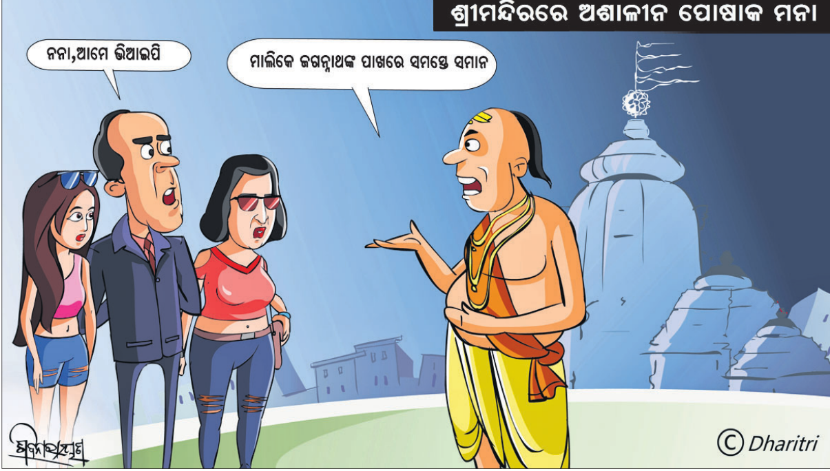
ଶ୍ରୀମନ୍ଦିରରେ ଅଶାଳୀନ ପୋଷାକ ମନା

ଠଡ଼ିଆ ଜଗତମାଳି ଓ ରୁଡ଼ି ପ୍ରୟୋଗ - ଏ.କେ. ମିଶ୍ର ପବ୍ଲିଶର୍ସ ପ୍ରା:ଲି:ଖ: