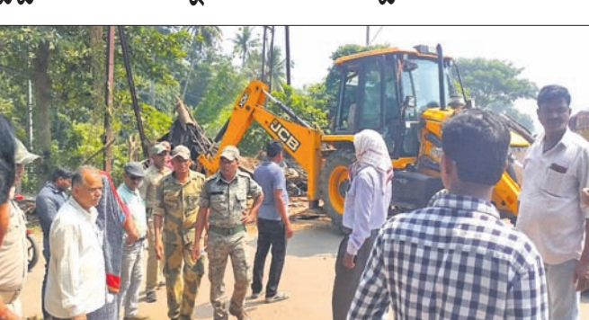
ପ୍ରଶାସନ ପକ୍ଷରୁ କବର ଦଖଲ ଉଲ୍ଲେଦ କରାଯାଇଛି।

ତେରାବିଶ, ୧୦୧୦ (ବେବର୍ତ୍ତୀ ଅକ୍ଷୟ ଦାସ) କୁରୁଜଙ୍ଗା-ଓଲଟି ପୂର୍ବ ବିଭାଗ ରାସ୍ତା ତେରାବିଶ ରୁକ୍ ଅଞ୍ଚଳର ମୁଖ୍ୟ ରାସ୍ତା। ଏହାକୁ ଦୃଷ୍ଟିରେ ରଖି କେନ୍ଦ୍ରାପଡ଼ା ପୂର୍ବ ବିଭାଗ ପକ୍ଷରୁ ଏହି ରାସ୍ତାକୁ ଓସାରିଆ କରିବା ଓ ରାସ୍ତାର ଉନ୍ନତିକରଣ କାର୍ଯ୍ୟ ଚାଲୁଛି। ମାତ୍ର ଏହି ରାସ୍ତାର ପ୍ରଶସ୍ତିକରଣ ବିଶେଷଜ୍ଞ ଡାକ୍ତରମାନେ ଯୋଗଦେଇ ୧୫୦ରୁ ଊର୍ଦ୍ଧ୍ୱ ରୋଗୀଙ୍କୁ ପରୀକ୍ଷା କରି ମାରଣାଣେ ଔଷଧ ଦିବରଣ କରିଥିଲେ।