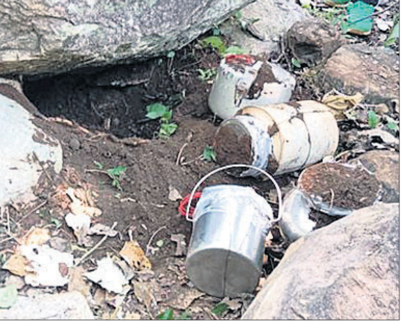
ମାଲକାନଗିରି, ୧୦।୧୦(ବୃହସ୍ପତିବାର ପାତ୍ର)

ମାଲକାନଗିରି ଜିଲ୍ଲା ପଡ଼ିଆ ସଦର ବ୍ଲକରେ ଥିବା ୧୪୨ ବାଟାଲିୟନ ବିଏସ୍‌ଏଫ୍ ଯବାନଙ୍କ ଦ୍ୱାରା ୫ ଟିପିନ୍ ବୋମା ଜବତ କରାଯାଇଛି। ପ୍ରକାଶ ଯେ, ମଙ୍ଗଳବାର ସକାଳେ ପଡ଼ିଆସ୍ଥିତ ୧୪୨ ବାଟାଲିୟନ ବିଏସ୍‌ଏଫ୍ ଯବାନମାନେ ସୂଚନା ମୋଡେରୁ ପଞ୍ଚାୟତ ପର୍ଯ୍ୟାପକୀ ଲିଙ୍କ ରୋଡ଼ଠାରୁ ଅଢ଼େଇ କି.ମି. ଦୂରରେ ଥିବା ଜମାଭାଗରୁ ଜଙ୍ଗଲରେ କୋପି କରୁଥିବା ସମୟରେ ଏକ ଗଛ ମୂଳେ ମେଟାଲ ଡିଟେକ୍ଟର ସାହାଯ୍ୟରେ ଉକ୍ତ ଟିପିନ୍ ବୋମା ଥିବା ଜାଣିବାକୁ ପାଇଥିଲେ। ପରେ ଉକ୍ତ ସ୍ଥାନରୁ ୫ଟି ଟିପିନ୍ ବୋମା ଜବତ କରି ବୋମା ନିଷ୍ପ୍ରୟକାରୀ ଦଳକୁ ଖବର ଦେଇଥିଲେ। ନିଷ୍ପ୍ରୟକାରୀ ଦଳ ବୋମାଗୁଡ଼ିକୁ ନିଷ୍ପ୍ରୟ କରିଥିବା ଜଣାପଡ଼ିଛି।