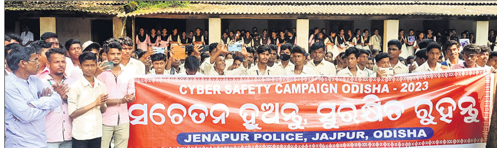
ଜେନାପୁର କଲେଜରେ ଅନୁଷ୍ଠିତ ସଚେତନତା କାର୍ଯ୍ୟକ୍ରମରେ ସାମିଲ ହୋଇଥିବା ଛାତ୍ରାଛାତ୍ରୀ ।

କୋଇଲିପୁର ପଞ୍ଚାୟତରେ କାମ ନ କରି ୮ଟି ପ୍ରଜାକୁ ଫର୍ମା ଦିଲ ଯତ୍ନା