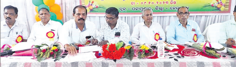
ସୁରଭି କାର୍ଯ୍ୟକ୍ରମରେ ଉପସ୍ଥିତ ଅତିଥିମାନେ।

ପଞ୍ଚାମୁଖା, ୧୦୧୧୦ (ଅକ୍ଷୟ ବିଶ୍ୱାଳ) ପଞ୍ଚାମୁଖା ଏମ୍.ଏ.ଏ. ହାଇସ୍କୁଲରେ ସୁରଭି ଶିଶୁଙ୍କୁ ପଢ଼ାଉଥିବା ପ୍ରତିଭା ବିକାଶ ପ୍ରକଳ୍ପର ଶୁଭାରମ୍ଭ ହେବ।