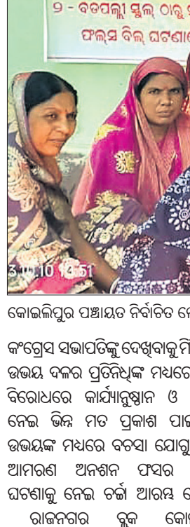
କୋଇଲିପୁର ପଞ୍ଚାୟତ ନିର୍ବାଚିତ ଲୋକପ୍ରତିନିଧିମାନେ ଫଳ ଉପରାଜାରେ ମତ ଦେଇଥିବା ଦିନର ଚିତ୍ର।

ରୁକ୍ମ ସମ୍ପୁରଣ ପାଇଁ ଡାକିଥିବା କଂଗ୍ରେସ ସମର୍ଥକ ଓ ଭାଜପା ସମର୍ଥକ ପ୍ରତିନିଧିଙ୍କ ଆମରଣ ଅନଶନରେ ପ୍ରତିନିଧିଙ୍କ ମଧ୍ୟରେ ବନ୍ଧନ ଓ ଚିତ୍କାର ପରେ ଆମରଣ ଅନଶନ ଅଧାରୁ ଉଠିଗଲା ଅନଶନ।