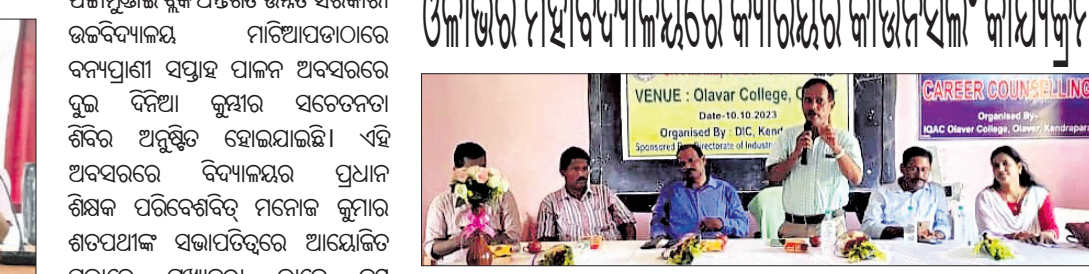
ଓକ୍ଲାହୋମା ମହାବିଦ୍ୟାଳୟରେ କାର୍ଯ୍ୟକ୍ରମରେ ଉପସ୍ଥିତ ଅତିଥିମାନେ।

ଓକ୍ଲାହୋମା, ୧୦୧୧୦ (ସଞ୍ଜୟ କୁମାର ବାଗ) ଓକ୍ଲାହୋମା ମହାବିଦ୍ୟାଳୟରେ କାର୍ଯ୍ୟକ୍ରମ ଚଳାଇବା ପାଇଁ ପ୍ରସ୍ତୁତ ହେବ।