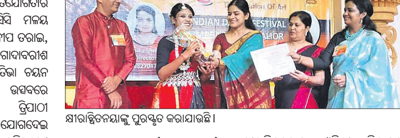
ଜାତୀୟ ନୃତ୍ୟ ମହୋତ୍ସବରେ କାର୍ଯ୍ୟକ୍ରମରେ ଉପସ୍ଥିତ ଅତିଥିମାନେ।

କେନ୍ଦ୍ରାପଡ଼ା, ୧୦୧୧୦ (କରନ୍ତା ଅଧିକାରୀ) କେନ୍ଦ୍ରାପଡ଼ା ଜିଲ୍ଲା ନୃତ୍ୟ ମହୋତ୍ସବରେ କାର୍ଯ୍ୟକ୍ରମ ଚଳାଇବା ପାଇଁ ପ୍ରସ୍ତୁତ ହେବ।