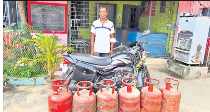
ଗିରଫ ଅଭିଯୁକ୍ତ ଓ ଜବତ ଗ୍ୟାସ ସିଲିଣ୍ଡର ।

କୋଇଲିପୁର ପଞ୍ଚାୟତରେ କାମ ନ କରି ୮ଟି ପ୍ରଜାକୁ ଫର୍ମା ଦିଲ ଯତ୍ନା