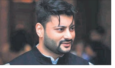
ଆବେଗର ସହ ଭିଡିଓ ଜରିଆରେ ନିଜର ସମସ୍ୟା ଡାକ୍ତା ସ୍ତ୍ରୀ ଅଭିନେତ୍ରୀ ବର୍ଷାଙ୍କୁ କହିଛନ୍ତି। ଅନୁଭବ କହିଛନ୍ତି, ମୋ ବାପାଙ୍କ ଦେହ ଅସୁସ୍ଥ। ଘରେ ପାଲିଥିବା ପଶୁର ଦେହ ମଧ୍ୟ ଅସୁସ୍ଥ। ବାପାଙ୍କ ବିଚ୍ଚିନା ଡାକ୍ତାଲିସିଏ ହେଉଛି। ବାପା ହୋସ୍ପିଟାଲ ରହୁନାହାନ୍ତି। କାହାରିକୁ ଚିହ୍ନି ପାରୁନାହାନ୍ତି। ରାତିରେ