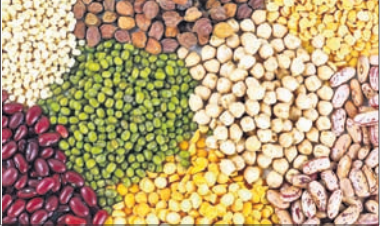
ପ୍ରୟୋଗ କରନ୍ତୁ । ଜରପୋକ ଲାଗିଲେ ହେକ୍ସା ପିଛା ରୋଗର ୧ ଲିତର କିମ୍ବା ଇମିଡାକ୍ଲୋପ୍ରିଡ୍ ୧୭.୮ ଏସ୍.ଏଲ୍. ୧୨୦ ମି.ଲି.କୁ ୫୦୦ ଲିତର ପାଣିରେ ମିଶାଇ ସିଞ୍ଚନ କରନ୍ତୁ । ପାଉଁଶିଆ ରୋଗ ଦେଖାଦେଲେ ହେକ୍ସା ପିଛା ୨ କି.ଗ୍ରା. ସେଡିଟି ଗଣକ ବା ସଲଫୋକ୍ସି ସିଞ୍ଚନ କରନ୍ତୁ ।

ଏକ କି.ଗ୍ରା. ଡାଲିଜାତୀୟ ବିହନ ପିଛା କାର୍ବେକ୍ସିନ୍ ୩୭.୫% x ଥିରାମ୍ ୩୭.୫% ମିଶ୍ରିତ ଡିଏସ୍ ପିମିନାକ୍ସିକ୍ ବିଷ ୨ ଗ୍ରାମ୍ ଗୋଳାଇ ବିହନ ଭୁଣନ୍ତୁ । ହେକ୍ସା ପ୍ରତି ୨୫ କି.ଗ୍ରା. ବିହନରେ ୫୦୦ ଗ୍ରାମ୍ ରାଇଜୋବିୟମ୍ ବାକ୍ଟେରିଆ କଲଚର ପ୍ରୟୋଗ କରନ୍ତୁ । ବିହନକୁ ଧାଡ଼ିରେ ଭୁଣନ୍ତୁ । ଧାଡ଼ିକୁ ଧାଡ଼ି ୩୦ ସେ.ମି. ବ୍ୟବଧାନ ରଖନ୍ତୁ । ଜମିକୁ ଭଲ ଭାବରେ ଚାଷ କରି ହେକ୍ସା ପିଛା ୧୦/୧୨ ଶଗଡ଼ ଶତା ଗୋବରଖାତ ବା କମ୍ପୋଷ୍ଟ ପ୍ରୟୋଗ କରନ୍ତୁ । ପୁରା ବିରି ପାଇଁ ହେକ୍ସା ପ୍ରତି ୨୦ କି.ଗ୍ରା. ଯବକ୍ଷାରକାମି, ୪୦ କି.ଗ୍ରା. ଫସ୍ଫୋଫେଟ୍ ୨୦ କି.ଗ୍ରା. ପରାଫ୍ ସବଂ ମଟର ପାଇଁ ୨୫ କି.ଗ୍ରା. ଯବକ୍ଷାରକାମି, ୫୦ କି.ଗ୍ରା. ଫସ୍ଫୋଫେଟ୍ ଓ ୨୫ କି.ଗ୍ରା. ପରାଫ୍ ସାର