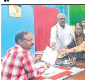
ରାଜକର୍ମିଣୀ ବିତିପଦ୍ମ ସରପଞ୍ଚମାନେ ଦାବିପତ୍ର ଦେଇଛନ୍ତି।

ରାଜକର୍ମିଣୀ ରୁକ୍ମ ସରପଞ୍ଚମାନେ ଦାବିପତ୍ର ଦେଲେ।