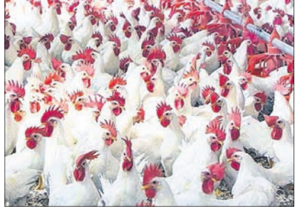
ବ୍ୟବସ୍ଥା କରନ୍ତୁ । ଘର ଅଗଣାରେ ପାଳନ କରୁଥିବା ସବୁ କୁକୁଡ଼ାକୁ ୨ ମାସ ବେଳକୁ ଓ ଡା' ପରେ ୬ ମାସ ଅନ୍ତରରେ ଆର.ଗୁ.ବି. ଚିକା ଦିଅନ୍ତୁ । ଏହା ଫଳରେ ବାଣୀକ୍ଷେତ୍ର ରୋଗ ହେବ ନାହିଁ ।

ବାଣୀକ୍ଷେତ୍ର ରୋଗର ପ୍ରତିଷେଧକ ପାଇଁ ୫ ଦିନରୁ ୭ ଦିନର କୁକୁଡ଼ା ଚିଆଁ ଲାସୋଗା ଚିକା ଦିଅନ୍ତୁ । ୨୧ ଦିନର କୁକୁଡ଼ାକୁ ଲାସୋଗା (ବୁଝାଇ) ଚିକା ଦିଅନ୍ତୁ । ୫୨ ଦିନର କୁକୁଡ଼ାକୁ ଆର.ଗୁ.ବି. ଚିକା ଦିଅନ୍ତୁ । ୧୧୨ ଦିନର କୁକୁଡ଼ାକୁ ଆର.ଗୁ.ବି. ବୁଝାଇ ଚିକା ଦିଅନ୍ତୁ । ବର୍ତ୍ତମାନ କୁକୁଡ଼ା ଗୃହର ଭିତର ଉଦ୍ଭାପନ ଦିନରେ ପାଖାପାଖି ୩୫୦ ରୁ ୪୦୦ ସେଲସିୟସ୍ ରହୁଥିଲେ କୁକୁଡ଼ା ଚିଆଁ ପାଳନ ପାଇଁ ଏହାଠାରୁ ଅଧିକ ଉଦ୍ଭାପନ ଦିଅନ୍ତୁ ନାହିଁ ଏବଂ ଗୃହର ଘରକାରେ ଓଦା ଅଞ୍ଚଳ ଓହଳାଇବା ବ୍ୟବସ୍ଥା କରନ୍ତୁ । ଚିକା, ଆଇସୋଷ୍ଟିକ୍ କିମ୍ବା ସିମେଣ୍ଟ ୬ ମାସ ଅନ୍ତରରେ ଆର.ଗୁ.ବି. ଚିକା ଦିଅନ୍ତୁ । ଛାତ ଥିଲେ ତାହା ଉପରେ ନିର୍ଦ୍ଦା ପକାଇବା ଘରକାରେ ରଖାଯାଇ ଚିକା ଦେବା ସହଜ ନାହିଁ ।