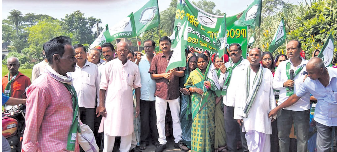
ପଦଯାତ୍ରାରେ ସାମିଲ ହୋଇଥିବା ବିଜେଡି ନେତା ଓ କର୍ମୀ ।

କୋଇଲିପୁର ପଞ୍ଚାୟତରେ କାମ ନ କରି ୮ଟି ପ୍ରଜାକୁ ଫର୍ମା ଦିଲ ଯତ୍ନା