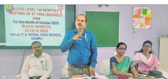
ଦନରାଷ୍ଟ୍ର ପି.ଏସ୍. ମଡେଲ ହାଇସ୍କୁଲରେ ଆୟୋଜିତ ବାର୍ଷିକ ବୃତ୍ତପ୍ରଦାନ ବୈଠକ।

ହାଇସ୍କୁଲ ଛାତ୍ରଛାତ୍ରୀଙ୍କୁ ସାମଗ୍ରିକ ଶୈକ୍ଷିକ ବିକାଶ ପାଇଁ ବିଦ୍ୟାଳୟ ଓ ଗଣଶିକ୍ଷା ବିଭାଗ ତରଫରୁ ଆଉ ଏକ ନୂତନ ପଦକ୍ଷେପ ଗ୍ରହଣ କରାଯାଇଛି। ମଙ୍ଗଳବାର ରାଜ୍ୟର ସମସ୍ତ ଉଚ୍ଚ ବିଦ୍ୟାଳୟର ପ୍ରଧାନ ଶିକ୍ଷକଙ୍କ ପ୍ରଥମ ବୃତ୍ତପ୍ରଦାନ ମାସିକ ବୈଠକ ଅନୁଷ୍ଠିତ ହୋଇଯାଇଛି। ପ୍ରତ୍ୟେକ ବ୍ଲକ୍ ବ୍ଲକ୍ ଶିକ୍ଷାଧିକାରୀ (ବିଇଓ)ଙ୍କ ଅଧିକାରୀଙ୍କ ଆୟୋଜିତ ଏହି ବୈଠକରେ ଛାତ୍ରଛାତ୍ରୀଙ୍କ ଶୈକ୍ଷିକ ବିକାଶ ପାଇଁ ଆବଶ୍ୟକ ପଦକ୍ଷେପ ସମ୍ବନ୍ଧରେ ଆଲୋଚନା କରାଯାଇଥିଲା। ରାଜ୍ୟ ସରକାରଙ୍କ ବିଭିନ୍ନ ଶିକ୍ଷା ଯୋଜନା ବିଷୟରେ ବିଭିନ୍ନ ବିସ୍ତୃତ ବିବରଣୀ ପ୍ରଦାନ କରିଥିଲେ। ବୃତ୍ତାନ୍ତରେ ଉଚ୍ଚ ବିଦ୍ୟାଳୟରେ ଆଲୋଚନା ହୋଇଥିଲା। ଏହାବ୍ୟତୀତ ମୁଖ୍ୟମନ୍ତ୍ରୀ ଶିକ୍ଷା ପୁରସ୍କାର, ଆକାଶ୍ୟା ପାଠ୍ୟକ୍ରମ ଅଧୀନରେ କ୍ଲବ୍ ଗଠନ, ବିକାଶ ପାଇଁ ଗ୍ରହଣ କରାଯାଇଥିବା ପଦକ୍ଷେପର ସୁପରିଚାଳନା ଭଳି ଅନେକ ବିଷୟବସ୍ତୁ ଉପରେ ବୈଠକରେ ଆଲୋଚନା କରାଯାଇଥିଲା। ସ୍ମାର୍ତ