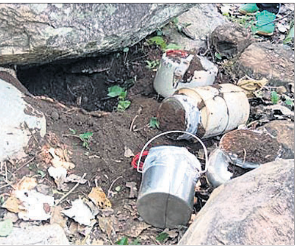
ମାଲକାନଗିରି, ୧୦.୧୦.୨୩(ବୃହସ୍ପତି ଦିନ)

ମାଲକାନଗିରି ଜିଲ୍ଲା ପଡ଼ିଆ ସଦର ବ୍ଲକରେ ଥିବା ୧୪୨ ବାଟାଲିୟନ ବିଏସ୍‌ଏଫ୍ ଯବାନଙ୍କ ଦ୍ୱାରା ୫ ଟିପିନ୍ ବୋମା ଜବତ କରାଯାଇଛି। ପ୍ରକାଶ ଯେ, ମଙ୍ଗଳବାର ସକାଳେ ପଡ଼ିଆସ୍ଥିତ ୧୪୨ ବାଟାଲିୟନ ବିଏସ୍‌ଏଫ୍ ଯବାନମାନେ ଦୁର୍ଗମ ମୋଡେରୁ ପଞ୍ଚାୟତ ପର୍ଯ୍ୟାପକୀ ଲିଙ୍କ ରୋଡ଼ଠାରୁ ଅଢ଼େଇ କି.ମି. ଦୂରରେ ଥିବା ଜମାଦାରୁଡ଼ା ଜଙ୍ଗଲରେ କୋପି-୧ କରୁଥିବା ସମୟରେ ଏକ ଗଛ ମୂଳେ ମୋଟାଲ ଡିକେଟର ସାହାଯ୍ୟରେ ଉକ୍ତ ଟିପିନ୍ ବୋମା ଥିବା ଜାଣିବାକୁ ପାଇଥିଲେ। ପରେ ଉକ୍ତ ସ୍ଥାନରୁ ୫ଟି ଟିପିନ୍ ବୋମା ଜବତ କରି ବୋମା ନିଷ୍ପ୍ରୟକାରୀ ଦଳକୁ ଖବର ଦେଇଥିଲେ। ନିଷ୍ପ୍ରୟକାରୀ ଦଳ ବୋମାଗୁଡ଼ିକୁ ନିଷ୍ପ୍ରୟ କରିଥିବା ଜଣାପଡ଼ିଛି।