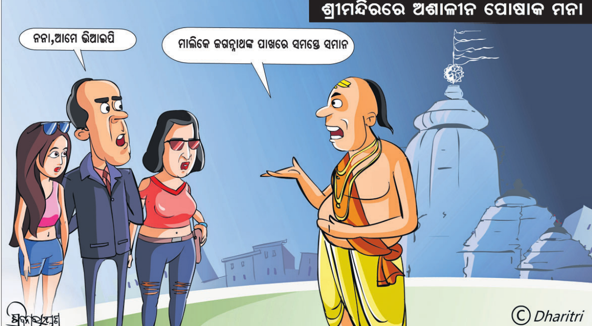
ଶ୍ରୀମନ୍ଦିରରେ ଅଶାନ୍ତନ ପୋଷାକ ମନା