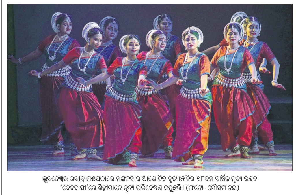
ଭୁବନେଶ୍ୱର ରବାନ୍ତ ମଣ୍ଡପାଠରେ ମଙ୍ଗଳବାର ଆୟୋଜିତ ନୃତ୍ୟାଞ୍ଜଳିର ୧୮ତମ ବାର୍ଷିକ ନୃତ୍ୟ ଉତ୍ସବ 'ଦେବଦାସୀ'ରେ ଶିଳ୍ପୀମାନେ ନୃତ୍ୟ ପରିବେଷଣ କରୁଛନ୍ତି।

ପୂର୍ବରୁ ବହି ଚୟନ ବେଆଇନ ବୋଲି ପ୍ରକାଶକମାନେ ଅଭିଯୋଗ କରିଛନ୍ତି। ସେହିପରି ଯେକୌଣସି ସରକାରୀ ଚେକ୍ସ ବା ଲଓଆଇ ପ୍ରକ୍ରିୟାରେ ଆବେଦନକାରୀ ଅନୁଷ୍ଠାନର ପୂର୍ବ ବର୍ଷମାନଙ୍କର ଆର୍ଥିକ ଆୟବ୍ୟୟ ହିସାବ ଓ ଲାଭକ୍ଷତ୍ରିତ ନଥି ଦାଖଲ କରିବା ଅତ୍ୟନ୍ତ ଗୁରୁତ୍ୱପୂର୍ଣ୍ଣ। କିନ୍ତୁ କିଛି ପ୍ରକାଶକଙ୍କୁ ସୁଯୋଗ ଦେବା ଲକ୍ଷ୍ୟରେ ଓସେପା କର୍ତ୍ତୃପକ୍ଷ ଏଥର ଚେକ୍ସ ପ୍ରକ୍ରିୟାରେ ଏ ନଥିକୁ ବାଧ୍ୟତାମୂଳକ କରିନାହାନ୍ତି। ଏହିଭଳି ବିଭିନ୍ନ ଅସଙ୍ଗତି ସମ୍ପର୍କରେ ମୁଖ୍ୟମନ୍ତ୍ରୀଙ୍କୁ ଟିପି କରି କଣାକଣା ସହିତ ଏହି ଲଓଆଇକୁ ବାତିଲ କରି ସାନି ଟେଣ୍ଡର କରିବାକୁ ପ୍ରକାଶକମାନେ ଅନୁରୋଧ କରିଛନ୍ତି। ଏଥିସହିତ ପୂର୍ବ ବର୍ଷର ବକେୟା ଅର୍ଥ ଦିଆଯାଇ ବୋଲି କୁହାଯାଇଛି। ମୁଖ୍ୟମନ୍ତ୍ରୀ ଏ ମାମଲାରେ ହସ୍ତକ୍ଷେପ କରିବା ସହ ସାନି ଟେଣ୍ଡର ପାଇଁ ନିର୍ଦ୍ଦେଶ ଦେବେ ବୋଲି ପ୍ରକାଶକମାନେ ଆଶାପ୍ରକଟ କରିଛନ୍ତି। ନଚେତ୍ ୫୦ରୁ ଅଧିକ ପ୍ରକାଶକ ଏକାଠି ହୋଇ ଓସେପା ବିରୋଧରେ ଆଇନର ଆଶ୍ରୟ ନେବାକୁ ବାଧ୍ୟ ହେବେ ବୋଲି କହିଛନ୍ତି।