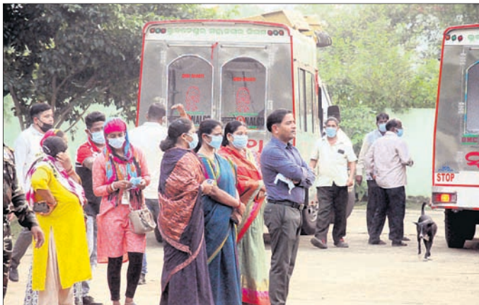
ସଂସ୍କାର କାର୍ଯ୍ୟକୁ ବିଏମ୍‌ସିସିଏ କର୍ମଚାରୀଙ୍କ ସହ ଅନୁମୋଦିତ ଭାବେ ସୁଚନା ଦିଆଯାଇଛି। ଏହା ପରେ ରାତି ୧୦ଟା ପୁଣ୍ୟ ମୋର୍ଟ ୨୧ଟି ମୃତଦେହ ହସ୍ତାନ୍ତର କରାଯାଇଥିଲା। ତେବେ ବିକଳିତ ରାତି ପର୍ଯ୍ୟନ୍ତ ଏହି ପ୍ରକ୍ରିୟା ଚାଲୁ ରହିବ ବୋଲି ଏମ୍‌ସିସିଏ ପକ୍ଷରୁ ସୂଚନା ଦିଆଯାଇଛି।

ବାହାନଗା ଟ୍ରେନ୍ ଦୁର୍ଘଟଣାର ୪ମାସ ପରେ ଅତିହୀନ ମୃତଦେହ ସଂସ୍କାର ପ୍ରକ୍ରିୟା ଆରମ୍ଭ ହୋଇଛି। ଏହି ଦୁର୍ଘଟଣାରେ ଅତିହୀନ ହୋଇ ରହିଯାଇଥିବା ୨୮ଟି ମୃତଦେହ ଭୁବନେଶ୍ୱର ଏମଏସ୍‌ସିଏ ହୋଇ ରହିଥିଲା। ତେବେ ସାମୁହିକ ଅତିହୀନ ସଂସ୍କାର ପାଇଁ ଖୋର୍ଦ୍ଧା ଜିଲ୍ଲା ପ୍ରଶାସନ ଏବଂ ବିଏମ୍‌ସିସିଏ ତଦନ୍ତକାରୀ ସଂସ୍ଥା ସିଏଆଇ ସହକ୍ଷମ ସଙ୍କେତ ଦେବା ପରେ ମଙ୍ଗଳବାର ପ୍ରକ୍ରିୟା ଆରମ୍ଭ ହୋଇଛି। ପ୍ରାଥମିକ ପର୍ଯ୍ୟାୟରେ ଏମ୍ ସମ୍ପୂର୍ଣ୍ଣ ବିଏମ୍‌ସିସିଏ ଗର୍ଭ ମୃତଦେହ ହସ୍ତାନ୍ତର କରାଯିବ। ପରେ ଭରତପୁର ଶ୍ମଶାନରେ ମୃତଦେହ ସେଚୁରିଟି ସହକାର କରାଯାଇଥିଲା। ଏହା ପରେ ରାତି ୧୦ଟା ପୁଣ୍ୟ ମୋର୍ଟ ୨୧ଟି ମୃତଦେହ ହସ୍ତାନ୍ତର କରାଯାଇଥିଲା। ତେବେ ବିକଳିତ ରାତି ପର୍ଯ୍ୟନ୍ତ ଏହି ପ୍ରକ୍ରିୟା ଚାଲୁ ରହିବ ବୋଲି ଏମ୍‌ସିସିଏ ପକ୍ଷରୁ ସୂଚନା ଦିଆଯାଇଛି। ବିଏମ୍‌ସିସିଏ ପୂର୍ବତନ ରେଳପଥ ଏବଂ ସିଏଆଇ