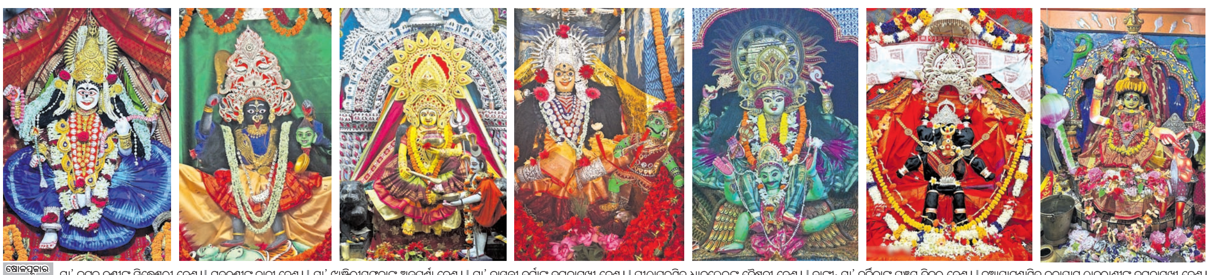
ଷୋଳପୁର ପଞ୍ଚମ ଦିନ ମା' କଟକ ରଣାଳ ସିଦ୍ଧେଶ୍ୱରୀ ବେଶ । ଗଡ଼ଜାତୀୟ କାଳୀ ବେଶ । ମା' ଖଞ୍ଜିରାମଙ୍ଗଳାଙ୍କ ଅନୁପୂର୍ଣ୍ଣା ବେଶ । ମା' ବାସନ୍ତୀ ଦୁର୍ଗାଙ୍କ ବରକାମୁଖୀ ବେଶ । ପାଠପୁରସ୍ଥିତ ଧାକୁଲେଇଙ୍କ ଦୈତ୍ୟବେଶ । ବାଙ୍କା: ମା' ଚର୍ଚ୍ଚିକାଙ୍କ ପଞ୍ଚମ ଦିନର ବେଶ । ଚୁଆପାଟଣାସ୍ଥିତ କବାପାଟ ଠାକୁରାଣୀଙ୍କ ବରକାମୁଖୀ ବେଶ ।

ସଂକ୍ଷେପରେ ବିଧାୟକଙ୍କୁ ସମସ୍ୟା ଜଣାଇଲେ ଓଡ଼ିଆସୀ କଟକ, ୧୦୧୦ (ସୁପ୍ରିୟା ପ୍ରିୟଦର୍ଶିନୀ)