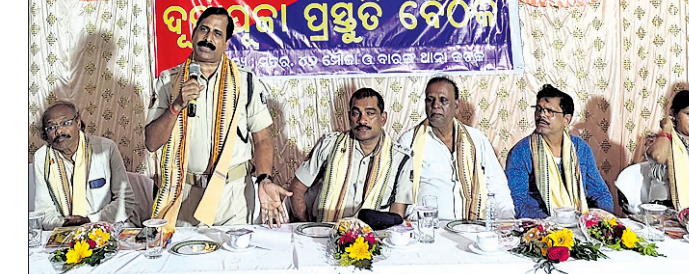
ପୁଲନଖରା, ୧୦୧୦ (ସତ୍ୟରଞ୍ଜନ ବାସନ୍ତୀପାତ୍ର)