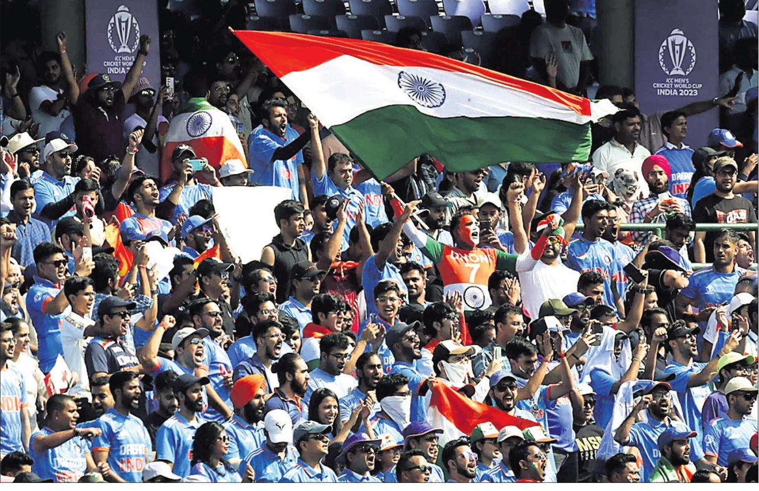
ଦିଲ୍ଲୀର ଅଭୁତ୍ତ ଜେଲ୍ଲା ଷ୍ଟାଡିୟମରେ ମ୍ୟାଚ ଉପଭୋଗ କରୁଛନ୍ତି ଭାରତୀୟ ପ୍ରଶଂସକ