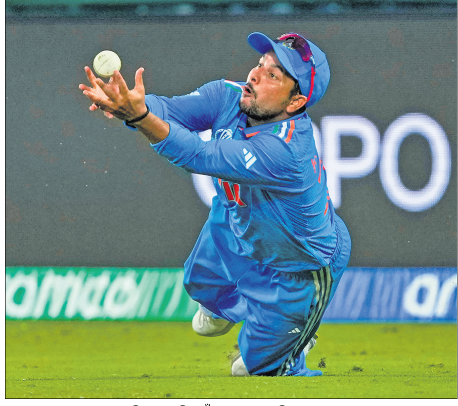
ଆଫଗାନିଷ୍ଠାନର ରଶିଦ୍ ଖାଁଙ୍କ କ୍ୟାଚ ନେଇଛନ୍ତି କୁଲଦୀପ ଯାଦବ

ସଫଳତା ହାସଲ କରିଥିଲେ। ଏହା ପୂର୍ବରୁ ସବିନ ତେହୁଲକର ଓ ଏବି ଡେଭିଲ୍ ୨୦ ମ୍ୟାଚରେ ୧୦୦୦ ରନ୍ ସମ୍ପୂର୍ଣ୍ଣ କରିଥିଲେ। ତତ୍ପୂର୍ଣ୍ଣ ଭାରତୀୟ ଖେଳାଳି ଭାବରେ ରୋହିତ ବିଶ୍ୱକପରେ ୧୦୦୦ ରନ୍ ସମ୍ପୂର୍ଣ୍ଣ କରିଛନ୍ତି। ପୂର୍ବରୁ ସବିନ ତେହୁଲକର, ସିରୀଜ ଗାଲୁଲି ଓ ବିରାଟ କୋହଲି ଏହି ମାଇଲଖୁଣ୍ଟ ହାସଲ କରିଥିଲେ। ଭାରତୀୟକ ମଧ୍ୟରେ ଏହା ବିଶ୍ୱକପରେ