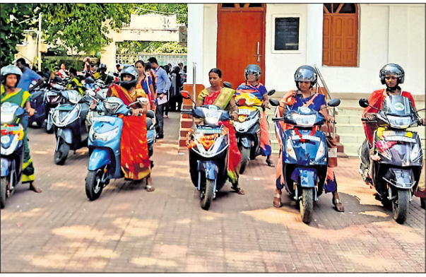
ସ୍ତୁତି ସହ ମିଶନଶକ୍ତି ମହିଳାମାନେ। ବାରିପଦା, ୧୧।୧୦

ପୁଖ୍ୟମନ୍ତ୍ରୀ ନବୀନ ପଟ୍ଟନାୟକ ରୁଧିରୀ ଭାବେ କନକପୁର ଜିଲ୍ଲାରେ ମିଶନ ଶକ୍ତି ସ୍ତୁତି ଯୋଜନା କରିଛନ୍ତି। ଏହି ପରିବେଶରେ ମହିଳାମାନଙ୍କୁ ଶକ୍ତି ମିଳିବାର ସହାୟତା ପ୍ରଦାନ କରିବା ପାଇଁ ପ୍ରୋତ୍ସାହନ ଦିଆଯାଇଛି।