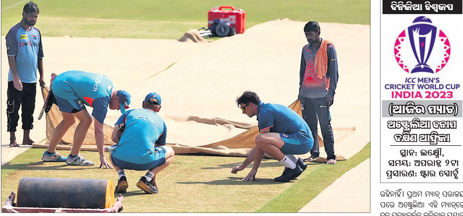
ଅଷ୍ଟ୍ରେଲିଆ ଅଧିନାୟକ ପ୍ୟାର୍ କୁମିନ୍ସ ଷ୍ଟୋର ପିଚ୍ ନିରୀକ୍ଷଣ କରୁଛନ୍ତି।

ଲକ୍ଷ୍ନୋ, ୧୧।୧୦ (ପି.ଟି.) ଗୁରୁବାର ଦିନିକିଆ କ୍ରିକେଟ ବିଶ୍ୱକପରେ ପରସ୍ପର ସାମ୍ନା କରିବେ ଦକ୍ଷିଣ ଆଫ୍ରିକା ଓ ଅଷ୍ଟ୍ରେଲିଆ। ପ୍ରଥମ ମ୍ୟାଚରେ ଦକ୍ଷିଣ ଆଫ୍ରିକା ବିଶାଳ ଷ୍ଟୋର ସହିତ ଶ୍ରୀଲଙ୍କାକୁ ପରାସ୍ତ କରିଥିବା ବେଳେ ଟେନାହାର ଭାରତ ବିପକ୍ଷ ଲୋ ଷ୍ଟୋର ମ୍ୟାଚରେ ପରାସ୍ତ ହୋଇଥିଲା।