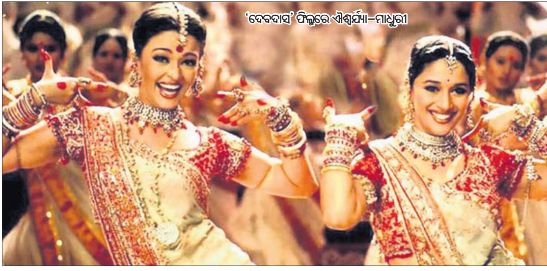
‘ଦେବଦାସ’ ଫିଲ୍ମରେ ‘ଶୈଶ୍ୱର୍ଯ୍ୟା-ମାଧୁରୀ’