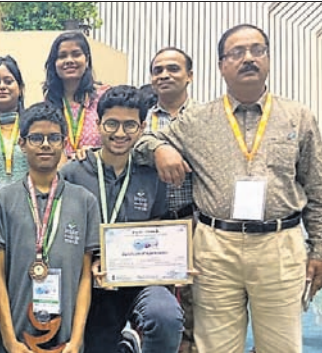
ପୁରସ୍କାର ପାଇଥିବା ଓଡ଼ିଶାର ୫ ଛାତ୍ରାଛାତ୍ରୀ।

ଭୁବନେଶ୍ୱର, ୧୧.୧୦ (ଅଧିକାରୀ ମହାରଣା) କେନ୍ଦ୍ର ସରକାରଙ୍କ ବିଜ୍ଞାନ ଓ କାରିଗରି କୌଶଳ ମନ୍ତ୍ରାଳୟ ତତ୍ତ୍ୱାବଧାନରେ