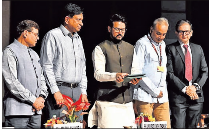
କେନ୍ଦ୍ର ସୂଚନା ଓ ପ୍ରସାରଣ ମନ୍ତ୍ରୀ ଅନୁରାଗ ଠାକୁର 'କେଟିବି- ଭାରତ ହେଁ ହମ୍'ର ଟ୍ରେଲର ଉନ୍ମୋଚନ କରୁଛନ୍ତି।

କେନ୍ଦ୍ରମନ୍ତ୍ରୀ ଅନୁରାଗ ଠାକୁର ଗୁରୁବାର ଏକ ଆନିମେସନ୍ ସିରିଜ୍ ଟ୍ରିପ୍, ଟ୍ରିପ୍ ଆଣ୍ଡ ବାଲିକନ୍ୟ (କେଟିବି) - ଭାରତ ହେଁ ହମ୍ ନେଇ ଉପସ୍ଥାପନ କରିଛନ୍ତି।