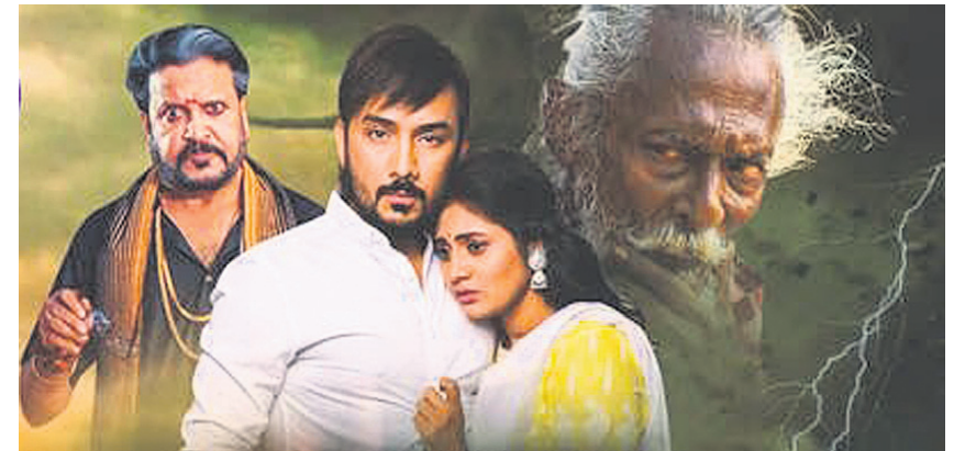
‘ରାଉଡ଼ି ରାଜା’ ଫିଲ୍ମର ଏକ ଦୃଶ୍ୟ