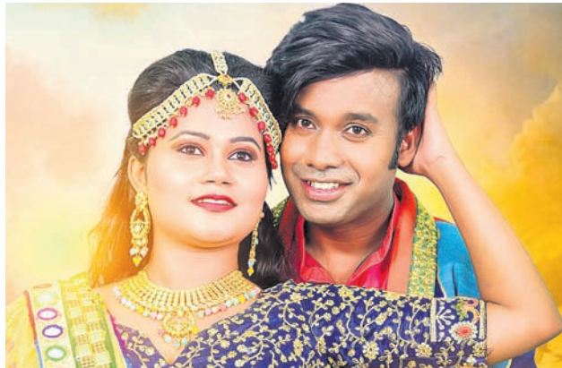
‘ଆଇଆଇସି ଧୀରେନ୍’ ଫିଲ୍ମର ଅର୍ପିତା-ଧୀରେନ୍