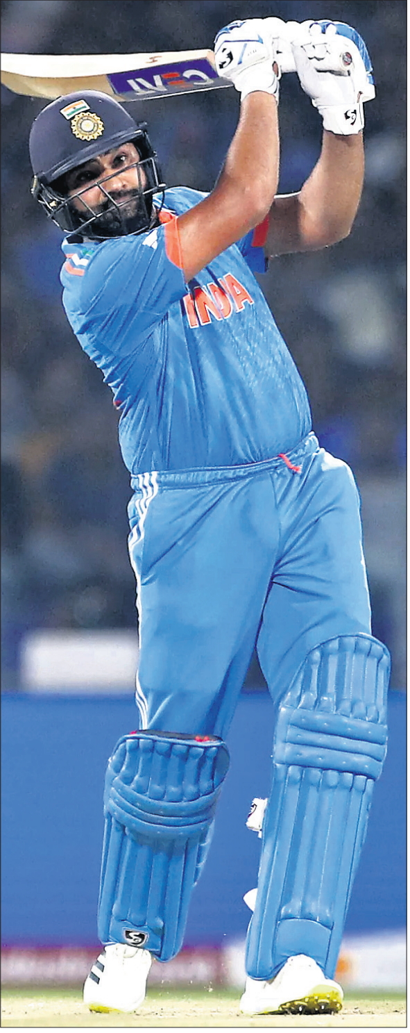
ଛକା ମାରିବା ଅବସରରେ ରୋହିତ ଶର୍ମା

ନୂଆଦିଲ୍ଲୀ, ୧୧/୧୦ ଭାରତୀୟ କ୍ରିକେଟ ଦଳର ଅଧିନାୟକ ରୋହିତ ଶର୍ମା ଆଫଗାନିଷ୍ଠାନ ବିପକ୍ଷ ମ୍ୟାଚରେ ଏକାଧିକ ରେକର୍ଡ ଅଧିକାରୀ ହୋଇଛନ୍ତି। ଏହି ମ୍ୟାଚରେ ଭାରତୀୟ କ୍ରିକେଟର କିୟତ୍ତା ସବିନ ତେହୁଲକର ଓ ଯୁନିଭର୍ସ ବସ୍ କ୍ରିସ୍ ଗେଲଙ୍କ ରେକର୍ଡ ଭାଙ୍ଗିବାରେ ସମର୍ଥ ହୋଇଛନ୍ତି ହିନ୍ଦ୍ୟାନ୍। ରୁଧିବାର ଅଭୁତ୍ତ ଜେଲ୍ଲା କ୍ରିକେଟ ଷ୍ଟାଡିୟମରେ ଶତକ ହାସଲ କରିବା ସହିତ ରୋହିତ ବିଶ୍ୱକପରେ ସର୍ବାଧିକ ଶତକ ଚାଲିକାରେ ସବିନଙ୍କ ରେକର୍ଡ ଭାଙ୍ଗିଥିଲେ। ଏହା ସହିତ ଅନ୍ତର୍ଜାତୀୟ କ୍ରିକେଟରେ ସର୍ବାଧିକ ଛକା ମାରିବାରେ ସେ କ୍ରିସ୍ ଗେଲଙ୍କ ରେକର୍ଡ ଭାଙ୍ଗିଛନ୍ତି। ବିଶ୍ୱକପରେ ସବିନ ୪୪ ମ୍ୟାଚ ଖେଳି ୬ ଶତକ ହାସଲ କରିଥିବା ବେଳେ ୧୯ ଚମ ବିଶ୍ୱକପ ମ୍ୟାଚରେ ରୋହିତ ତାଙ୍କ ରେକର୍ଡ ଭାଙ୍ଗିଛନ୍ତି। ସବିନ ନିଜ କ୍ୟାରିୟରରେ ୬ଟି ବିଶ୍ୱକପ ଖେଳିଥିବା ବେଳେ ରୋହିତଙ୍କ କ୍ୟାରିୟରରେ ଏହା ତୃତୀୟ ବିଶ୍ୱକପ। ୨୦୧୫ରେ ପ୍ରଥମ ଥର ବିଶ୍ୱକପ