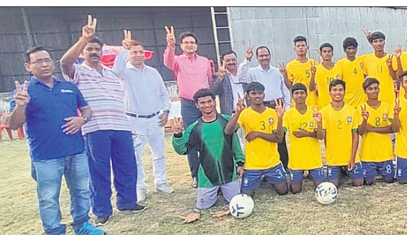
ଅତିଥିଙ୍କୁ ଗହଣରେ ଚାମ୍ପିୟନ ଦଳର ଖେଳାଳିମାନେ ।