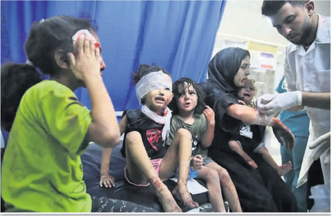
ଆକ୍ରମଣରେ ଆହତ ପାଲେଷ୍ଟିନୀୟ ଶିଶୁ ଓ ମହିଳା ଶିପା ହସ୍ପିଟାଲରେ ଚିକିତ୍ସାଧୀନ ।

ପ୍ରଭାବିତ ସିରିଆରେ ଦଶନ୍ଧି ଧରି ଇସ୍ରାଏଲ ଆନେକ ଶବ୍ଦ ଏୟାରସ୍ତ୍ରଇଜ୍ କରିଆସିଛି । ବିଶେଷକରି ଇରାନ୍ ସମର୍ଥିତ ହେବୋଲା ପାଇର୍ସ ଓ ବିରାୟ ସେନା ପ୍ରତିଷ୍ଠାନଗୁଡ଼ିକୁ ଇସ୍ରାଏଲ ଟାର୍ଗେଟ କରିଥାଏ । ଯୁଦ୍ଧ ଘନଘଟା ମଧ୍ୟରେ ଆମେରିକା ପରାସ୍ତ ସଚିବ ଆଣ୍ଡୋନି ବ୍ଲିକ୍ସେନ୍ ଗୁଜୁବାର ଇସ୍ରାଏଲ ଗସ୍ତ କରି ପ୍ରଧାନମନ୍ତ୍ରୀ ବେଞ୍ଜାମିନ୍ ନେତାନ୍ୟାହୁକୁ ଭେଟିଛନ୍ତି । ଇସ୍ରାଏଲ ପ୍ରତି ସମର୍ଥନ ପାଇଁ ନେତାନ୍ୟାହୁ ଆମେରିକାକୁ ଅନୁରୋଧ କରୁଛନ୍ତି । ଦୁଇଦିନିଆ ଏକ ମିଳିତ ଖବରଦାତା ସମ୍ମିଳନୀରେ ବ୍ଲିକ୍ସେନ୍ କହିଛନ୍ତି, ଆମେରିକା ପାଇଁ ଇସ୍ରାଏଲର ପର୍ଯ୍ୟାପ୍ତ ଶକ୍ତି