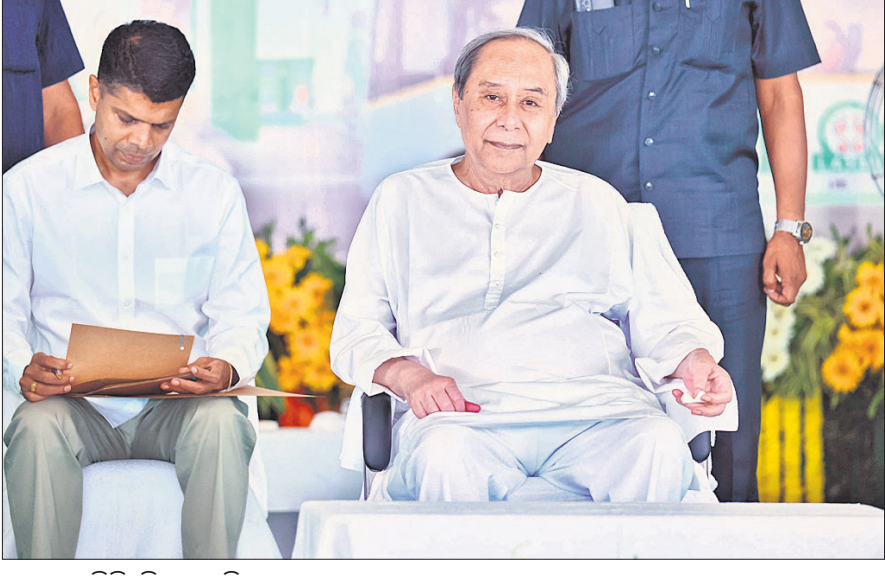
ମାଲକାନଗିରି ଜିଲ୍ଲା ସ୍ୱାସ୍ଥ୍ୟମନ୍ତ୍ରୀଙ୍କୁ ଶ୍ରଦ୍ଧାଞ୍ଜଳି ପାଇଁ ସମ୍ମାନିତ କରାଯାଇଛି।

ଘର ପହଞ୍ଚିବା ପରେ ଡ୍ରାଉ ଯୁକ୍ତରେ ଡିଆର ମୁତବେହ ଛୁଇଁଥିବା ବେଶ୍ଟିକୁ ପାଇଥିଲେ।