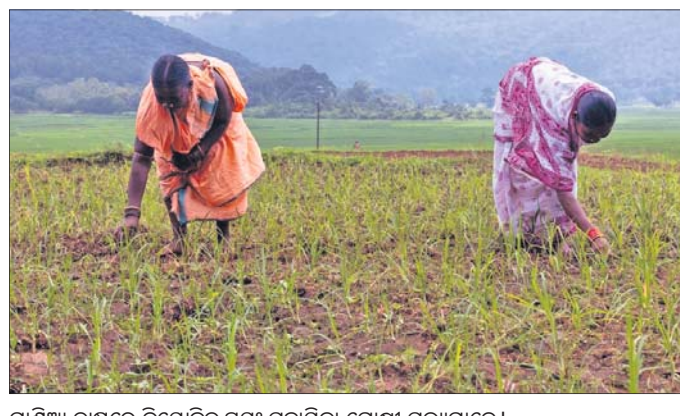
ମାଣିଆ ଚାଷରେ ନିଯୋଜିତ ସ୍ୱୟଂ ସହାୟକା ଗୋଷ୍ଠୀ ସଦସ୍ୟାମାନେ।

ମହିଳା ସଶକ୍ତୀକରଣ ଦିଗରେ ଗୋଷ୍ଠୀ ସହକାରିତାକୁ ପ୍ରାଥମିକତା ଦେଇ ଚିପିଏସ୍‌ଓଡିଏଲ୍ ପକ୍ଷରୁ କାମିକା ପ୍ରୋଫାଇନ୍ କାର୍ଯ୍ୟକ୍ରମର ଯତ୍ନକୁ ନିଆଯାଇଛି। ମିଶନ ଶକ୍ତି ଓ ଓଡ଼ିଶା ଜାତିକା ମିଶନର ସହକାରିତାରେ ଚିପିଏସ୍‌ଓଡିଏଲ୍ ପକ୍ଷରୁ ଓଡ଼ିଶାର ମହିଳା ସ୍ୱୟଂ ସହାୟକ ଗୋଷ୍ଠୀ (ଏସ୍‌ଏସ୍‌ଜି) ତଥା ଚାଷୀଙ୍କୁ ତାଲିମ ଦିଆଯାଉଛି। କମ୍ପାନୀ ମାଣିଆ ଚାଷକୁ ପ୍ରାଥମିକତା ଦେଉଛି। ଅନ୍ୟପକ୍ଷରେ ବର୍ତ୍ତମାନ ସୁଦ୍ଧା ଚିପିଏସ୍‌ଓଡିଏଲ୍ ପକ୍ଷରୁ ପ୍ରାୟ ୫୦୦ ଜଣ ଏସ୍‌ଏସ୍‌ଜି ସଦସ୍ୟା ଓ ଚାଷୀଙ୍କୁ ଉନ୍ନତମାନର ସିନିଟ୍ ସହ ଅନ୍ୟାନ୍ୟ ଆନୁସଙ୍ଗିକ ସହାୟତା ଯୋଗାଇଛି। ଖିରିଟ୍ ରକ୍ଷଣ ଚିପିଏସ୍‌ଓଡିଏଲ୍ ଦକ୍ଷିଣ ଓଡ଼ିଶାର ୮ଟି ଜିଲ୍ଲାରେ ୫୦୦ ଏକରରୁ ଅଧିକ ଜମିରେ ମାଣିଆ ଚାଷକୁ ସହାୟତା ଯୋଗାଇଛି। ଏଥିସହ ଆକର୍ଷକ ମିଲେଟ୍ ବର୍ଷ ୨୦୨୩ ଅବସରରେ ଆସନ୍ତା ରବି ଋତୁରେ ମଧ୍ୟ କମ୍ପାନୀ ପକ୍ଷରୁ ୧୦୦୦ ଏକର ଜମିରେ ଚାଷ ପାଇଁ ସହାୟତା ଦିଆଯିବା ନେଇ ନିଷ୍ପତ୍ତି ନିଆଯାଇଛି।