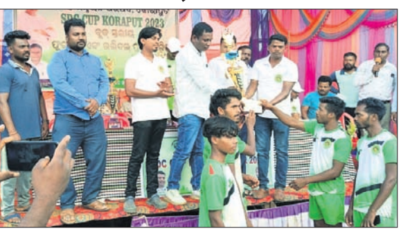
ଅତିଥିମାନେ ବିଜୟୀ ଦଳକୁ ପୁରସ୍କୃତ କରୁଛନ୍ତି ।