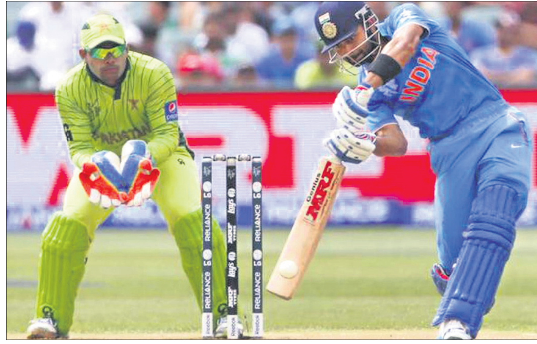
ପାକିସ୍ତାନ ବିପକ୍ଷ ଶତକାୟ ଜନିତ୍ ଅବସରରେ ଶର୍ଦ୍ଧା ଖେଳୁଥିବା ବିରାଟ କୋହଲି।