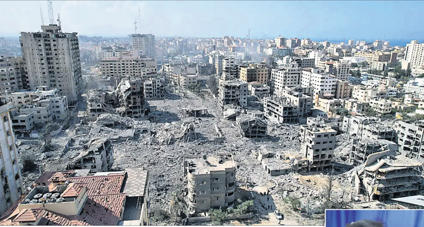
ଇସ୍ରାଏଲ ଆକ୍ରମଣରେ ବିଧୂସ୍ତ ଗାଜା ଅଲ-ରିମାଲ ।

କେରୁକେଲମ/ଗାଜା ବିଟି/ ଡାମାସ୍କସ୍, ୧୨୧୦ ଇସ୍ରାଏଲ ଓ ପାଲେଷ୍ଟିନୀୟ ଆତଙ୍କବାଦୀ ସମ୍ମୁଖରେ ହମାସ୍ ମଧ୍ୟରେ ୬ ଦିନ ଧରି ଚାଲିଥିବା ଯୁଦ୍ଧର ନିଆଁ ଏବେ ମଧ୍ୟପ୍ରାଚ୍ୟର ଅନ୍ୟ ରାଷ୍ଟ୍ରକୁ ବ୍ୟାପିବା ଆରମ୍ଭ ହେଲାଣି । ଇସ୍ରାଏଲ ପକ୍ଷରୁ ଗୁଜୁବାର ସିରିଆ ରାଜଧାନୀ ଡାମାସ୍କସ୍ ଏବଂ ଆଲେପୋ ସହରରେ ଥିବା ୨ ବିମାନବନ୍ଦରୁ ଗାଜାରେ କରାଯାଇଛି । ଇସ୍ରାଏଲର ମିଶ୍ଟାଲ ମାଡ଼ରେ ୨ ଏୟାରଫୋର୍ସର ଲ୍ୟାଣ୍ଡିଂ ଏରିଆ କ୍ଷତିଗ୍ରସ୍ତ ହୋଇଛି । ଏଥିପାଇଁ ଏୟାରଫୋର୍ସ ଦ୍ୱୟରେ ବିମାନ ଚଳାଚଳ ସେବା ବନ୍ଦ