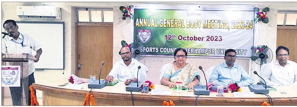
ବୈଠକରେ ମହାସଭାନ ବିଶ୍ୱବିଦ୍ୟାଳୟ କର୍ତ୍ତୃପକ୍ଷ। ବ୍ରହ୍ମପୁର, ୧୨।୧୦ (ତନ୍ତୁଗ୍ରୀ ନାହାକ)

ବ୍ରହ୍ମପୁର ବିଶ୍ୱବିଦ୍ୟାଳୟ ■ କ୍ରୀଡ଼ା ପରିଷଦର ବାର୍ଷିକ ସାଧାରଣ ବୈଠକ ■ ୨୦୨୩-୨୪ ପାଇଁ ୫୧ ଲକ୍ଷ ଟଙ୍କାର ବଜେଟ୍