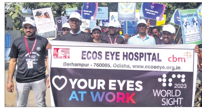
ହସିତାଳ କର୍ମଚାରୀମାନେ ଶୋଭାଯାତ୍ରାରେ ଯାଉଛନ୍ତି। ବ୍ରହ୍ମପୁର, ୧୨।୧୦