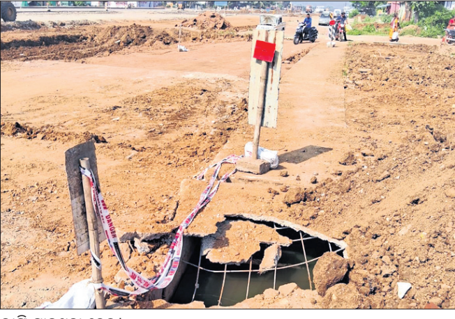
ଭାଙ୍ଗି ଯାଇଥିବା ଡ୍ରେନ୍।

ଅନୁଗୋଳ ଜିଲ୍ଲା କିଶୋରନଗର ବ୍ଲକ୍ ବଲଖା ଅଞ୍ଚଳରେ ନିର୍ମାଣ କରାଯାଇଥିବା ଡ୍ରେନ୍ କାର୍ଯ୍ୟ ନିମ୍ନମାନର ହେଉଥିବା ଅଭିଯୋଗ ହୋଇଛି। ଆବଶ୍ୟକ ପରିମାଣର ନୁହେଁ ହୋଇଥିବା ନ ଥିବା ଯୋଗୁଁ କେତେକ ସ୍ଥାନରେ ଡ୍ରେନ୍ ଭାଙ୍ଗିବା ଆରମ୍ଭ କଲାଣି। ଏହାକୁ ନେଇ ଅଞ୍ଚଳବାସୀଙ୍କ ମଧ୍ୟରେ ଅସନ୍ତୋଷ ଦେଖାଦେଇଛି। ବଲଖା ବିଧାନ ସଭା କାର୍ଯ୍ୟାଳୟ ନିକଟରେ ନିର୍ମାଣ ହୋଇଥିବା ଡ୍ରେନ୍ ର ଉଚ୍ଚତା ଅତିକମ୍ପନୀୟ। ଏକ ଟାକିଆ ଯାନ ଯାଇଥିବା ବେଳେ ଡ୍ରେନ୍‌ର ଉଚ୍ଚତା ଭାଙ୍ଗିପଡିଥିଲା। ନିର୍ମାଣକୁ ୨ ମାସ ନ ପୂର୍ବରୁ ଡ୍ରେନ୍ ଭାଙ୍ଗିଯିବା ନିମ୍ନମାନର କାମକୁ ଦର୍ଶାଉଛି ବୋଲି କର୍ମଚାରୀଙ୍କୁ ଗ୍ରାମବାସୀ ଗୁରୁତାର ଜିଲ୍ଲାପାଳଙ୍କୁ ଏକ ଅଭିଯୋଗପତ୍ର ମାଧ୍ୟମରେ ଅବଗତ କରାଇଛନ୍ତି।