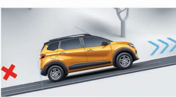
ହିଲ୍ ଷ୍ଟାର୍ଟ ଆସିଷ୍ଟ (HSA)

for a test drive, call on 1800 315 4444. select variants available in CSD. special offers for defence personnel, government, PSU and corporate employees. for bulk enquiries, contact corporsales@renault.com for further details, connect on 011-45769564/renault.co.in