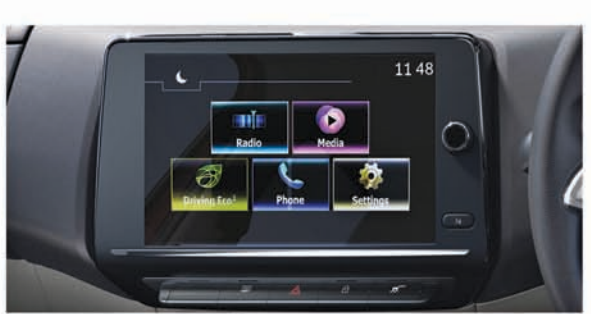
20.32 cm ଟଚ୍‌ସ୍କ୍ରିନ mediaNAV ଇଡିଓଲୁକ୍ସସନ୍