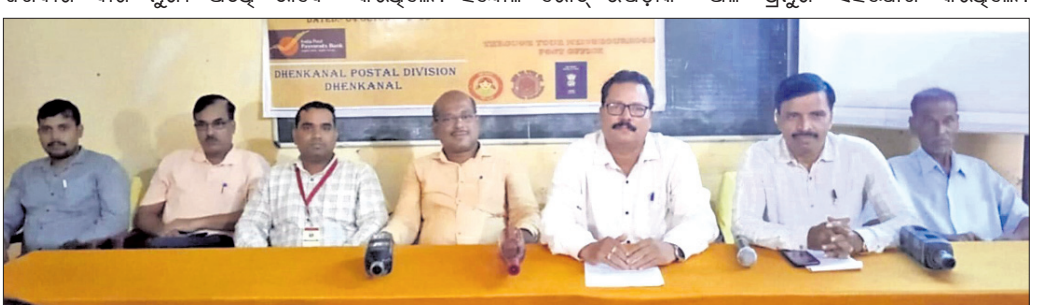
ଓପିଏସ୍ ମହାବିଦ୍ୟାଳୟରେ ଅନୁଷ୍ଠିତ ସଚେତନତା କାର୍ଯ୍ୟକ୍ରମରେ ମହାସାଗତ ଅତିଥିମାନେ।

ଯୋଗଦେଇ ଡାକ ବିଭାଗରେ ଥିବା ପର୍ଯ୍ୟାପ୍ତ ଆଧୁନିକ ସୁବିଧା ଓ ନିରାପତ୍ତା ସମ୍ପର୍କରେ ସୂଚନା ଦେବା ସହିତ ଏହାର ଆହାର କରିଥିଲେ। ସଭାପତି ଡ. ପ୍ରଧାନ ଆଧୁନିକ ମୁଦ୍‌ପତ୍ରି ସଚେତନ ରହିଲେ ଡାକ କ୍ରିଆରେ ମିଳୁଥିବା ଉନ୍ନତମାନର ବ୍ୟାଙ୍କ ଓ ଡିଜିଟାଲ ସେବାକୁ ଆପଣାତ୍ତ ଠକାମିରୁ ସମାଜକୁ ରକ୍ଷା କରିହେବ ବୋଲି କହିବା ସହିତ ‘ଡାକ ସେବା ହିଁ ବିଶ୍ଵସନୀୟ ସେବା’ ବୋଲି ମତବ୍ୟକ୍ତ କରିଥିଲେ। ହିନ୍ଦୋଳ ରୋଡ଼ ଉପଡ଼ାକ