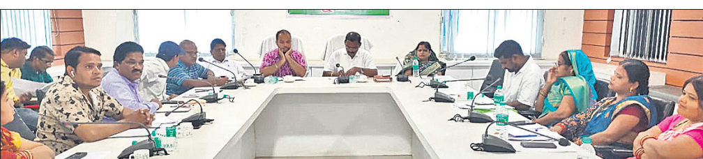
ବୈଠକରେ ଉପସ୍ଥିତ ଜନପ୍ରତିନିଧି ଓ ଅଧିକାରୀ।