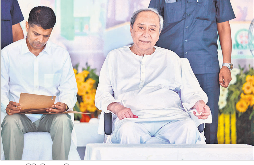
ମାଲକାନଗିରି ଜିଲ୍ଲା ସ୍ୱାସ୍ଥ୍ୟମନ୍ତ୍ରୀଙ୍କୁ ଶ୍ରଦ୍ଧାଘାଟରେ ମୁଖ୍ୟମନ୍ତ୍ରୀ ନବୀନ ପଟ୍ଟନାୟକଙ୍କ ସହ ୫-ଟି ସଭିତ ଭି.କେ.ପାଣିଆଁ ।

ଘର ପହଞ୍ଚିବା ପରେ ଡ୍ରାଉ ଯୁକ୍ତରେ ଡିଆର ମୃତଦେହ ଛୁଇଁବା ବ୍ୟବସ୍ଥାକୁ ପାଇଥିଲେ।