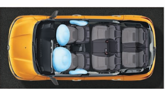
ସାମନା ଏବଂ ସାଇଡ୍ ଏୟାରବ୍ୟାଗ୍-ଡ୍ରାଇଭର ଏବଂ ପାସେଞ୍ଜର