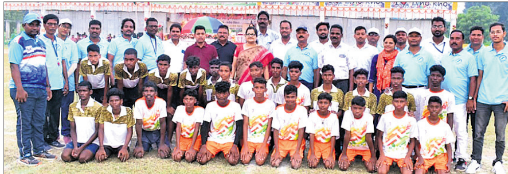
ଅତିଥି ସହ ବାଳକ ବିଭାଗର ଖେଳାଳିମାନେ।

ଅନୁଗୋଳ ପଞ୍ଚୋଳ ରେଭେନ୍ସା ଚାଳିତ ମହାବିଦ୍ୟାଳୟଠାରେ ରାଜ୍ୟସ୍ତରୀୟ ବିଦ୍ୟାଳୟ ସମୂହ ଖୋଖୋ ପ୍ରତିଯୋଗିତା ଉଦ୍ଦଘାଟିତ ହୋଇଯାଇଛି। ପ୍ରଥମ ଦିନରେ ୧୭ ବର୍ଷରୁ କମ୍ ବାଳିକା ବିଭାଗରେ ୧୮ ମ୍ୟାଟ ଖେଳାଯାଇଥିବା ବେଳେ ବାଳକ ବିଭାଗରେ ୧୯ଟି ମ୍ୟାଟ ଖେଳାଯାଇଥିଲା। ୧୭ ବର୍ଷରୁ କମ୍ ବାଳକ ବିଭାଗରେ ବାଲକ୍ଷର ଜିଲ୍ଲା କନ୍ଧମାନଙ୍କୁ ହରାଇଛି। ଖୋଖୋ ଜିଲ୍ଲା ସମଲପୁରକୁ, ଅନୁଗୋଳ ଜିଲ୍ଲା ସୋନପୁରକୁ, ଯାଜପୁର ଜିଲ୍ଲା ନୂଆପଡ଼ାକୁ, କେନ୍ଦୁଝର ଜିଲ୍ଲା ବେବରଗଡ଼କୁ, ମୟୂରଭଞ୍ଜ ଜିଲ୍ଲା ବୌଦ୍ଧକୁ, ଜଗତସିଂହପୁର ଜିଲ୍ଲା