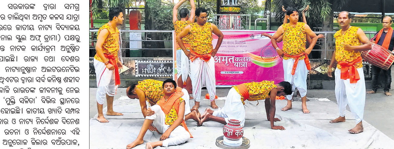
ଅମୃତ କଳସ ଯାତ୍ରା ଅବସରରେ ଅଲଗା-ଅଲଗା ରିପର୍ଟ ଥିଏଟରର କଳାକାରମାନେ ନାଟକ ପୂର୍ଣ୍ଣ ସକଳା ମଞ୍ଚସ୍ଥ କରୁଛନ୍ତି।