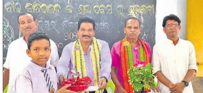
ଜଣେ କୃତୀ ଛାତ୍ରଙ୍କୁ ଅତିଥି ପୁରସ୍କାର ପ୍ରଦାନ କରୁଛନ୍ତି।