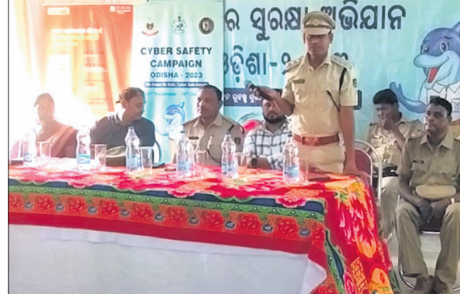
କାର୍ଯ୍ୟକ୍ରମରେ ଉପସ୍ଥିତ ଅତିଥିମାନେ।