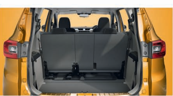
625L ପର୍ଯ୍ୟନ୍ତର ବୁକ୍ ସ୍ପେସ୍