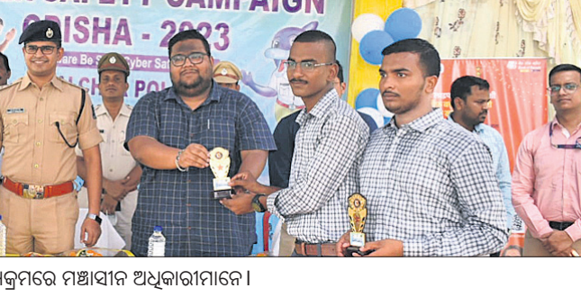
ଆଇଭର ଠକେଇ ସମ୍ପର୍କରେ ସଚେତନତା କାର୍ଯ୍ୟକ୍ରମରେ ମଞ୍ଚାସୀନ ଅଧିକାରୀମାନେ।