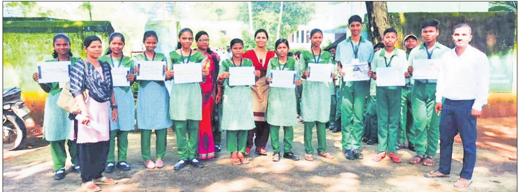
ବିଶ୍ଵ ବାଳିକା ଦିବସ ଅବସରରେ ଶୋଭାଯାତ୍ରାରେ ବାହାରିଥିବା ଛାତ୍ରୀମାନେ।

ବନ୍ଧୁ, ୧୨୧୦ (ପରିଷ୍କୃତ ସାହୁ) ବର୍ତ୍ତମାନ ସମୟରେ ପୁଅଙ୍କ ବୁକ୍ସିରେ ଡିଆଁ ସଂଖ୍ୟା କମ୍ ରହିଛି। ଲୋକମାନେ କନ୍ୟା ଜନ୍ମ ହେବ ବୋଲି ଆଶଙ୍କା କରି ଭୁଣ ନଷ୍ଟ କରୁଛନ୍ତି। ଆଗାମୀ ଦିନରେ ଏହା ଏକ ବଡ଼ ସମସ୍ୟା ହୋଇ ଠିଆ ହେବ। ତେଣୁ ସମସ୍ତେ ସଚେତନ ହୋଇ କନ୍ୟାମାନଙ୍କୁ ଗୁରୁତ୍ଵ ଦେବା ସହ ସୁରକ୍ଷା