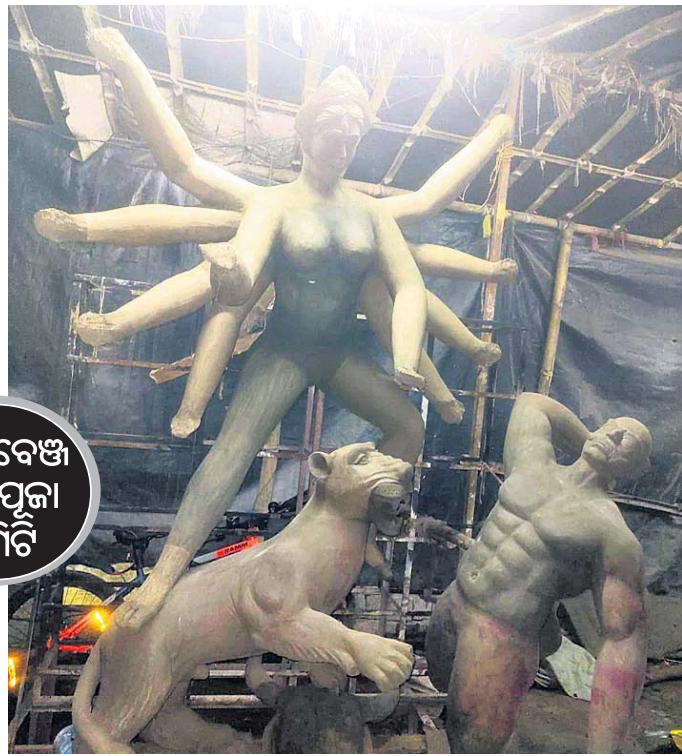
ଗଡ଼ଜାତୀୟ ପୂଜା କର୍ମିତ

ଗଡ଼ଜାତୀୟ ପୂଜା ଚଳିତବର୍ଷ ୪୩ ବର୍ଷରେ ପହଞ୍ଚିଛି। ମା'ଙ୍କ ଧରାବତରଣ ପାଇଁ କର୍ମିତ ପକ୍ଷରୁ ପୂଜା ପୋଷାଳ କାର୍ଯ୍ୟ ଲାଗି ରହିଛି। ୧୯୮୦ରେ ଏଠାରେ ପୂଜା ଆରମ୍ଭ ହୋଇଥିଲା। ମହେଶ୍ୱର ଦାସ ଓ ଅନ୍ୟାନ୍ୟ ସଦସ୍ୟମାନେ ପୂଜା ଆରମ୍ଭ କରିଥିଲେ। କର୍ମିତ ପକ୍ଷରୁ ପ୍ରଥମକରି ମୂର୍ତ୍ତି ପୂଜା ହୋଇଥିଲା। ଚଳିତବର୍ଷ ସ୍ଥାନୀୟ କାରିଗରଙ୍କ ଦ୍ୱାରା ମୂର୍ତ୍ତିନିର୍ମାଣ କରାଯାଇଛି।