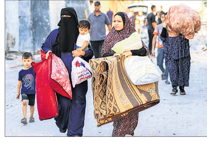
ଇସ୍ରାଏଲର ଚେତାବନୀ ପରେ ଗାଜାର ରାଫହରୁ ପଳାଉଥିବା ଧରି ପଳାୟନ କରୁଛନ୍ତି ପାଲେଷ୍ଟିନୀୟ ମହିଳା।

ଗାଜାର ଶାସକ ହମାସ୍ ଆତଙ୍କବାଦୀ ଗୋଷ୍ଠୀ ବିରୋଧରେ ଇସ୍ରାଏଲ ସ୍ଥଳସେନା ପକ୍ଷରୁ ବଡ଼ ଧରଣର ଆକ୍ରମଣ ହେବାକୁ ଯାଉଛି। ଏଥିପାଇଁ ୧୦ ଲକ୍ଷ ପାଲେଷ୍ଟିନୀୟ ୨୪ ଘଣ୍ଟା ମଧ୍ୟରେ ଉତ୍ତର ଗାଜା ଛାଡ଼ି ଦକ୍ଷିଣ ପାର୍ଶ୍ୱକୁ ଚାଲିଯିବା ପାଇଁ ଇସ୍ରାଏଲ ସୈନ୍ୟବାହିନୀ ପକ୍ଷରୁ ଶୁକ୍ରବାର ନିର୍ଦ୍ଦେଶ ଦିଆଯାଇଥିଲା। ଏହି ଚେତାବନୀ ପରେ ଗାଜା ଷ୍ଟ୍ରିଟ୍ ବହୁସଂଖ୍ୟାରେ ଲୋକ ଘର ଛାଡ଼ିବା ଆରମ୍ଭ କରିଛନ୍ତି। ବହୁ ସଂଖ୍ୟାରେ ଲୋକେ କାର୍ ଛାଡ଼ି ବିଛଣାପତ୍ର ଓ ଅତ୍ୟାବଶ୍ୟକ ସାମଗ୍ରୀ ଧରି ପଳାଉଥିବା ଦେଖାଯାଇଛି। ଗାଜା ସିଟି, ବେଇଟ୍ ଲାହିଆ, ବେଇଟ୍ ହାନୌନ ଏବଂ କାବାଲିଆ ଆର୍ଯ୍ଥରୁ ବାସିନ୍ଦାମାନେ ଗଣପଲାଇନ କରୁଛନ୍ତି। ଯେଉଁମାନେ ଘର ନ ଛାଡ଼ିବେ ସେମାନେ ମାରାତ୍ମକ ପରିଣାମର ସମ୍ମୁଖୀନ ହୋଇପାରନ୍ତି ବୋଲି ଇସ୍ରାଏଲ ସେନା ଚେତାବନୀ ଦେଇଥିଲା। ଗାଜା ଷ୍ଟ୍ରିଟ୍ ଉପରେ ଆକାଶ ମାର୍ଗରୁ ବୋମା ଓ ରକେଟ ମାଡ଼ କରିଚାଲିଥିବା ଇସ୍ରାଏଲ ସେନା ଏବେ ସ୍ଥଳପଥରେ ଉକ୍ତ ଅଞ୍ଚଳକୁ ଦଖଲ କରିବାକୁ ଚାହୁଁଛି। ଏଥିପାଇଁ ୩ ଲକ୍ଷ ସୈନ୍ୟ ଗାଜା ସୀମାକୁ ପଠାଯିବା ସହ ବହୁସଂଖ୍ୟାରେ