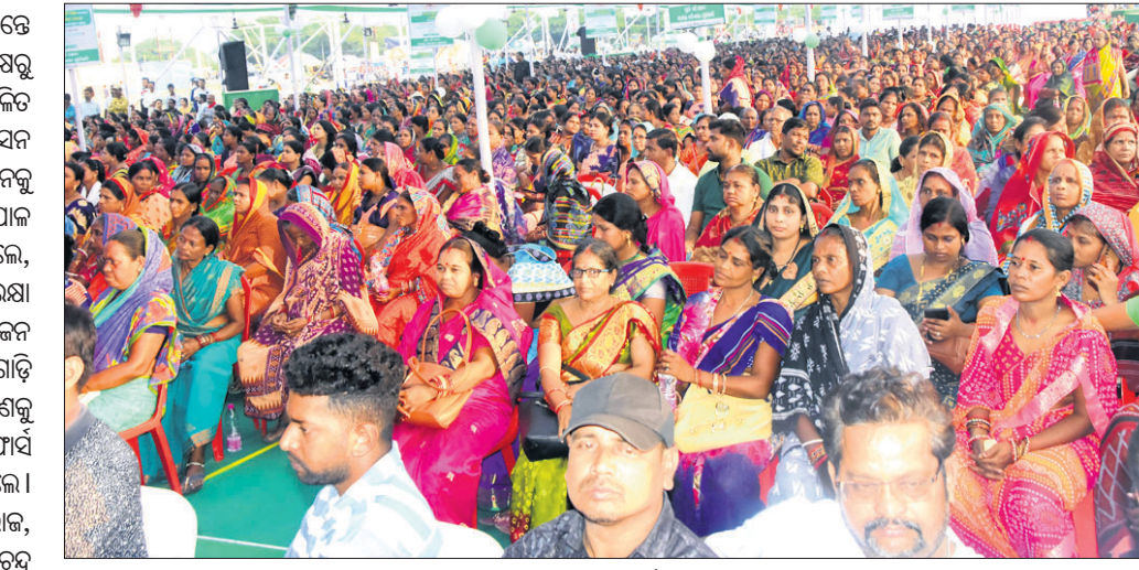
ପୁରୀ ତାଳବଣିଆ ପଢ଼ିଆରେ ଆୟୋଜିତ କାର୍ଯ୍ୟକ୍ରମରେ ଉପସ୍ଥିତ ଜନସାଧାରଣ।

ପ୍ରସାର ଓ ଉପକ୍ରମ କାର୍ଯ୍ୟକ୍ରମର ମାନ୍ୟତା ପ୍ରଦାନ ନିମନ୍ତେ ହେଉଥିବା ଉପକ୍ରମ ଦୃଷ୍ଟିରେ ରଖି ଲୋକସମ୍ପର୍କ ବିଭାଗ ପକ୍ଷରୁ