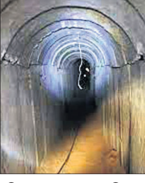
ରହିଥିବାବେଳେ ମାତ୍ର ୫ ପ୍ରତିଶତ ନଷ୍ଟ ହୋଇଥିବା ହମାସ୍ ନେତା ଯାହୟା ସିନୱର କହିଥିଲେ। ଦିଲ୍ଲୀର ଆଇଡିଏଲ ଗାଜାର ୪ ମୁଣ୍ଡ ହୋଇଥିବାବେଳେ ମୋଟ ମେଡ୍ରୋ ନେଷ୍ଟର୍ଡ୍ ୩୯୨ କିଲୋମିଟର ଫୋର୍ସ ଦାବି କରିଥିଲା। ତେବେ ସେଠାରେ ୫୦୦ କିଲୋମିଟର ଚଳେ ନେଷ୍ଟର୍ଡ୍

ଇସ୍ରାଏଲ ସ୍ଥଳସେନା ଜୋର୍ଦ୍ଦାନୀ ଆକ୍ରମଣ କରି ଗାଜା ଷ୍ଟ୍ରିଟ୍ ଦଖଲ ପାଇଁ ପ୍ରସ୍ତୁତି ଚଳାଇଛି। ତେବେ ସେଠାରେ ହମାସ୍ ଆତଙ୍କବାଦୀଙ୍କ ଗୁପ୍ତ ସୁଡ଼ଙ୍ଗ ଇସ୍ରାଏଲ ସୈନ୍ୟଙ୍କ ପାଇଁ ସବୁରୁ ବଡ଼ ଚ୍ୟାଲେଞ୍ଜ ହେବ ବୋଲି କୁହାଯାଉଛି। ସ୍ଥଳଭାଗରେ ଆକ୍ରମଣ କଲେ ଇସ୍ରାଏଲ ମହଙ୍ଗା ପଡ଼ିପାରେ ବୋଲି ବହୁ ବିଶେଷଜ୍ଞ ସତର୍କ କରାଇଛନ୍ତି। ଗାଜା ଷ୍ଟ୍ରିଟ୍ରେ ଅନେକ ଦୀର୍ଘ ଗୁପ୍ତ ସୁଡ଼ଙ୍ଗ ନେଷ୍ଟର୍ଡ୍ ରହିଛି। ଉକ୍ତ ଚଳେ ନେଷ୍ଟର୍ଡ୍ ଉପରେ ଆକ୍ରମଣ କରାଯିବ ବୋଲି ଇସ୍ରାଏଲ ପ୍ରତିରକ୍ଷା ବାହିନୀ ମୁଖପାତ୍ର କହିଛନ୍ତି। ତେବେ ଏହା ସହଜ ନୁହେଁ। ୨୦୨୧ରେ ହମାସ୍‌ର ୧୦୦ କିଲୋମିଟରରୁ ଅଧିକ ଚଳେ ନେଷ୍ଟର୍ଡ୍‌କୁ ନେଷ୍ଟର୍ଡ୍‌କୁ ଧ୍ୱଂସ କରାଯାଇଥିବା ଇସ୍ରାଏଲ ଡିଫେନ୍ସ ଫୋର୍ସ ଦାବି କରିଥିଲା। ତେବେ ସେଠାରେ ୫୦୦ କିଲୋମିଟର ଚଳେ ନେଷ୍ଟର୍ଡ୍ ରହିଥିବାବେଳେ ମାତ୍ର ୫ ପ୍ରତିଶତ ନଷ୍ଟ ହୋଇଥିବା ହମାସ୍ ନେତା ଯାହୟା ସିନୱର କହିଥିଲେ। ଦିଲ୍ଲୀର ଆଇଡିଏଲ ଗାଜାର ୪ ମୁଣ୍ଡ ହୋଇଥିବାବେଳେ ମୋଟ ମେଡ୍ରୋ ନେଷ୍ଟର୍ଡ୍ ୩୯୨ କିଲୋମିଟର ଫୋର୍ସ ଦାବି କରିଥିଲା। ତେବେ ସେଠାରେ ୫୦୦ କିଲୋମିଟର ଚଳେ ନେଷ୍ଟର୍ଡ୍