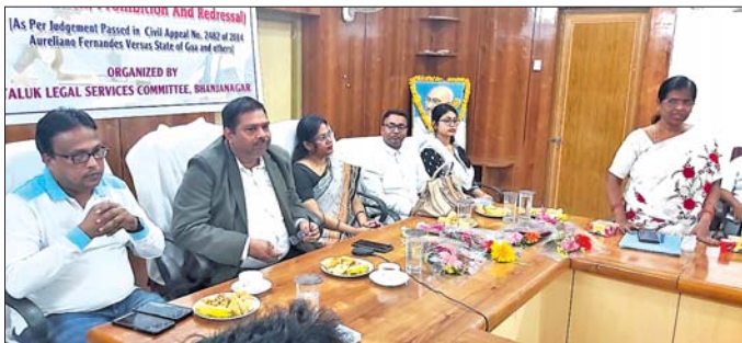
ବୈଠକରେ ଉପସ୍ଥିତ ଅତିଥି।

ପକ୍ଷ ରଖିବାକୁ ସୁଯୋଗ ଦେଇଥିଲେ। ଫଳରେ ପକ୍ଷବର୍ତ୍ତୀ ପର୍ଯ୍ୟାୟରେ ପ୍ରତ୍ୟେକର କର୍ମଚାରୀଙ୍କୁ ଠିକ୍ ଭାବେ କାର୍ଯ୍ୟକାରୀ ପଦାଧିକାରୀ ଭାବେ ନିଯୁକ୍ତ କରିବା ପାଇଁ ନିର୍ଦ୍ଦେଶ ଦିଆଯାଇଥିଲା। ଯାହାଦ୍ୱାରା ପରବର୍ତ୍ତୀ ପର୍ଯ୍ୟାୟରେ ବିଭିନ୍ନ ପଦାଧିକାରୀଙ୍କୁ ନିଯୁକ୍ତ କରିବା ପାଇଁ ନିର୍ଦ୍ଦେଶ ଦିଆଯାଇଥିଲା।