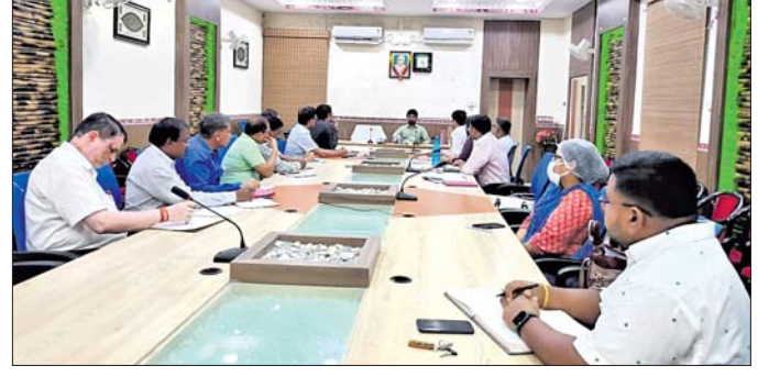
ବୈଠକରେ ଜିଲ୍ଲାପାଳଙ୍କ ସହ ଅନ୍ୟମାନେ।