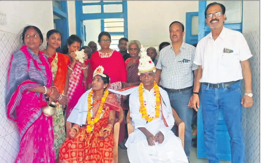
ବରକନ୍ୟାଙ୍କୁ ଆଶୀର୍ବାଦ କରୁଛନ୍ତି ଜିଲ୍ଲା ମୁଖ୍ୟ ଚିକିତ୍ସାଧିକାରୀ ଓ ଅତିରିକ୍ତ ମୁଖ୍ୟ ଚିକିତ୍ସାଧିକାରୀ।

ପତ୍ନୀବତୀଙ୍କ ଘର ଓପଦା ବ୍ଲକ୍ କୁଟାଗଡ଼ିଆ ଅଞ୍ଚଳରେ। ସେ ପୂର୍ବରୁ ବିବାହିତା ଥିଲେ। ୧୦ବର୍ଷ ପୂର୍ବେ ପତ୍ନୀବତୀ କୁଷ୍ମାଗ୍ରମରେ ଆକ୍ରାନ୍ତ ହୋଇଥିଲେ। ପରିବାର ଲୋକେ ତାଙ୍କୁ ପୁଣି କରିବାରୁ ସେ ଘର ଛାଡ଼ି ଆସି ବାମପଦାରେ ଥିବା କୁଷ୍ମାଗ୍ରମରେ ରହି ରିକ୍ସିତ ହେଉଥିଲେ। ଏବେ ସେ କୁଷ୍ମାଗ୍ରମରୁ ମୁକ୍ତ ହୋଇଛନ୍ତି, ହେଲେ ଘରକୁ ଫେରିନାହାନ୍ତି। ସେହିଭଳି ବାଲେଶ୍ୱର ସଦର ବ୍ଲକ୍ ସାଥୀ ଗ୍ରାମରେ ଦାସ ମାରାଣ୍ଡିଙ୍କ ଘର। ସେ ମଧ୍ୟ କୁଷ୍ମାଗ୍ରମରେ ଆକ୍ରାନ୍ତ