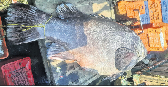
ଧରାଯାଇଥିବା ସାମୁଦ୍ରିକ କଉ ମାଛ।