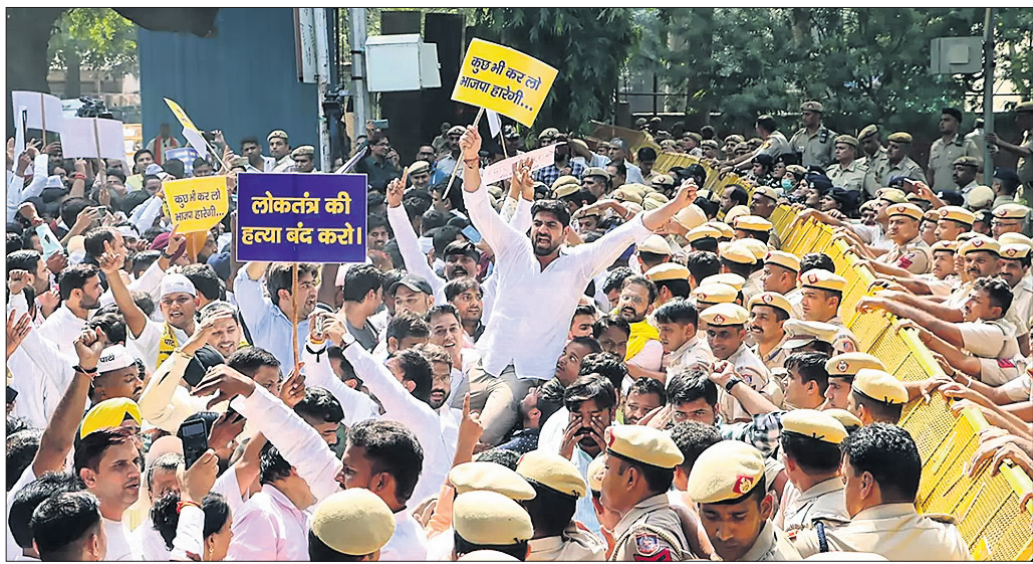
ଏଏପି ନେତା ସଞ୍ଜୟ ସିଂହଙ୍କ ଗିରଫକୁ ବିରୋଧ କରି ଦଳୀୟ କର୍ମୀମାନେ ନୂଆଦିଲ୍ଲୀରେ ବିରୋଧ ପ୍ରଦର୍ଶନ କରୁଛନ୍ତି।