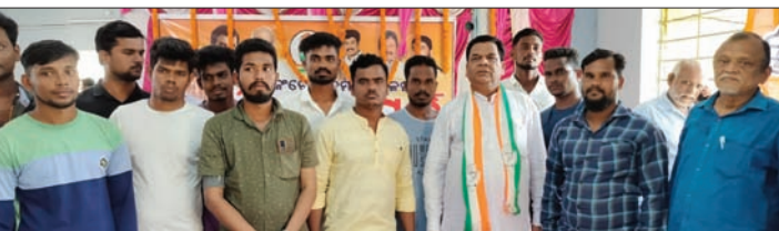
କଂଗ୍ରେସର ମିଶ୍ରଣ ପର୍ବରେ ସାମିଲ ହୋଇଥିବା କର୍ମୀ।

କବି ବୋଲି ପାଣିଗ୍ରାହୀ କହିଛନ୍ତି। ବିଜେଡ଼ି, ଭାଜପା ଦଳ କର୍ମୀମାନେ ଦଳ ଛାଡି କଂଗ୍ରେସ ଦଳରେ ସାମିଲ ହୋଇଥିଲେ।