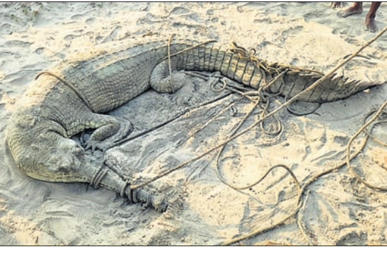
ଉଦ୍ଧାର ହୋଇଥିବା କୁମ୍ଭୀର।

ଭୋଗରାଇ, ୧୩।୧୦ (ପ୍ରଦୀପ ଦାସ) ବାଲେଶ୍ୱର ଜିଲ୍ଲା ଭୋଗରାଇ ବ୍ଲକ୍ ତାଳସାରୀ ବେଳାଭୂମିରୁ ୧୩ ପୁଷ୍ଟ ଲମ୍ବର ଏକ କୁମ୍ଭୀରକୁ ଉଦୟପୁର ବନ ବିଭାଗ ଶୁକ୍ରବାର ସକାଳେ କାବୁ କରିଛି। କୁମ୍ଭୀର ଜବତ କରିଥିଲେ। ମୃତଦେହକୁ ସ୍ୱାବଚ୍ଛେଦ ଲାଗି ଜଳେଶ୍ୱର ପ୍ରାଣୀଧନ ଚିକିତ୍ସାଳୟକୁ ପଠାଯାଇଛି। ଏନେଇ ମେରାଜନ ଆନାରେ ଏକ ଅପମୃତ୍ୟୁ ମାମଲା(ନଂ. ୫/୨୩) ରୁଜୁ କରାଯାଇ ପ୍ରାଥମିକ ତଦନ୍ତ ଆରମ୍ଭ ହୋଇଛି।