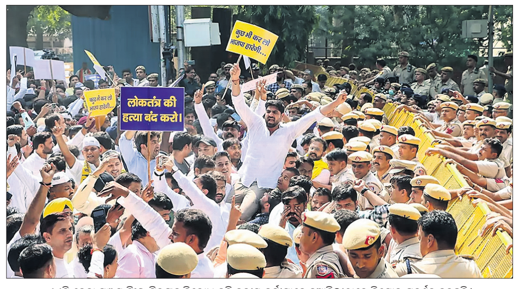
ଏଏପି ନେତା ସଞ୍ଜୟ ସିଂହଙ୍କ ଗିରଫକୁ ବିରୋଧ କରି ଦଳୀୟ କର୍ମୀମାନେ ନୂଆଦିଲ୍ଲୀରେ ବିରୋଧ ପ୍ରଦର୍ଶନ କରୁଛନ୍ତି।