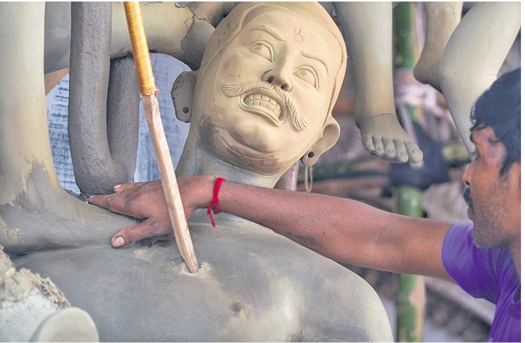
ଅନୁଗୋଳ ସହରରେ ଜଣେ କାରିଗର ମା' ଦୁର୍ଗାଙ୍କ ମୂର୍ତ୍ତି ନିର୍ମାଣରେ ବ୍ୟସ୍ତ।