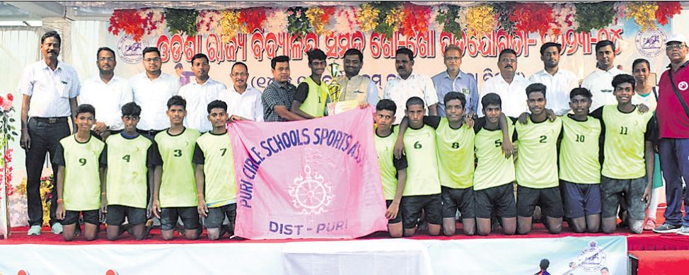
ଅତିଥିଙ୍କ ସହ ଚାମ୍ପିୟନ ଦଳର ଖେଳାଳିମାନେ ।