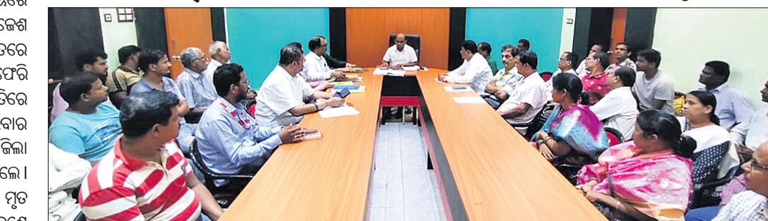
ବୈଠକରେ ଅନୁଗୋଳ ଉପକିଳାପାଳଙ୍କ ସମେତ ଅନ୍ୟ ଅଧିକାରୀ ଓ ଗ୍ରାମବାସୀ ।