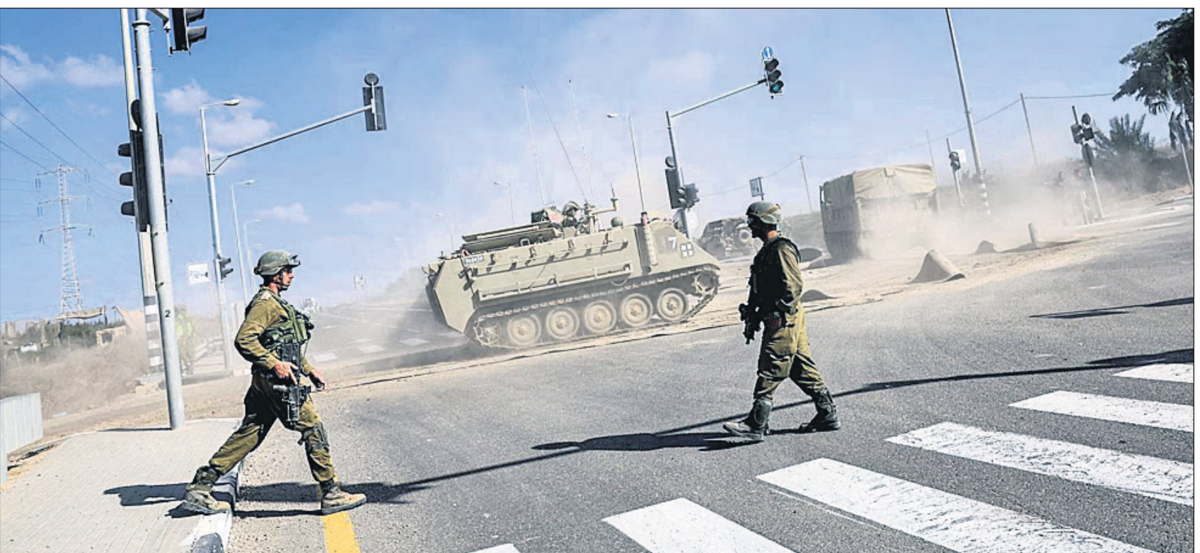
ଗାଜା ଶ୍ଟ୍ରିଟ୍ ସୀମାରେ ଆର୍ମେନିଆ ପର୍ଯ୍ୟନ୍ତେଲ କେରିୟର (ଏପିସି) ସହ ଇସ୍ରାଏଲୀ ସୈନ୍ୟ।

ମଣିପୁର ଛାତ୍ରାଛାତ୍ର ହତ୍ୟା: ୫୮ ଅଭିଯୁକ୍ତଙ୍କୁ ଗିରଫକଲା ସିବିଆଇ