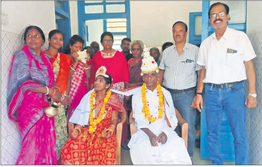
ବରକନ୍ୟାଙ୍କୁ ଆଶୀର୍ବାଦ କରୁଛନ୍ତି ଜିଲ୍ଲା ମୁଖ୍ୟ ଚିକିତ୍ସାଧିକାରୀ ଓ ଅତିରିକ୍ତ ମୁଖ୍ୟ ଚିକିତ୍ସାଧିକାରୀ ।

ପତ୍ନୀବତୀଙ୍କ ଘର ଓପଦା ବୁକ୍ କୁଟାଗଡ଼ିଆ ଅଞ୍ଚଳରେ । ସେ ପୂର୍ବରୁ ବିବାହିତା ଥିଲେ । ୧୦ବର୍ଷ ପୂର୍ବେ ପତ୍ନୀବତୀ କୃଷ୍ଣାରୋଗର ଆକ୍ରାନ୍ତ ହୋଇଥିଲେ । ପରିବାର ଲୋକେ ତାଙ୍କୁ ଚିକିତ୍ସା କରିବାକୁ ସେ ଘର ଛାଡ଼ି ଆସି ବାପପଦାରେ