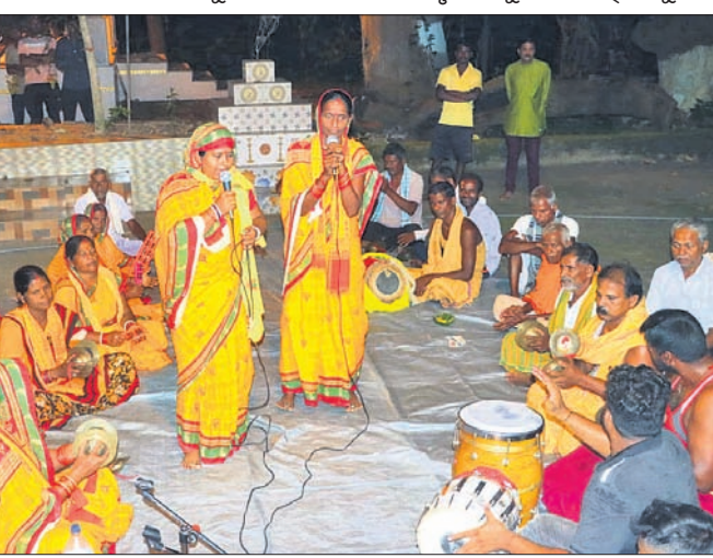
ସଂକୀର୍ତ୍ତନ ମଣ୍ଡଳୀ ନାମ ପରିବେଷଣ କରୁଛନ୍ତି।

ଦେଢ଼ାନାଳ ଜିଲ୍ଲା କାମାକ୍ଷାନଗର ବ୍ଲକ ବାଉଁଶପାଳ ପଞ୍ଚାୟତ ଶ୍ରେଣୀପତ୍ନୀଠାରେ