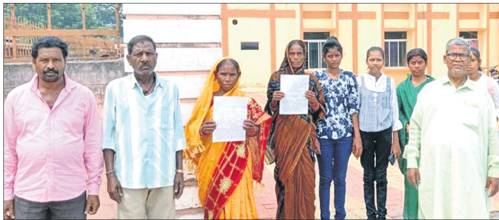
ଜିଲ୍ଲାପାଳ ଓ ଏସ୍ପିଙ୍କ ନିକଟରେ ଅଭିଯୋଗ କରିବାକୁ ଆସିଥିବା ଦଳିତ ଆଦିବାସୀମାନେ।

ନେଇ ଜିଲ୍ଲାପାଳ ଓ ଏସ୍ପିଙ୍କ ନିକଟରେ ଲିଖିତ ଅଭିଯୋଗ କରିଛନ୍ତି। ସେମାନେ ଦର୍ଶାଇଛନ୍ତି, ହରିପୁର ଗ୍ରାମ ନିକଟସ୍ଥ ଏକ କମ୍ପାନୀରୁ କାର୍ଯ୍ୟ ସାରି ଉକ୍ତ ଅଞ୍ଚଳର କେତେଜଣ ଦଳିତ ଓ ଶବର ଯୁବକ ଘରକୁ ଫେରୁଥିବା ବେଳେ ଗ୍ରାମର ବଉଳ ଛକଠାରେ କେତେଜଣ ଯୁବକ ସେମାନଙ୍କୁ ଆକ୍ରମଣ କରିଥିଲେ। ଫଳରେ ଦଳିତ ଯୁବକମାନେ ଭୟରେ ଦୌଡ଼ି ପଳାଇଥିଲେ। ଏହାପରେ ସର୍ବସ୍ତ୍ର