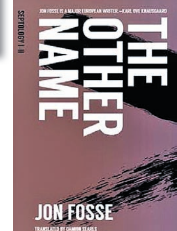
କନ୍ ଫୋସେଙ୍କ 'The Other Name' ପୁସ୍ତକର ଛବି। ଏହା ତାଙ୍କର ଏକ ଉଲ୍ଲେଖନୀୟ କାବ୍ୟକଳାକରଣ।

ଏହାର ଆଧାର ଜୀବନ ଓ ମୃତ୍ୟୁ। ତାଙ୍କର ପ୍ରଭାବଶାଳୀ ନାଟକଗୁଡ଼ିକ ମଧ୍ୟରେ 'ସମ୍ପୂର୍ଣ୍ଣ ଭାବ ଗୋଲ୍‌କ୍ ଟୁ କମ୍' ଓ 'ଦ ନେମ୍' ଅତି ପ୍ରଖ୍ୟାତ। ଫୋସେଙ୍କ ଆଧୁନିକତାବାଦୀ ଚିନ୍ତା ଓ ବ୍ୟତିକ୍ରମୀ ଗଦ୍ୟଶୈଳୀକୁ ଲକ୍ଷ୍ୟ କରି କେହି କେହି ତାଙ୍କୁ ହେନ୍‌ରିକ୍ ଇଭ୍‌ସନ୍‌ଙ୍କ ସହ ତୁଳନା କରିଥାନ୍ତି, ଯାହା ଅସତ୍ୟ। ତୁହେଁ ଫୋସେଙ୍କ ଲେଖାରେ ଥାଏ ଏକ ଧାରଣା (idea)। ଗଦ୍ୟ ଗଦ୍ୟ ଉତ୍ପାଦନରେ ଭରା ତୁହେଁ ଏସବୁ। ସମସାମୟିକତାର ସ୍ୱର ଥାଏ ଗଦ୍ୟ ଗଦ୍ୟ କିମ୍ବା ଅଣବେଶା। ସମୟ ସମୟରେ ଯଦି ତାଙ୍କ ଲେଖାରେ ଥାଏ ମୃତ୍ୟୁ ଭାବନା ଓ ଛିତିକାଦା