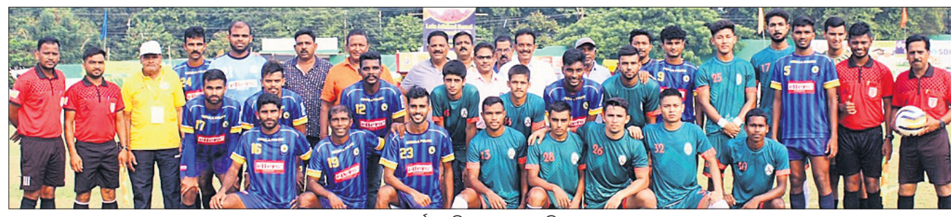
ମ୍ୟାଚ ପୂର୍ବରୁ ଅତିଥିଙ୍କ ସହ ଖେଳାଳିମାନେ।