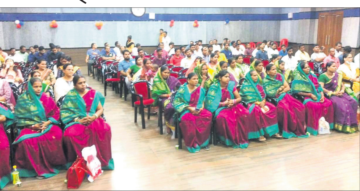
ଅଣ୍ଡା ବିକ୍ରୟ ପାଇଁ ଅବସରରେ ଦେଢ଼ାନାଳ ଜିଲ୍ଲାର ଅଗ୍ରଣୀ କୁକୁଡ଼ା ଚାଷୀ, ସ୍ୱୟଂ ସହାୟକ ଗୋଷ୍ଠୀର ମହିଳା କୁକୁଡ଼ା ଚାଷୀମାନେ ଉପସ୍ଥିତ ରହିଛନ୍ତି।