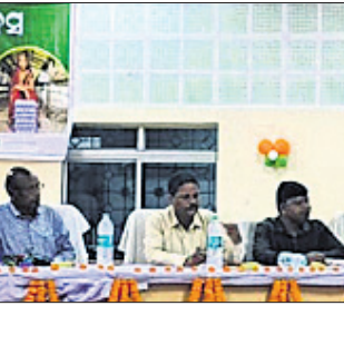
କାର୍ଯ୍ୟକ୍ରମରେ ମହାଧ୍ୟାୟ ଅଧିକାରୀମାନେ ।