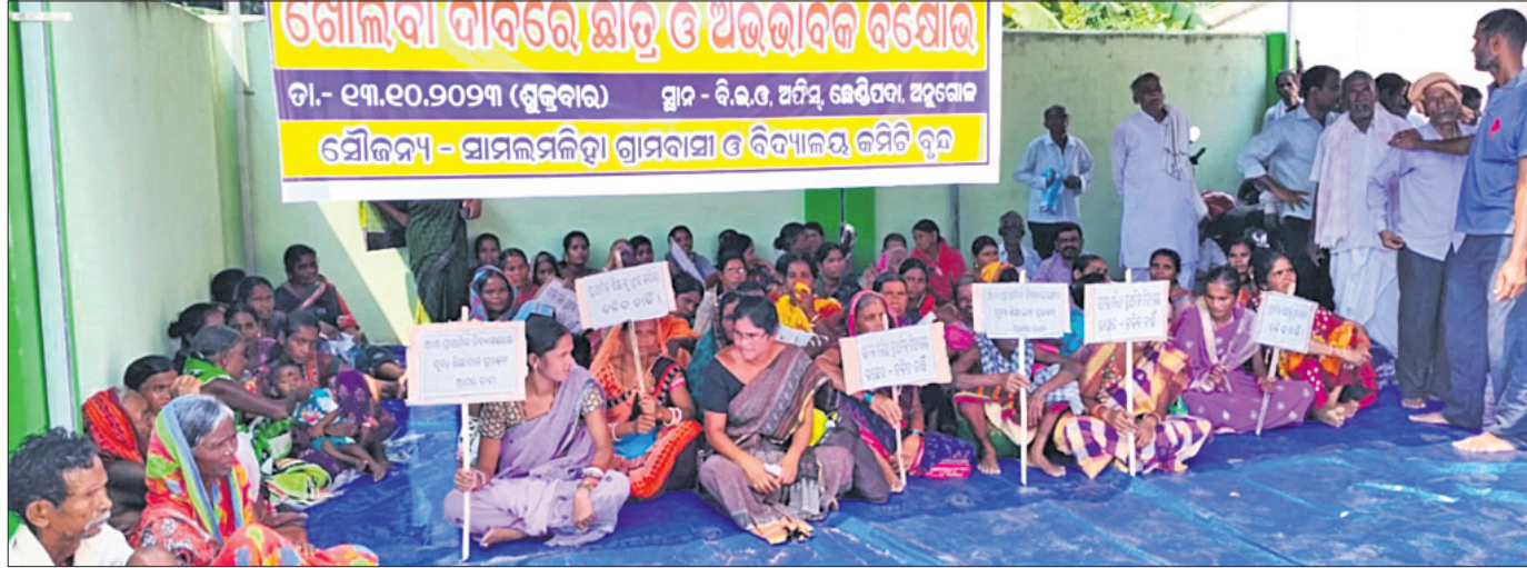
ସାମଲମଳିଆ ପ୍ରାଥମିକ ବିଦ୍ୟାଳୟକୁ ପୁନଃ ଖୋଲିବା ଦାବିରେ ଅଭିଭାବକ ଓ ଗ୍ରାମବାସୀ ଧାରଣା ଦେଇଛନ୍ତି ।

ଛେକ୍ତିପଦା, ୧୩୧୦ (ଡି.ଏନ.ଏ.) ଛେକ୍ତିପଦା ବ୍ଲକ୍ କରସାହି ପଞ୍ଚାୟତରେ ଥିବା ସାମଲମଳିଆ ପ୍ରାଥମିକ ବିଦ୍ୟାଳୟକୁ ପୁନଃ ଖୋଲିବା ଦାବିରେ ଅଭିଭାବକ ଓ ଗ୍ରାମବାସୀ ଶୁକ୍ରବାର ଗୋଷ୍ଠୀ ଶିକ୍ଷାଧିକାରୀଙ୍କ କାର୍ଯ୍ୟାଳୟ ସମ୍ମୁଖରେ ଧାରଣା ଦେଇଛନ୍ତି । ଅଭିଭାବକମାନେ କହିଛନ୍ତି, ଦୀର୍ଘ ୩ ବର୍ଷ ହେବ ଶିକ୍ଷା ବିଭାଗର ନୂତନ ନୀତି ଅନୁଯାୟୀ କମ୍