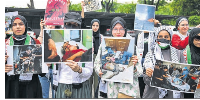
ମାଲଦିଭୀୟା କୁଆଲାଇମ୍ପୁରେ ଇସ୍ରାଏଲ ବିରୋଧୀ ବିକ୍ଷୋଭ ବେଳେ ମହିଳାମାନେ ସ୍ତୋତ୍ରାଦି ଦେଉଛନ୍ତି।

ବିକ୍ଷୋଭକାରୀମାନେ ଭରାନା, ପାଲେଷ୍ଟିନୀୟ, ଲେବାନନ୍ ହେଉଥିବା ପତାକା ଉଡ଼ାଇଥିଲେ। ସେମାନେ ଧରିଥିବା ବ୍ୟାନରଗୁଡ଼ିକରେ ଲେଖାଥିଲା, 'ତାଉନ୍ ଥ୍ରେ ଆମେରିକା' ଏବଂ 'ତାଉନ୍ ଥ୍ରେ ଇସ୍ରାଏଲ'। ଭରାନା ଅନ୍ୟ ସହରଗୁଡ଼ିକରେ ମଧ୍ୟ ବିକ୍ଷୋଭକାରୀମାନେ ଆମେରିକା ଓ ଇସ୍ରାଏଲର ଜାତୀୟ ପତାକାକୁ ପୋଡ଼ିଥିଲେ। ବାହାରିନ୍ରେ ଦିବାଳ ମସଜିଦ୍ ଆଗରେ ନମାଜ ପାଠ ପୂର୍ବରୁ ଅନେକ ହଜାର ମୁସଲମାନ ସୂର୍ଯ୍ୟ ଦେଇଥିଲେ, 'ତେଥୁ ରୁ ଇସ୍ରାଏଲ' ଏବଂ 'ତେଥୁ ରୁ ଆମେରିକା'। ସାଉଦି ରାଜଧାନୀ ରିୟାଧରେ ବିକ୍ଷୋଭକୁ ନିଷିଦ୍ଧ କରାଯାଇଥିବାବେଳେ କେତେଜଣ ଲୋକ ଏହାକୁ ଅବଞ୍ଚା କରିଛନ୍ତି। ଆଇନ ଅମାନ୍ୟକାରୀ ଜଣେ ପୂଜକଙ୍କୁ ପୋଲିସ୍ ଗିରଫ କରି ନେଉଥିବାବେଳେ ସେ କହୁଥିଲେ, 'ଦିବ ଆବାଉର୍ ପାଲେଷ୍ଟିନ'।