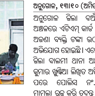
କାର୍ଯ୍ୟକ୍ରମରେ ମହାଧ୍ୟାୟ ଅଧିକାରୀମାନେ ।