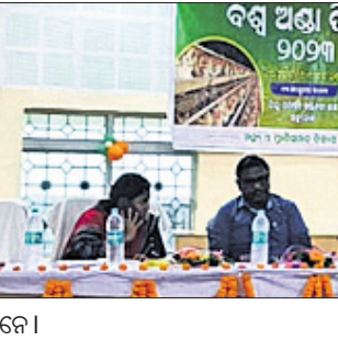
କାର୍ଯ୍ୟକ୍ରମରେ ମହାଧ୍ୟାୟ ଅଧିକାରୀମାନେ ।