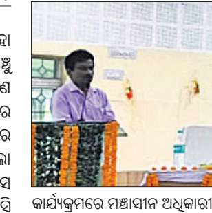
କାର୍ଯ୍ୟକ୍ରମରେ ମହାଧ୍ୟାୟ ଅଧିକାରୀମାନେ ।