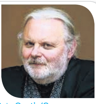
କନ୍ ଫୋସେଙ୍କ ଛବି। ସେ ୨୦୨୩ ପାଇଁ ନୋବେଲ ପୁରସ୍କାର ଜିତିଛନ୍ତି।