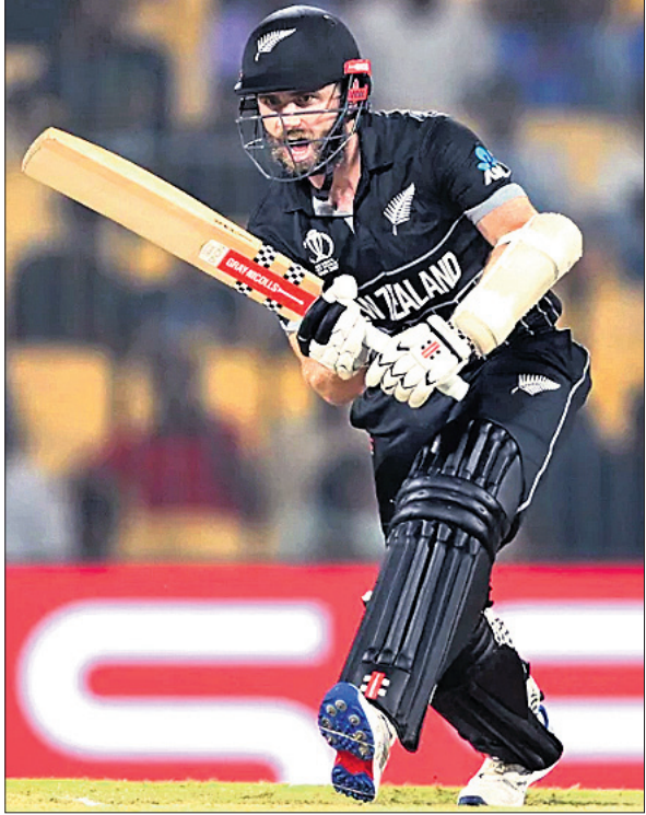
ଅର୍ଦ୍ଧଶତକୀୟ ଜିନ୍ଦିଗୀ ଅବସରରେ କେନ୍ଦ୍ର ଫିଲିପ୍ସ।

ଦିନିକିଆ କ୍ରିକେଟ ବିଶ୍ୱକପରେ ହ୍ୟାଟ୍ରିକ୍ ରିଜୟ ହାସଲ କରିଛନ୍ତି ନ୍ୟୁଜିଲାଣ୍ଡ। ଚମତ୍କାର ଫର୍ମରେ ରହିଥିବା ନ୍ୟୁଜିଲାଣ୍ଡ ବୁଟାୟ ମ୍ୟାଚ୍ ଖେଳିଥିବା ବେଳେ ସବୁଥିରେ ବିଜୟ ହାସଲ କରି ପଏଣ୍ଟ ଟେବଲର ଶୀର୍ଷ ସ୍ଥାନରେ ପହଞ୍ଚିଛି। ପ୍ରତ୍ୟାବର୍ତ୍ତନରେ କେନ୍ଦ୍ର ଫିଲିପ୍ସ ଚମତ୍କାର ୬୮ ରନ୍ କରିଥିବା ବେଳେ ତାରିଲ୍ ମିଚେଲଙ୍କ ୮୯ ରନ୍ ବଳରେ ନ୍ୟୁଜିଲାଣ୍ଡ ୮ ରଜକେଟରେ ମ୍ୟାଚ୍କୁ ଜିତି ନେଇଥିଲା। ପ୍ରଥମେ ବ୍ୟାଟିଂ କରି ବାଂଲାଦେଶ ୫୦ ଓଭରରେ ୧ ରଜକେଟ ହରାଇ ୨୪୪ ରନ୍ ଷ୍ଟୋର କରିଥିଲା। ଜବାବରେ ୪୨.୫ ଓଭରରେ ୨ ରଜକେଟ ହରାଇ ନ୍ୟୁଜିଲାଣ୍ଡ ୨୪୮ ରନ୍ କରିଥିଲା। ଚତୁର୍ଥ ସ୍ଥାନରେ ବ୍ୟାଟିଂ କରିଥିଲା ବାଂଲାଦେଶ। ଦଳର ଚତୁର୍ଥ ଅର୍ଡର ସମ୍ପୂର୍ଣ୍ଣ ବିଫଳ ହୋଇଥିବା ବେଳେ ଦଳ ୫୬ ରନ୍ରେ ୪ ରଜକେଟ ହରାଇଥିଲା। ଜିତନ ଦାସ(୦), ଗାଞ୍ଜି ହସନ(୧୬), ନେହିଦା ହସନ ମିରାଜ(୩୦) ଓ ନଜମାଲ ହୋସେନ୍ ଶତୋ(୭) ରନ୍ କରି ପ୍ୟାକିଙ୍ଗ୍ ଫେରିଥିଲେ। ଅଧିନାୟକ ସାକିବ୍ ଅଲ୍ ହସନ ୪୦ ଓ ସୁସମ୍ପର୍କ ରହି ୬୬ ରନ୍ କରି ଦଳକୁ ସକଟରୁ ଉଦ୍ଧାର କରିଥିଲେ।