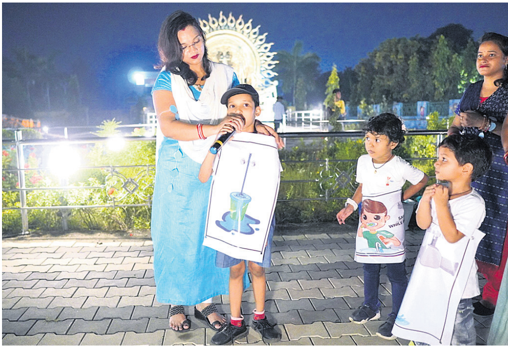
ଅନୁଗୋଳସ୍ଥିତ ଯୁବେ କିନ୍ଦୁ ସ୍କୁଲ ପକ୍ଷରୁ ଆୟୋଜିତ ପାଣି ବଞ୍ଚାଅ, ଭବିଷ୍ୟତ ବଞ୍ଚାଅ କାର୍ଯ୍ୟକ୍ରମରେ ଭାଗ ନେଉଥିବା କୁନି ପିଲାମାନେ ।