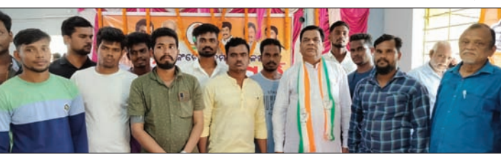
କଂଗ୍ରେସର ମିଶ୍ରଣ ପର୍ବରେ ସାମିଲ ହୋଇଥିବା କର୍ମୀ।

କବି ବୋଲି ପାଣିଗ୍ରାହୀ କହିଛନ୍ତି। ବିଜେଡ଼ି, ଭାଜପା ଦଳ କର୍ମୀମାନେ ଦଳ ଛାଡି କଂଗ୍ରେସ ଦଳରେ ସାମିଲ ହୋଇଥିଲେ।