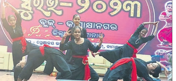
କାର୍ଯ୍ୟକ୍ରମରେ କୁନି କଳାକାରମାନେ ନୃତ୍ୟ ପରିବେଷଣ କରୁଛନ୍ତି ।