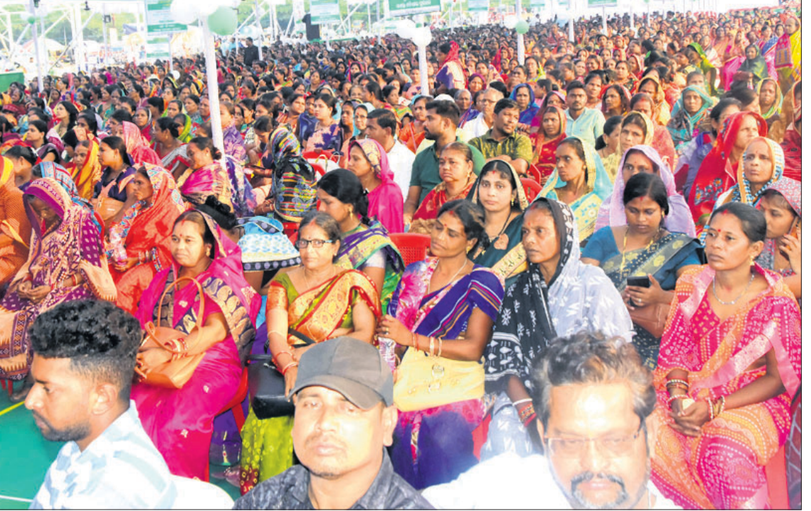
ପୂର୍ବା ତାଳକବିଆ ପଡ଼ିଆରେ ଆୟୋଜିତ କାର୍ଯ୍ୟକ୍ରମରେ ଉପସ୍ଥିତ ଜନସାଧାରଣ ।