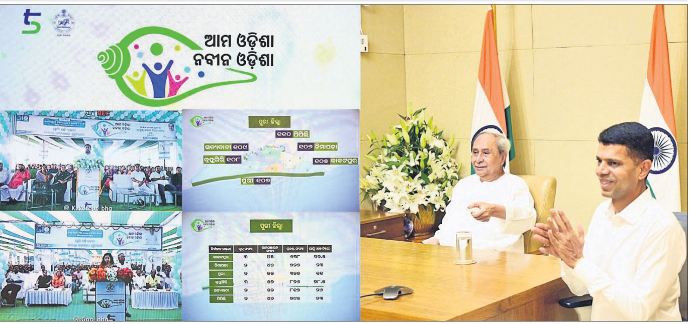
ଭୁବନେଶ୍ୱର, ୧୩/୧୦ (ଅନିଲ ଦାସ)