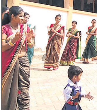
କର୍ମଶାଳାରେ ସଂଗ୍ରହଣ କରିଥିବା ମା' ମାନେ।

କେନ୍ଦୁଝର ଜିଲ୍ଲା ଯୋଡ଼ା ବ୍ଲକ୍ ବିଲେଇପାଣ୍ଡିତ ସରସ୍ୱତୀ ଶିଶୁ ବିଦ୍ୟାଳୟରେ ମାତୃ କର୍ମଶାଳା ଆୟୋଜିତ ହୋଇଯାଇଛି।