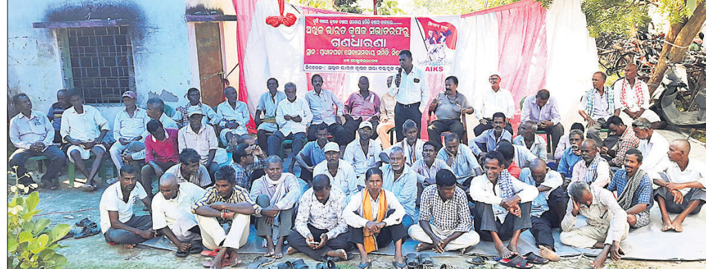
ପଧାନପଡ଼ା ସେବା ସମବାୟ ସମିତି ଆଗରେ କୃଷକମାନେ ଧାରଣା ଦେଇଛନ୍ତି।