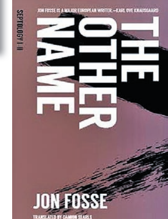
କନ୍ ଫୋସେଙ୍କ 'The Other Name' ପୁସ୍ତକର ଛବି

ଏହାର ଆଧାର ଜୀବନ ଓ ମୃତ୍ୟୁ। ତାଙ୍କର ପ୍ରଭାବଶାଳୀ ନାଟକଗୁଡ଼ିକ ମଧ୍ୟରେ 'ସମ୍ପୂର୍ଣ୍ଣ ଭାବ ଗୋଲ୍ଡେନ୍ ଟୁ କର୍ମ' ଓ 'ବ ନେମ୍' ଅତି ପ୍ରଖ୍ୟାତ। ଫୋସେଙ୍କ ଆଧୁନିକତାବାଦୀ ଚିନ୍ତା ଓ ବ୍ୟତିକ୍ରମୀ ଗଦ୍ୟଶୈଳୀକୁ ଲକ୍ଷ୍ୟ କରି କେହି କେହି ତାଙ୍କୁ ହେନରିକ୍ ଇଭସନ୍ଙ୍କ ସହ ତୁଳନା କରିଥାନ୍ତି, ଯାହା ଅସତ୍ୟ। କିନ୍ତୁ ଫୋସେଙ୍କ ଲେଖାରେ ଥାଏ ଏକ ଧାରଣା (idea)। ଗଦ୍ୟ ଗଦ୍ୟ ଉତ୍ପାଦନରେ ଭରା ରୁହେଁ ଏସବୁ। ସମସାମୟିକତାର ସ୍ୱର ଥାଏ ଗଦ୍ୟ ଗଦ୍ୟ କିମ୍ବା ଅଣବେଶା। ସମୟ ସମୟରେ ଯଦି ତାଙ୍କ ଲେଖାରେ ଥାଏ ମୃତ୍ୟୁ ଭାବନା ଓ ଛିତିକାଦା