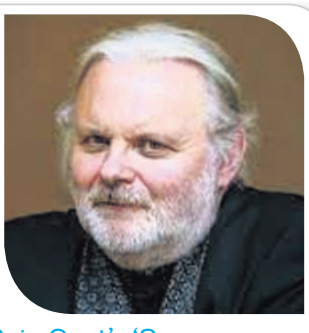
କନ୍ ଫୋସେଙ୍କ ଫୋଟୋ