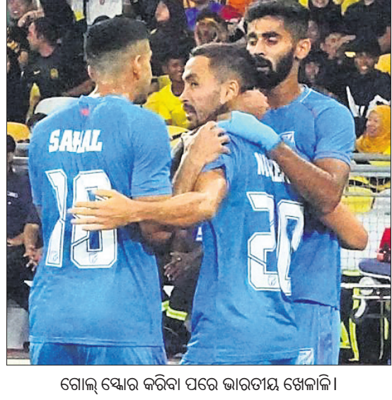
ଗୋଲ୍ ଷ୍ଟୋର କରିବା ପରେ ଭାରତୀୟ ଖେଳାଳି।