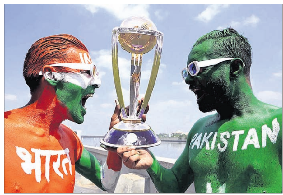
ଅହମାଦନୁରେ ଅଧିକ ଟିକେଟ ବିକ୍ରି ପାଇଁ ରଖାଯାଇ ନ ଥିବା ନେଇ ଫ୍ୟାନ୍‌ମାନେ ଅଭିଯୋଗ କରିଥିଲେ। ଏହାପରେ ଆଇସିସି ଓ ବିସିସିଆଇ ପକ୍ଷରୁ ଅହମାଦନୁରେ ଆଉ ୧୪ ହଜାର ଟିକେଟ ଉପଲବ୍ଧ କରାଯାଇଥିଲା। ତେବେ ମାତ୍ର ୩୦ ମିନିଟ ମଧ୍ୟରେ ଏହି ଟିକେଟ ସବୁ ବିକ୍ରି ହୋଇ

ଅହମଦାବାଦ, ୧୩୧୦ (ପି.ଟି.) ଦିନିକିଆ କ୍ରିକେଟ ବିଶ୍ୱକପ-୨୦୨୩ରେ ଭାରତ-ପାକିସ୍ତାନ ମ୍ୟାଚ ପାଇଁ ସମସ୍ତ ଟିକେଟ ବିକ୍ରି ହୋଇଛି। ଏହି ଗୁରୁତ୍ୱପୂର୍ଣ୍ଣ ମ୍ୟାଚରୁ ଆଉ କିଛି ଯାକି ବାକି ରହିଥିବା ବେଳେ ଟିକେଟ ପାଇଁ ଫ୍ୟାନ୍‌ଙ୍କ ମଧ୍ୟରେ ପ୍ରବଳ ଉତ୍ସାହ ଦେଖାଯାଇ ମିଳିଛି। ଏହି ମ୍ୟାଚର ଗୁରୁତ୍ୱ କାରଣରୁ ହିଁ ଏହାକୁ ବିଶ୍ୱର ସର୍ବବୃହତ କ୍ରିକେଟ ଷ୍ଟାଡ଼ିୟମରେ ରଖାଯାଇଥିଲା। ୧ ଲକ୍ଷ ୩୨ ହଜାର ଦର୍ଶକ କ୍ଷମତା ବିଶିଷ୍ଟ ଏହି ଷ୍ଟାଡ଼ିୟମଟି ବର୍ତ୍ତମାନ ପୂର୍ଣ୍ଣ ହୋଇ ଯାଇଛି। ଆଗରୁ ଟିକେଟକୁ ନେଇ ବିବାଦ ଦେଖାଦେଇଥିଲା।