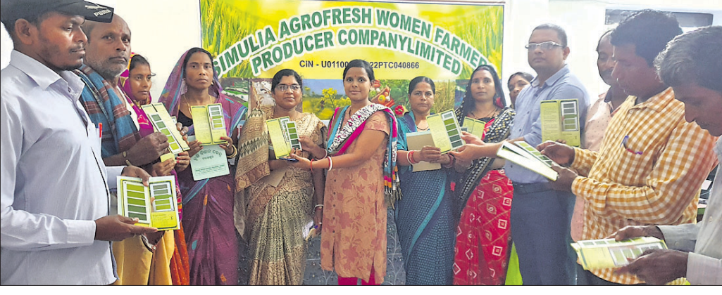
୬୦ ବୈଜ୍ଞାନିକ ଚାଷୀମାନଙ୍କୁ ଏକସିଦ୍ଧି କିଟ୍ ପ୍ରଦାନ କରୁଛନ୍ତି।