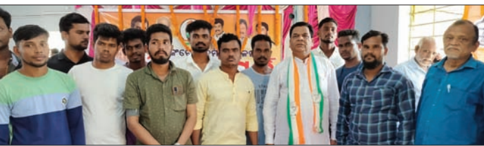
କଂଗ୍ରେସର ମିଶ୍ରଣ ପର୍ବରେ ସାମିଲ ହୋଇଥିବା କର୍ମୀ।

କବି ବୋଲି ପାଣିଗ୍ରାହୀ କହିଛନ୍ତି। ବିଜେଡ଼ି, ଭାଜପା ଦଳ କର୍ମୀମାନେ ଦଳ ଛାଡି କଂଗ୍ରେସ ଦଳରେ ସାମିଲ ହୋଇଥିଲେ।