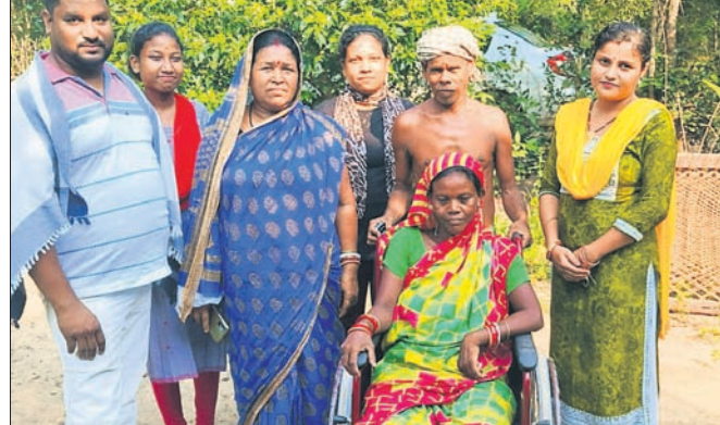
ଦିବ୍ୟାଙ୍ଗ ମହିଳାଙ୍କୁ ହୁଲ୍ଲ ଚେୟାର ପ୍ରଦାନ କରାଯାଇଛି।

ବାରିପଦା, ୧୩।୧୦ (ନୀଳାଦ୍ରି ବିହାରୀ ଦଣ୍ଡପାଟ)