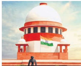
ମତବାଦର ପ୍ରଚାରପ୍ରସାର କରିପାରନ୍ତି ଭାରତୀୟ ସମ୍ପ୍ରଦାୟର ଅନୁଗ୍ରହ

ପ୍ରତିଶ୍ଵରଣ ଦାଖଲ ହୋଇଥିଲା। କିମ୍ପା ସଞ୍ଜୟ କିଷାନ କୌଲ ଏବଂ ସୁଧାଂଶୁ ଧୂଲିଆଙ୍କୁ ନେଇ ଗଠିତ ଖଣ୍ଡପୀଠ ଶୁକ୍ରବାର ଉକ୍ତ ଆବେଦନକୁ ଖାରଜ କରିଦେଇଛନ୍ତି। ଖଣ୍ଡପୀଠ କହିଛନ୍ତି, ଡାର୍ଢିନ୍ଙ୍କ ବିବର୍ତ୍ତନ ସିଦ୍ଧାନ୍ତ ଏବଂ ଆଇନ୍ଷ୍ଟାଇନ୍ଙ୍କ ସମୀକରଣକୁ ଆବେଦନକାରୀ ଭୁଲ୍ ପ୍ରମାଣିତ କରିବାକୁ ଚାହୁଁଛନ୍ତି। ଏଥିପାଇଁ ସେ ଏକ ମଞ୍ଚ ଲୋଡ଼ୁଛନ୍ତି। ଯଦି ତାଙ୍କର କିଛି ସ୍ୱତନ୍ତ୍ର ଧାରଣା ଅଛି, ତେବେ ସେ ନିଜ