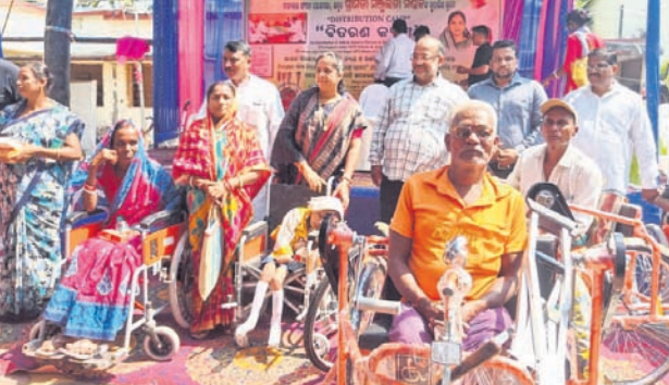
ଅତିଥି ଗଣଶରେ ଗ୍ରାଜସାଇକେଲଧାରୀ ଦିବ୍ୟାଙ୍ଗ।