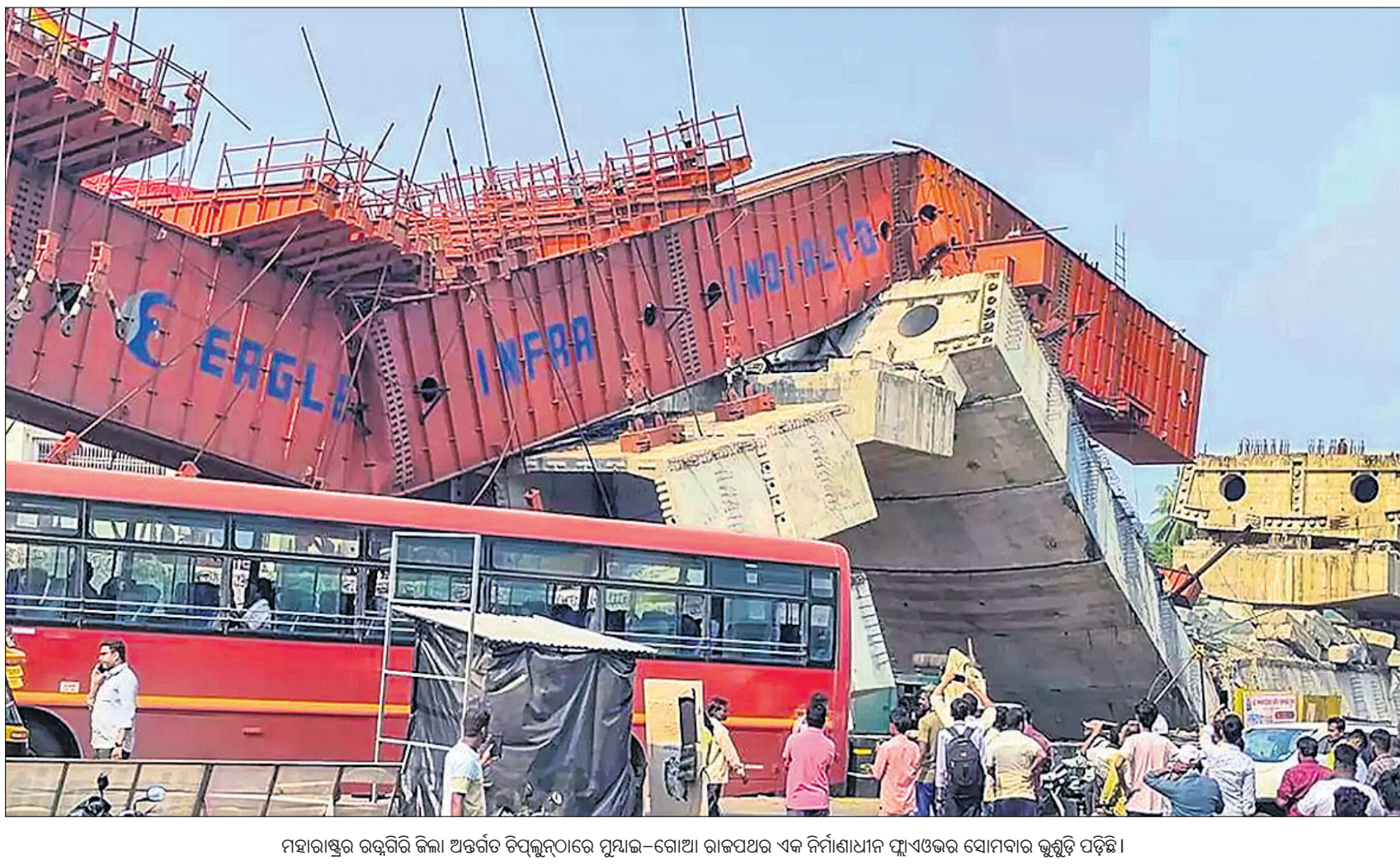
ମହାରାଷ୍ଟ୍ରର ରଢ଼ଗିରି ଜିଲ୍ଲା ଅନ୍ତର୍ଗତ ବିପ୍ଲବନାଗରେ ମୁମ୍ବାଇ-ଗୋଆ ରାଜପଥର ଏକ ନିର୍ମାଣାଧୀନ ପ୍ଲାଏଓଭର ସୋମବାର ଭୁସ୍ତ୍ର ପଡ଼ିଛି।

ମୁମ୍ବାଇ, ୧୬.୧୦: ମହାରାଷ୍ଟ୍ରର ବିଜ୍ ଜିଲ୍ଲା ଅନ୍ତର୍ଗତ ଆଷ୍ଟି ସହରରୁ ଅହମଦନଗର ଯାଉଥିବା ଟ୍ରେନ୍ରେ ୫ଟି ବଗିଚାରେ ସୋମବାର ଅପରାହ୍ନରେ ନିଆଁ ଲାଗିଯାଇଥିଲା। ଫଳରେ ଯାତ୍ରୀମାନଙ୍କୁ ଚୁରକ ଟ୍ରେନ୍ରୁ ଓହ୍ଲାଇ ଦିଆଯାଇଛି। ନାରାୟଣତୋହ ଏବଂ ଅହମଦନଗର ଷ୍ଟେଶନ ମଧ୍ୟବର୍ତ୍ତୀ ସ୍ଥାନରେ ଏହି ଅଗ୍ନିକାଣ୍ଡ ଘଟିଛି। ଗାର୍ଡ ପାଖ ଦେଇ ଜ୍ୟାନୁ ଏବଂ ଏହା ନିକଟରେ ଥିବା ୪ଟି ବଗିଚାରେ ନିଆଁ ଲାଗିଯାଇଥିଲା। ୪ଟି ଦମକଳ ନିଆଁକୁ ଆୟତ୍ତ କରିଥିଲେ। ଏଥିରେ କେହି ମୃତ୍ୟୁ ହୋଇନାହାନ୍ତି। ଘଟଣାସ୍ଥଳକୁ ଚିଲିଫ୍ ଟ୍ରେନ୍ ପଠାଯାଇଛି।