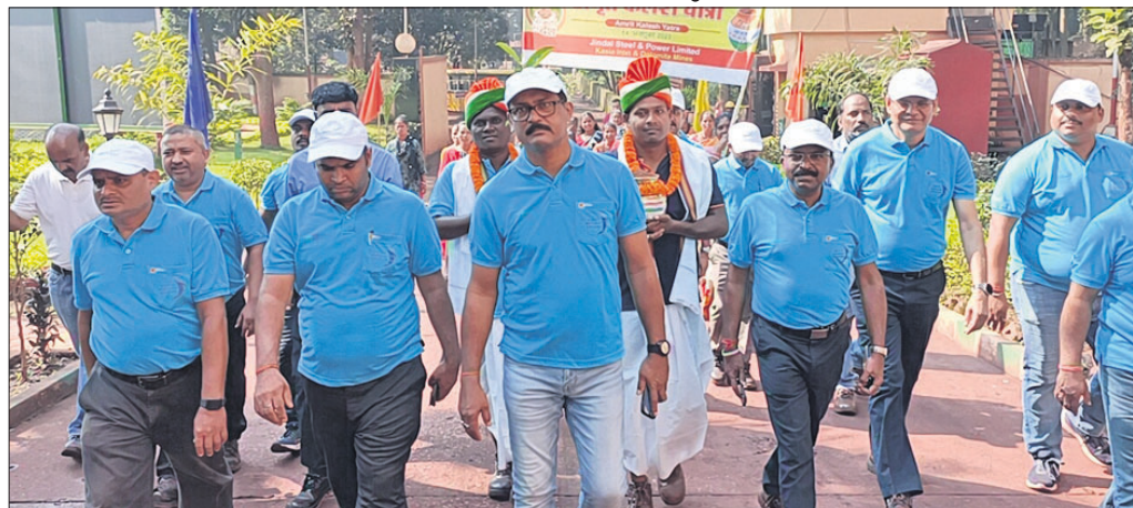
ଜ୍ୟେଷ୍ଠ କାସିଆ ମାଉସୁର ଅଧିକାରୀମାନେ ଓ ସ୍ଥାନୀୟ ଲୋକେ।