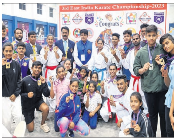
ପଦକ ସହ କୃତୀ କରାଚେକାମାମେ।