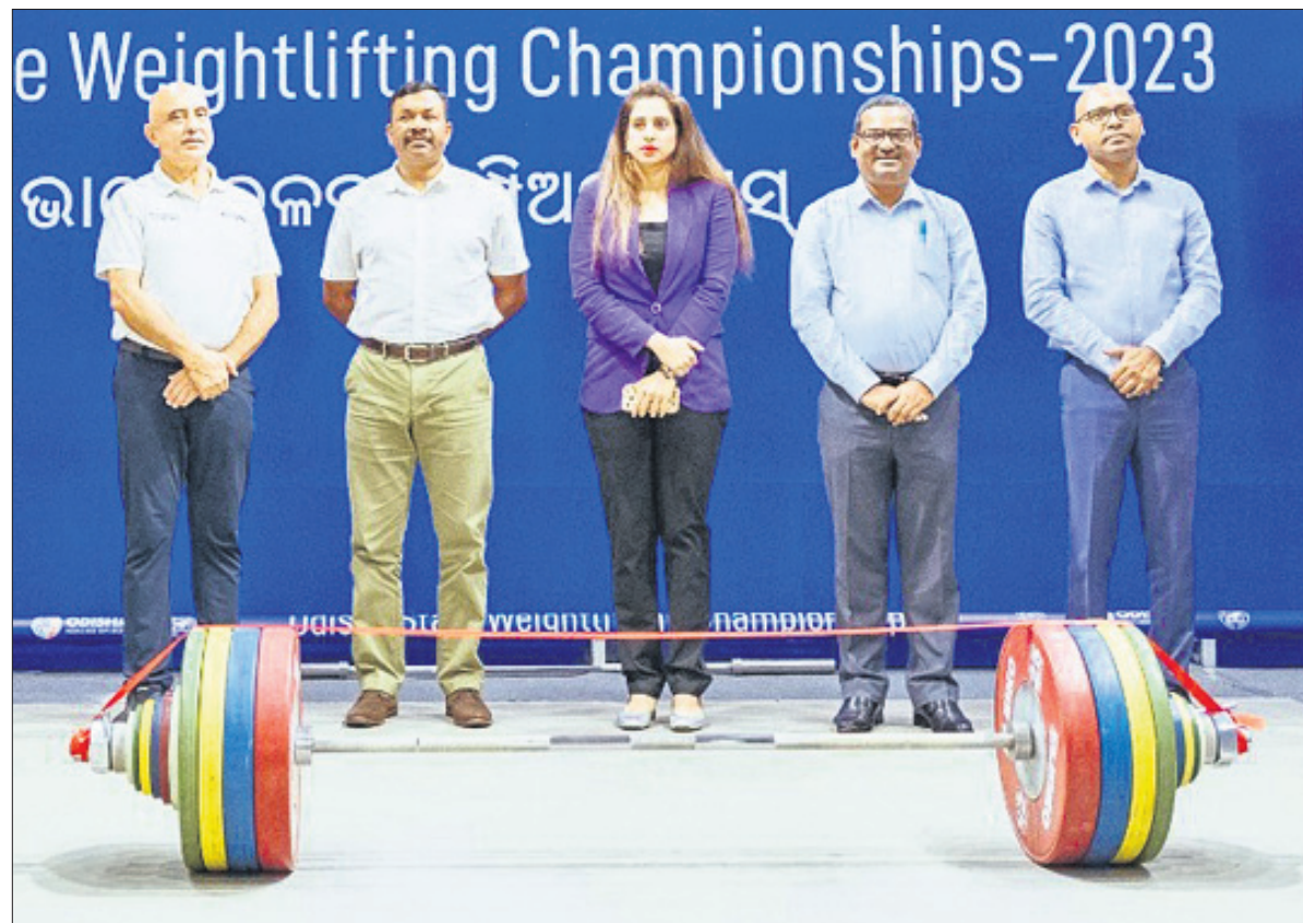
ଉଦ୍‌ଘାଟନା କାର୍ଯ୍ୟକ୍ରମରେ ଅତିଥିବୃନ୍ଦ।