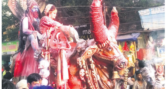
ଅଯୋରି ନୃତ୍ୟ ପରିବେଷଣ କରାଯାଇଛି।