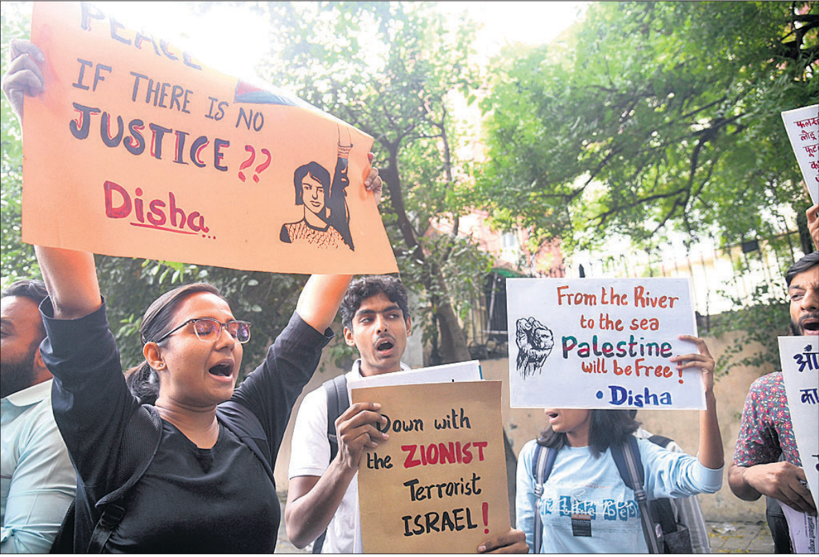
ପାଲେଷ୍ଟାଇନ୍ ସମର୍ଥନରେ ନାଗରିକ ସଚେତନତା କର୍ମୀମାନେ ନୂଆଦିଲ୍ଲୀର ଯତ୍ନ ମନ୍ତ୍ରଣାଳୟରେ ଯୋଗ୍ୟତା ବିରୋଧ ପ୍ରଦର୍ଶନ କରୁଛନ୍ତି।

ବେଶ୍ କୁର୍ଟ ପ୍ରସ୍ତୁତ ନାୟକ ଏହାବେଳେ ତୁରନ୍ତ ଛତ୍ରପୁର ପୋଲିସ୍‌କୁ ଖବର ଦେଇଥିଲେ। ଥାନା ସହକର୍ମୀଙ୍କୁ ନିର୍ଦ୍ଦୋଷିତ ମାଜିଷ୍ଟ୍ରେଟ୍ ଓ ଅନ୍ୟ ପୋଲିସ୍ କର୍ମଚାରୀ ପହଞ୍ଚି ସୁବାସଙ୍କୁ କାନ୍ଦୁ କରି ନେଇଥିଲେ। ଏନେଇ ୬୯୫/୨୩୩ରେ ଏକ ମାମଲା ରୁଜୁ ହୋଇଛି। ସୁବାସଙ୍କ କୋର୍ଟରେ କୌଣସି ମାମଲାର ଶୁଣାଣି ନ ଥିଲା କି କୋର୍ଟ ସମନ ବି ନ ଥିଲା। ହେଲେ ସେ କାହିଁକି ଆସି ପଥରମାଡ଼ କଲେ ତାହା ସ୍ପଷ୍ଟ ହୋଇପାରିନି। ଅପରପକ୍ଷରେ ସୁବାସ କାହିଁକି ଏପରି କଲେ ସେନେଇ କିଛି ବିଶେଷ କହି ନ ଥିଲେ ବୁଝା ତାଙ୍କ