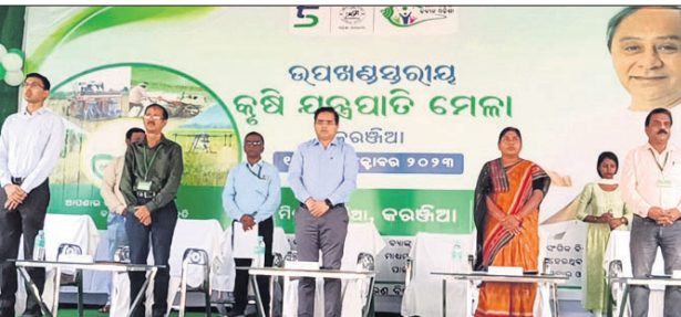
ମଞ୍ଚରେ ଉପସ୍ଥିତ ମନ୍ତ୍ରୀ ବାସନ୍ତୀ ହେମ୍ବର ଓ ଅନ୍ୟମାନେ।