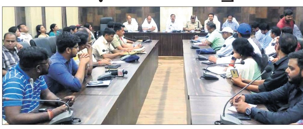
ପଲ୍ଲିଶ୍ରୀ ମେଳା ପ୍ରସ୍ତୁତି ବୈଠକରେ ଉପସ୍ଥିତ ଅଧିକାରୀ ଓ ଅନ୍ୟମାନେ।