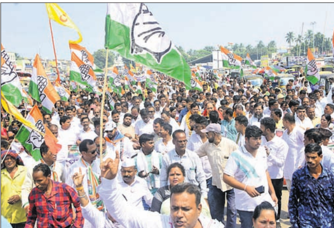
ପୂରଣ ନ କରାଯିବ କ'ଣ୍ଡେସ କର୍ମୀଙ୍କ ଦାବି। ଶୋଭାଯାତ୍ରାରେ ସାମିଲ କ'ଣ୍ଡେସ କର୍ମୀ ଓ ନେତୃବୃନ୍ଦ।