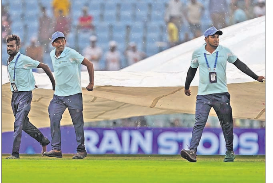
ବର୍ଷା ଆସିବାରୁ ଗ୍ରୀଭସ୍ତମ୍ୟାନମାନେ ପଡ଼ିଆକୁ କଭର କରୁଛନ୍ତି