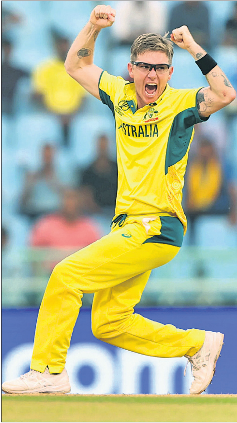
ପ୍ଲେୟର ଅଫ୍ ଦି ମ୍ୟାଚ ଆଡାମ ଲାମ୍ପାର୍ଡ