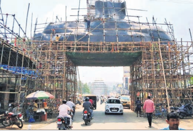
ଗଣେଶ ବଜାରରେ ନିର୍ମାଣ ହେଉଥିବା ତୋରଣ।

୨୫ ବର୍ଷ ପୂର୍ତ୍ତ ଉପଲକ୍ଷେ ହୀରକ ଜୟନ୍ତୀ ଉତ୍ସବ ଧ୍ୟାନପୂର୍ବକ ପାଳନ କରାଯିବ। ପୂଜା କମିଟି ପକ୍ଷରୁ ୧୯୯୯ ୧୦୦ ବର୍ଷର ଧନୀ-ପୁଣ୍ୟ ଗ୍ରାମୀଣ ସୁନା ମୁକୁଟ ମା'ଙ୍କ ପାଇଁ ନିର୍ମାଣ କରିଛି। ଏଥିପାଇଁ ପ୍ରାୟ ଦେଢ଼ କୋଟି