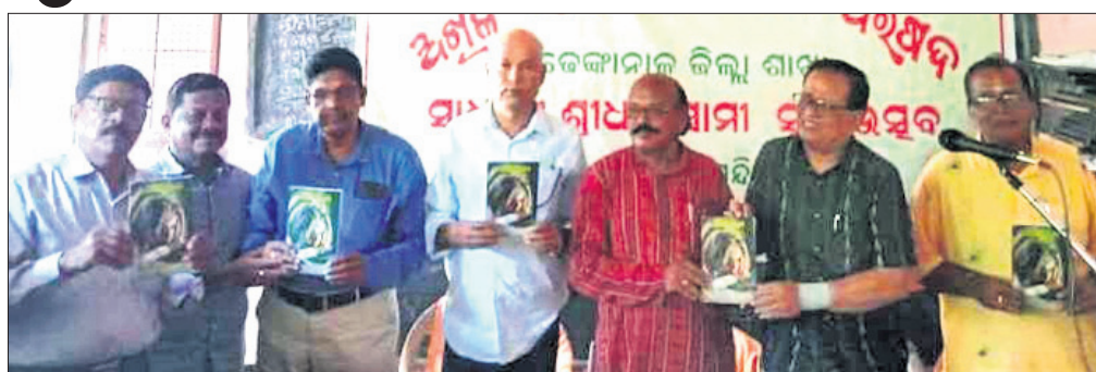
ଅଧିକ ଭାରତୀୟ ସାହିତ୍ୟ ପରିଷଦର ବାର୍ଷିକ ଉତ୍ସବ ଅବସରରେ ମଞ୍ଚାସୀନ ଅଭିଯୋଗୀମାନେ।