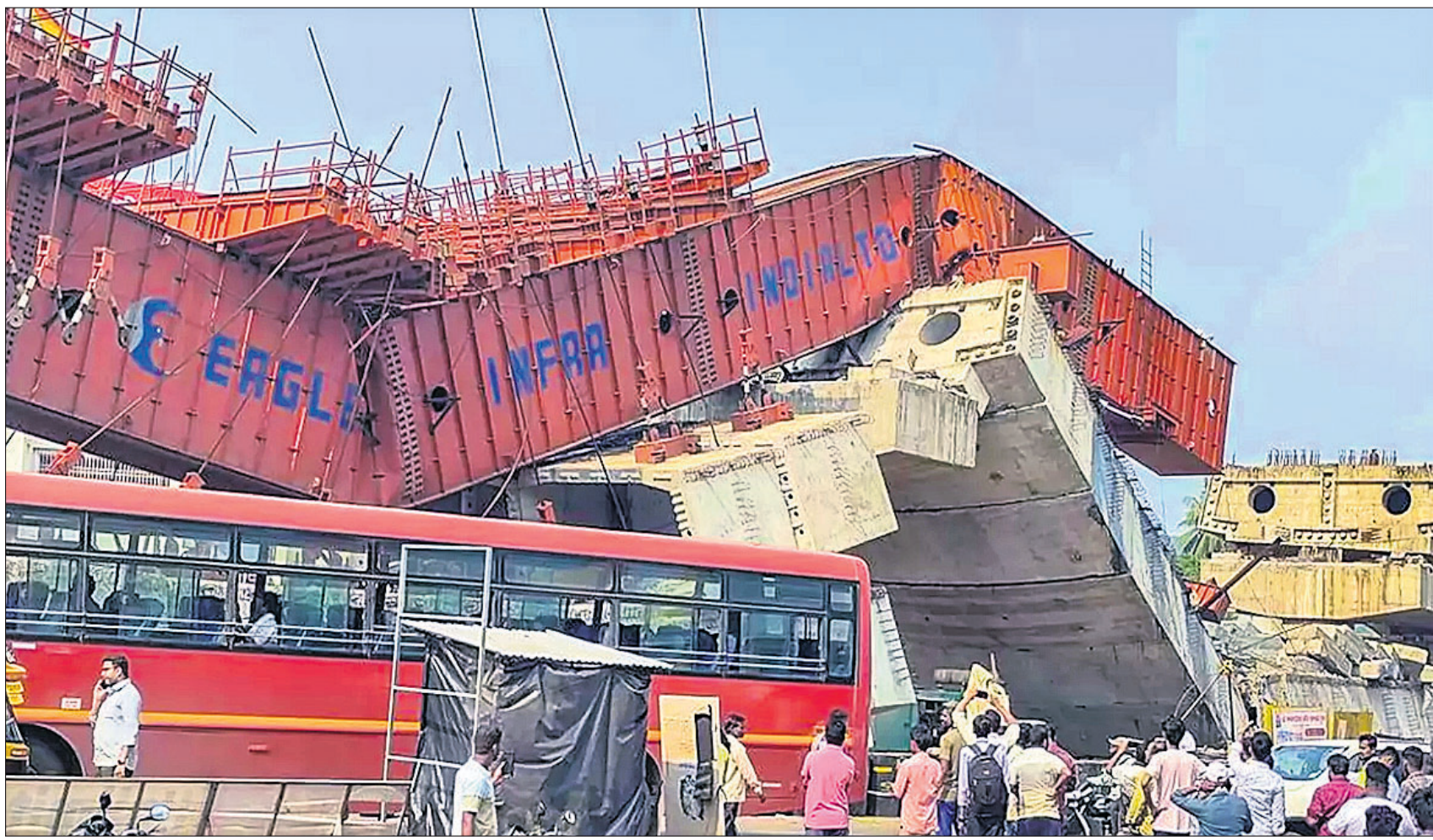
ମହାରାଷ୍ଟ୍ରର ରଢ଼ଗିରି ଜିଲ୍ଲା ଅନ୍ତର୍ଗତ ବିପ୍ଲବ୍‌ନାଗରେ ମୁମ୍ବାଇ-ଗୋଆ ରାଜପଥର ଏକ ନିର୍ମାଣାଧୀନ ପ୍ଲାଏଓଭର ସୋମବାର ଭୁସ୍ତ୍ରି ପଡ଼ିଛି।

ମୁମ୍ବାଇ, ୧୬.୧୦: ମହାରାଷ୍ଟ୍ରର ବିଜ୍ ଜିଲ୍ଲା ଅନ୍ତର୍ଗତ ଆଷ୍ଟି ସହରରୁ ଅହମଦନଗର ଯାଉଥିବା ଟ୍ରେନ୍ରେ ୫ଟି ବଗିଚାରେ ସୋମବାର ଅପରାହ୍ନରେ ନିଆଁ ଲାଗିଯାଇଥିଲା। ଫଳରେ ଯାତ୍ରୀମାନଙ୍କୁ ଚୁରକ ଟ୍ରେନ୍ରୁ ଓହ୍ଲାଇ ଦିଆଯାଇଛି। ନାରାୟଣତୋହ ଏବଂ ଅହମଦନଗର ଷ୍ଟେଶନ ମଧ୍ୟବର୍ତ୍ତୀ ସ୍ଥାନରେ ଏହି ଅଗ୍ନିକାଣ୍ଡ ଘଟିଛି। ଗାର୍ଡ ପାଖ ଦେଇ ଜ୍ୟାନୁ ଏବଂ ଏହା ନିକଟରେ ଥିବା ୪ଟି ବଗିଚାରେ ନିଆଁ ଲାଗିଯାଇଥିଲା। ୪ଟି ଦମକଳ ନିଆଁକୁ ଆୟତ୍ତ କରିଥିଲେ। ଏଥିରେ କେହି ମୃତ୍ୟୁ ହୋଇନାହାନ୍ତି। ଘଟଣାସ୍ଥଳକୁ ଚଳିତ ଟ୍ରେନ୍ ପଠାଯାଇଛି।