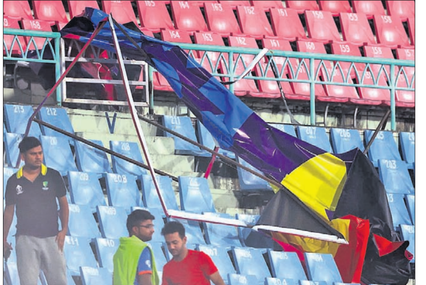
ପବନ ଯୋଗୁ ଖସିପଡ଼ିଥିବା ହୋର୍ଡିଂ

ଲଣ୍ଡନ, ୧୬ ଅକ୍ଟୋବର (ପି.ଟି.) ଯୋଗ୍ୟତା ଅଷ୍ଟ୍ରେଲିଆ ବନାମ ଶ୍ରୀଲଙ୍କା ବିଶ୍ୱକପ ମ୍ୟାଚ୍ ବେଳେ ଜୋରରେ ପବନ ବହିବାରୁ ଏକାକୀ ଷ୍ଟାଡିୟମର ଛାତ ଉପରୁ ବହୁ ହୋର୍ଡିଂ ଚଳେ ଥିବା ଆସନଗୁଡ଼ିକ ଉପରେ ଖସିପଡ଼ିଥିଲା । ବର୍ଷାଯୋଗୁ ଖେଳକୁ କିଛି ସମୟ ସ୍ଥଗିତ ରଖାଯାଇଥିଲା ।