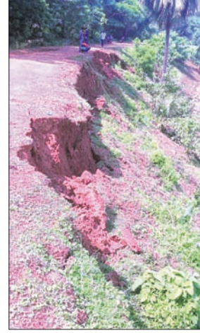
ବୈତରଣୀ ନଦୀ କୁଅଁରସାହି ବନ୍ଧରେ ମାଟି ଧସିଛି।

ଯାଜପୁର ଜିଲ୍ଲାର କୋରେଇ, ଯାଜପୁର, ଦଶରଥପୁର ଓ ବିଞ୍ଜୁରପୁର ବ୍ଲକ ଅଞ୍ଚଳବାସୀଙ୍କ ପାଇଁ ବୈତରଣୀ ନଦୀରେ ବନ୍ୟା ନିୟନ୍ତ୍ରଣ ଯୋଜନା ଚାଲିଛି। ବିପୁଳ କୋଟି ଟଙ୍କା ଖର୍ଚ୍ଚ କରାଯାଇ ନଦୀବନ୍ଧ ନିର୍ମାଣ ହେଉଛି। ଅଧିକ ବଜେଟ ଅନୁସାରେ ଆବଶ୍ୟକ ନିର୍ମାଣ ସାମଗ୍ରୀ ବ୍ୟବହାର ନ ହୋଇ ନିମ୍ନମାନର କାର୍ଯ୍ୟ ହେଉଥିବାରୁ ନିର୍ମାଣ ସମୟରେ ହିଁ ନଦୀବନ୍ଧ ଧସିଯାଇଛି। ବୈତରଣୀ ନଦୀର ତାହାଣ ପାର୍ଶ୍ୱ ବ୍ରହ୍ମଚାରୀ ପାଟଣାଠାରୁ ଅର୍ଦ୍ଧଭଳିଆ ପର୍ଯ୍ୟନ୍ତ ନିର୍ମାଣାଧୀନ ନଦୀବନ୍ଧକୁ କୁଅଁରସାହି ଗ୍ରାମ ନିକଟରେ ଉଦ୍‌ବାର ରାତିରେ ମାଟି ଧସିପଡ଼ିଛି। ନଦୀବନ୍ଧ ପ୍ରାୟ ୫ ଫୁଟ ଉଚ୍ଚତା ଓ ୧୬୦ ଫୁଟ ଲମ୍ବ ଅଂଶ ନଦୀ ଭିତରକୁ ଧସି ଯାଇଥିବା ଦେଖିବାକୁ ମିଳିଛି। ଏଥିରୁ ନଦୀବନ୍ଧ ନିର୍ମାଣରେ ସ୍ୱଳ୍ପତାକୁ ନେଇ ପ୍ରଶ୍ନବାଚୀ ସୃଷ୍ଟି ହେଉଛି। ଯାଜପୁର ଜିଲ୍ଲା ଦେଇ ପ୍ରବାହିତ ବୈତରଣୀ ଏବଂ ଏହାର ଶାଖା କାଶୀ ନଦୀର ବନ୍ୟାଜଳ