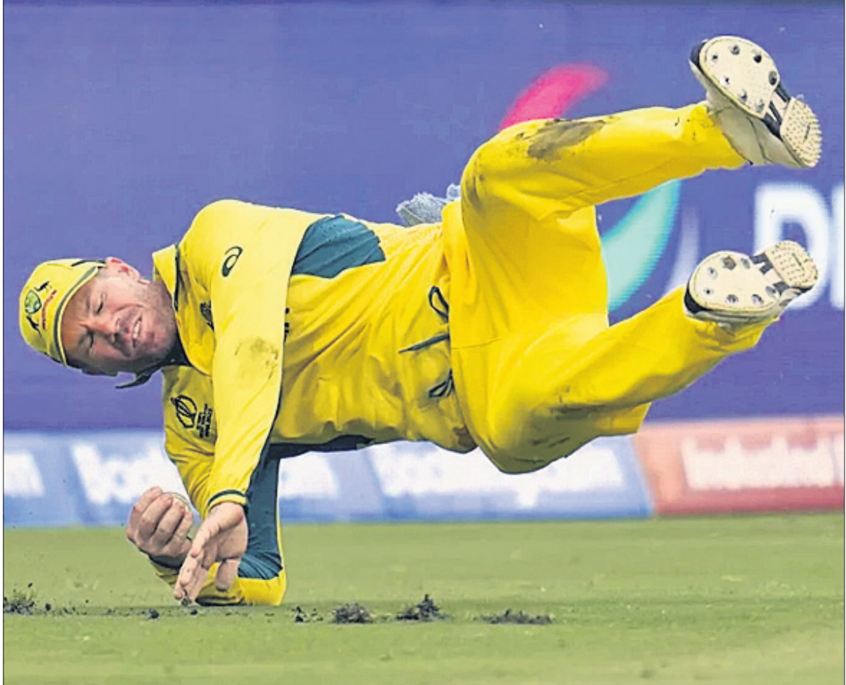
ଡାଇଭ୍ ମାରି ଚିରାକର୍ଷକ କ୍ୟାଚ ନେବା ଅବସରରେ ଅଷ୍ଟ୍ରେଲିଆର ଡେଭିଡ୍ ଫ୍ଲିନ୍ଦର୍ ।