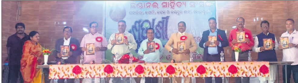
ଅତିଥିମାନେ ସଂସଦର ପତ୍ରିକା ଉନ୍ମୋଚନ କରୁଛନ୍ତି ।