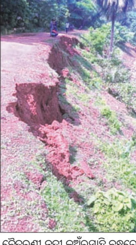
ବୈତରଣୀ ନଦୀ କୁଅଁରସାହି ବନ୍ଧରେ ମାଟି ଧସିଛି।

ଯାଜପୁର ଜିଲ୍ଲାର କୋରେଇ, ଯାଜପୁର, ଦଶରଥପୁର ଓ ବିଞ୍ଜୁରପୁର ବ୍ଲକ ଅଞ୍ଚଳବାସୀଙ୍କ ପାଇଁ ବୈତରଣୀ ନଦୀରେ ବନ୍ୟା ନିୟନ୍ତ୍ରଣ ଯୋଜନା ଚାଲିଛି। ବିପୁଳ କୋଟି ଟଙ୍କା ଖର୍ଚ୍ଚ କରାଯାଇ ନଦୀବନ୍ଧ ନିର୍ମାଣ ହେଉଛି। ଅଧିକ ବଜେତ ଅନୁସାରେ ଆବଶ୍ୟକ ନିର୍ମାଣ ସାମଗ୍ରୀ ବ୍ୟବହାର ନ ହୋଇ ନିମ୍ନମାନର କାର୍ଯ୍ୟ ହେଉଥିବାରୁ ନିର୍ମାଣ ସମୟରେ ହିଁ ନଦୀବନ୍ଧ ଧସିଯାଇଛି। ବୈତରଣୀ ନଦୀର ତାହାଣ ପାର୍ଶ୍ୱ ବ୍ରହ୍ମଚାରୀ ପାଟଣାଠାରୁ ଅର୍ଦ୍ଧଘଣ୍ଟିଆ ପର୍ଯ୍ୟନ୍ତ ନିର୍ମାଣାଧୀନ ନଦୀବନ୍ଧ କୁଅଁରସାହି ଗ୍ରାମ ନିକଟରେ ଉଦ୍‌ଘାଟନ ରାତିରେ ମାଟି ଧସିପଡ଼ିଛି। ନଦୀବନ୍ଧ ପ୍ରାୟ ୫ ଫୁଟ ଉଚ୍ଚତା ଓ ୧୬୦ ଫୁଟ ଲମ୍ବ ଅଂଶ ନଦୀ ଭିତରକୁ ଧସି ଯାଇଥିବା ଦେଖିବାକୁ ମିଳିଛି। ଏଥିରୁ ନଦୀବନ୍ଧ ନିର୍ମାଣରେ ସ୍ୱଳ୍ପତାକୁ ନେଇ ପ୍ରଶ୍ନବାଚୀ ସୃଷ୍ଟି ହେଉଛି। ଯାଜପୁର ଜିଲ୍ଲା ଦେଇ ପ୍ରବାହିତ ବୈତରଣୀ ଏବଂ ଏହାର ଶାଖା କାଶୀ ନଦୀର ବନ୍ୟାଜଳ