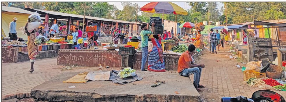
ହାତପିଣ୍ଡକୁ ସ୍ଥାନାନ୍ତର ହୋଇଥିବା ବ୍ୟବସାୟୀ ।