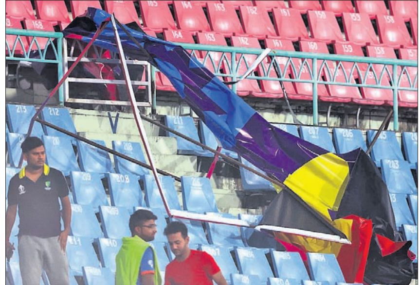
ପବନ ଯୋଗୁ ଖସିପଡ଼ିଥିବା ହୋର୍ଡ଼ିଂ ।

ଲଣ୍ଡୋ, ୧୨।୧୦(ପି.ଟି.) ଯୋଗ୍ୟତା ଅଷ୍ଟ୍ରେଲିଆ ବନାମ ଶ୍ରୀଲଙ୍କା ବିଶ୍ୱକପ ମ୍ୟାଚ୍ ବେଳେ ଜୋରରେ ପବନ ବହିବାରୁ ଏକାକୀ ଷ୍ଟାଡ଼ିୟମର ଛାତ ଉପରୁ ବହୁ ହୋର୍ଡ଼ିଂ ଚଳେ ଥିବା ଆସନଗୁଡ଼ିକ ଉପରେ ଖସିପଡ଼ିଥିଲା । ବର୍ଷାଯୋଗୁ ଖେଳକୁ କିଛି ସମୟ ସ୍ଥଗିତ ରଖାଯାଇଥିଲା ।