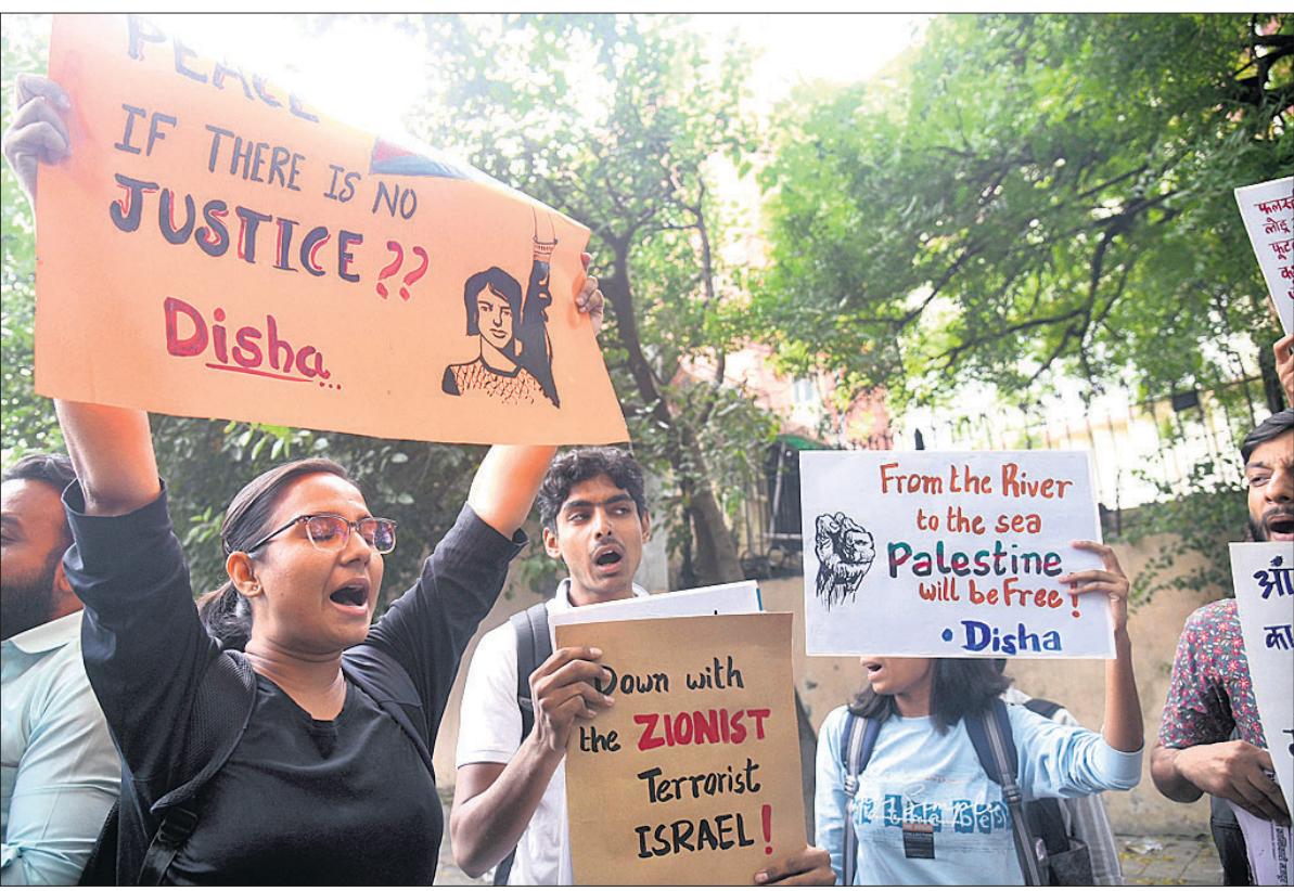
ପାଲେଷ୍ଟାଇନ୍ ସମର୍ଥନରେ ନାଗରିକ ସଚେତନତା କର୍ମୀମାନେ ନୂଆଦିଲ୍ଲୀର ଯତ୍ନ ମନ୍ତ୍ରଣାଳୟରେ ସୋମବାର ବିରୋଧ ପ୍ରଦର୍ଶନ କରୁଛନ୍ତି।