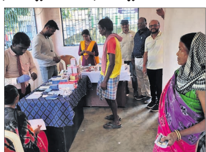
ଶିବିରରେ ଲୋକମାନେ ସ୍ୱାସ୍ଥ୍ୟପରୀକ୍ଷା କରୁଛନ୍ତି ।