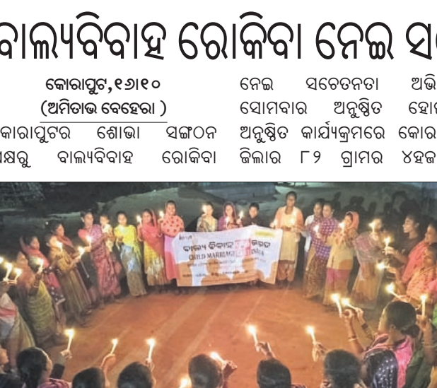
ବାଲ୍ୟବିବାହ ରୋକିବା ନେଇ ବାହାରିଥିବା କ୍ୟାଣ୍ଟେଲ ଶୋଭାଯାତ୍ରା ।