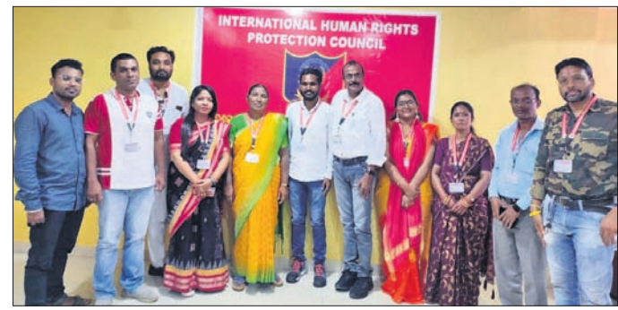
କାର୍ଯ୍ୟକ୍ରମରେ ଉପସ୍ଥିତ ଅତିଥି ଓ ଅନ୍ୟମାନେ ।

ପରେ ସେଠାରେ ପୋଲିସ୍ ନିକଟରେ ଲିଖିତ ଅଭିଯୋଗ କରିଥିଲେ । ପରେ ସ୍ୱାସ୍ଥ୍ୟକେନ୍ଦ୍ରରେ ମୃତଦେହ ବ୍ୟବଚ୍ଛେଦ ପରେ ଗ୍ରାମକୁ ଫେରୁଥିବା ଜଣାପଡ଼ିଛି । ଅଭି କାମ କରୁଥିବା ଚିକ୍ଳୁଡ଼ି କମ୍ପାନୀର ମାଲିକ ଗ୍ରାମକୁ ମୃତଦେହ ନେବାପାଇଁ ଆହ୍ଲାଦ୍ ବ୍ୟବସ୍ଥା କରି ଅଭିଙ୍କ ସମ୍ପର୍କୀୟଙ୍କୁ ୨୦ ହଜାର ଟଙ୍କା ପ୍ରଦାନ କରିଛନ୍ତି । ସୂଚନାଯୋଗ୍ୟ, ଗ୍ରାମରେ ଏମିଲିଏନଆରଇସିଏସ୍ରେ ଶ୍ରମିକ ଭାବେ କାମ କରି ଠିକ୍ ସମୟରେ ମନୁଡ଼ି ପାଇ ନ ଥିବାରୁ ଆମେ ଅଭିଙ୍କ ସହ ଧର୍ମର ଏଠାରେ କାମ କରିବାକୁ ଆସିଥିଲୁ । ଗ୍ରାମରେ କରୁଥିବା କାମ ବାବଦ ପ୍ରାୟ ଠିକ୍ ରୂପେ ପାଇଥିଲେ ଆମେ ଆନ୍ଧ୍ରକୁ ଦାଦନ ଖଟି ଆସି ନ ଥାନ୍ତୁ କି ଆମର ଜଣେ ସାଙ୍ଗକୁ ହରାଇ ନ ଥାନ୍ତୁ ବୋଲି କହିଛନ୍ତି ମନୁଡ଼ି ।