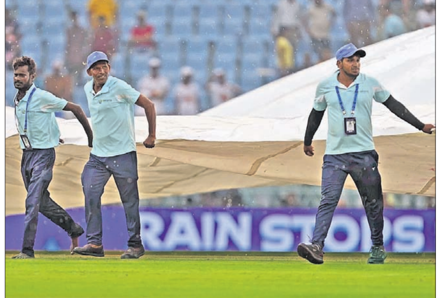
ବର୍ଷା ଆସିବାରୁ ଗ୍ରୀଭସ୍ତମ୍ୟାନମାନେ ପଡ଼ିଆକୁ କଭର କରୁଛନ୍ତି ।