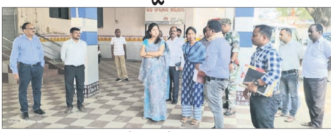
ଉନ୍ନୟନ କାର୍ଯ୍ୟ ପରିଦର୍ଶନ କରୁଛନ୍ତି ଜିଲ୍ଲାପାଳ।

କୃତ୍ୟ, ୧୭।୧୦ (ବି.ଶଙ୍କର) : କୃତ୍ୟ ବିଧି ଅନୁରୂପ ଗ୍ରାମ, ଓଏସ୍ ଲୁକ୍ ସମ୍ମିଳନୀ କକ୍ଷରେ ସୋମବାର ରୁକ୍ମପ୍ରଭାସ ଅଭିଯୋଗ ଶୁଣାଣି ଶିବିର ଆରମ୍ଭ ହୋଇଯାଇଛି।