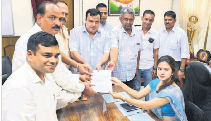
ଜିଲ୍ଲା ବିକେଡ଼ି ପକ୍ଷରୁ ଜିଲ୍ଲାପାଳଙ୍କୁ ସ୍ଥାନାନ୍ତରଣ ଦିଆଯାଉଛି।