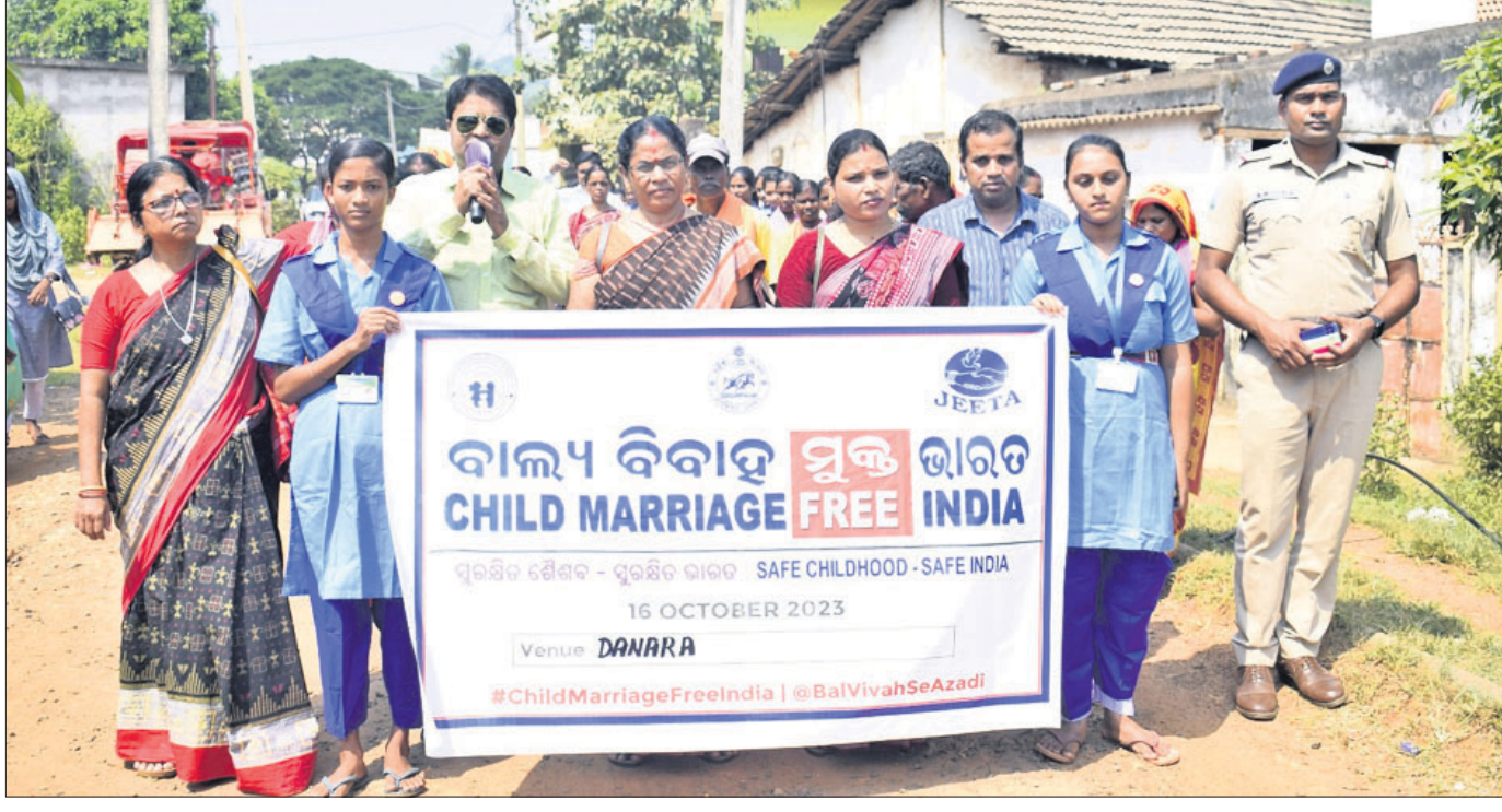
ସଚେତନତା ରାଲି ବାହାରି ସଚେତନ କରୁଛି ।