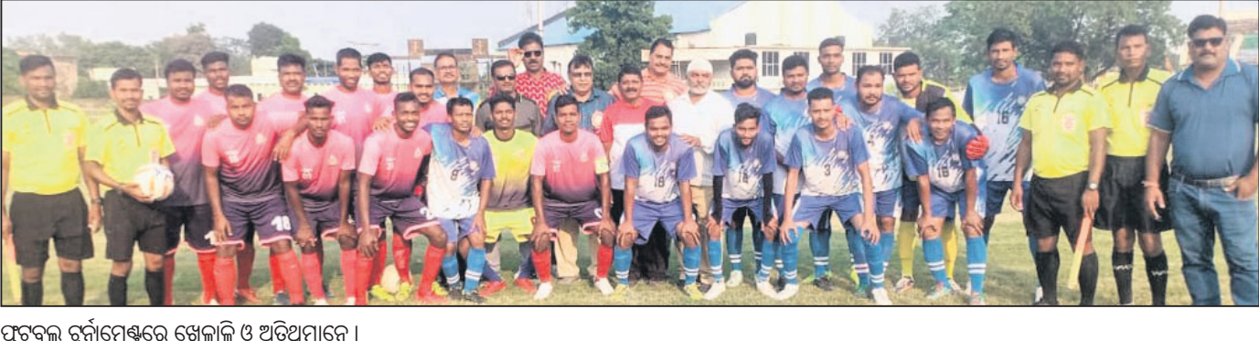
ଫୁଟ୍ ବଲ ଟୁର୍ନାମେଣ୍ଟରେ ଖେଳାଳି ଓ ଅତିଥିମାନେ ।