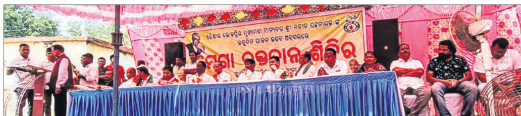
ଜମିନକିରାଠାରେ ଆୟୋଜିତ କାର୍ଯ୍ୟକ୍ରମରେ ମାଷାସାଧନ ଅତିଥିମାନେ।