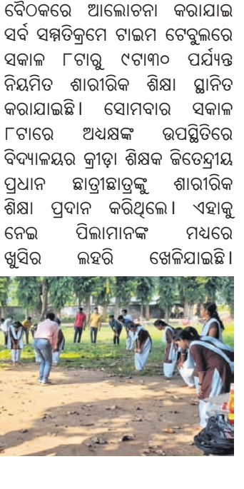
ଶାରୀରିକ ଶିକ୍ଷା ଗ୍ରହଣ କରୁଛି ଛାତ୍ରଛାତ୍ରୀ ।