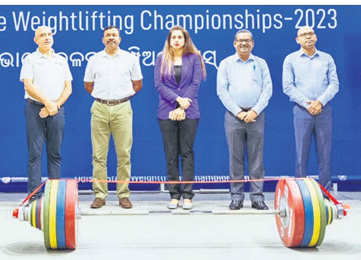
ଉତ୍ସାବନୀ କାର୍ଯ୍ୟକ୍ରମରେ ଅତିଥିବୃନ୍ଦ।