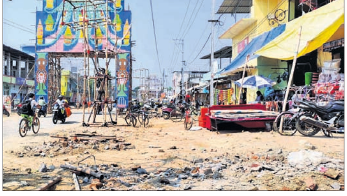
ପୂଜା କମିଟି ପକ୍ଷରୁ ବିଭିନ୍ନ ତୋରଣ ପ୍ରସ୍ତୁତ କରାଯାଇଛି।

ସମ୍ବଲପୁର, ୧୭।୧୦ (ବି.ଶଙ୍କର) : ସମ୍ବଲପୁର ମହାନଗର ନିଗମ ଅନ୍ତର୍ଗତ ଗୋବିନ୍ଦଚୋଳା ଦୁର୍ଗାପୂଜା ୫୫ବର୍ଷରେ ପଦାର୍ପଣ କରୁଛି।