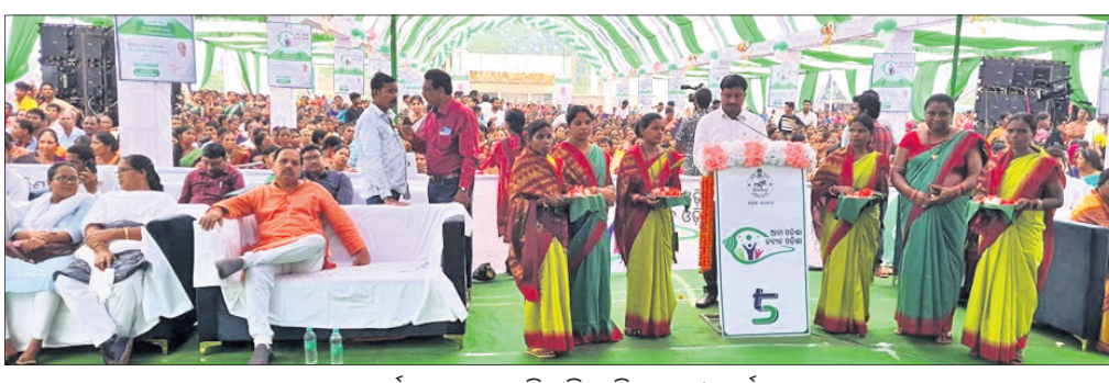
କାର୍ଯ୍ୟକ୍ରମରେ ଉପସ୍ଥିତ ବିଜେଡି ନେତା ଓ କର୍ମୀ।

ଦେବଗଡ଼, ୧୭୧୦ (ଶଶାଙ୍କ ଶେଖର ଝାଙ୍କର) କୁଡ଼େଇଗୋଳା ଆନା ଅନ୍ତର୍ଗତ ପଲ୍ଲୀପାଳିକା ପରିଷଦ ପକ୍ଷରୁ ଶୁଭକାରୀ ଯୋଜନା ଉଦ୍ଘାଟନା କରାଯାଇଛି।