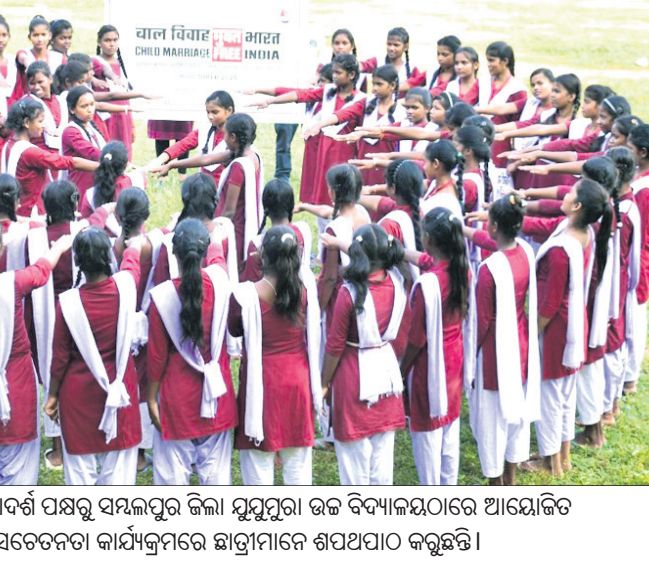
ମଙ୍ଗଳବାର ସାମାଜିକ ସଂଗଠନ ଆଦର୍ଶ ପକ୍ଷରୁ ସମ୍ପର୍କିତ ଜିଲା ସ୍ତରୀୟ ଉଚ୍ଚ ବିଦ୍ୟାଳୟରେ ଆୟୋଜିତ ବାଲ୍ୟବିବାହ ନିରୋଧ ସଚେତନତା କାର୍ଯ୍ୟକ୍ରମରେ ଛାତ୍ରମାନେ ଶପଥପାଠ କରୁଛନ୍ତି।