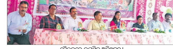
ବୈଠକରେ ଉପସ୍ଥିତ ଅତିଥିବୃନ୍ଦ।

ଦେବଗଡ଼, ୧୭୧୦ (ଶଶାଙ୍କ ଶେଖର ଝାଙ୍କର) ଦେବଗଡ଼ ଜିଲାର ସ୍ୱାମୀନାଥ ଉପତ୍ୟକାରେ ଶୁଭକାରୀ ଯୋଜନା ଉଦ୍ଘାଟନା କରାଯାଇଛି।