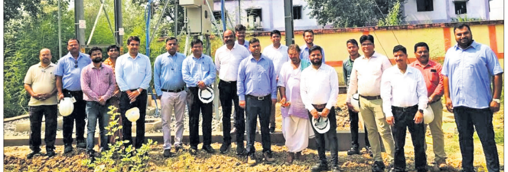
ବିଦ୍ୟୁତ୍ ସଂଯୋଗ କାର୍ଯ୍ୟକ୍ରମରେ ବିଭାଗୀୟ ଅଧିକାରୀ ଓ କର୍ମଚାରୀ।

ପୁଟିବନ୍ଧ ଗ୍ରୀଡ଼ ସହ ମାନେଶ୍ୱର ଗ୍ରୀଡ଼କୁ ସଂଯୋଗ କରିବା ପାଇଁ ଏକ ସ୍ୱତନ୍ତ୍ର ବୈଠକ ଅନୁଷ୍ଠିତ ହୋଇଛି।