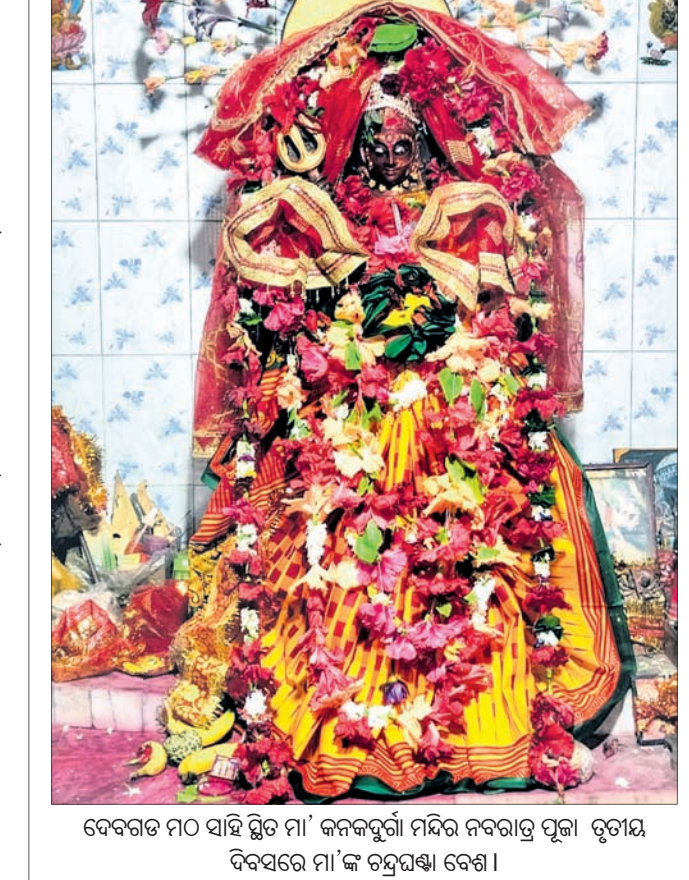
ଦେବଗଡ଼ ମଠ ସାହି ଛାଡ଼ି ମା' କଳକର୍ତ୍ତୃଣୀ ମନ୍ଦିର ନବରାତ୍ରି ପୂଜା ତୃତୀୟ ଦିବସରେ ମା'ଙ୍କ ଚନ୍ଦ୍ରସାଧା ବେଶ।

ଦେବଗଡ଼, ୧୭୧୦ (ଶଶାଙ୍କ ଶେଖର ଝାଙ୍କର) ଦେବଗଡ଼ ଜିଲାର ସ୍ୱାମୀନାଥ ଉପତ୍ୟକାରେ ଶୁଭକାରୀ ଯୋଜନା ଉଦ୍ଘାଟନା କରାଯାଇଛି।