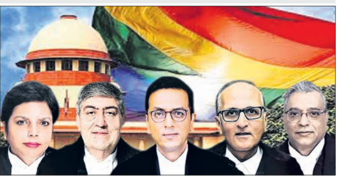
ସାମ୍ବିଧାନିକ ପୀଠର ୫ ବିଚାରପତି ହେଲେ (ବାମରୁ) ଜଷ୍ଟିସ୍ ହିମା କୋହଲି, ଜଷ୍ଟିସ୍ ସଞ୍ଜୟ କେ. କୋଲ, ପ୍ରଧାନ ବିଚାରପତି ଡି.ଓ.ଲ. ଚନ୍ଦ୍ରଚୂଡ଼, ଜଷ୍ଟିସ୍ ଏସ୍. ରବୀନ୍ଦ୍ର ଜଜ୍ ଓ ଜଷ୍ଟିସ୍ ପି.ଏସ୍. ନରସିଂହ।

ସମଲିଙ୍ଗୀ ମିଳନକୁ ବୈଧ କରିବା ସକାଶେ ଆଇନରେ ପରିବର୍ତ୍ତନ କରିପାରିବ ପାର୍ଲିାମେଣ୍ଟ: ସାମ୍ବିଧାନିକ ପୀଠ