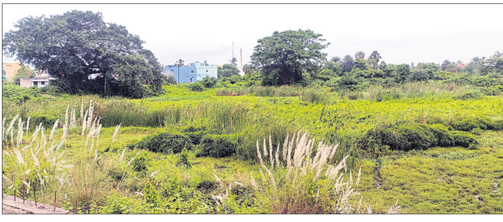
ଛତ୍ରପୁର, ୧୭।୧୦ (ଦିଲୀପ ସାମଲ): ଅଭିନବପୁର ରାଜ୍ୟ ଗ୍ରାମର ୨ ଏକର ଯେଉଁଠି ପ୍ଲାଷ୍ଟିକ ମୁକ୍ତ ଗ୍ରାମର ଘୋଷଣା କରାଯାଇଛି...