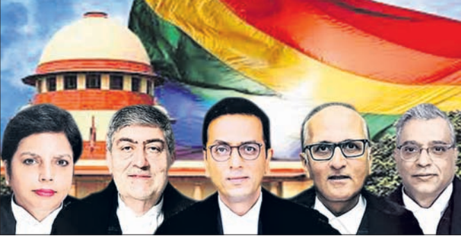
ସାମ୍ବିଧାନିକ ପୀଠର ୫ ବିଚାରପତି ହେଲେ (ବାମରୁ) ଜଷ୍ଟିସ୍ ହିମା କୋହଲି, ଜଷ୍ଟିସ୍ ସଞ୍ଜୟ କେ. କୋଲ, ପ୍ରଧାନ ବିଚାରପତି ଡି.ଓ.ଲ. ଚନ୍ଦ୍ରଚୂଡ଼, ଜଷ୍ଟିସ୍ ଏସ୍. ରବୀନ୍ଦ୍ର ଜଜ୍ ଓ ଜଷ୍ଟିସ୍ ପି.ଏସ୍. ନରସିଂହ।

ସମଲିଙ୍ଗୀ ମିଳନକୁ ବୈଧ କରିବା ସକାଶେ ଆଇନରେ ପରିବର୍ତ୍ତନ କରିପାରିବ ପାର୍ଲିାମେଣ୍ଟ: ସାମ୍ବିଧାନିକ ପୀଠ