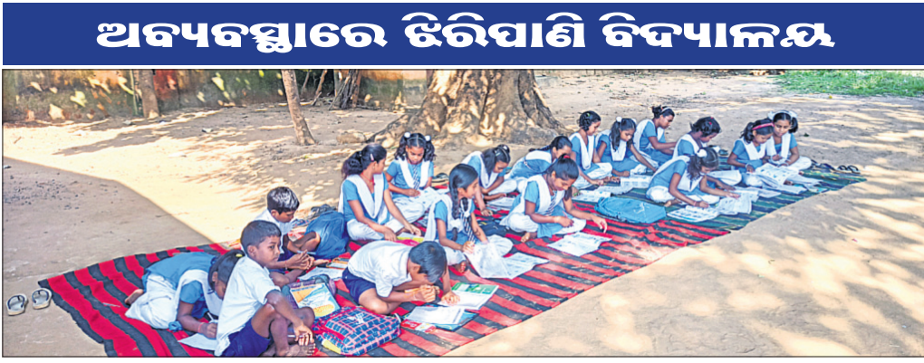
ଆୟଗଛ ତଳେ ଛାତ୍ରାଛାତ୍ରୀମାନେ ପଢ଼ୁଛନ୍ତି।