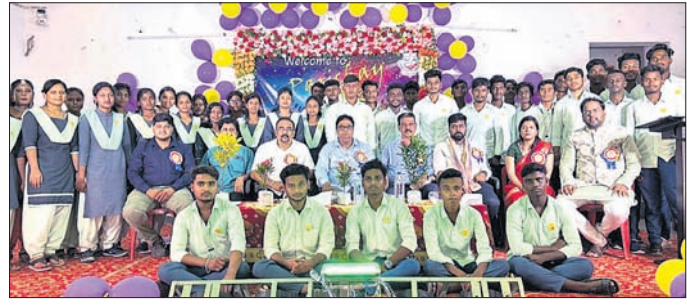
ମହାସାଧନ ଅତିଥିକ ସହ ଛାତ୍ରାଛାତ୍ରୀମାନେ